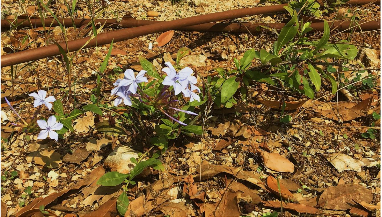
Abb. 18: Plumbago auriculata ; Erstfund für die Insel Krk, Istrien und Kroatien; Foto: Marica ROTTENSTEINER; confirm. Matthias ERBEN.