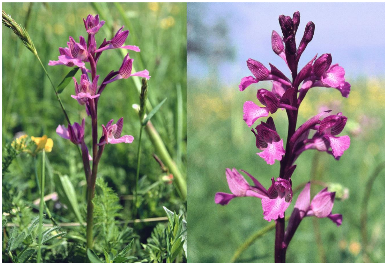
Abb. 13: Anacamptis × gennarii ( A. morio × A. papilionacea); Erstfund für die Insel Krk: W Malinska/Malisca/Durischal, Porat/Porto; 23.04.2000