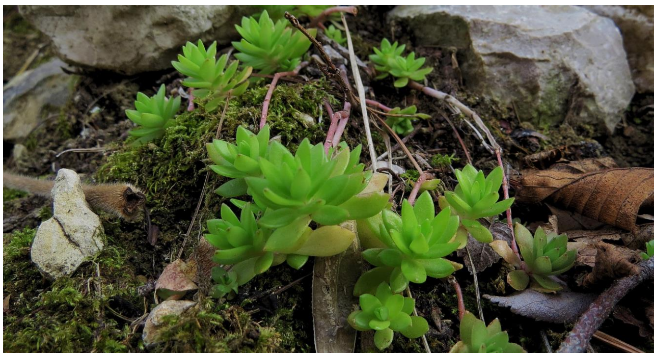
Abb. 9: Sedum sarmentosum ; Erstfund für die Insel Krk; Foto: Marica ROTTENSTEINER; det. Walter K. ROTTENSTEINER.