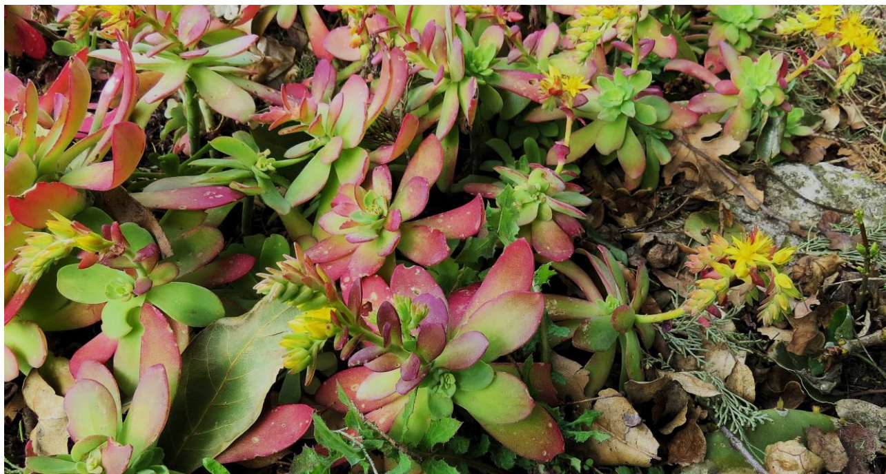
Abb. 8: Sedum palmeri ; Erstfund für die Insel Krk; det. Walter K. ROTTENSTEINER.

Lagenaria siceraria (MOLINA) STANDL.; selten kultiviert und sehr selten verwildert.