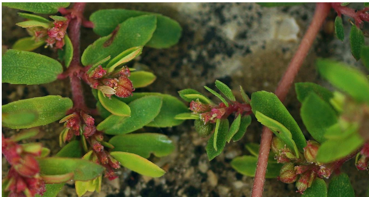
Abb. 10: Euphorbia maculata ; Erstfund für die Insel Krk; det. Božo FRAJMAN.

Euphorbia maculata L. (Abb. 10) !!Neu für die Insel Krk/Veglia/Vögl's!! ; selten. Diese Art konnte erstmals am 03.10.2017 bei Zarok/Cosmo W Baška/Bescanuova/Weschke gefunden werden.