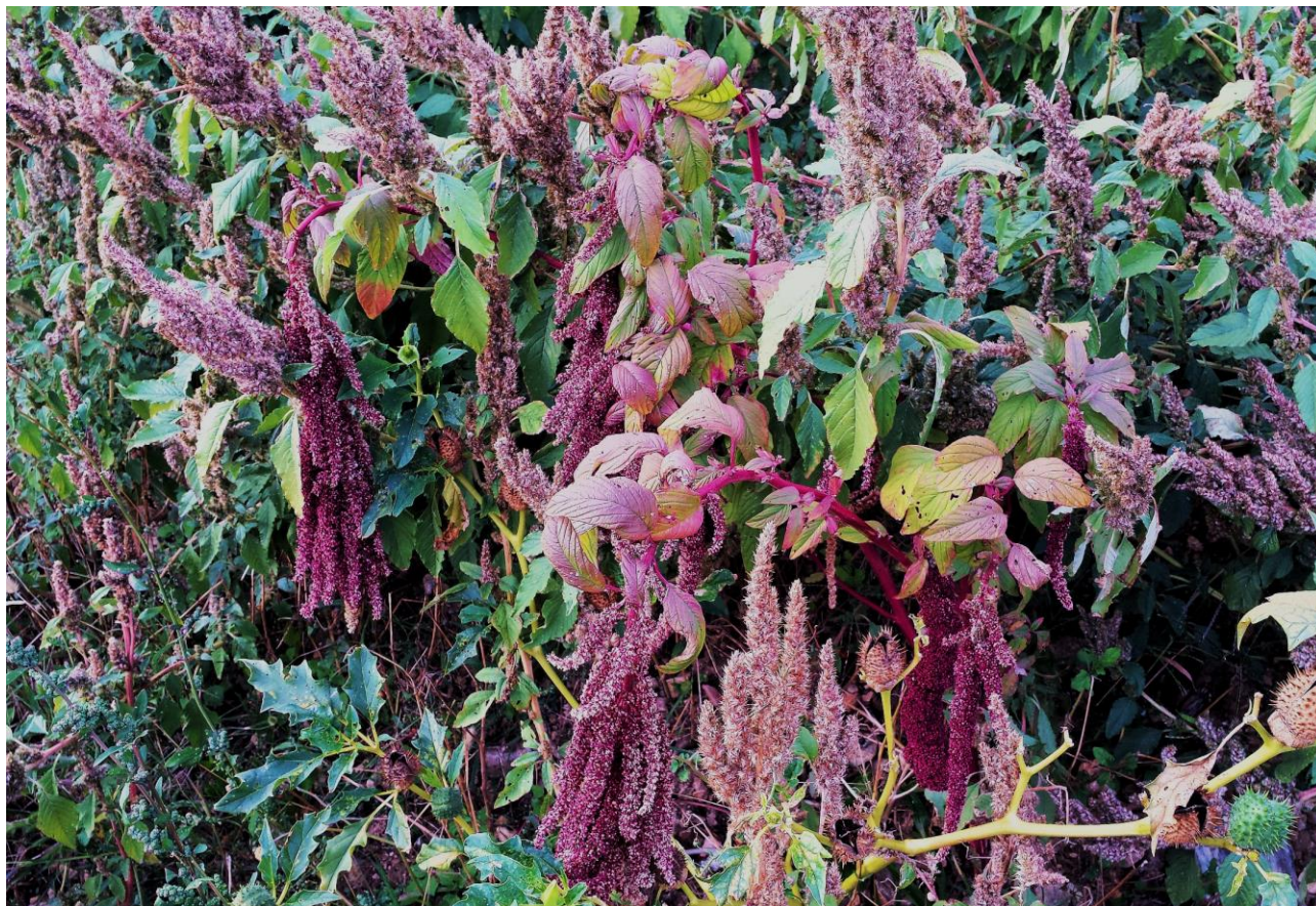
Abb. 4: Amaranthus caudatus ; Erstfund für die Insel Krk; Foto: Stefan LEFNAER, confirm. Johannes WALTER.

Amaranthus caudatus L. (Abb. 4) !!Neu für die Insel Krk/Veglia/Vöglis!! ; selten. Der Wildbestand wurde am 13.10.2019 auf einer Aufschüttung NW Jurandvor/Giurandvor/Vidklau (N 44°59' 01,95", E 14°43'40,92", 45 m alt.) entdeckt und nur fotografiert.