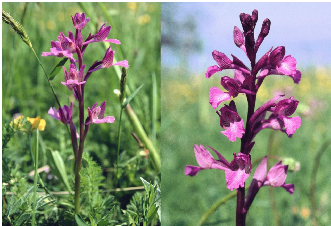
Abb. 13: Anacamptis \times gennarii ( A. morio \times A. papilionacea); Erstfund für die Insel Krk: W Malinska/Maliscal/Durischal, Porat/Porto; 23.04.2000