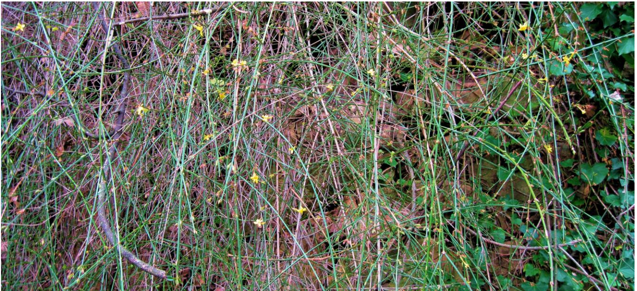
Abb. 12: Jasminum nudiflorum ; Erstfund für die Insel Krk: Omišalj/Castelmuschio/Moschau: an der Straße von der Altstadt zum Hafen, Böschung vom Wald zur Straße, 28.03.2018

Jasminum nudiflorum LINDL. (Abb. 12) !!Neu für die Insel Krk/Veglia/Vögl's!! ; zerstreut kultiviert und selten verwildert.