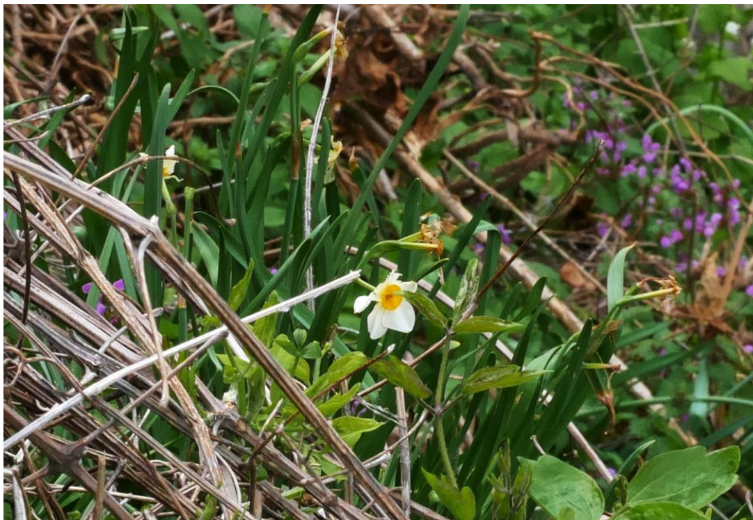
Abb. 5: Narcissus tazetta subsp. italicus ; Erstfund für die Insel Krk; confirm. Michael MÜNCH.