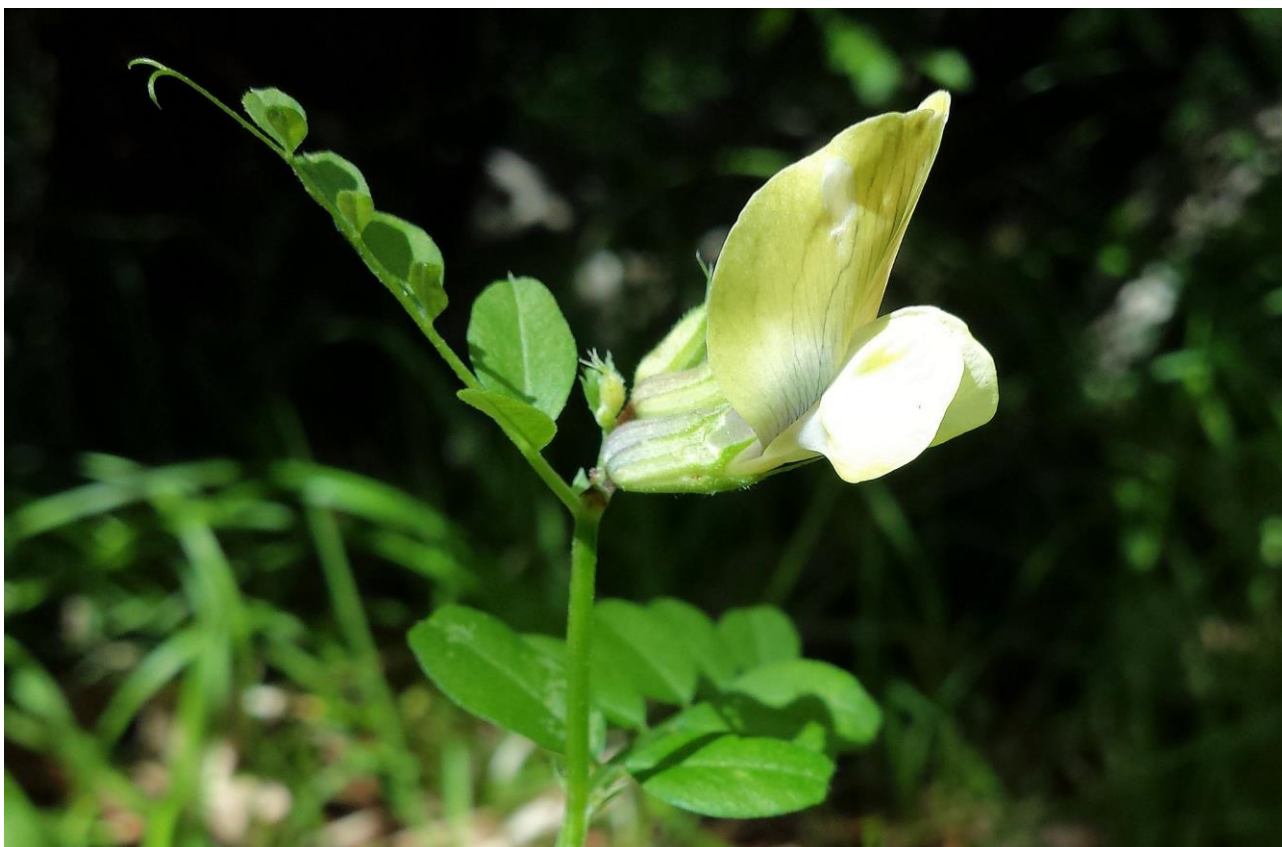
Abb. 11: Vicia grandiflora subsp. grandiflora var. grandiflora ; Erstfund für die Insel Krk; Foto: Stefan LEFNAER; det. Walter K. ROTTENSTEINER.