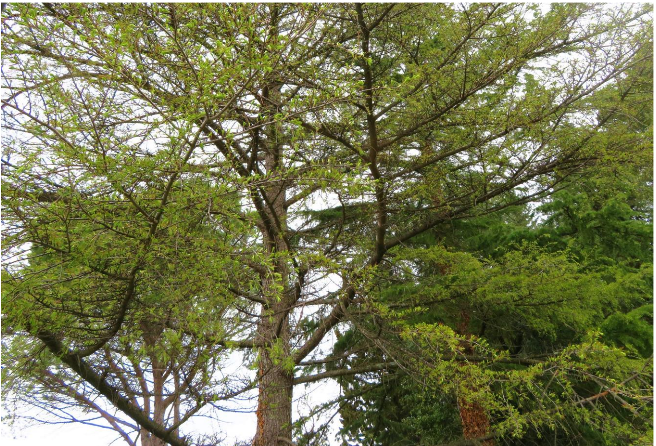
Abb. 2: Larix decidua subsp. decidua ; Erstfund für die Insel Krk (kultiviert).

Larix decidua MILL. subsp. decidua (Abb. 2); sehr selten kultiviert. Erstmals in Kultur beobachtet: SSW Malinska/Malisca/Durischal, Milčetići, N 45°07'13,14", E 14°31'22,84", 8 m alt.; 12.04. 2019.