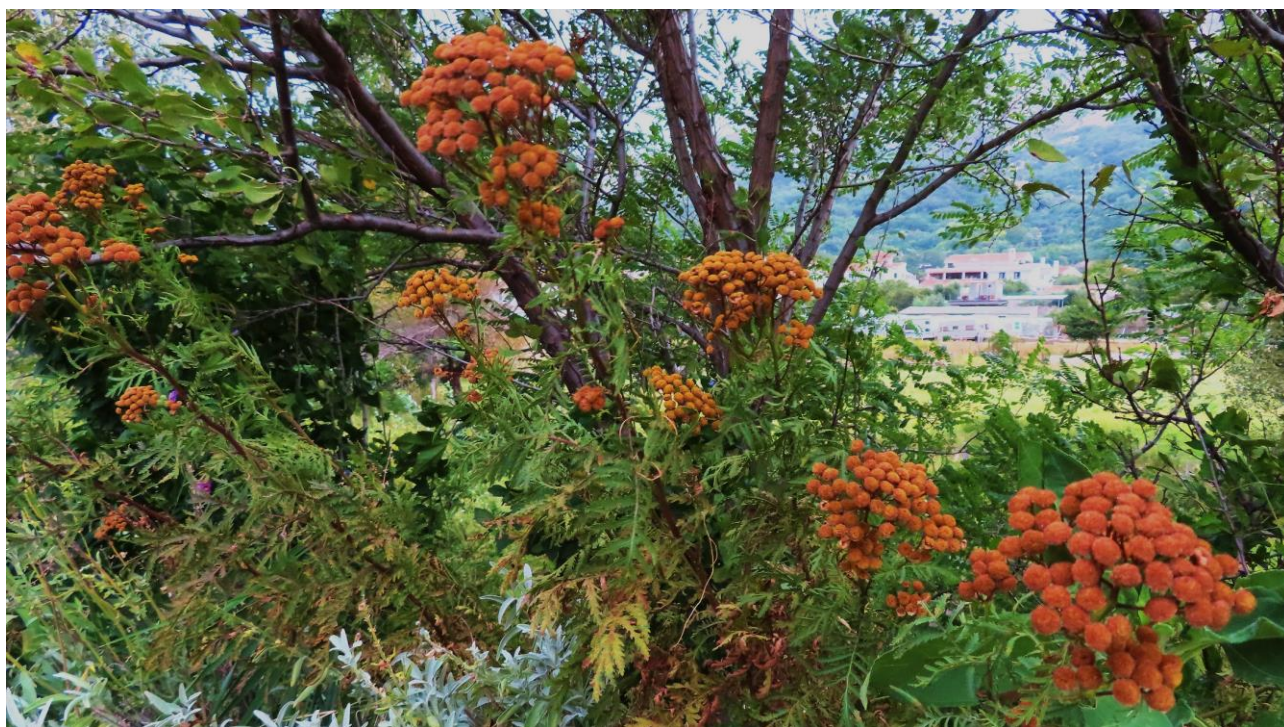
Abb. 7: Tanacetum vulgare ; Erstfund für die Insel Krk; Foto: Walter K. ROTTENSTEINER; det. Walter K. ROTTENSTEINER.

Tanacetum vulgare L. (Abb. 7) !!Neu für die Insel Krk/Veglia/Vögl's!! ; selten. Der Rainfarn wurde auf dieser Insel erstmals am 06.09.2019 entdeckt, NW Baška/Bescanuova/Weschke in Jurandvor/Giurandvor/Vidklau etwa nördlich vom Gasthaus "Malin" an der Uferböschung des Baches Suha Ričina/Fiumera, N 44°58'24,74", E 14°44'09,64", 16 m alt.