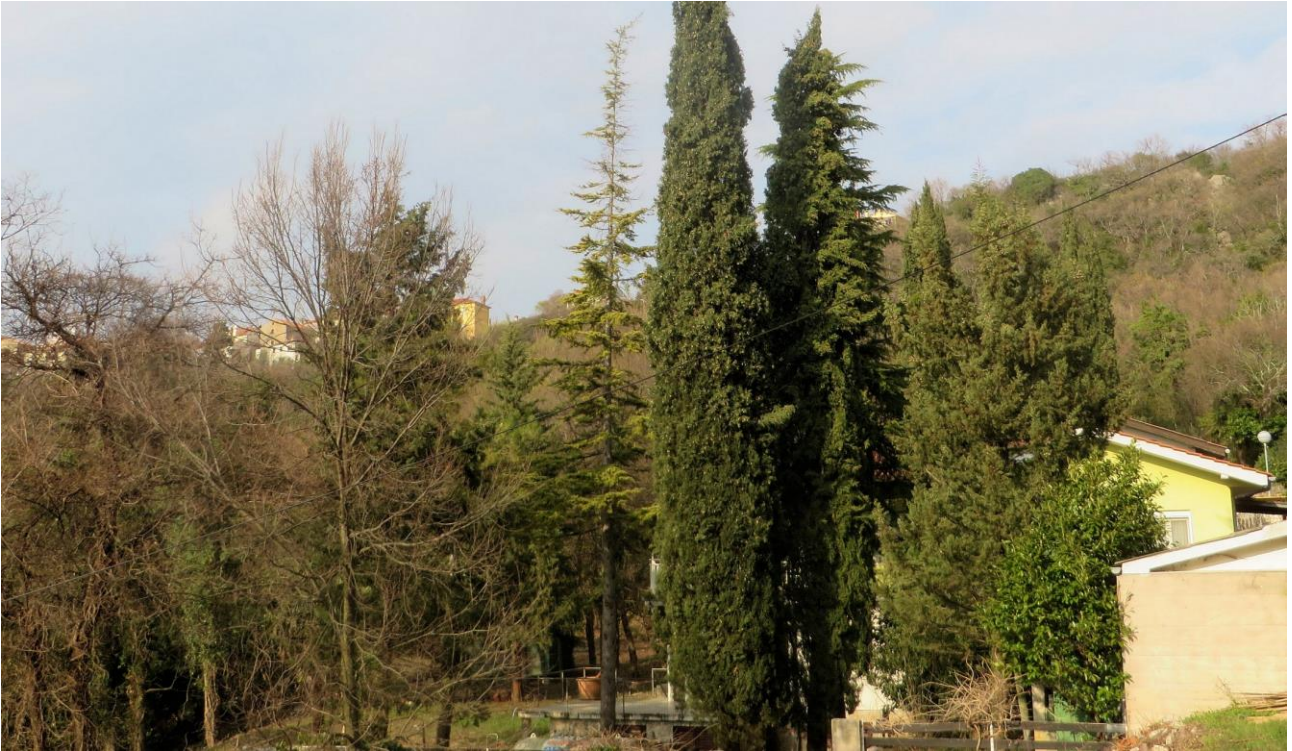
Abb. 3: Picea omorika ; Erstfund für die Insel Krk (kultiviert).