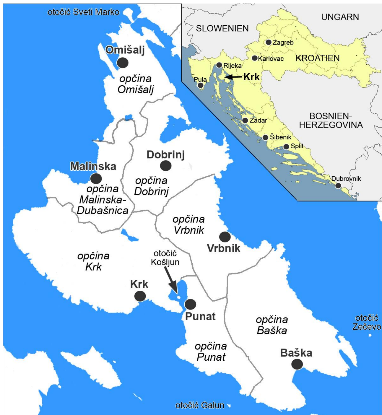
Abb. 20: Lage und politische Einteilung der Insel Krk/Veglia/Vögl in die 7 Gemeinden općina Omišalj, općina Malinska-Dubašnica, općina Dobrinj, općina Krk, općina Vrbnik, općina Punat und općina Baška.