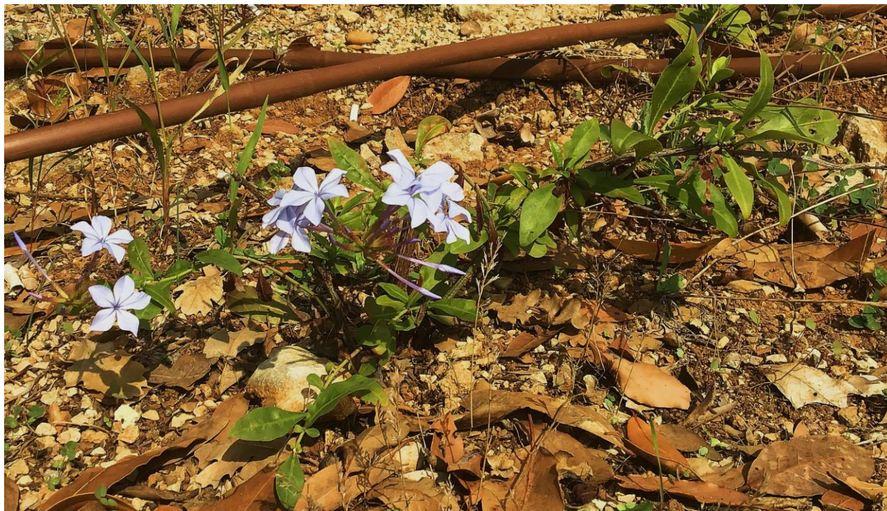
Abb. 18: Plumbago auriculata ; Erstfund für die Insel Krk, Istrien und Kroatien; confirm. Matthias ERBEN.