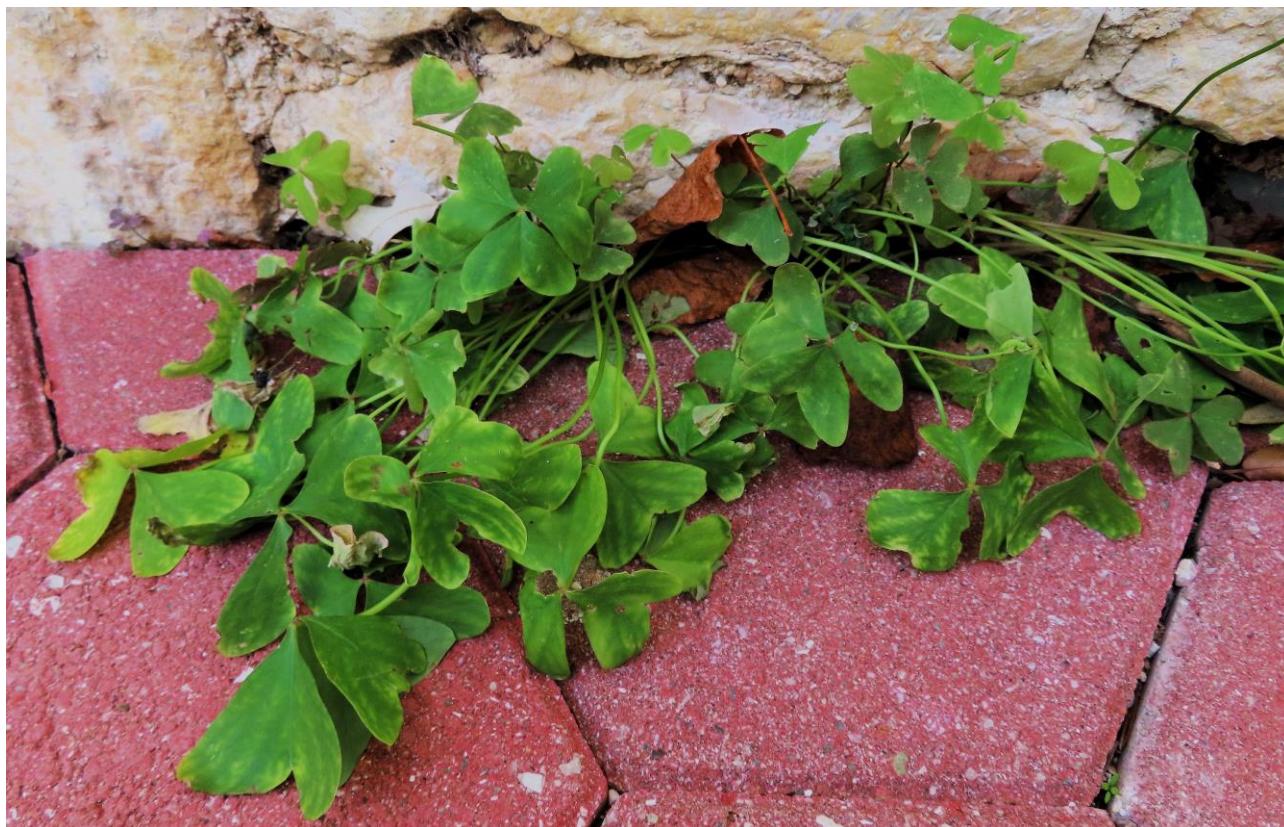
Abb. 17: Oxalis latifolia ; Erstfund für die Insel Krk; Foto: Walter K. ROTTENSTEINER; det. Walter K. ROTTENSTEINER.

Oxalis latifolia HUMB., BONPL. & KUNTH (Abb. 17) !!Neu für die Insel Krk/Veglia/Vöglis!! ; selten kultiviert und verwildert. Dieser Erstfund wurde am 31.12.2019 westlich von Punat/Ponte/Sankt Maria auf der otočić Košljun/scoglio Cassione/Klosterinsel direkt beim Franziskanerkloster gemacht: N 45°01'35,88", E 14°37'04,04", 2 m alt.; Pflasterritze.