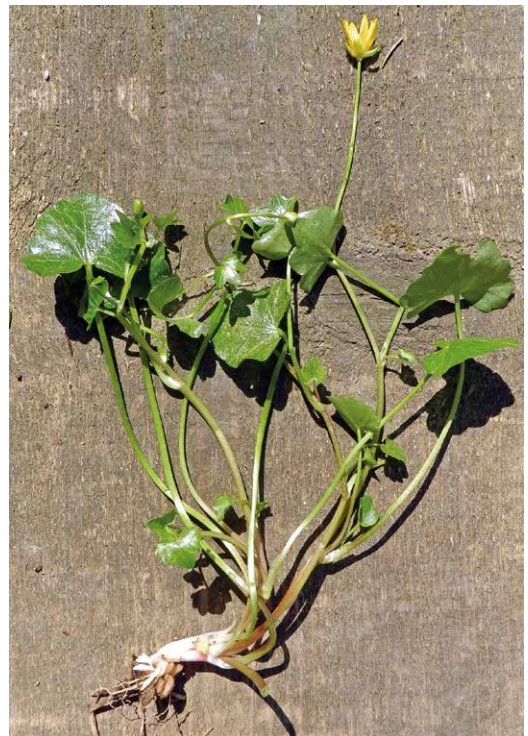
Abb. 17, 18

Scharbockskraut kann an nassen Standorten ziemlich groß werden. Mit ca. 15 cm hat diese Pflanze einen sehr langen, sich verzweigenden und relativ schlaffen Stängel ausgebildet. Auch die Blatt- und Blütenstiele sind einige Zentimeter lang. An relativ trockenen und lichtreichen Wiesenstandorten wachsen die Scharbockskrautpflanzen nur wenige Zentimeter hoch.