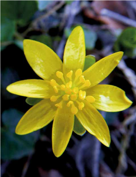
Abb. 19 Der leuchtend gelbe Blütenstern des Scharbockskrautes besteht aus 6 bis 12 lackartig glänzenden Kronblättern. Im Zentrum überragen die längeren Staubblätter die ebenso zahlreichen Fruchtblätter.