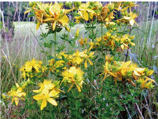
Abb. 50, 51 und 52

Die Herbstzeitlose ( Colchicum autumnale ) (Abb. 50), das Lungenkraut ( Pulmonaria officinalis ) (Abb. 51) und das Tüpfel-Johanniskraut ( Hypericum perforatum ) (Abb. 52) gehören zu jenen Pflanzen, die seit Jahrhunderten in der Volksmedizin und später zum Teil auch in der Pharmazie Verwendung gefunden haben. Besonders in der wissenschaftlich nicht tragfähigen Signaturenlehre werden von äußeren Merkmalen der Pflanzen ihre spezifischen Wirkungen abgeleitet.