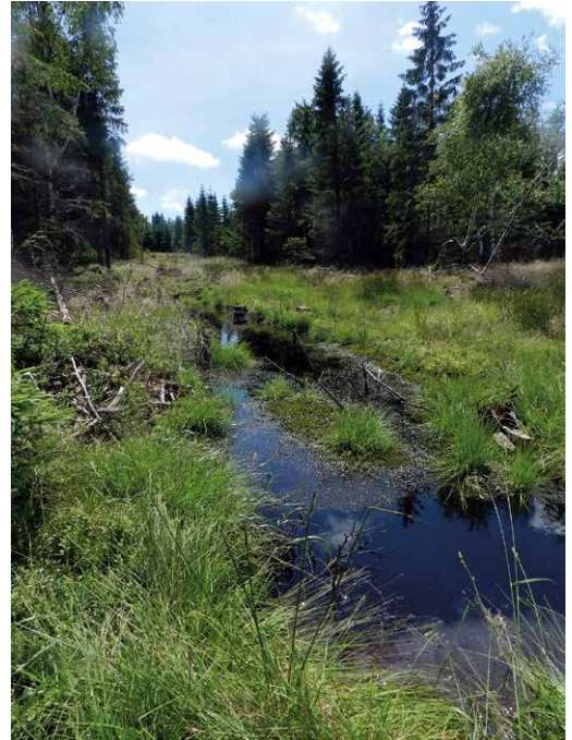
Abb. 65, 66

Die Naturwaldzelle in Steinbach ist ein gutes Beispiel für erfolgreichen Prozessschutz. Ob das in der Philipphöhe bei Satzung, einem kürzlich „revitalisiertem“ Moor, ebenso gelingen wird, hängt sowohl von der Intensität der initiierten „Wiederbelebung“ des ehemaligen Moorgebietes als auch von der Wirkung klimatischer Faktoren ab.