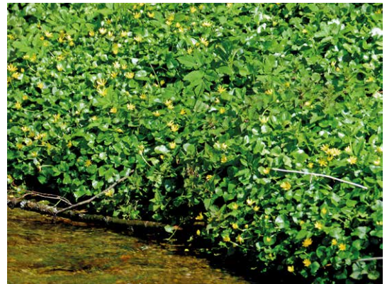
Abb. 6, 7 An manchen Standorten dominiert das Scharbockskraut ( Ficaria verna ) so stark, dass es umfangreiche gelbe Teppiche ausbilden kann. Entlang dieses Baches im „Grünen Tal“ bei Großsolbersdorf hängen die Blüten wie Balkonpflanzen über dem Wasserspiegel des Baches.

getationsperiode aufgebraucht. Gleichzeitig werden 3-4 neue, längliche Wurzelknollen zum Überdauern bis in das kommende Jahr angelegt. Anschließend sterben die oberirdischen Pflanzenteile ab; am Ende des Frühjahrs sind die Pflanzen in den lehmigen Boden „eingezogen“. Solche „Erdschürfepflanzen“ (Hemikryptophyten) bzw. „Erdpflanzen“ (Geophyten) 2 nutzen die kurzzeitig sehr günstigen Standortbedingungen (lichtreich und feucht, relativ wenig Konkurrenten) zum raschen Aufbau verdickter Speicherorgane. Bereits im Herbst sind die Knospen für die neuen Triebe an den frischen, meist von abgestorbenen Pflanzenteilen überdeckten Knollen gut zu erkennen. Das Scharbockskraut bewohnt seinen Standort oft viele Jahre hintereinander. Ändern sich aber spezifische Lebensbedingungen, verschwindet die Art allmählich aus der Lebensgemeinschaft (Biozönose). Das geschieht oft im Zuge einer natürlichen Aufeinanderfolge (Sukzession) solcher Gesellschaften. Das kann z. B. allmählich durch die zunehmende Ausprägung einer natürlichen Krautschicht