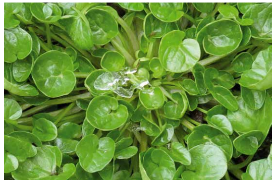
Abb. 44a, 44b

Das Echte Löffelkraut galt lange Zeit als eine „Sammelart“ ( Cochlearia officinalis agg.) aus mehreren „Kleinarten“. Diese sind inzwischen genetisch und taxonomisch genauer untersucht und erlauben eine Abtrennung als eigene Arten. Das abgebildete Bayerische Löffelkraut ( Cochlearia bavarica ) ist ein seltener Endemit im bayerischen Voralpenraum und wächst dort in skelettreichen Waldquellfluren und Kalkquellmooren. Die Wuchsgebiete der abgebildeten Pflanzen werden wie folgt angegeben: Abb. 44 a „Glonnquellen“ (Hangquellmoor Mühlthal), Lkr. Ebersberg, 24.04.2012; Abb. 44 b Kupferbachtal (Tuffhang nördlich Spielberg), Lkr. München-Land, 01.02.2014.