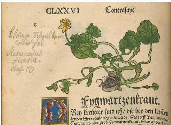
Abb. 47, 48 und 49 Otto Brunfels legte mit seinem „Contrafayt Kreüterbuch“, eine wesentliche Grundlage für weitere deutschsprachige Kräuterbücher im 16. Jahrhundert. Abb. 47 zeigt das Titelblatt der Ausgabe Straßburg 1532. „Klein Fygwartzenkraut“ oder „Paffenhödlin“ bezeichnet Otto Brunfels hier unser Scharbockskraut. Ein früherer Nutzer hat am Rand des Blattes „Klein Fygwartzenkraut“ handschriftlich den volkstümlichen Namen „kleine Schwalbenwurz“ und die lateinische Bezeichnung Ranunculus Ficaria vermerkt (Abb. 48 und 49). Das kolorierte Bild zeigt alle wesentlichen Merkmale der Art.

Obwohl bei Leonhart Fuchs und Hieronymus Bock bei den deutschen Bezeichnungen von Ficaria verna auch der Name „Scherbockskraut“ mit aufgezählt wird, fehlen Hinweise zur Anwendung gegen Skorbut. Das hatte mehrere Gründe. Zum einen ergab sich diese Nutzung kaum aus der Signaturenlehre. Zum anderen kam es erst im Zuge der großen Entdeckungen zu den weit verbreiteten Skorbutfällen bei den Seefahrern. Entsprechende Aussagen zum Scharbockskraut finden sich auch in den Kräuterbüchern von Rembert Dodoens (1516/17-1588), Adam Lonitzer (1528-1586), Matthias de L’Obel (1538-1616) und Valerius Cordus (1515-1544). 13