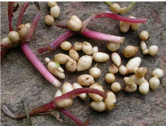
Abb. 24, 25 und 26

Die hauptsächliche Vermehrung der einheimischen Unterart Ficaria verna subsp. bulbifera erfolgt durch zahlreiche helle, getreidekorngroße Knöllchen, die während der Blütezeit in den Blattachseln heranwachsen. Diese Bulbillen fallen am Ende der Vegetationszeit von der Pflanze ab und werden durch Wasser, Tiere und andere Träger verbreitet.