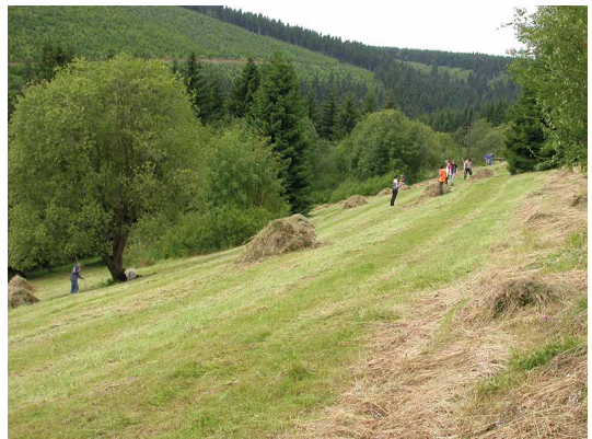
Abb. 58, 59

Eine ökologisch sinnvolle Biotop-Pflege, wie hier im Naturschutzgebiet Zechengrund bei Oberwiesenthal, ist die Voraussetzung für den Erhalt selten gewordener Pflanzengesellschaften und gefährdeter Arten.