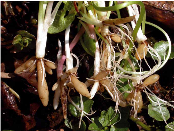
Abb. 23 Durch zufälliges Abspalten der unterirdischen Knollen von der Mutterpflanze können im kommenden Frühjahr neue Scharbockskrautpflanzen entstehen.

Die Weiterentwicklung der neu angelegten vegetativen Organe (Knollen und Bulbillen, Abb. 27, 28) hängt vom Wirken bestimmter Umweltfaktoren ab. Beim Scharbockskraut könnte das besonders der notwendige Kältereiz sein, der im Laufe einer Ruhephase einwirken muss. Ein eigener Kulturversuch legte das wenigstens nahe: Im Oktober 2014 hatte ich in der Umgebung von Scharfenstein an der Böschung eines kleinen Wasserlaufs kurze, frische Rhizomstücke von „eingezogenen“ Scharbockskraut-Pflanzen entnommen und im Zimmer in einer mit feuchter Erde gefüllten Schale bei tageszeitlich wechselnden Temperaturen gehalten. Einige der schon vorhandenen Knospen bzw. der bereits gut sichtbaren Sprosssteile bildeten im Laufe des November jeweils mehrere Laubblätter aus, die an langen Stielen 5-8 cm senkrecht nach oben wuchsen (Abb. 29). Ab der zweiten Dezemberwoche stagnierte die weitere Entwicklung der grünen Pflanzenteile; diese starben schließlich ab. Die am selben Tag eingesammelten Bulbillen aus der Umgebung dieser Pflanzen wurden gleichzeitig kultiviert. Es setzte ein geringes Streckungswachstum der im Ansatz teilweise schon sichtbaren Keimspitzen ein (1-2 mm). Bereits nach 1-2 Wochen entwickelten sich diese Bulbillen nicht weiter und schrumpften.