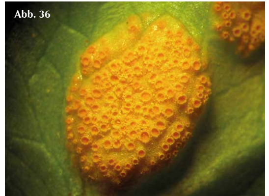
Abb. 30-36 Verschiedene Entwicklungsstufen von Rostpilzen, die Sprosstiele des Scharbockskrautes befallen: