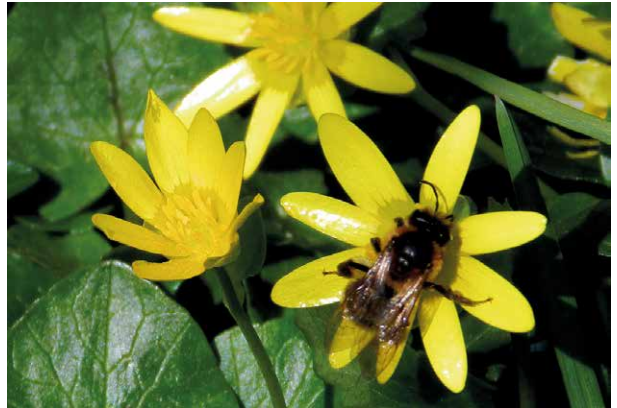
Abb. 21 Die Blüten des Scharbockskrautes produzieren reichlich Pollen und Nektar und werden häufig von Schmetterlingen, Bienen und anderen Insekten besucht. Trotz Bestäubung der zwittrigen Blüten kommt es bei der heimischen Unterart kaum zur Ausbildung reifer Früchte.