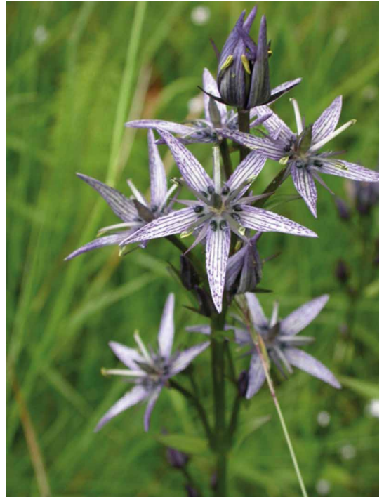
Abb. 60, 61

Glieder solcher montanen Pflanzengesellschaften im Gebiet des NSG „Zechengrund“ sind z. B. die Mondraute ( Botrychium lunaria ), eine seltene und versteckt lebende Farnpflanze, und der Blaue Tarant oder Sumpfenzian ( Swertia perennis ), eine in Sachsen nur noch im oberen Erzgebirge vorkommendes Kaltzeitrelikt.