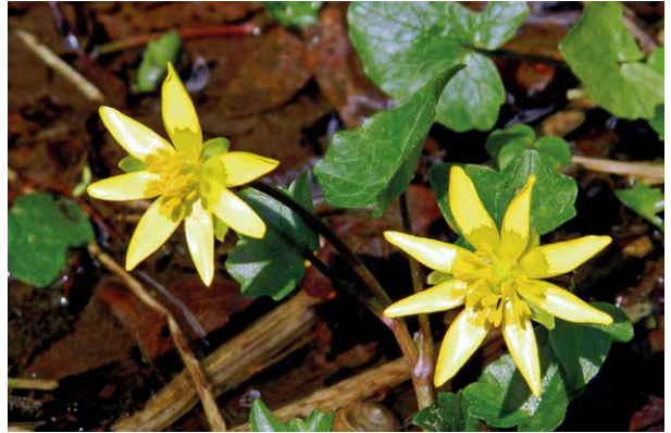
Abb. 20 Der auffällige Glanz der Blüten des Scharbockskrautes kommt durch die starke Reflexion des Lichtes zustande. Nur an ihrem matt schimmernden Grund wird wenig Licht reflektiert. Solche Stellen werden „Flecksaftmale“ genannt und dienen Insekten zur Orientierung.