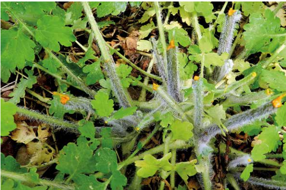
Abb. 46a, 46b

Das Große Schellkraut ( Chelidonium majus ) wächst an Wegrändern, Mauern und anderen Ruderalstandorten. Bei Verletzung der Pflanze tritt aus den Blättern und Stängeln ein auffallend gelbroter Saft aus, den man auch als „Warzengift“ verwendet.