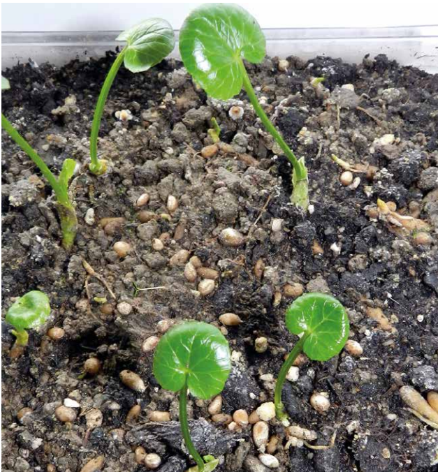
Abb. 29 Ein angesetzter Kulturversuch auf dem Fensterbrett im November 2014 verlief zunächst viel versprechend. Aus den grünen Knospen sprossen im Laufe des Monats November mehrere Laubblätter, die an langen Stielen 5 - 8 cm senkrecht nach oben wuchsen. Ab der 2. Dezemberwoche stagnierte die weitere Entwicklung der grünen Pflanzenteile. Die Bulbillen blieben schon zu Beginn des Kulturversuchs sitzen. Mitte Dezember waren alle oberirdischen Teile abgestorben.

H. G. L. Reichenbach das Scharbockskraut Ficaria ranunculoides MNCH. (REICHENBACH 1844). Zu Beginn des 20. Jahrhunderts wurde von Otto Wünsche der Name Ranunculus ficaria L. verwendet (WÜNSCHE 1904). Im „Wünsche-Schorler“, einem Nachfolgewerk seit 1912, findet man erst spät Ficaria verna HUDS. (FLÖSSNER et al. 1956). Im „Rothmaler“, der für das gesamte Gebiet der DDR