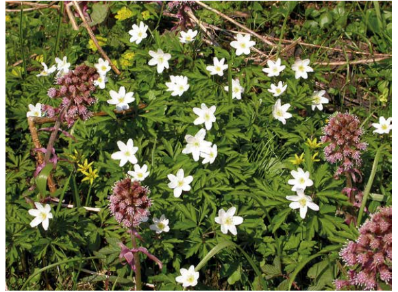
Abb. 13, 14

Auf dieser großen Feuchtwiese in einem Seitental der Preßnitz hat eindeutig die Rote Pestwurz ( Petasites hybridus ) die Vorherrschaft. Die gelben Tupfer stammen vom Wald-Goldstern ( Gagea lutea ), vom Wechselblättrigen Milzkraut ( Chrysosplenium alternifolium ) oder von der Sumpfdotterblume ( Caltha palustris ). Vor allem an den Böschungen findet man auch einige blühende Scharbockskrautpflanzen.