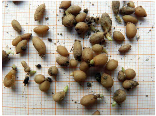
Abb. 27, 28 Bereits im Herbst kann man beim Scharbockskraut zahlreiche auskeimende Sprosssteile beobachten; auch manche Bulbillen zeigen kurze Keimspitzen.