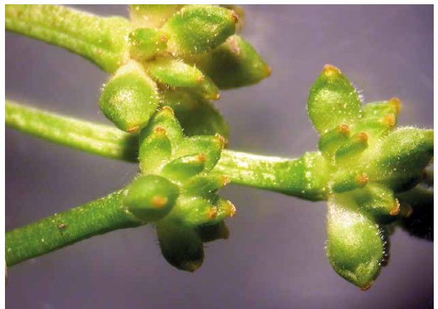
Abb. 22 Nur selten kann man beim einheimischen Knöllchen-Scharbockskraut ( Ficaria verna ssp. bulbifera ) reife Früchte beobachten, hier an einzelnen Pflanzen einer Population am Großsolbersdorfer Bach im Mündungsbereich zur Zschopau. Die von feinen Härchen bedeckten Nüsschen waren auffällig größer und bildeten eine feste Schale aus. Ob der im Inneren befindliche längliche, relativ flache Körper ein reifer Samen oder doch nur die eingetrocknete Samenanlage ist, könnte erst durch einen Keimversuch geklärt werden.