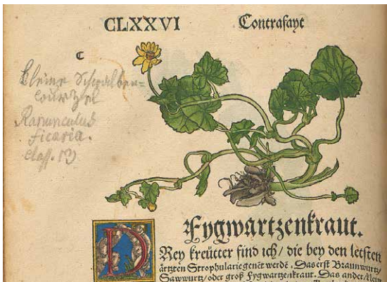
Abb. 47, 48 und 49 Otto Brunfels legte mit seinem „Contrafayt Kreüterbuch“, eine wesentliche Grundlage für weitere deutschsprachige Kräuterbücher im 16. Jahrhundert. Abb. 47 zeigt das Titelblatt der Ausgabe Straßburg 1532. „Klein Fygwartzenkraut“ oder „Paffenhödlin“ bezeichnet Otto Brunfels hier unser Scharbockskraut. Ein früherer Nutzer hat am Rand des Blattes „Klein Fygwartzenkraut“ handschriftlich den volkstümlichen Namen „kleine Schwalbenwurtzel“ und die lateinische Bezeichnung Ranunculus Ficaria vermerkt (Abb. 48 und 49). Das kolorierte Bild zeigt alle wesentlichen Merkmale der Art.

Obwohl bei Leonhart Fuchs und Hieronymus Bock bei den deutschen Bezeichnungen von Ficaria verna auch der Name „Scherbockskraut“ mit aufgezählt wird, fehlen Hinweise zur Anwendung gegen Skorbut. Das hatte mehrere Gründe. Zum einen ergab sich diese Nutzung kaum aus der Signaturenlehre. Zum anderen kam es erst im Zuge der großen Entdeckungen zu den weit verbreiteten Skorbutfällen bei den Seefahrern. Entsprechende Aussagen zum Scharbockskraut finden sich auch in den Kräuterbüchern von Rembert Dodoens (1516/17-1588), Adam Lonitzer (1528-1586), Matthias de L’Obel (1538-1616) und Valerius Cordus (1515-1544). 13