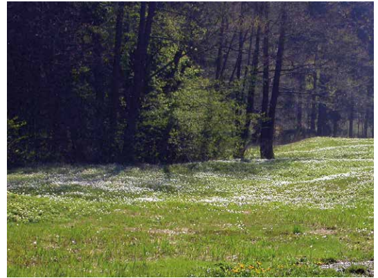
Abb. 4, 5 Feuchte Wiesen, Bachsäume und Gebüschfluren, hier im Zschopautal bei Scharfenstein und im Heidelbachtal bei Drebach, gehören zu den typischen Standorten des Scharbockskrautes.