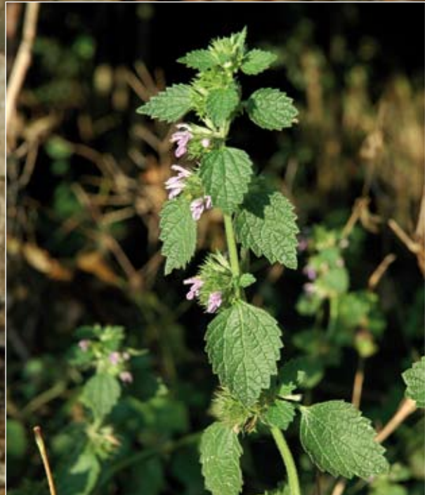
Abb. 9: Die Schwarznessel ( Ballota nigra ) - eine alte, vergessene Heilpflanze. Nach HIRSCH u. GRÜNBERGER (2006) wirkt sie unter anderem krampflösend, beruhigend und antibakteriell. Auf Grund ihres unangenehmen Geruches hat man sie früher laut HEGI (1926) nur äußerlich gegen Haut- und Haarkrankheiten verwendet.