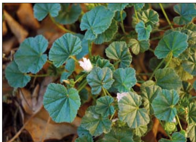
Abb. 4: Die Weg-Malve ( Malva neglecta ) - eine vielseitig genutzte Heil- und Nahrungspflanze der mittelalterlichen Burgen (DEHNEN-SCHMUTZ 2000) - hier im Garten des Schlosses Vornbach am Inn.

Eine gewisse Bedeutung dürfte auch der Gefleckte Aronstab ( Arum maculatum - Abb. 10) gehabt haben, denn VIERHAPPER (1885) bezeichnete diese Art als „sehr häufig am Schlossberge von Wildshut“. Im Burggraben der Burg Obernberg am Inn kommt er heute noch gehäuft vor. Nach HEGI (1909) galt der Aronstab einst als Hexenkraut und Orakelpflanze. Er spielte aber auch medizinisch eine Rolle und wurde gegen Lungenleiden und Husten verwendet. Der Schild-Sauerampfer ( Rumex scutatus ) - eigentlich eine Pflanze der Steinschutt- und Geröllfluren der Alpen - wurde