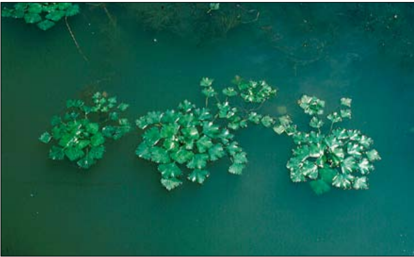
Abb. 31: Die Wärme liebende Wassernuss ( Trapa natans ) war bei uns nur in den zwischen- und nacheiszeitlichen Wärmezeiten heimisch. Die Angaben aus dem 19. und 20. Jahrhundert betrafen ziemlich sicher kultivierte Pflanzen in Schlossteichen oder ähnlichen Gewässern. Diese Vorkommen sind heute aus Oberösterreich wieder verschwunden (HOHLA u. a. 2009).