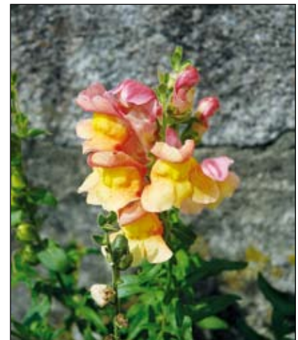
Abb. 22: Das aus dem Mittelmeergebiet stammende Große Löwenmaul ( Antirrhinum majus ) wurde bereits im 16. Jahrhundert als Zierpflanze eingeführt, wo es alsbald verwilderte. Seine Heimat liegt im westlichen Mittelmeergebiet, wo es in Felsspalten und im Schotter der Flüsse wächst (KRAUSCH 2007). Damals wurden allerdings haupt- sächlich die trüb-purpurrote Wildform oder nahestehende Sorten verwendet.

Verwilderungen der Echten Katzen- minze ( Nepeta cataria - Abb. 24)