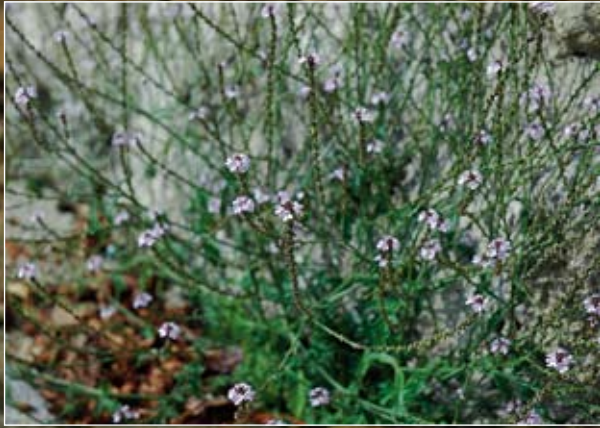
Abb. 8: Ein im Altertum berühmtes Heilkraut bei Verwundungen durch eiserne Waffen, heute jedoch nahezu ohne Bedeutung - das Eisenkraut ( Verbena officinalis ).