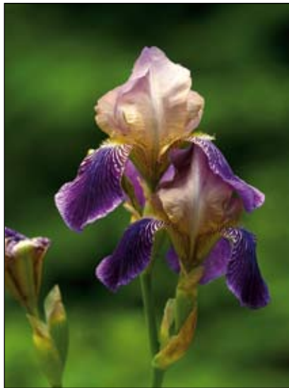
Abb. 23: RITZBERGER (1908) gibt die Holunder-Schwertlilie ( Iris x sambucina ) von den Felsen bei der Ruine Losenstein an. Sie zählt auch zu den Besonderheiten an den Hängen unterhalb der Feste Oberhaus in Passau (ZAHLEHEIMER 2001).

Früher, zur Ritterzeit, wurden die Abhänge rund um die Burgen noch weitgehend frei gehalten, um angreifende Feinde so früh wie möglich erkennen zu können. Außerdem wurden sie auch wegen des wertvollen Brennholzes regelmäßig abgeholzt oder man ließ die Burgberge einfach