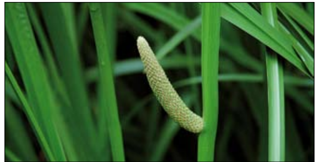
Abb. 14 (Oben): Der Kalmus ( Acorus calamus ) - stammt ursprünglich aus Asien, war aber schon im 16. Jahrhundert bei uns eingebürgert. Diese Arznei- und Likörpflanze wurde gegen Magenbeschwerden und Appetitlosigkeit eingesetzt und wuchs noch vor wenigen Jahrzehnten in vielen kleinen Bauernteichen. VIERHAPPER (1885) gab diese Pflanze vom Schlossteiche bei Aistersheim an, RITZBERGER (1907) vom „Schaumburgerteiche“.