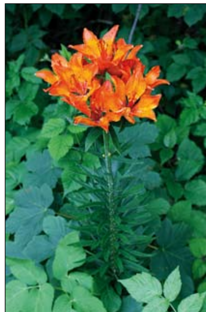
Abb. 21: Die Feuerlilie ( Lilium bulbiferum ) ist ihrer attraktiven Blüten wegen frühzeitig in die Gärten geholt worden, von wo aus sie auch verwilderte, wie hier am Schlosshang des Schlosses Wildberg.

In manchen Fällen ließ sich Nütz- lichkeit auch mit Ästhetik verbinden, wie etwa beim März-Veilchen ( Viola odorata ) oder beim Echten Goldlack ( Erysimum cheiri - Abb. 18), beides attraktive Arten, die auch medizinisch genutzt wurden (DEHNEN-SCHMUTZ 2000). Während der Echte Goldlack heute in unserer Flora - abgesehen von seltenen, unbeständigen Verwilde- rungen - fehlt, ist das März-Veilchen ein weitverbreiteter Archäophyt. (Darunter versteht man eine Art, die bereits vor 1500 verwilderte und heute eingebürgert ist). Dieses Veilchen wächst nun an vielen Waldrändern, unter Gebüsch und in schattigen Wegrainen, meist jedoch in Siedlung- nähe und kaum jemand vermutet noch dessen fremde Herkunft. Für viele ist es das Veilchen schlechthin, sein Duft ist den meisten wohlbekannt, während die anderen, geruchlosen heimischen Arten pauschal als „Hundsveigal“ abgetan werden (HOHLA 2008). Na-