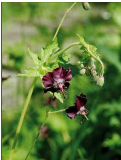
Abb. 25: Es ist anzunehmen, dass auch der Braune Storchschnabel ( Geranium phaeum ) einst als Zierpflanze kultiviert wurde. Heute wächst er noch in der Umgebung der Burg Obernberg am Inn. Dass ihn auch VIERHAPPER (1882) bei der Schlossruine Ibm neben anderen klassischen alten Kulturpflanzen vorfand, bestärkt meine Vermutung.

von Schafen oder Ziegen beweidet. An den exponierten, felsigen Stellen konnten viele licht- und wärmeliebende Arten wachsen, darunter auch so mancher Burggartenflüchtling. In den letzten Jahrzehnten sind viele Burggräben und Böschungen zugewachsen und die empfindlichen Arten werden von den Gehölzen verdrängt. Beispielhaft ist das „Tauernscheckenprojekt“ an den Burghängen von Burghausen, wo etwa 10 Hektar