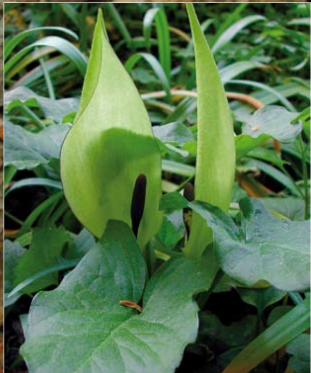
Abb. 10: Der Gefleckte Aronstab ( Arum maculatum ) zählt zu den „Kessel-Gleitfallenblumen“, da die Insekten gefangen gehalten und erst nach der erfolgreichen „Bestäubung“ mit Pollen wieder entlassen werden. Im Volksglauben nahm man früher an, dass der Aronstab als Phallussymbol die Potenz steigern und den Nachwuchs sichern würde (DÜLL u. KUTZELNIGG 2005).