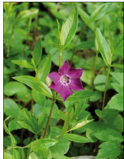
Abb. 26: Die vielen Vorkommen des Kleinen Immergrüns ( Vinca minor ) in unseren umliegenden Wäldern stellen unauslöschbare Spuren längst vergangener Siedlungen und Burganlagen dar. Diese auffällige, dunkelrosa blühende Sorte wächst in den bewaldeten Hängen unterhalb der Burg ruine Obernberg am Inn.

von Frühjahr bis Herbst beweidet werden. Durch die Offenhaltung der Hänge nach historischem Vorbild wird die Strukturvielfalt und somit die Artenvielfalt wesentlich erhöht. Tauernschecken-Ziegen sind eine