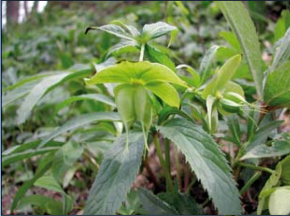
Abb. 16: Die Grüne Nieswurz ( Helleborus viridis ) - nach G. Kleesadl (mündl. Mitt.) heute noch am Schlosshang des Schlosses Wildberg - ist ebenfalls eine altbekannte Heilpflanze, jedoch in der Tiermedizin.