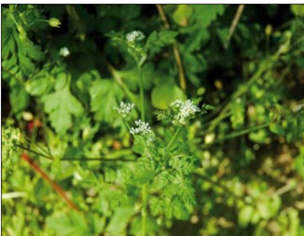
Abb. 29: Der Garten-Kerbel - ( Anthriscus cerefolium var. cerefolium ), eine alte Gewürzpflanze, die gerne aus Burggärten verwilderte - hier in den Gebüsch um die Ruine der Burg Obernberg am Inn.

Eines der weiteren typischen - wenn auch unauffälligen - Burggarten-Relikte ist der Garten-Kerbel ( Anthriscus cerefolium var. cerefolium - Abb. 29), eine alte Gewürzpflanze, die immer wieder im Bereich von Burgen verwildert gefunden wird und dort fest in der umgebenden Vegetation etabliert ist (vgl. ZAHLHEIMER 2001, HOHLA 2009). Von flächendeckenden Kerbelbeständen um Burgruinen berichtet zum Beispiel auch BRANDES (1996). Der Frankfurter Stadtarzt Adam LONITZER bezeichnete den Kerbel in seinem 1679 erschienenen Kräuterbuch einst als „Musskraut“, was bedeutet, dass er in