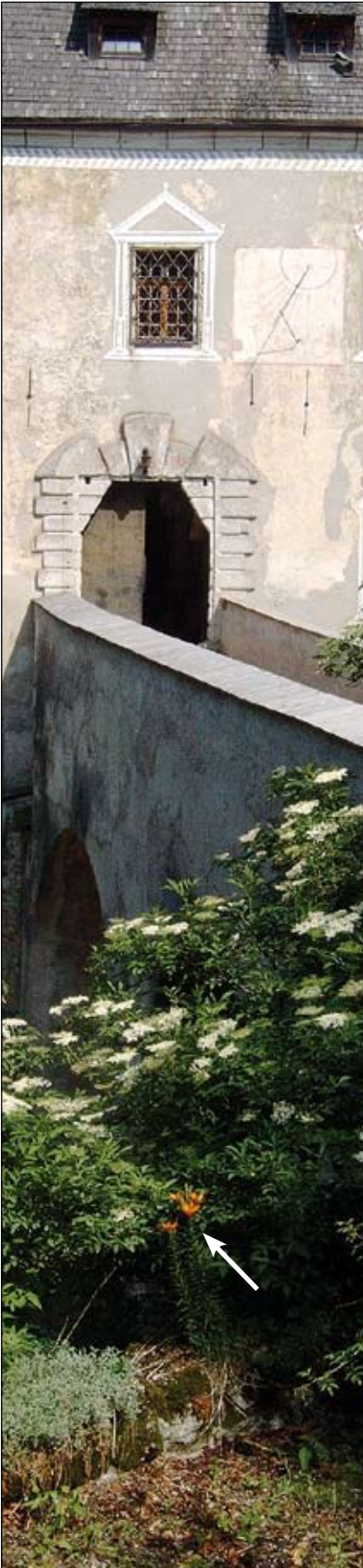
Abb. 20: Burg Altpernstein: eine wohl-erhaltene Burg hoch über dem Kremstal, urkundlich erstmals 1147 erwähnt (HAINISCH 1977), mit Holunder und Feuerlilie (Pfeil) im heutigen Burggarten.

von Gläsern. Diese zwei Glaskraut-Arten wurden bereits von den Römern ins Land gebracht (KOWARIK 2003). In Passau waren sie noch im 19. Jahrhun- dert zu finden. Heute sucht man sie dort jedoch vergebens (ZAHLHEIMER 2001). Es ist anzunehmen, dass auch bereits damals schon das „Zinnkraut“ - der Acker-Schachtelhalm ( Equi- setum arvense ) - zum Reinigen des Metallgeschirrs genutzt wurde.