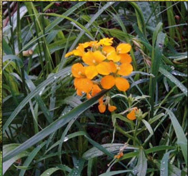
Abb. 18: Der Echte Goldilack ( Erysimum cheiri ) - eine bereits im Mittelalter kultivierte Art, die nach FISCHER u. a. (2008) stellenweise an Felsen und alten Gemäuern von Burgen eingebürgert vorkommt.