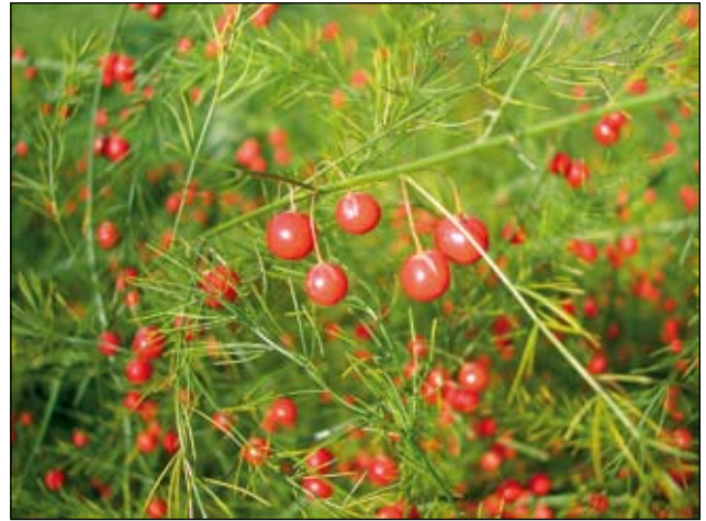
Abb. 12: Der Spargel ( Asparagus officinalis ) wurde bereits in den mittelalterlichen Burgen als Nahrungspflanze genutzt und auch medizinisch verwendet (DEHNEN-SCHMUTZ 2000). Heute ist diese Art in manchen Auwäldern eingebürgert.

Aber nicht nur Heil- und Zauberpflanzen hat man auf Burgen kultiviert, sondern auch andere nützliche Arten. Die Färber-Resede ( Reseda luteola ) und die Färber-Hundskamille ( Anthemis tinctoria ) wurden etwa zum Färben von Stoffen verwendet und das Glaskraut ( Parietaria judaica und P. officinalis - Abb. 17) zum Reinigen