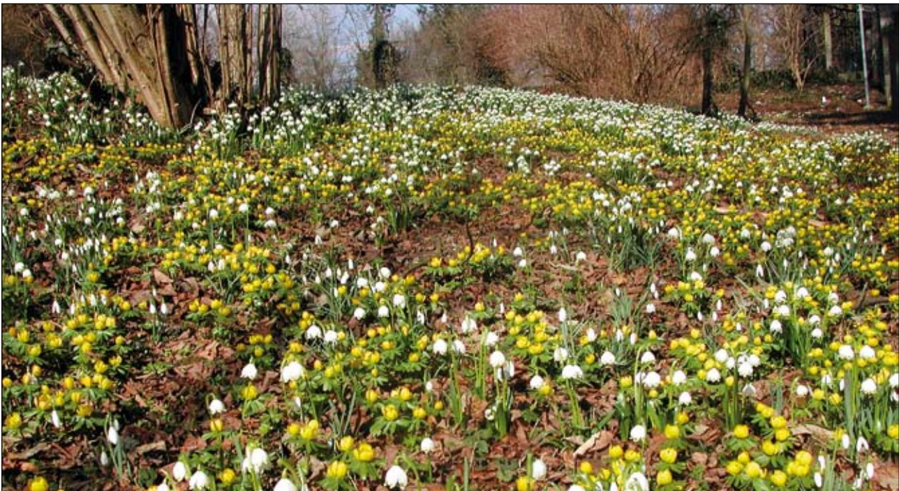
Abb. 34: Frühling im Burggarten der Burg Obernberg am Inn - mit Frühlings-Knotenblumen ( Leucojum vernum ), Schneeglöckchen ( Galanthus nivalis ) und Winterlingen ( Eranthis hyemalis ). Die aus Südeuropa stammenden Winterlinge kamen in der zweiten Hälfte des 16. Jahrhunderts nach Mitteleuropa (KRAUSCH 2007).

der Gefäßpflanzen Oberösterreichs (HOHLA u. a. 2009). Die meisten Fotos wurden vom Autor gemacht. Für die Überlassung weiterer Fotos danke ich Herrn Werner Bejvl,