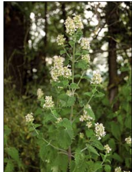
Abb. 24: Die echte Katzenminze ( Nepeta cataria ) - eine Art der Burggärten - hier im Gebüschsaum an der Innleiten in der Nähe des Schlosses Katzenberg. HEGI (1926) berichtete über die Erzählungen eines Schweizer Arztes im 17. Jahrhundert, wonach ein damals weithin bekannter Scharfrichter aus „ursach menschlichen mitleidens“ keine Hinrichtungen vornehmen hätte können, wenn er nicht vorher ein Stück Katzenminzenwurzel gekaut und sie danach unter die Zunge genommen hätte, sodass „ihm augenblicklich ein zorn und grimm ankommen und er ganz blutigierig worden“ ist.

von Frühjahr bis Herbst beweidet werden. Durch die Offenhaltung der Hänge nach historischem Vorbild wird die Strukturvielfalt und somit die Artenvielfalt wesentlich erhöht. Tauernschecken-Ziegen sind eine