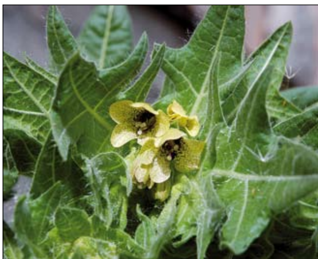
Abb. 5: Das Schwarze Bilsenkraut ( Hyoscyamus niger ) - eine stark giftige Pflanze, die im Mittelalter zur Herstellung von Liebestränken und Hexensalben mit erotisierender oder berauschender Wirkung mit Halluzinationen verwendet wurde. Bis ins 17. Jahrhundert wurde diese Pflanze deshalb auch von den Brauereien angebaut und dem Bier zugesetzt (DÜLL u. KUTZELNIGG 2005).