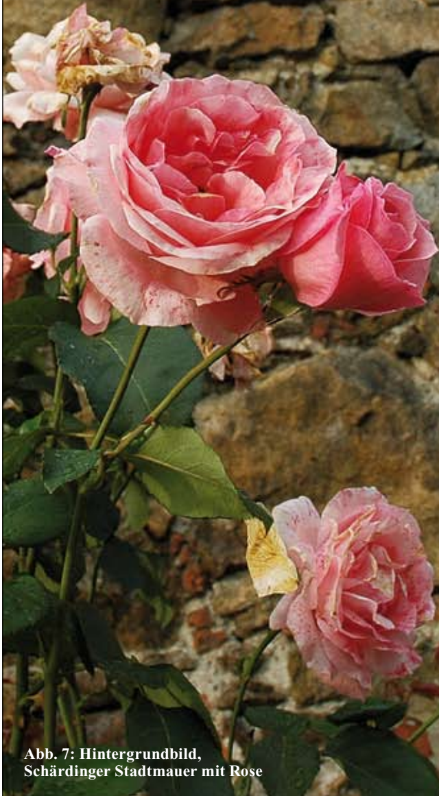
Abb. 7: Hintergrundbild, Schärdinger Stadtmauer mit Rose