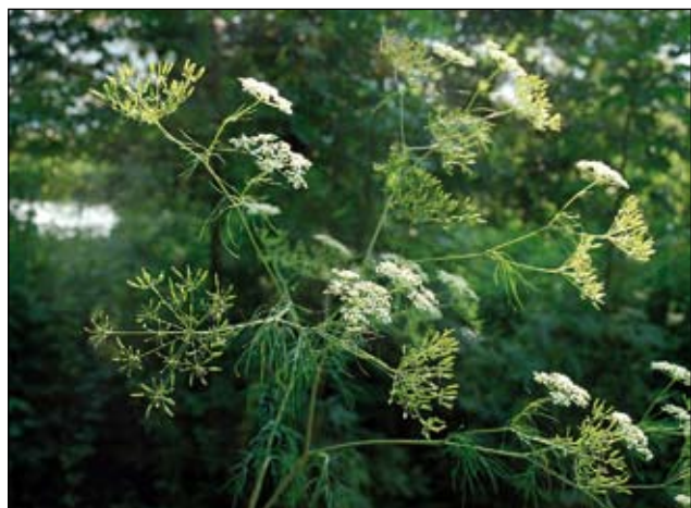
Abb. 30: Der Rüben-Kälberkropf ( Chaerophyllum bulbosum ) - auch „Kerbelrübe“ genannt. Nach HEGI (1926) dürfte deren Anbau bis ins Mittelalter zurückgehen. Durch die Klöster sei sie verbreitet worden. Auch die zahlreichen Vorkommen im östlichen Innviertel könnten Abkömmlinge früherer Kulturen darstellen.