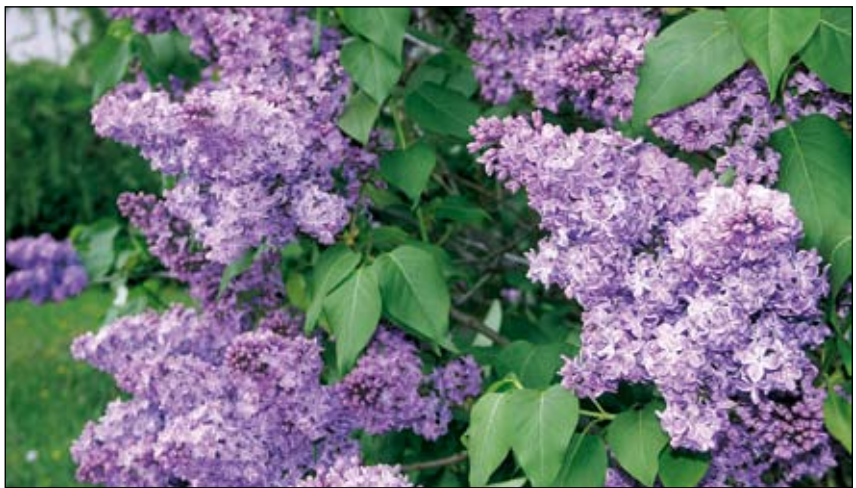
Abb. 26: Der Gewöhnliche Flieder ist in Bulgarien und angrenzenden Gebieten beheimatet, von wo er im 15. Jahrhundert von den Türken in die Gärten geholt wurde. Der berühmte Botaniker Carolus Clusius, der 1573 bis 1588 in Wien wirkte, schrieb 1576, dass er jetzt auch bei uns in Gärten wachse. Von Wien, aber auch von Italien aus, gelangte der Flieder anschließend auch in andere Orte West- und Mitteleuropas (KRAUSCH 2007).