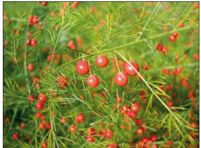
Abb. 12: Der Spargel ( Asparagus officinalis ) wurde bereits in den mittelalterlichen Burgen als Nahrungspflanze genutzt und auch medizinisch verwendet (DEHNEN-SCHMUTZ 2000). Heute ist diese Art in manchen Auwäldern eingebürgert.

Aber nicht nur Heil- und Zauberpflanzen hat man auf Burgen kultiviert, sondern auch andere nützliche Arten. Die Färber-Resede ( Reseda luteola ) und die Färber-Hundskamille ( Anthemis tinctoria ) wurden etwa zum Färben von Stoffen verwendet und das Glaskraut ( Parietaria judaica und P. officinalis - Abb. 17) zum Reinigen