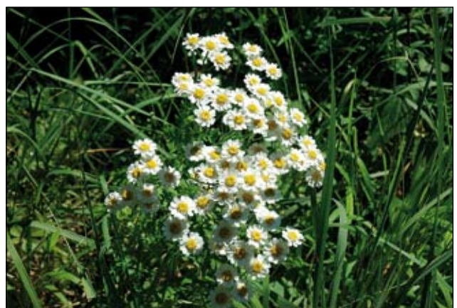
Abb. 6: Die Mutterkamille ( Tanacetum parthenium ) dürfte mit den Römern ins Land gekommen sein. Bereits Dioskurides beschreibt die positive Wirkung dieser Pflanze für Frauen: Es „wird die Hartigkeit der beer Mutter dadurch erweicht“. Auch Hildegard von Bingen schätzte die Heilkraft der Mutterkamille sehr, denn sie ist „den schmerzenden Eingeweiden wie eine angenehme Salbe“. Frauen bereitet es in ihren Tagen „eine angenehme und leichte Reinigung des Schleims und des inneren Unrats und leitet den Monatsfluß hinaus“ (STRANK & MEURERS-BALKE 2008).