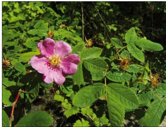
Abb. 28: Dass auch die Zimt-Rose ( Rosa majalis ) auf alten Schlossanlagen kultiviert wurde, beweist der Herbarbeleg einer verwilderten Pflanze im Herbarium des Biologiezentrums Linz, welche A. Dürrnberger im Jahr 1890 beim Schloss Kreutzen sammelte.

„sie machen dieselben klar und ziehen das „triefen“ heraus“ (HINZ 2007). In späterer Zeit reichte man Rosen auch als beliebte Fleisch- und Dessertwürze zum Essen. Rosenwasser und Rosenöl waren bereits im frühen Mittelalter begehrte Handelsgüter. Im Laufe der Kreuzzüge gelangten dann einige orientalische Gartenrosen (und auch der Name der Rose!) nach Mitteleuropa. So brachten die Kreuzfahrer damals verschiedene Abkömmlinge der Damaszener-Rose ( Rosa damascena ) ins Land. Eine beliebte Rose der Renaissancezeit war die Weiße Rose ( Rosa alba ), eine Hybride mit umstrittener Abstammung, besonders in einer halbgefüllten Form ( 'semiplena' ). Zu dieser Zeit mehrten sich in den mitteleuropäischen Gärten bereits fremdländische Rosen aus dem Mittelmeergebiet und aus Asien.