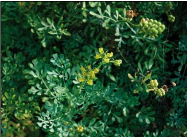
Abb. 3: Die Wein-Raute ( Ruta graveolens ) wurde in den Burggärten außer als Heilpflanze auch als Zauberpflanze zum Vertreiben von Feinden, Teufel und Schlangen gebraucht (MARZELL 1922).

graveolens - Abb. 3), die außer als Heilpflanze auch als Zauberpflanze zum Vertreiben von Feinden, Teufel und Schlangen gebraucht wurde (MARZELL 1922). Dieses Kraut wurde bereits sehr früh - um 800 - im „Capitulare de Villis“ Karls des Großen erwähnt (KOWARIK 2003). Zu medizinischen Zwecken verwendete man damals noch eine ganze Reihe weiterer Pflanzen. Dazu zählen auch heute noch bekannte Heilpflanzen wie etwa der Spitz-Wegerich ( Plantago lanceolata ), die Weg-Malve ( Malva neglecta - Abb. 4) oder die Wilde Malve ( Malva sylvestris ). Die berauschende und „abhebende“ Wirkung des giftigen Schwarzen Bilsenkrautes ( Hyoscyamus niger - Abb. 5) machte diese Pflanze zu einer wichtigen Zutat der „Hexenküche“ aber auch der früheren Bierbraukünste. Die