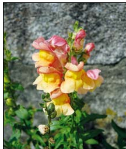
Abb. 22: Das aus dem Mittelmeergebiet stammende Große Löwenmaul ( Antirrhinum majus ) wurde bereits im 16. Jahrhundert als Zierpflanze eingeführt, wo es alsbald verwilderte. Seine Heimat liegt im westlichen Mittelmeergebiet, wo es in Felsspalten und im Schotter der Flüsse wächst (KRAUSCH 2007). Damals wurden allerdings haupt- sächlich die trüb-purpurrote Wildform oder nahestehende Sorten verwendet.

Verwilderungen der Echten Katzen- minze ( Nepeta cataria - Abb. 24)