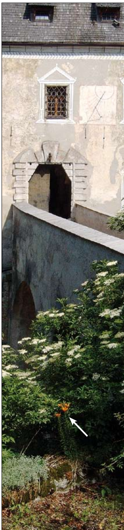
Abb. 20: Burg Altpernstein: eine wohl-erhaltene Burg hoch über dem Kremstal, urkundlich erstmals 1147 erwähnt (HAINISCH 1977), mit Holunder und Feuerlilie (Pfeil) im heutigen Burggarten.

von Gläsern. Diese zwei Glaskraut-Arten wurden bereits von den Römern ins Land gebracht (KOWARIK 2003). In Passau waren sie noch im 19. Jahrhun- dert zu finden. Heute sucht man sie dort jedoch vergebens (ZAHLHEIMER 2001). Es ist anzunehmen, dass auch bereits damals schon das „Zinnkraut“ - der Acker-Schachtelhalm ( Equi- setum arvense ) - zum Reinigen des Metallgeschirrs genutzt wurde.