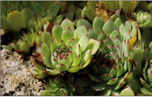
Abb. 11: „ Et ille hortulanus habeat super domum suam Jovis barbam “ - „Auf dem Dach seines Hauses habe oder pflanze ein jeder Gärtner die Dachwurz“, so empfahl (oder befahl) es Kaiser Karl der Große in seinem „Capitulare“. Die Dach-Hauswurz ( Sempervivum tectorum ) sollte nämlich angeblich gegen Blitzschlag schützen (STRANK u. MEURERS-BALKE 2008), daher auch ihre weiteren alten Namen Donarsbart, Donnerbart oder Gewitterkraut.

früher allgemein als „Französischer (oder Römischer) Spinat“ angepflanzt (DÜLL u. KUTZELNIGG 1994) und verwilderte nicht selten auf alten Mauern, wie zum Beispiel auf der Stadtmauer von Braunau (LOHER 1887), in Kremsmünster (GUPPENBERGER 1874) oder bei der Schlossruine Ibm (VIERHAPPER 1882, RITZBERGER 1911). Diese verwilderten Vorkommen sind heute jedoch allesamt wieder verschwunden.