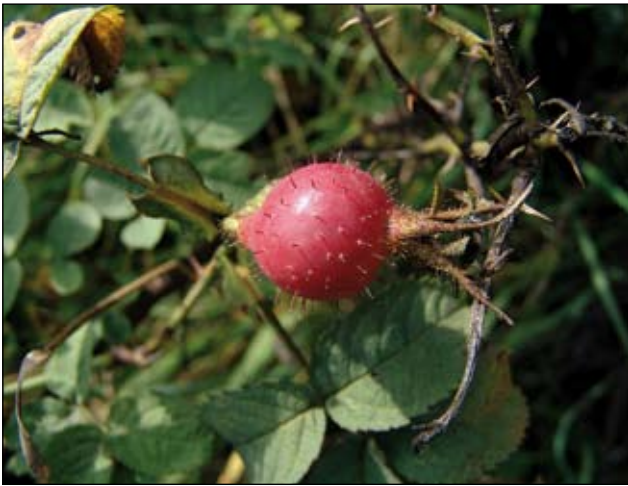
Abb. 27: Großfrüchtige Formen der Apfel-Rose („ R. pomifera “) wurden früher zur Marmeladeherstellung kultiviert. DÜRRNBERGER (1893) fand diese Rose als Überbleibsel alter Kulturen beim Schloss Wildberg nahe Linz.