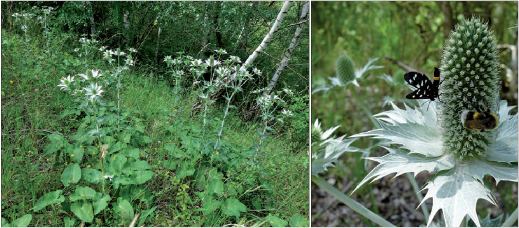
Abb. 25 und 26: Eryngium giganteum. Halde Blösien, 03.07.2016

liegt an der N-Seite der Halde bei Blösien (4637-324), an der sich an vier Stellen Bestände von insgesamt über 100 Exemplaren entwickelt haben.