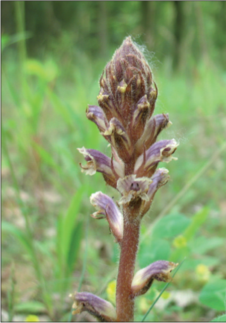
Abb. 29: Orobanche minor auf Trifolium repens -Ansaat. Zwischen Höhennölsen und Theißen, 11.06.2016

wird über die Bastardfreudigkeit einiger Primelgruppen geschrieben: „Bastarde sind innerhalb der Untergattungen Vernales und Auricula zahlreich ... Wo zwei Arten nebeneinander wachsen, wird man in der Mehrzahl der Fälle auch ihre Bastarde finden können... In der Mehrzahl sind die Hybriden unfruchtbar, können aber trotzdem in verschiedenen Formen auftreten... Mehrere Arten bilden fruchtbare Bastarde, die dann durch Aufspaltung und Rückkreuzung einen großen Formenreichtum erzeugen und gewöhnlich alle Übergangsformen von der einen Art zur anderen enthalten (gleitende Reihen).“