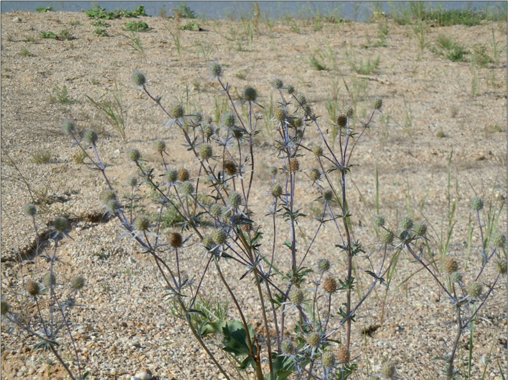
Abb. 27: Eryngium planum. Innenkippe Geiseltalsee bei Mücheln, 12.08.2012