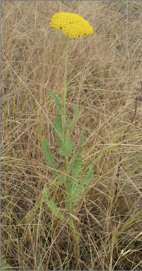
Abb. 18: Achillea filipendulina. Wansleben, 24.07.2013