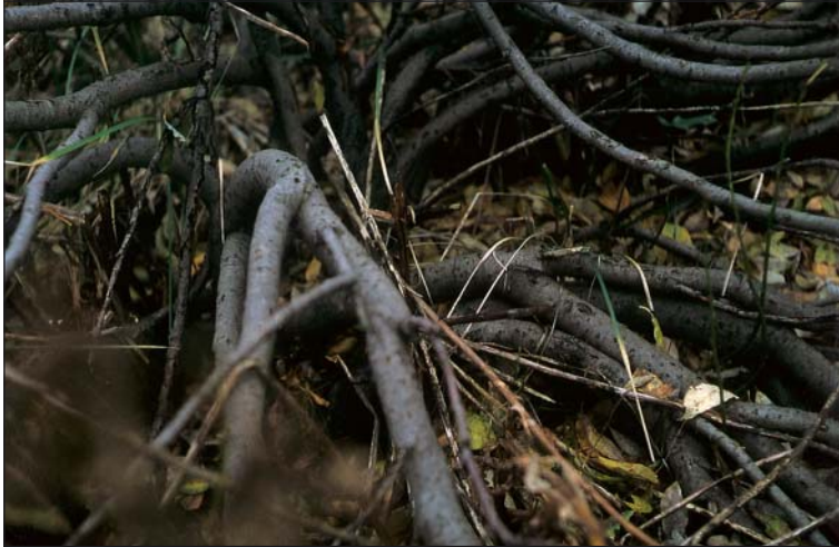
Abb. 2: Verzweigung und Dicke der Äste der Salix bicolor am Richt-funkturm.