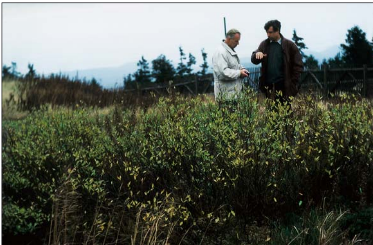
Abb. 3: Größenvergleich der Salix bicolor am Richtfunkturm (Brocken).