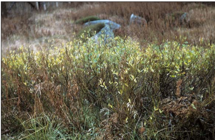
Abb. 4: Wuchsform der Salix bicolor am Richt-funkturm (Brocken).