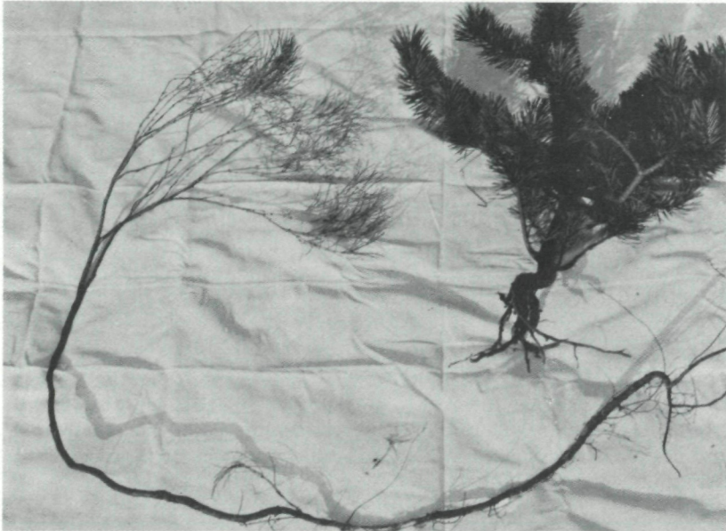
Abb. 9: Genista radiata - und Pinus mugho -Strauch vom selben Standort. Typisch sind Hakenbildung und langes Wurzelsystem bei Genista radiata .

mugho -Bestände können die Samen von Genista radiata infolge der sauren Nadelstreu und wegen der Beschattung nicht mehr keimen. pH-Messungen des Bodens (in aqua destillata) im Wurzelbereich von Kugelginster und Legföhre ergaben keine nennenswerten Unterschiede.