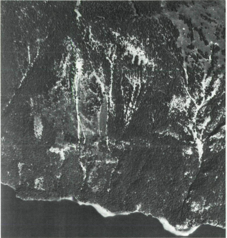
Abb. 2: Luftbild*) vom Standort des Cytisantho-Ostryetum WRABER 1961 am Weißensee (Kärnten). Die unbewaldete Fläche ist von 2 Schotterrinnen durchzogen. Oberer Bildbereich: Standort des Cytis-Ostr. Subass. v. Saponaria ocymoides , unterhalb der gegen den See abfallenden Felswände: Standort des Cyt.-Ostr. Subass. von Fraxinus ornus .

Die größten Niederschlagsmengen fallen im Juni und im Juli, in diesen beiden Monaten herrschen auch die höchsten Durchschnittstemperaturen.