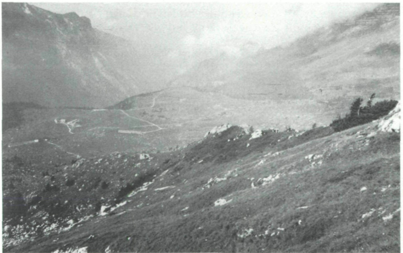
Abb. 8: Lawinengang mit Seslerio-Semperviretum Subass. v. Daphne striata (unterhalb Foronon del Buinz, 2531 m). Genista radiata -Bestände sind mit der Blaugras-halde verzahnt. Ein kleiner Pinus mugho -Bestand (Bildmitte, rechts) kann sich nur in einer Mulde auf dem Rücken (winterliche Schneebedeckung!) halten.

Werden Standorte, die sowohl Pinus mugho als auch Genista radiata geeignete Lebensbedingungen bieten können (beim Vorhandensein winterlicher Schneebedeckung), zuerst von Pinus mugho besiedelt, kann Genista radiata lediglich außerhalb der Legföhren aufkommen und bildet um diese Bestände herum bisweilen typische Säume unterschiedlicher Breite (1–6 m) und Wuchshöhe (0,5–1,2 m) (Abb. 9). Innerhalb der Pinus