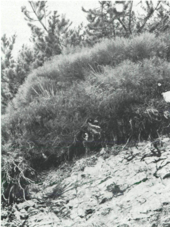
Abb. 10 Genista radiata -Saum, der einem Pinus mugho -Bestand vorgelagert ist.

Betonica alopecuroides Asperula longiflora Galium aristatum Buphthalmum salicifolium Lilium martagon