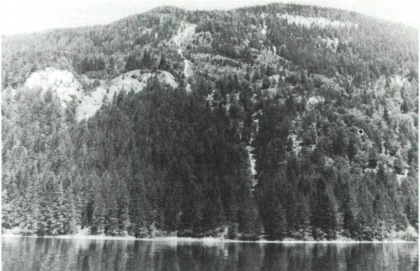
Abb. 1: Standort des Cytisantho-Ostryetum WRABER 1961 oberhalb der „Kleinen Steinwände“ am Weißensee (Kärnten).

Der Stammesdurchmesser von Ostrya carpinifolia wird über dem flachgründigen Boden kaum stärker als 15 cm (gemessen in Brusthöhe), die Wuchshöhe von 6 m wird selten überschritten.