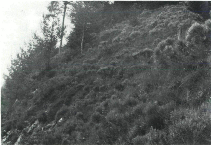
Abb. 4: Das Cytis.-Ostr. Subass. v. Saponaria ocymoides vom Weißensee. Nach einem Waldbrand konnte sich Genista radiata auf dieser Fläche stark ausbreiten.

In den Jahren 1949–1960 wurde mehrmals versucht, die Brandfläche aufzuforsten: Dazu wurde den Besitzern das Saatgut (Föhren-, Lärchen-, Fichten-, Birken- und Grünerlensamen) von der Forstbehörde kostenlos zur Verfügung gestellt. Diese und andere Aufforstungs- und Kultivierungsversuche sind an den meisten Stellen der Brandfläche fehlgeschlagen. Erst als sich der Kugelginster durch Anflug aus der Umgebung von selbst eingestellt hat, waren die Voraussetzungen für einen natürlichen Erosionsschutz gegeben. Als Pflanze, die trockene, kalkreiche und auch offene Böden warmer S-Lagen bei genügender Luftfeuchtigkeit bevorzugt besiedelt, konnte sich Genista radiata zusammen mit anderen heliophilen Pflanzen rasch auf der ganzen ehemaligen Brandfläche ausbreiten (Abb. 4) und