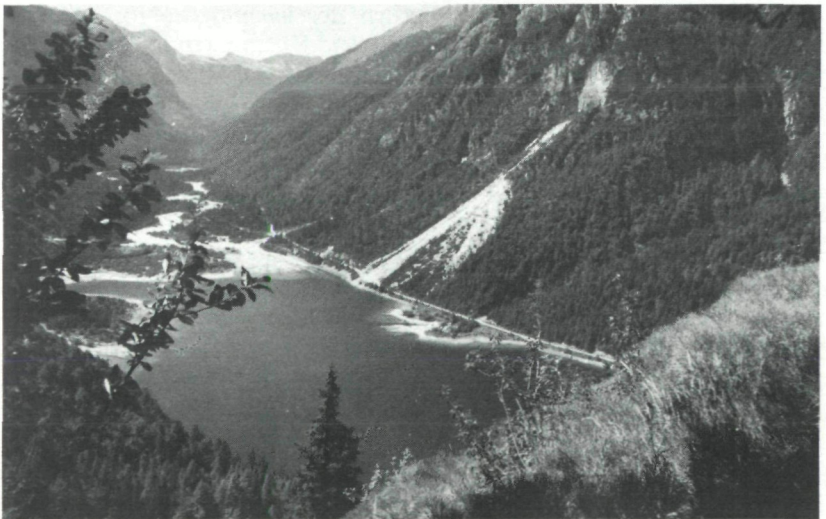
Abb. 5: Blick von den Genista radiata -Heiden (Cytis.-Ostr. Subass. v. Thesium bavarum ) oberhalb des Predil-Passes gegen Raibler See (Lago di Predil), Seebachtal (V. Rio d. Lago) und Nevea-Paß (P. di Nevea)

Unsere Subass. ist besonders auf mittelgründigem Boden über Karbonatgestein anzutreffen. Die bei WRABER l. c. namengebende Hopfenbuche