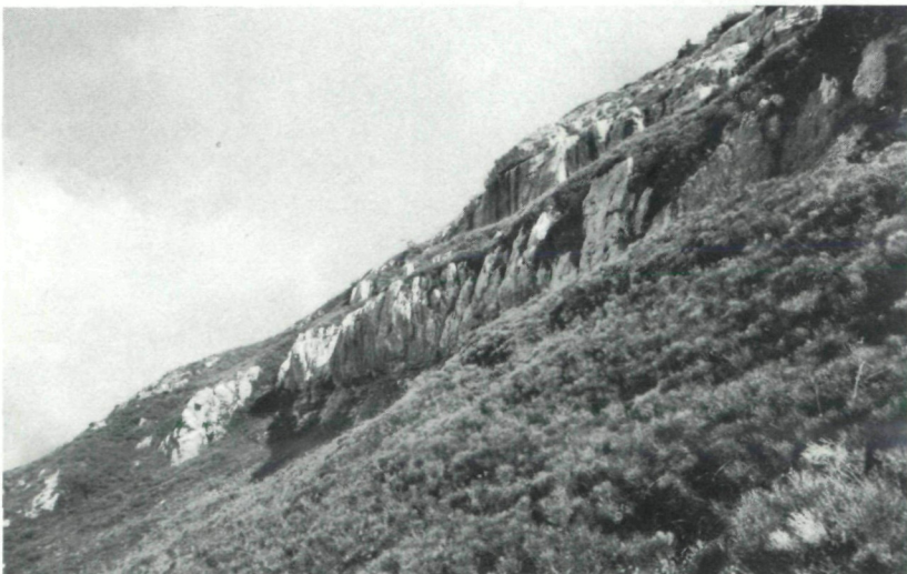
Abb. 6: Genista radiata -Heide verzahnt mit einer Blaugrashalde (Seslerio-Semperviretum Subass. v. Daphne striata ) oberhalb der Casera Larice (P. di Nevea).

Trotz des reichlichen Vorkommens von Sesleria varia können unsere Aufnahmen keinem Seslerio-Semperviretum angeschlossen werden, sondern müssen einem artenarmen Festucetum calvae zugeordnet werden.