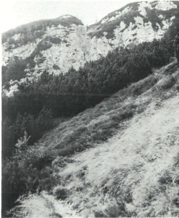
Abb. 7: Festucetum calvae Subass. v. Mercurialis perennis unterhalb der Velika Dnina. Deutliche Zonierung: Festucetum calvae (rechts unten), Genista radiata -Saum mit Festuca calva (Bildmitte), dahinter Pinus mugho -Bestand.

Gegenüber den zuvor beschriebenen Subass. ist das Festucetum calvae Subass. v. Mercurialis perennis klimatisch begünstigt. Die Gesellschaft besiedelt windgeschützte, wärmebegünstigte (Reflexion an den steilen Felswänden) und im Winter meist schneebedeckte S-Hänge (20° Neigung). Für den günstigen Wärmehaushalt unserer Subass. spricht das Vorkommen von Viola collina in Höhenlagen um 1600 m s.m.