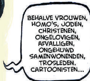
Illustratie Ruben L. Oppenheimer