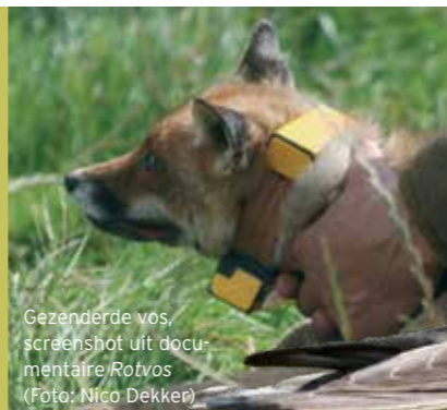
Gezenderde vos, screenshot uit documentaire Rotvos