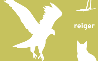
buizerd en bruine kiekendief