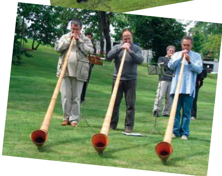
Trio de cor des alpes et orchestre créés pour l'occasion afin d'accompagner les chants d'enfants.