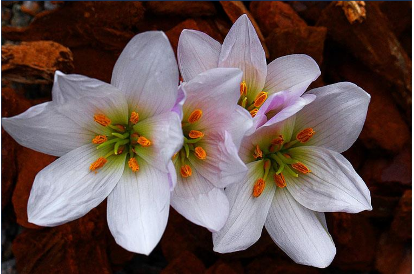
Colchicum szovitsii , pink form by S.G.