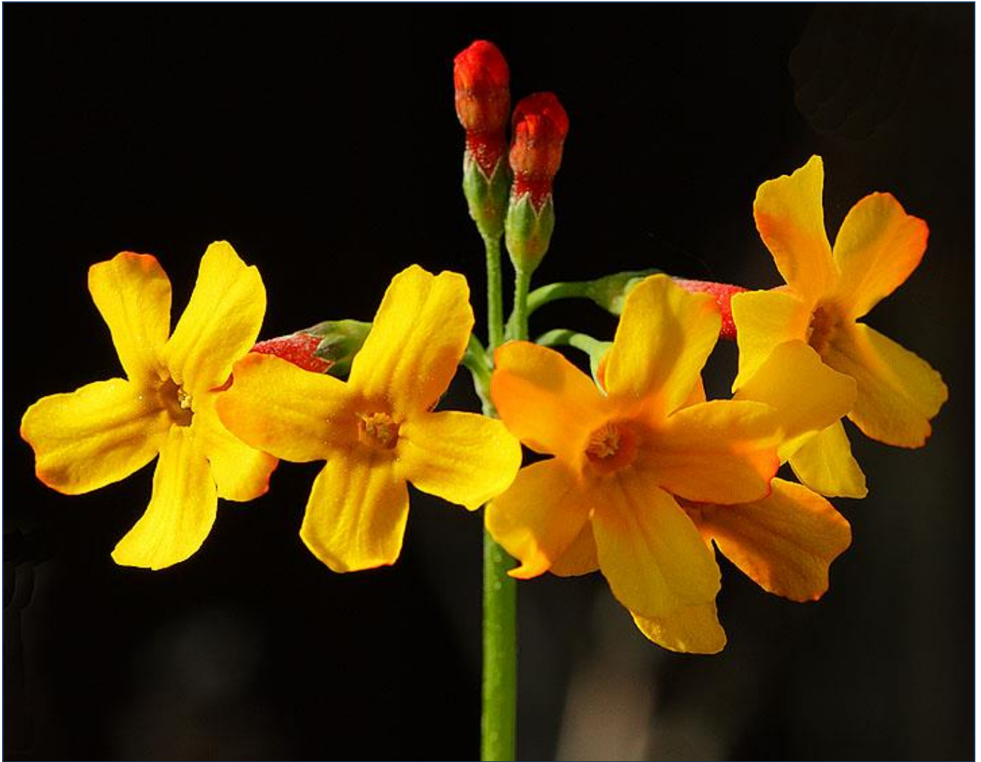
Primula cockburniana by S.G.