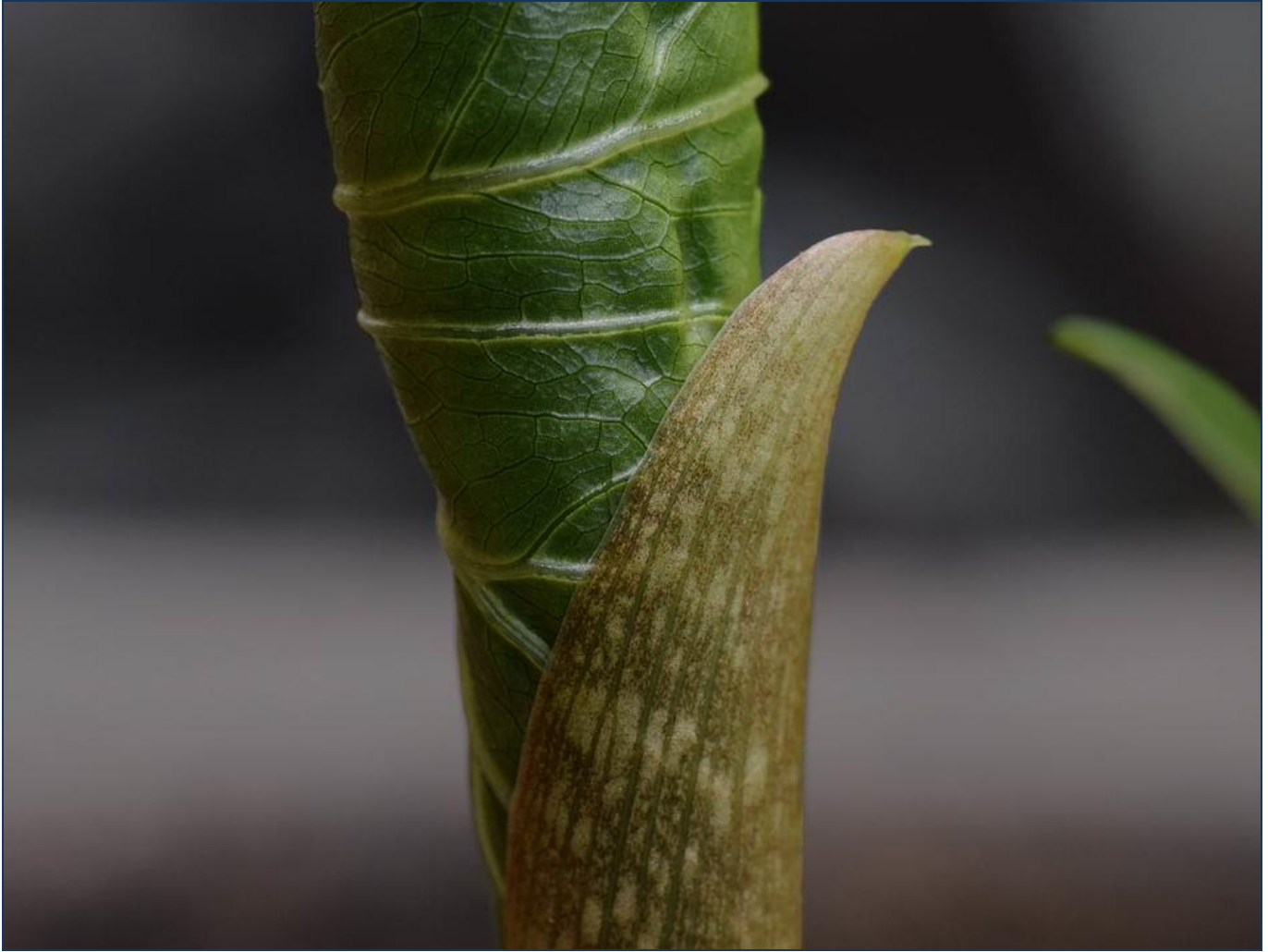
Arisaema fargesii