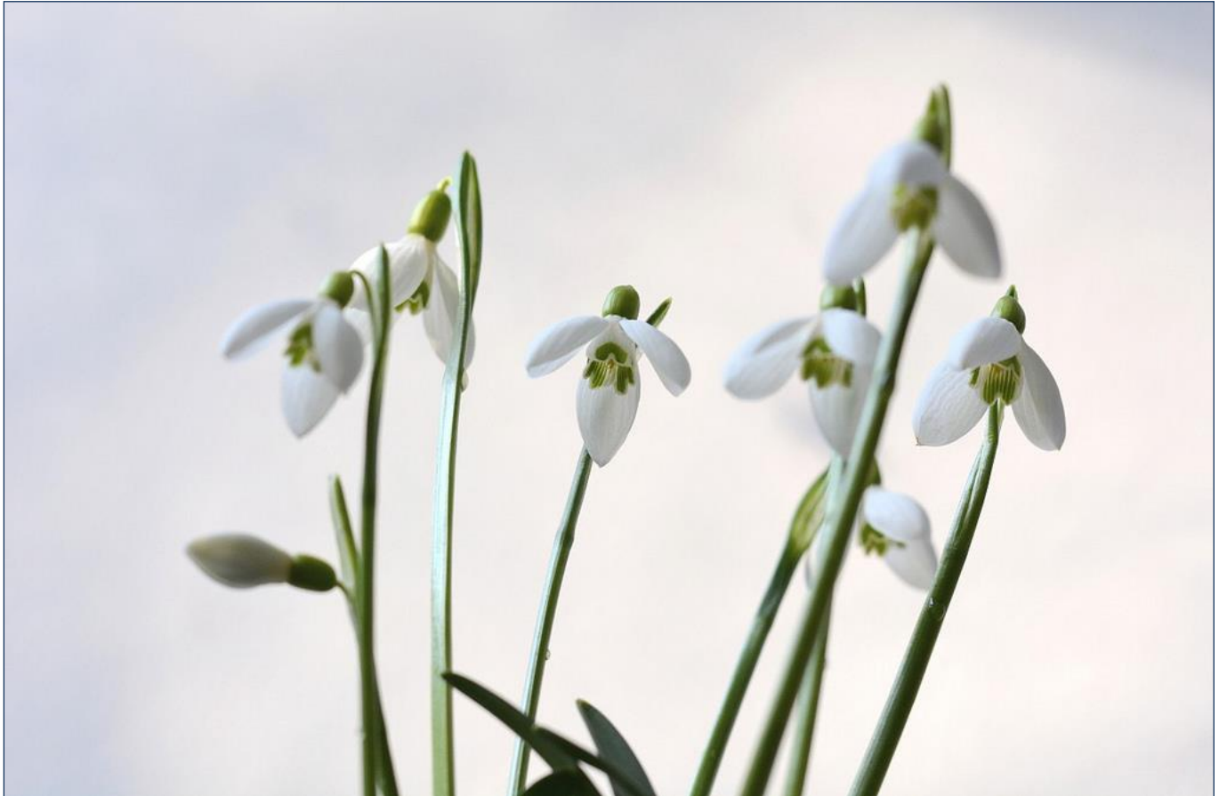
Galanthus rizehensis by J. S.