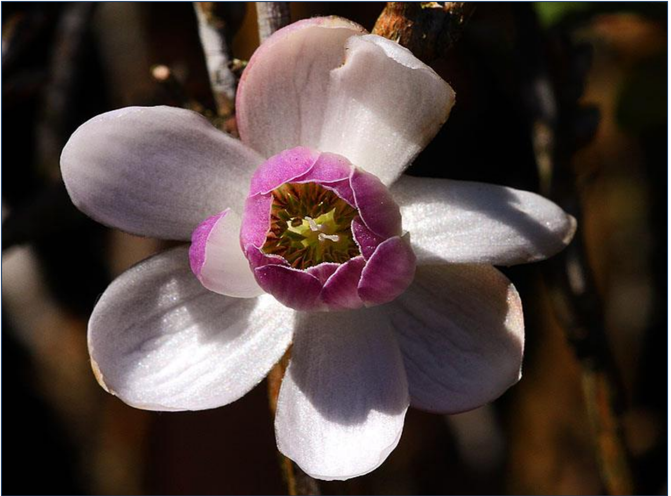
Anemonopsis macrophylla by S.G.