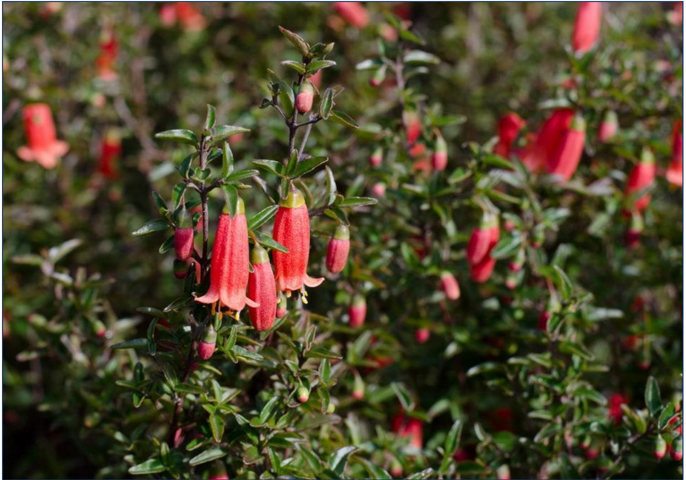
Correa pulchella by J. S.