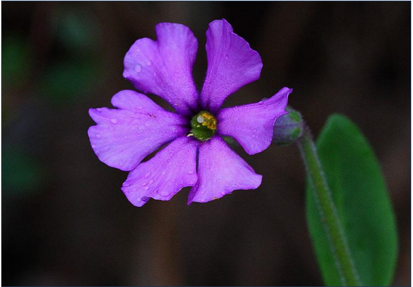
Omphalogramma vincaeflora by S.G.