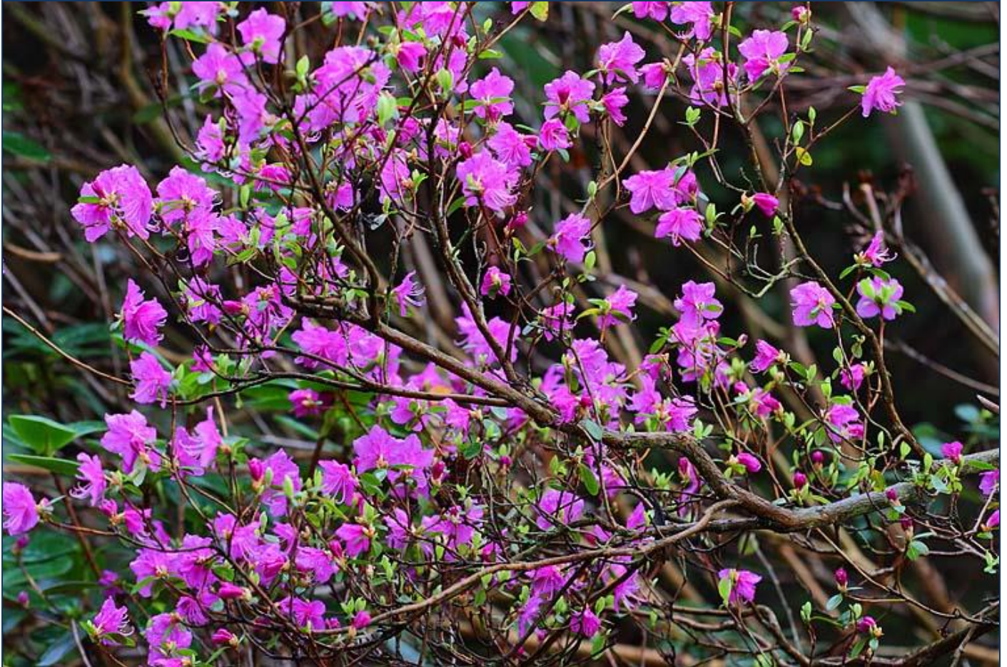
Rhododendron dauricum by S.G.