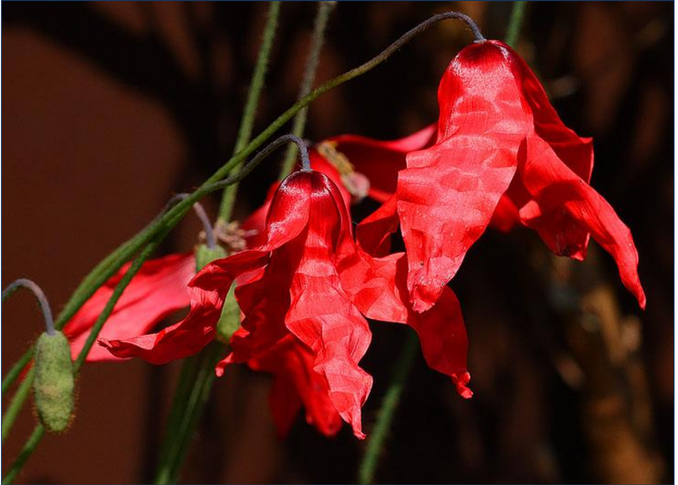
Meconopsis punicea by S.G.