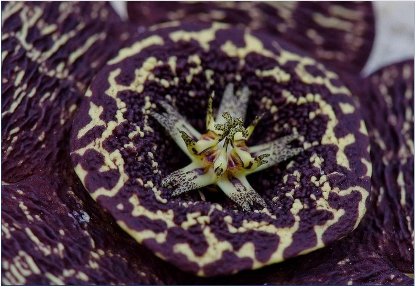
Stapelia variegata by J. S.