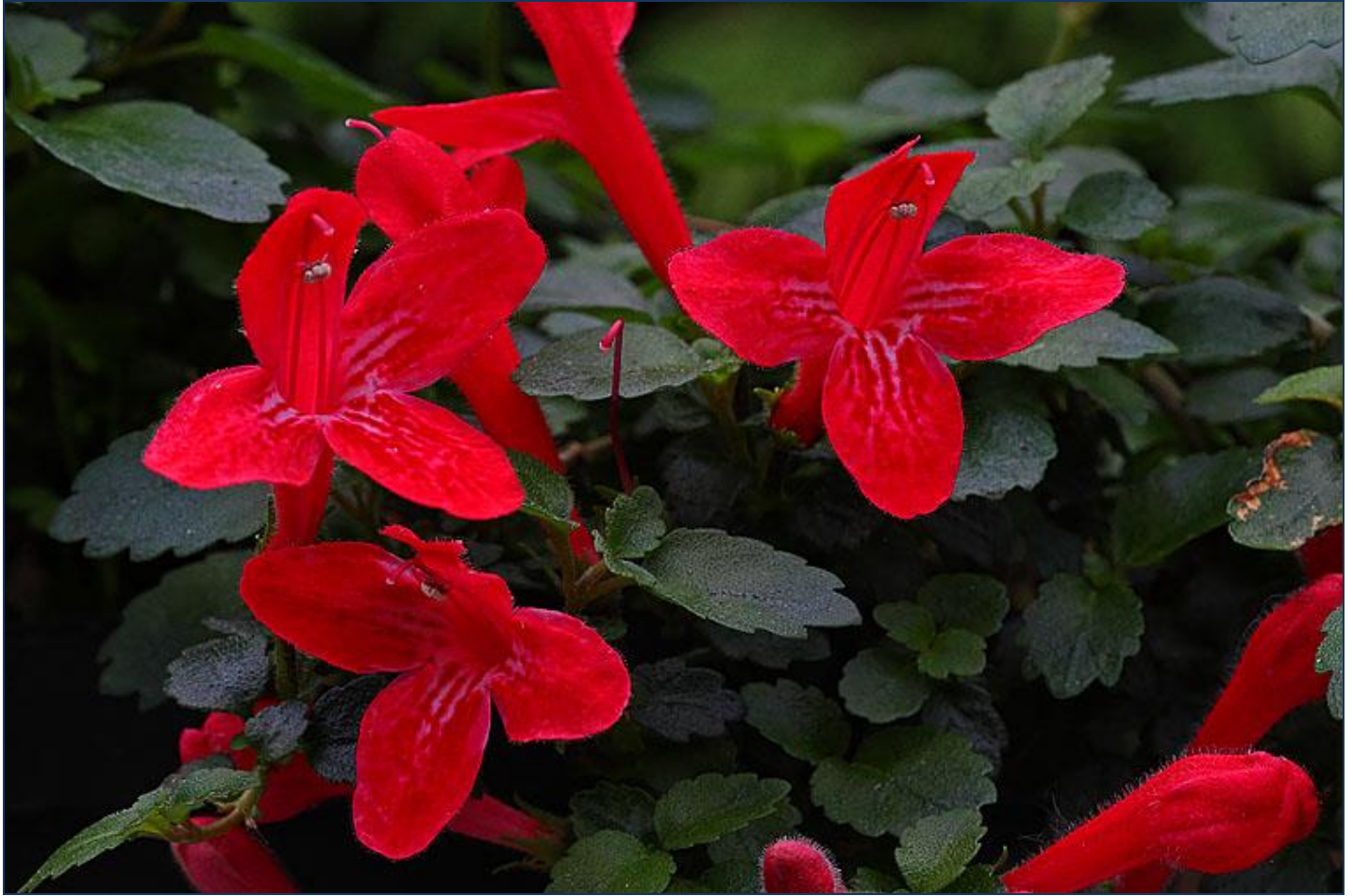
Asteranthera ovata by S.G.