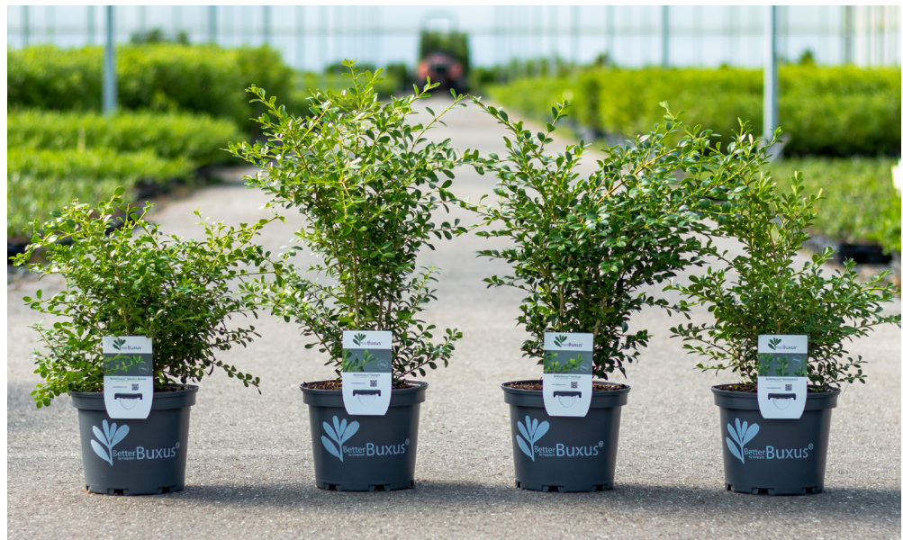
Från vänster: BABYLON BEAUTY, SKYLIGHT, HERITAGE OCH RENAISSANCE.

I en av projektets första faser inokulerade man buxbomssot på de nya korsningarna och sjukdomsbenägna plantorkunde selekterades bort. Därefter gjordes urval beroende på bladfärg, härdighet och växtsätt. 2019 var de första plantorna redo för försäljning.