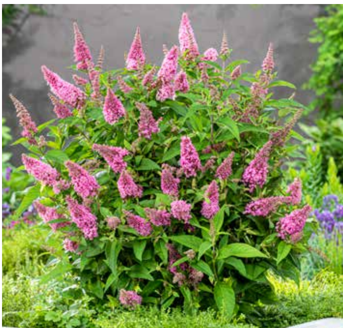
Buddleja davidii LITTLE PINK ('Botex 001' PBR-AF ) Butterfly Candy-Serien

Blommar med vita blomsterkolvar under hela säsongen. Grågrönt bladverk. Busken är låg, välförgrenad och kompakt. Trivs bäst i sol på näringsrik, väl-dränerad jord. För den lilla trädgården, i kruka eller med perenner i en blandad rabatt. Bi-och fjärilsväxt. Höjd och bredd ca 80 cm. Zon 1-2 (3).