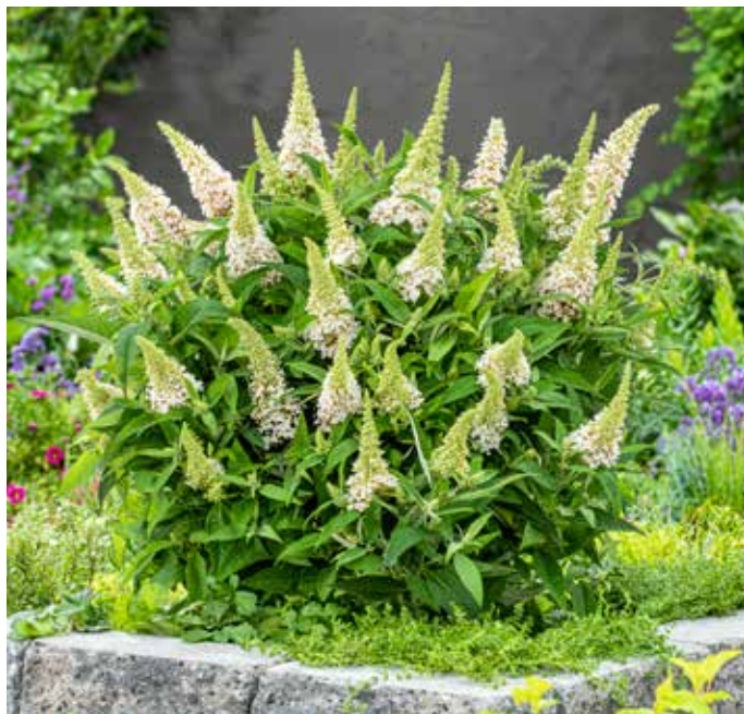
Buddleja davidii LITTLE WHITE ('Botex 003' PBR-AF )

Blomvillig buske som producerar blomsterkolvar hela säsongen. Sorten LILA SWEETHEART får lila blommor med gult öga och de har en lätt, söt doft. Grågrönt bladverk. Trivs bäst i full sol och med näringsrik jord. Passar i rabatt eller kruka. Bi-och fjärilsväxt. Höjd och bredd ca 80 cm. Zon 1-2 (3).