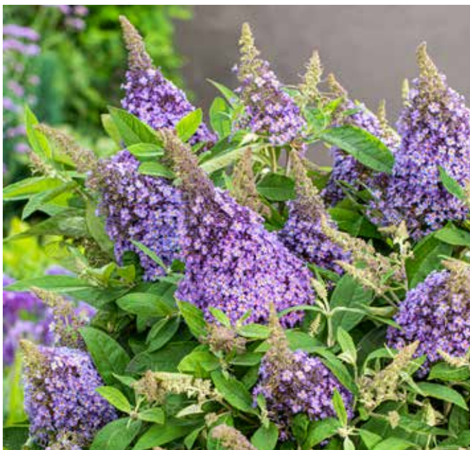
Buddleja davidii LILA SWEETHEART ('Botex 002' PBR-AF )