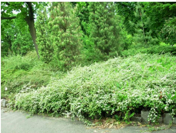
Рис. 6. C. x suecicus 'Skogholm' – кизильник шведський 'Skogholm', куртина

C. x suecicus 'Skogholm' – кизильник шведський 'Skogholm'. (Syn. C. dammeri Mrs. Kennedy) (рис. 6). Культivar відібрано у 1941 р. з розсади C. dammeri В. Geransson з Hindby поблизу Мalmö у Швеції. Наші рослини (вх. № 69903) вирощені з насіння ботанічного саду м. Ессен у Німеччині у 1987 р. Вічнозелений, гіллястий, дуже розгалужений кущ заввишки 0,3-0,6 м. Гілки довгі (2-3 м), розлогі, місцями ароматні, які опускаються, торкаються землі і вкорінюються. Листки