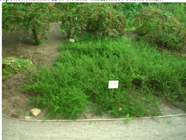
Рис. 2. C. congestus – кизильник щільний, куртина

но-еліптичні, обернено-яйцеподібно видовжені, 4-13×3-8 мм; на верхівці заокруглені або виїмчасті, біля основи клиноподібні або широко клиноподібні; зверху гладенькі, блідо-зелені або зелені, тьмяні, зісподу світло-сіро-зелені, на тонких часто червонуватих черешках завдовжки 3-5 мм. Фертильні гілочки завдовжки 10-25 мм, облистнені чотирма листочками, на верхівці з 1 (2) квітками на квітконіжках завдовжки 3-7 мм. Віночок 9 мм у діаметрі. Пелюстки розпростерті, білі. Плоди приплюснuto-кулясті, 8-10 мм, малинові до вишневих, тьмяні. Кісточок 2 (3). Цвіте у травні, плодоносить у жовтні. У Ботанічному саду рослини зимують під листяним укриттям. В останні теплі зими їх не вкриваємо. Декоративні кущі, привабливі габітусом, забарвленням листків, поодинокими великими, яскравими плодами. Перспективний для схилів південної експозиції.