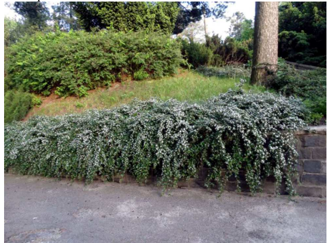
Рис. 4. C. x suecicus – кизильник шведський

1986 р. Є екземпляри, вирощені з живців Нікітського ботанічного саду та із насіння, зібраного у 1985 р. у Арборетумі м. Брно (Чехія). Вічнозелений, сланкий, не укорінливий. Утворює куртини заввишки 0,3-0,4 м, у старшому віці до 0,5 м, формує густий килим. Листки оберненоланцетні, 25-35×8-15 мм, зверху слабо зморшкуваті, зелені, зісподу світло-зелені, на черешках завдовжки 4 мм; восени незначна частина листків забарвлюється у жовтий колір. Квітки в рихлих пониклих щитках по 3-10. Віночок 5 (6) мм у діаметрі. Пелюстки розлогі, білі. Цвіте у червні 15-20 днів. Плоди кулясті, червоні, пізніше коричнювато-червоні, лискучі, потім тьмяні, 5-6 мм у діаметрі, кісточок 4-5. Плоди в пониклих щитках по 3-5 (7), зверху закриті листками, через що візуально плодоношення слабке, а знизу гілок – рясне та дуже рясне. Плоди зберігаються до літа. Утворює чудовий ґрунтовий килим, який декоративний упродовж року. Дуже поширений в озелененні країн Західної Європи.