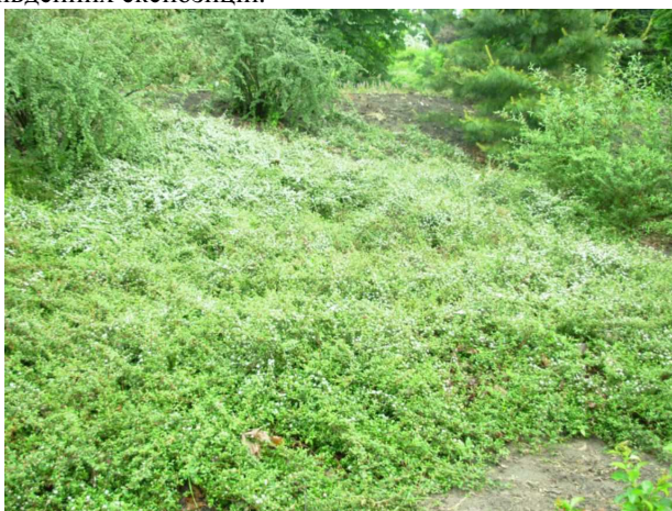
Рис. 5. C. x suecicus 'Coral Beauty' – кизильник шведський 'Прекрасний Корал', килим

C. x suecicus 'Coral Beauty' – кизильник шведський 'Прекрасний Корал' (Hoogendorn, 1967) (рис. 5). Наші рослини (вх. № 71312) вирощені з живців Нікітського ботанічного саду (1983). Вічнозелений сланкий кущ до 0,2-0,4 м заввишки з довгими пасмами елегантних гілок. Листки папірчасті, обернено-еліптичні, 18-20×7-10 мм, зверху темно-зелені, лискучі, зісподу світло-зелені. Квітки зібрані в щитках по 3-5 (7) на кінцях коротких гілочок завдовжки (5) 10-15 мм. Віночок 8-10 мм. Пелюстки розлогі, білі. Плоди кулясті, помаранчево-червоні, 5-9 мм у діаметрі. Цвіте у травні, плодоносить у жовтні. Холодостійкий. Під легким листяним укриттям перезимовує за I балом зимостійкості. Надзвичайно декоративний у період цвітіння. Незамінний для схилів південних експозицій.