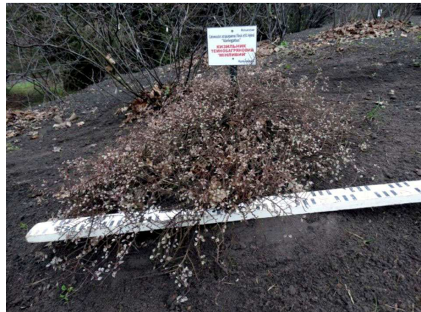
Рис. 1. C. atropurpureus 'Variegatus' – кизильник темно-багряний 'Строкатий'

C. atropurpureus 'Variegatus' – кизильник темно-багряний 'Строкатий' (Osborn K. H., 1916) (рис. 1). Живу рослину придбано у 2007 р. Листопадний, сланкий куш, заввишки до 0,3 м із хаотично розміщеними пагонами, які повертаючись по колу, утворюють невелику куртину. Листки світло-зелені, по краю з білою, а восени рожевою смужкою. Край листової пластинки іноді хвилястий. Віночок 3-5 мм у діаметрі, пелюстки темно-червоні з карміною цяточкою знизу, по краю зі світлою облямівкою, прямостоячо-увігнуті, злегка відкриті. Квіток мало, плоди дуже дрібні, 3-(5) мм у діаметрі, поодинокі. У Ботанічному саду зимує під укриттям. Насіння, здатного проростати, ще не отримували. Відомий у культурі як C. horizontalis 'Variegatus'. Як декоративну рослину у 1993 р. нагороджено Received RHS Award у Garden Merit.