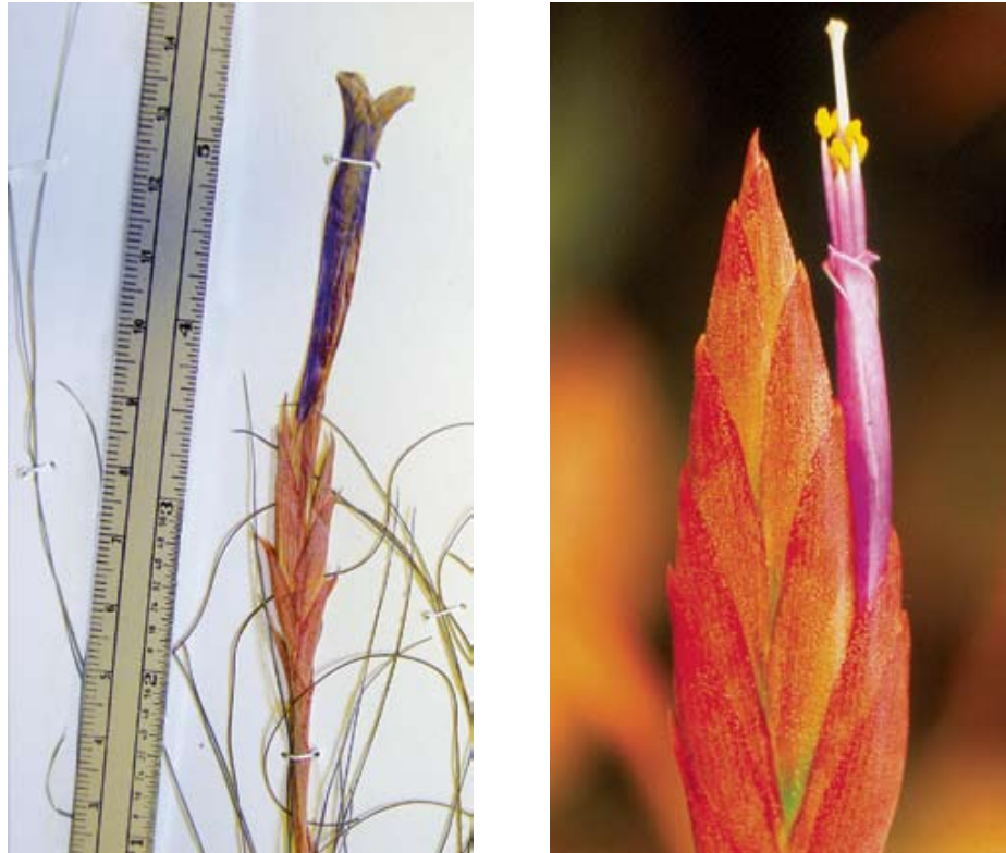
Fig. 2. A. Tillandsia chaetophylla Mez. (detalle del ejemplar: A. Salinas y E. Martínez 5980 (MEXU) B. Tillandsia sessemocinoi Espejo, López-Ferrari y Blanco (fotografía de la espiga correspondiente al espécimen: A. R. López-Ferrari et al. 2780).

espiga oblonga a oblongo-elíptica, aplanada, de 3.5 a 5.5 cm de largo por 1 a 1.3 cm de ancho; brácteas florales rosadas, oblongo-lanceoladas, de 2.2 a 2.5(2.7) cm de largo por 8 a 10 mm de ancho, más largas que los entrenudos, imbricadas, nervadas, ecarinadas, lepidotas, acuminadas y excurvadas en el ápice; flores dísticas, erectas, 3 a 4(5) por espiga, actinomorfas, subsésiles, formando una corola hipocraterimorfa; sépalos verdes, angosta y largamente lanceolados, de 3 a 3.2 cm de largo por 3.5 a 4 mm de ancho, nervados, glabros, con un amplio margen hialino, largamente atenuados a acuminados en el ápice, los dos posteriores carinados y connatos en casi toda su longitud; pétalos libres, de color violeta, oblongo-espátulados, de 6.5 a 6.8 cm de largo por 6 a 7 mm de ancho, redondeados a agudos y excurvados en el