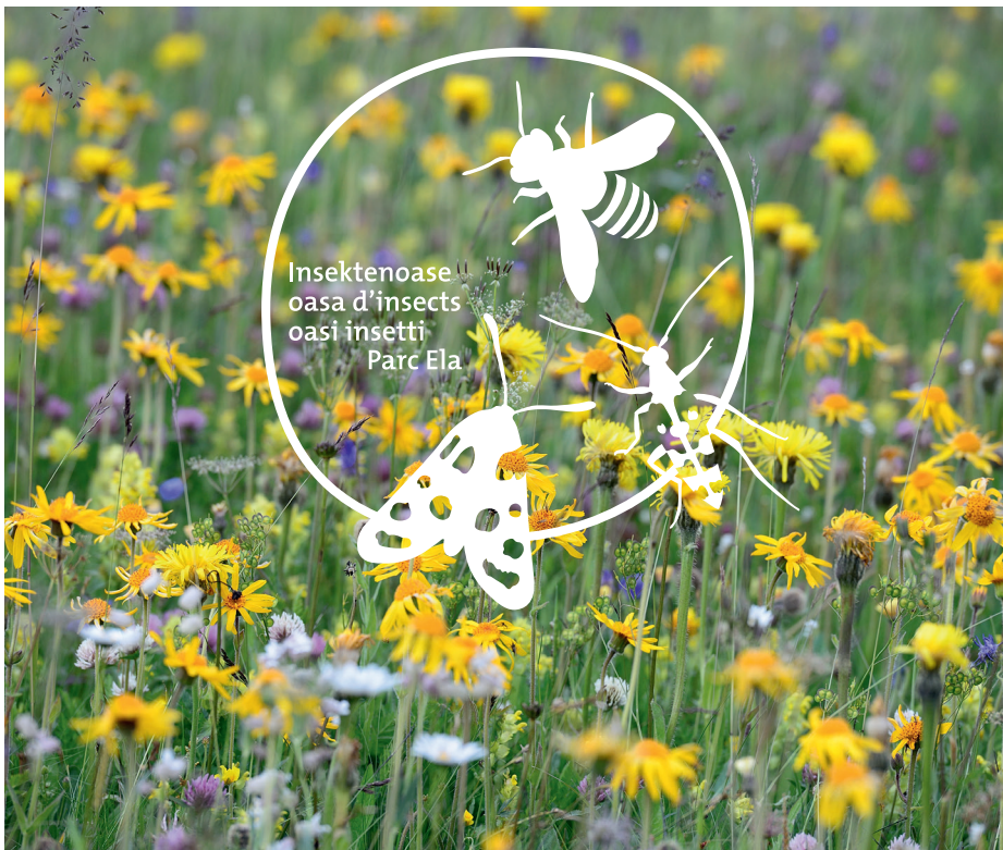
Blumenwiese Alp Flix