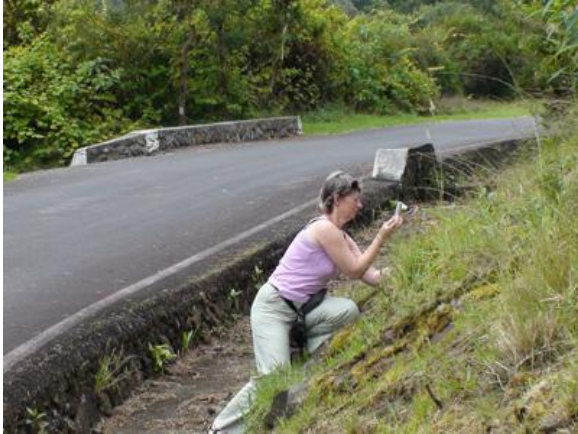
Martine op fotojacht