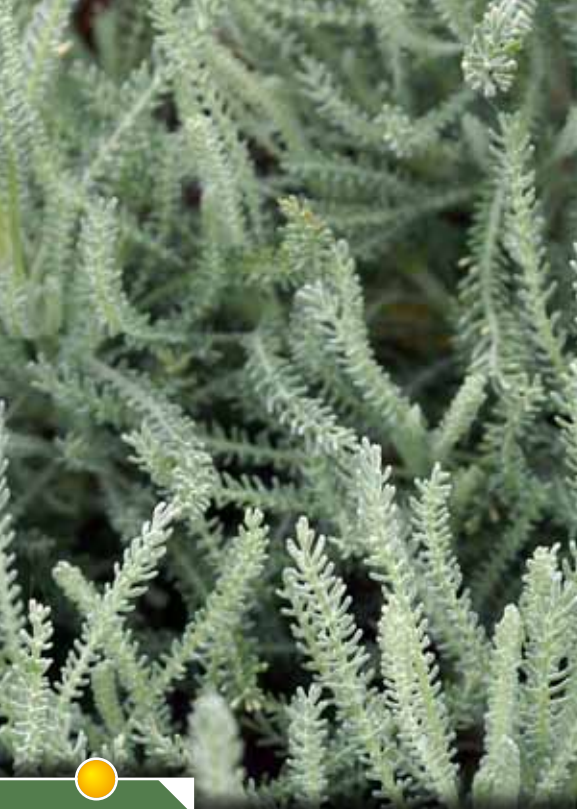
Hauteur 40 cm, floraison de juillet à août. SANTOLINA chamaecyparissus 'Noemie'