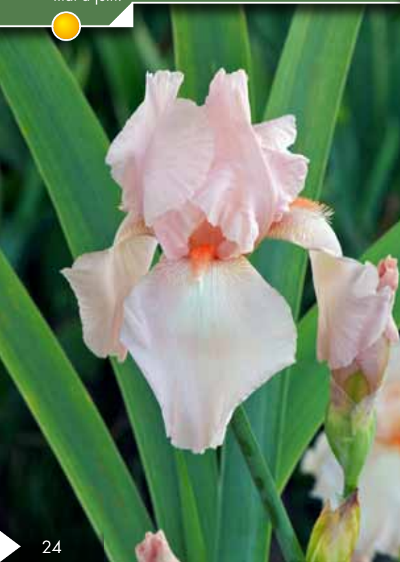
Hauteur 90 cm, floraison de mai à juin. IRIS b-e 'Flaming'