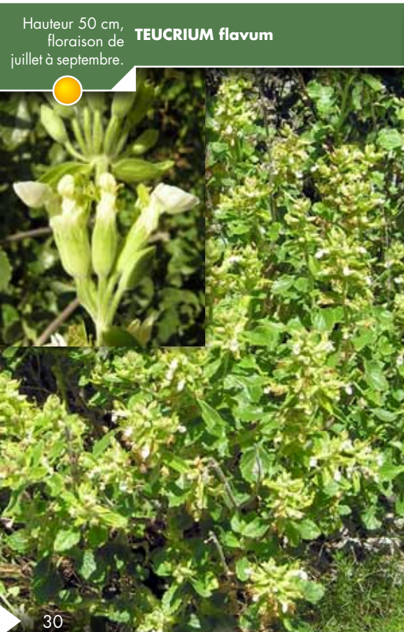
Hauteur 50 cm, floraison de juillet à septembre. TEUCRIUM flavum