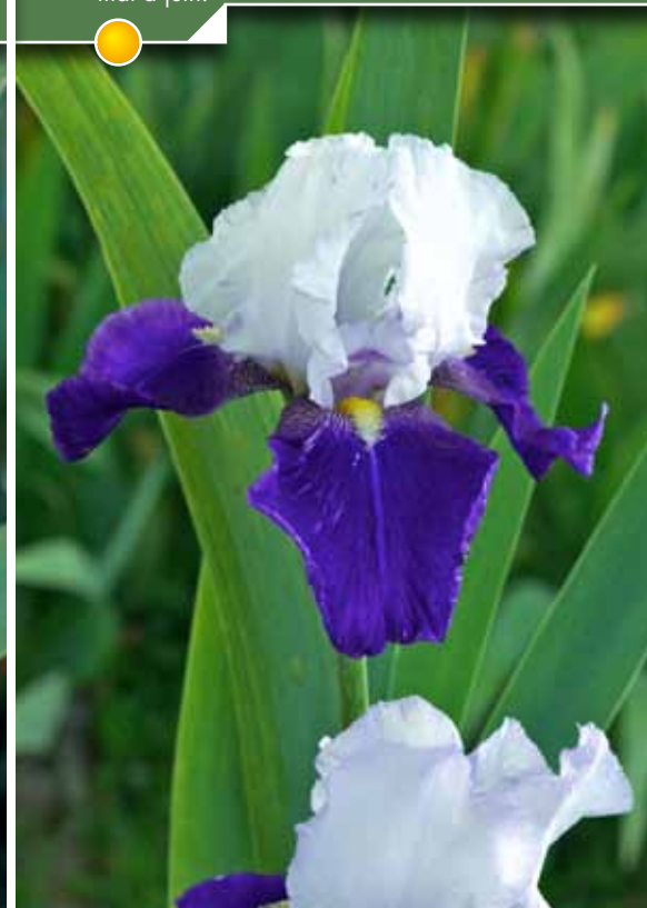
Hauteur 90 cm, floraison de mai à juin. IRIS b-e 'Ola Kala'