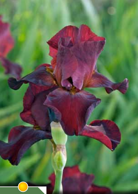
Hauteur 85 cm, floraison de mai à juin. IRIS b-e 'Sultan's Palace'