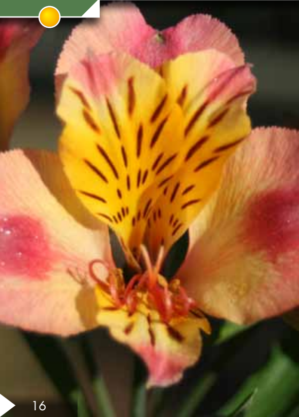
Hauteur 70 cm, floraison de mai à octobre. ALSTROEMERIA 'Fougeré'