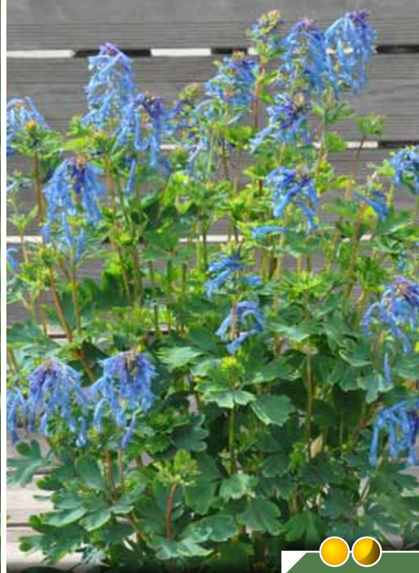
CORYDALIS 'Blue Line'® Hauteur 40 cm, floraison de mai à octobre.

Hauteur 30 cm, floraison de mai à juillet.