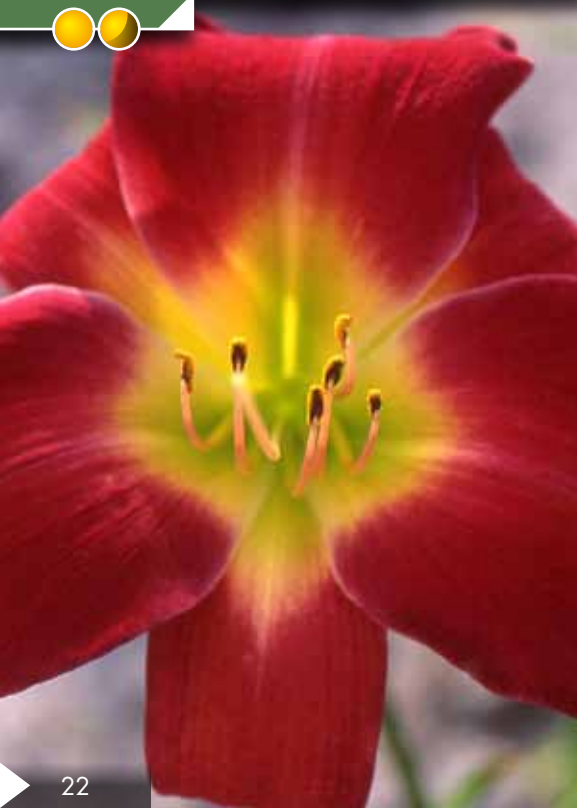
Hauteur 80 cm, floraison de juillet à août. HEMEROCALLIS 'Exalted Ruler'