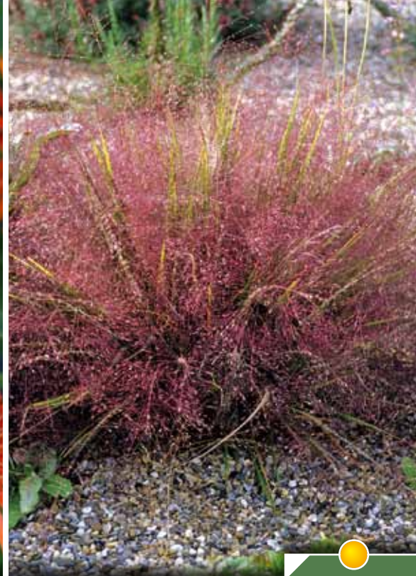
ERAGROSTIS spectabilis Hauteur 50 cm floraison de août à octobre.