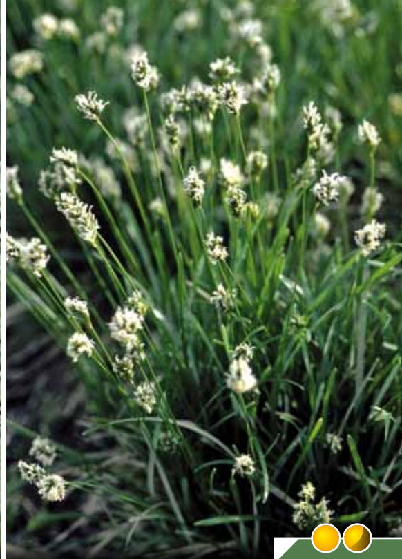
Hauteur 30 cm, floraison de avril à juillet. SESLERIA albicans