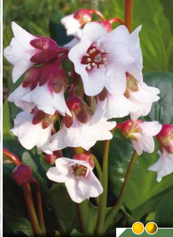
Hauteur 40 cm, floraison de avril à mai. BERGENIA 'Harzkristall'