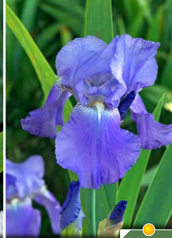
Hauteur 80 cm, floraison de mai à juin. IRIS b-e 'Harbor Blue'