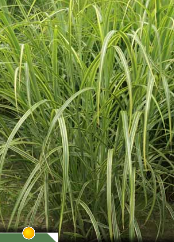
Hauteur 200 cm, floraison de sept. à nov. MISCANTHUS sinensis var. condensatus 'Luc-André Lepage'