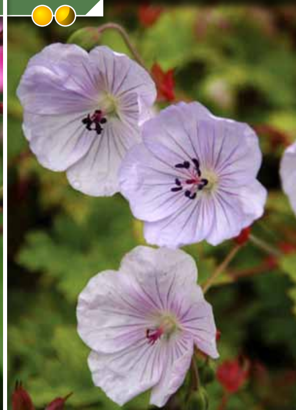
Hauteur 30 cm, floraison de juin à octobre. GERANIUM 'Orkney Pink'