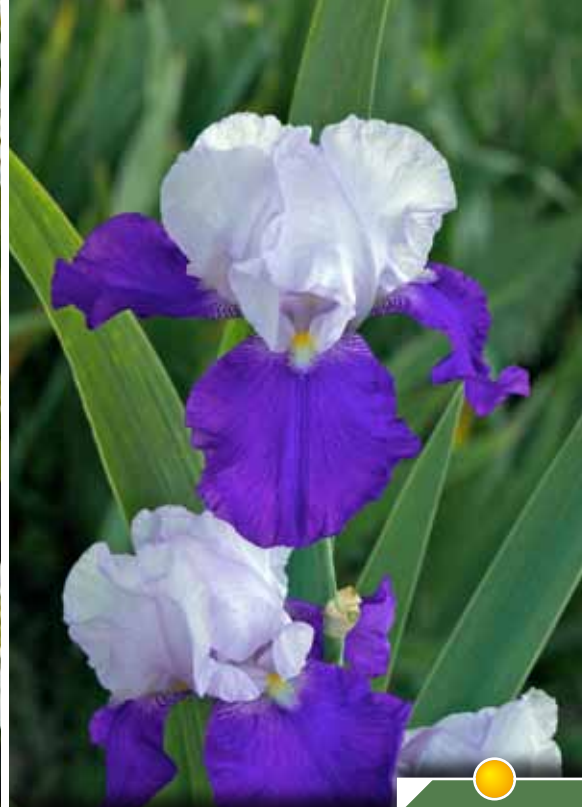
Hauteur 90 cm, floraison de mai à juin. IRIS b-e 'Arpège'