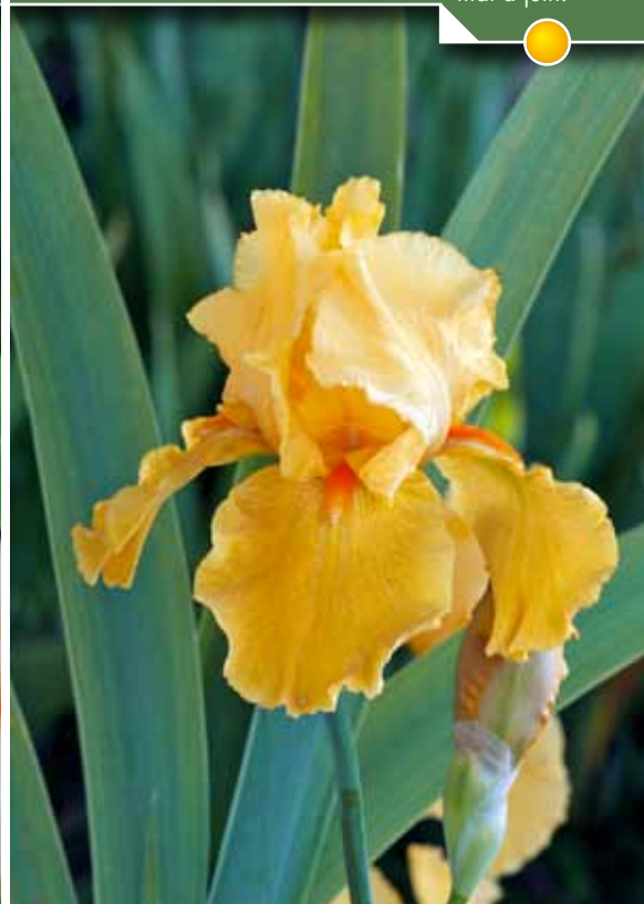
Hauteur 85 cm, floraison de mai à juin. IRIS b-e 'Night Edition'