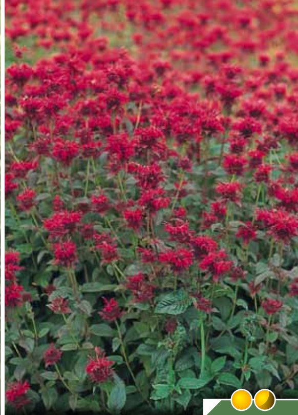
Hauteur 100 cm, floraison de juin à septembre. MONARDA 'Panorama'