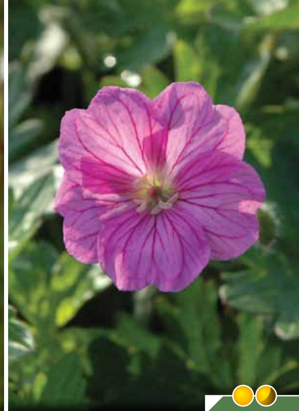
Hauteur 60 cm, floraison de juin à septembre. GERANIUM 'Blushing Turtle' ®