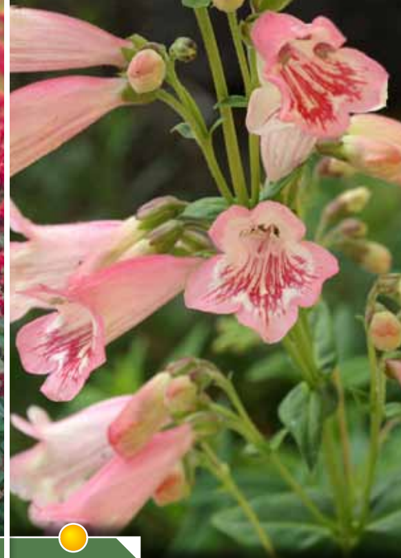
Hauteur 80 cm, floraison de juin à octobre. PENSTEMON 'Hewell Pink Bedder'