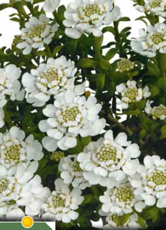
Hauteur 25 cm floraison de février à mai. IBERIS 'Candy Ice'