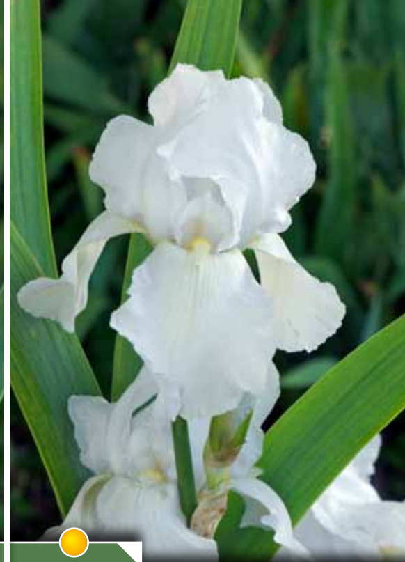
Hauteur 75 cm, floraison de mai à juin. IRIS b-e 'Glacier'