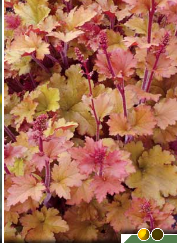
Hauteur 35 cm, floraison de juin à juillet. HEUCHERA 'Marmalade'®