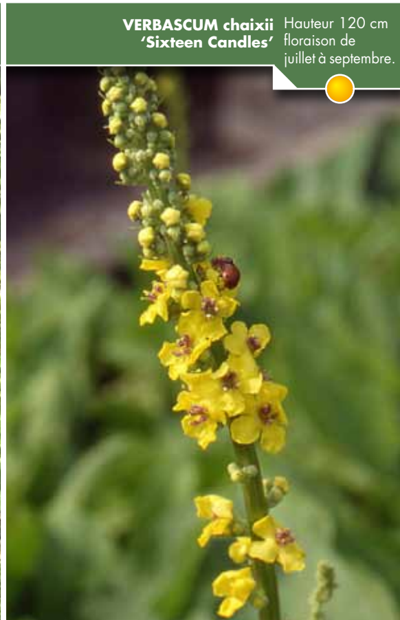
Hauteur 120 cm, floraison de juillet à septembre. VERBASCUM chaixii 'Sixteen Candles'