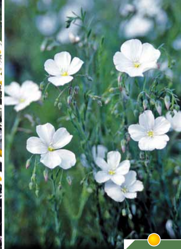
Hauteur 25 cm, floraison de juin à août. LINUM perenne 'Diamant'