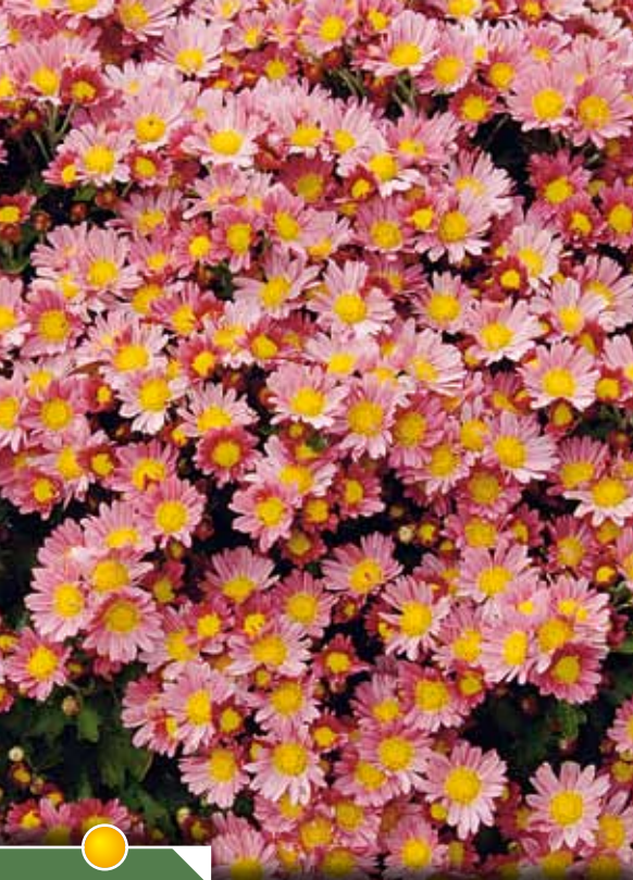
Hauteur 50 cm, floraison de octobre à nov. AJANIA bellania 'Bengo Rosa'