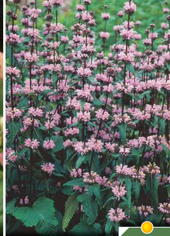
Hauteur 130 cm, floraison de mai à juin. PHLOMIS tuberosa 'Amazone'