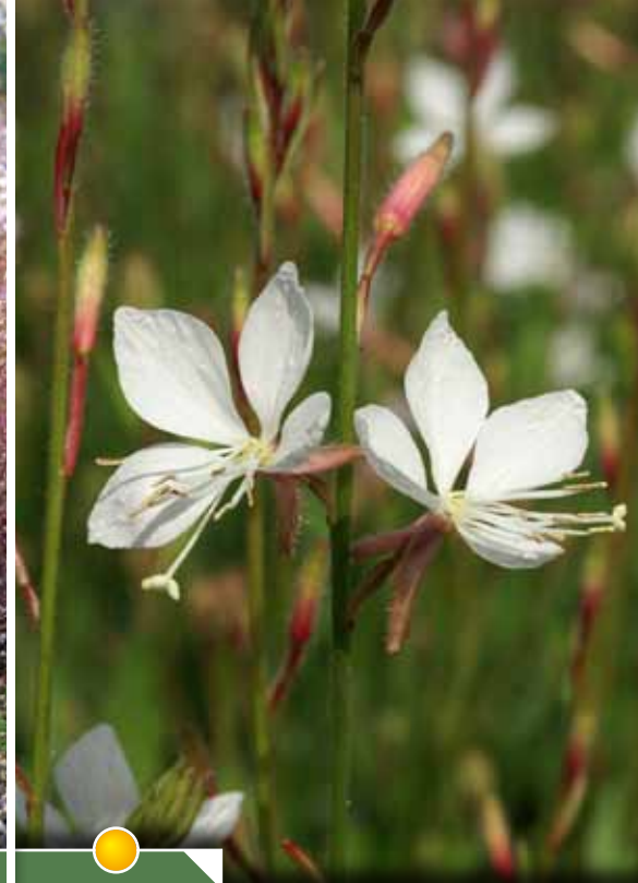
Hauteur 60 cm, floraison de juin à octobre. GAURA lindheimeri 'Snowstorm'