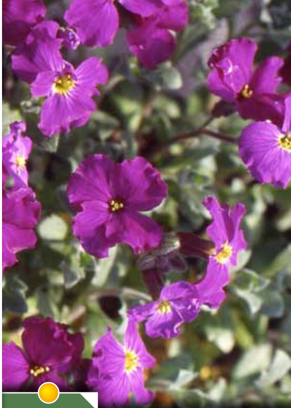
Hauteur 10 cm, floraison de avril à mai. AUBRIETA 'Red Dyke'