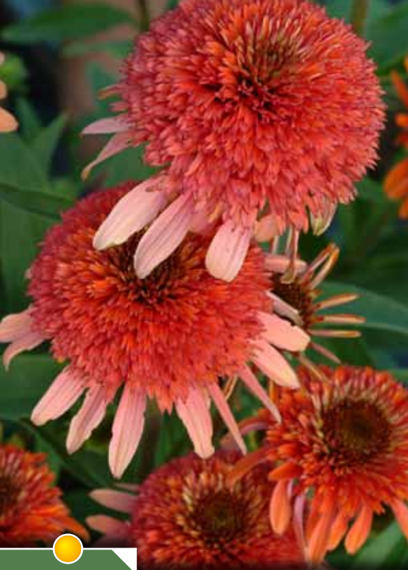
Hauteur 80 cm floraison de juillet à octobre. ECHINACEA 'Coral Reef' ®