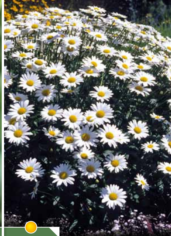
Hauteur 80 cm, floraison de mai à septembre. LEUCANTHEMUM superbum 'Brightside'