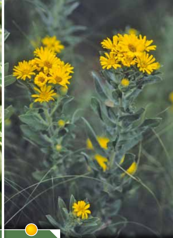
Hauteur 40 cm, floraison de juin à octobre. HETEROTHECA villosa