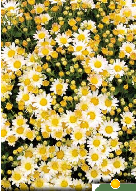
Hauteur 50 cm, floraison de octobre à nov. AJANIA bellania 'Bengo Weiss'