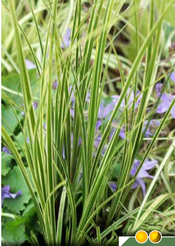
CAREX brunnea 'Variegata' Hauteur 40 cm.