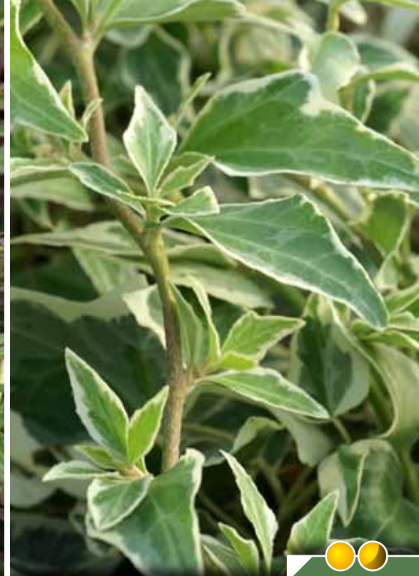
Hauteur 30 cm. HEDERA helix 'Little Diamond'