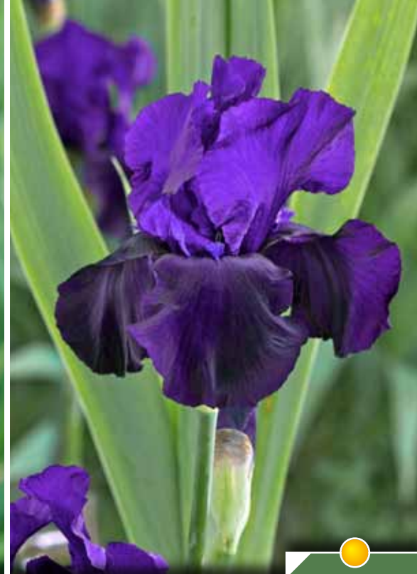
Hauteur 90 cm, floraison de mai à juin. IRIS b-e 'Tuxedo'