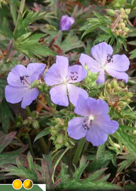
Hauteur 40 cm, floraison de juin à juillet. GERANIUM pratense 'New Dimension'