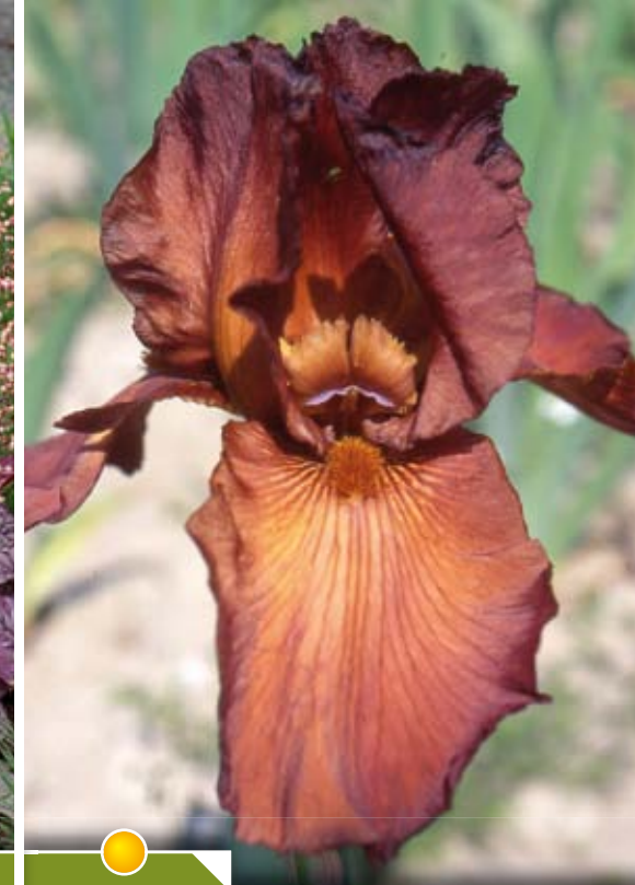
Hauteur 85 cm, floraison de mai à juin. IRIS b-e 'Dutch Chocolate'