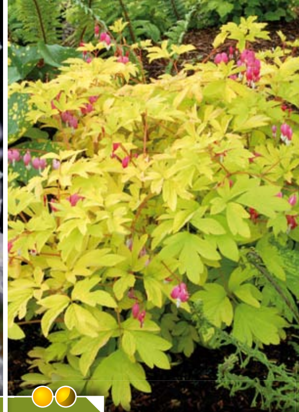
Hauteur 60 cm, floraison de avril à juin. DICENTRA spectabilis 'Gold Heart'