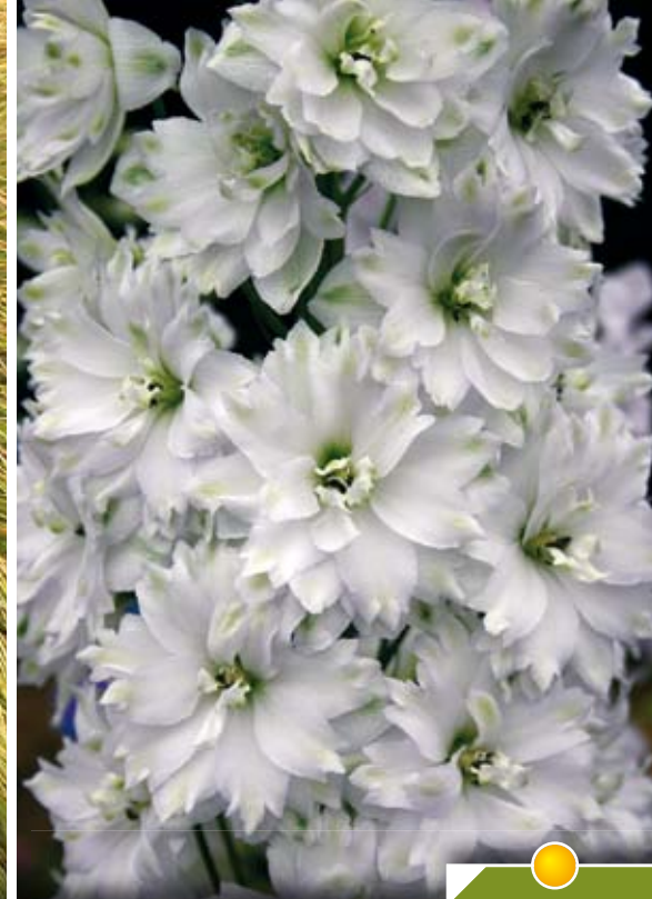
DELPHINIUM 'Double Innocence' (Elatum Group) Hauteur 150 cm, floraison de juin à septembre.