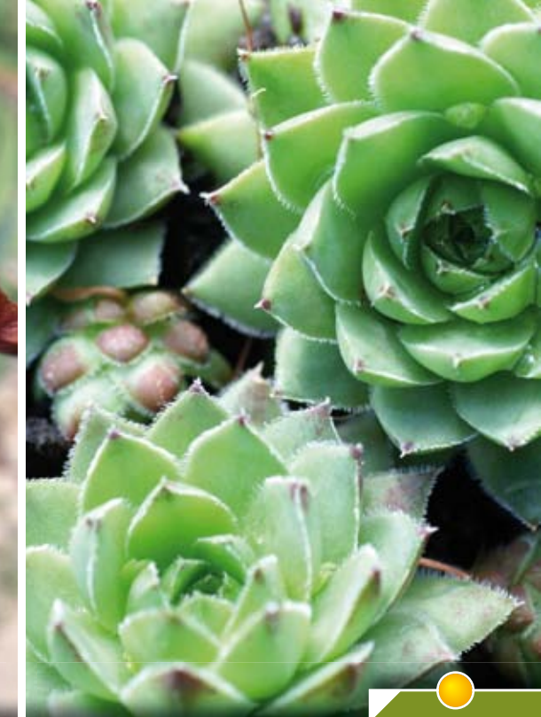
Hauteur 15 cm, floraison de juin à juillet. JOVIBARBA hirta 'Purpurea'