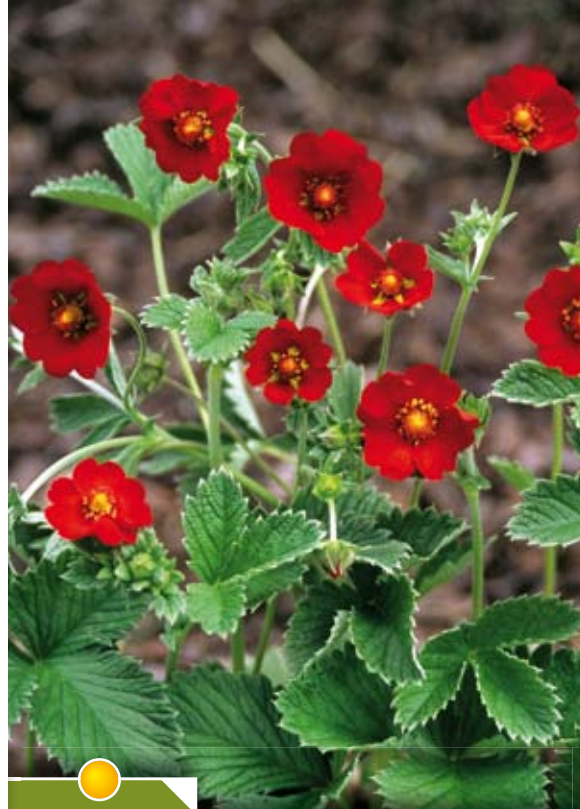
Hauteur 40 cm, floraison de juin à août. POTENTILLA atrosanguinea 'Scarlett Starlight'