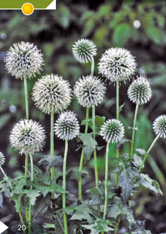
ECHINOPS bannaticus 'Star Frost'

Hauteur 150 cm floraison de juillet à octobre.