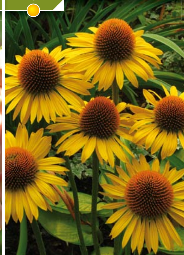
Hauteur 100 cm, floraison de juillet à septembre. ECHINACEA purpurea 'Happy Star'