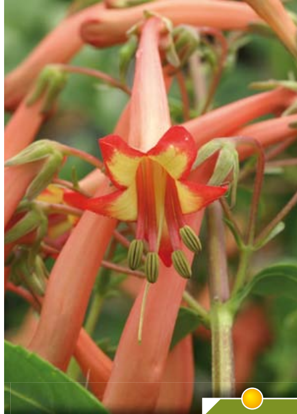
Hauteur 80 cm, floraison de juin à octobre. PHYGELIUS Somerford Funfair Orange