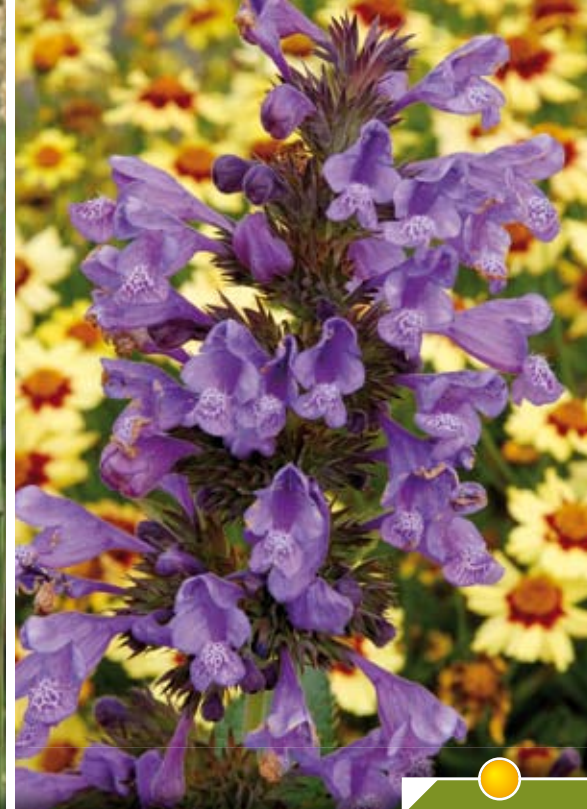
Hauteur 80 cm, floraison de juin à septembre. NEPETA 'Blue Dragon' ®