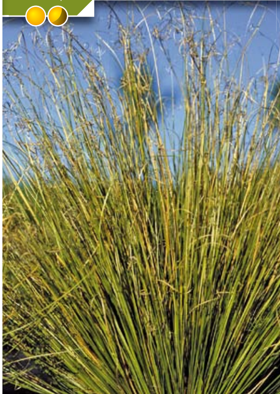
Hauteur 50 cm, floraison de juillet à septembre. CAREX dispacea