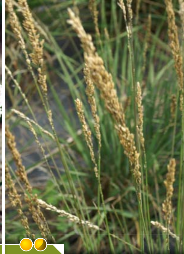
Hauteur 50 cm, floraison de juillet à octobre. MOLINIA caerulea 'Overdam'