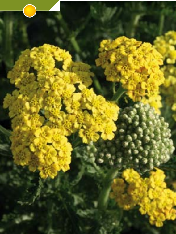
Hauteur 70 cm, ACHILLEA floraison de juin à août.