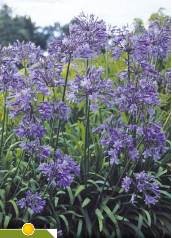
Hauteur 80 cm, floraison de juillet à août. AGAPANTHUS 'Headbourne Hybrids'