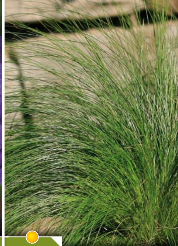
Hauteur 30 cm, floraison de juin à juillet. STIPA trichotoma 'Palomino'