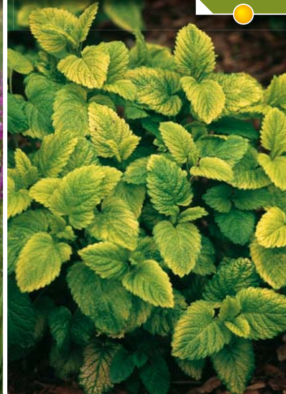
Hauteur 50 cm, floraison de juin à septembre. ORIGANUM vulgare 'Hot and Spicy'