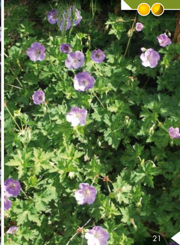
GERANIUM 'Azure Rush'

Hauteur 50 cm, floraison de mai à novembre.