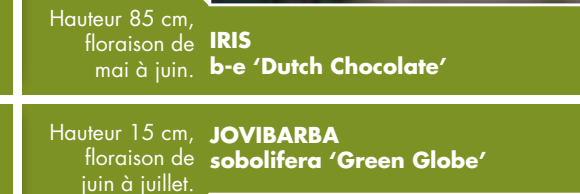
Hauteur 15 cm, floraison de juin à juillet. JOVIBARBA sobolifera 'Green Globe'