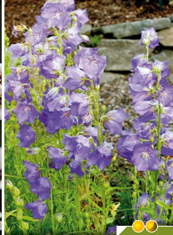
Hauteur 50 cm, floraison de juin à août. CAMPANULA 'Blue Eyed Blonde'