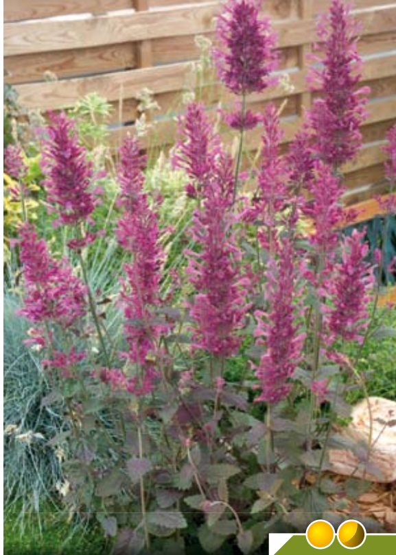
Hauteur 40 cm, floraison de juin à septembre. AGASTACHE 'Boléro'