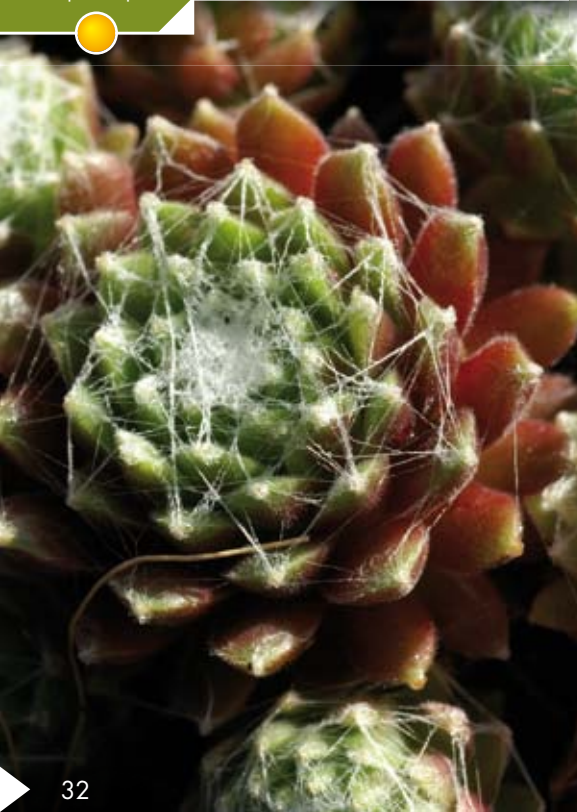
Hauteur 10 cm, floraison de juin à juillet. SEMPERVIVUM 'Topaz'