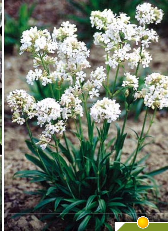
Hauteur 50 cm, floraison de mai à juillet. LYCHNIS viscaria 'Alba'