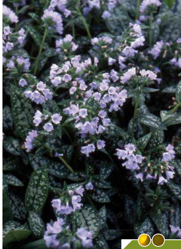
Hauteur 20 cm, floraison de mars à mai. PULMONARIA 'Ocupol'