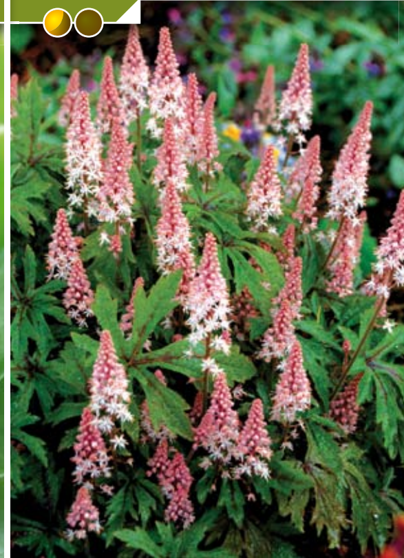
Hauteur 35 cm, floraison de mai à juin. TIARELLA 'Sugar and Spice'