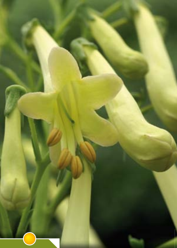
Hauteur 80 cm, floraison de juin à octobre. PHYGELIUS Somerford Funfair Cream