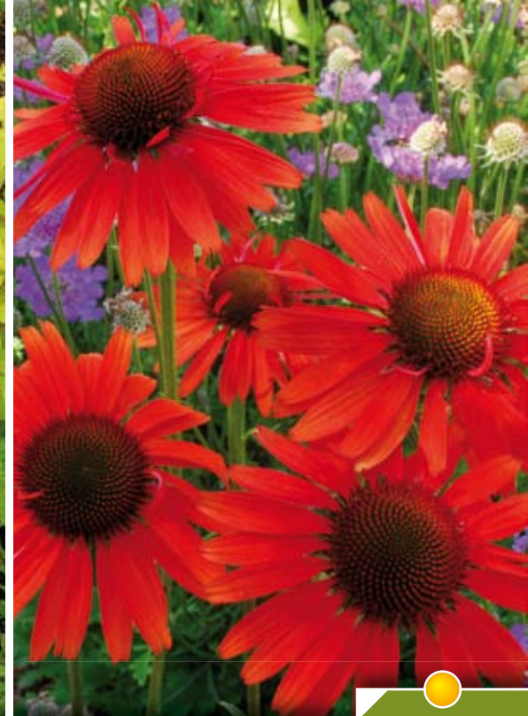
Hauteur 80 cm, floraison de juillet à septembre. ECHINACEA 'Hot Lava' ®