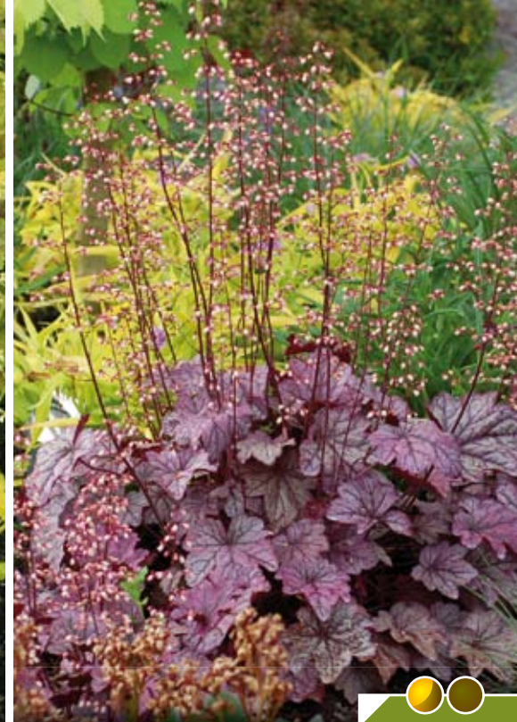
Hauteur 40 cm, floraison de mai à août. HEUCHERA 'Plum Royale' ®