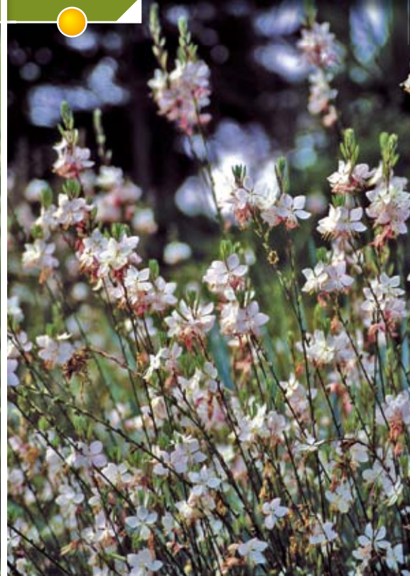
GAURA lindheimeri 'Summer Breeze'

Hauteur 50 cm, floraison de mai à novembre.