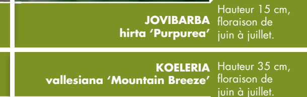
Hauteur 35 cm, floraison de juin à juillet. KOELERIA vallesiana 'Mountain Breeze'