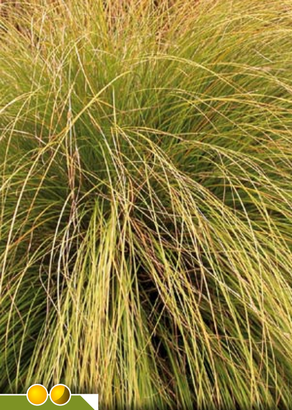
Hauteur 40 cm, floraison de juillet à août. CAREX flagellifera 'Kiwi'