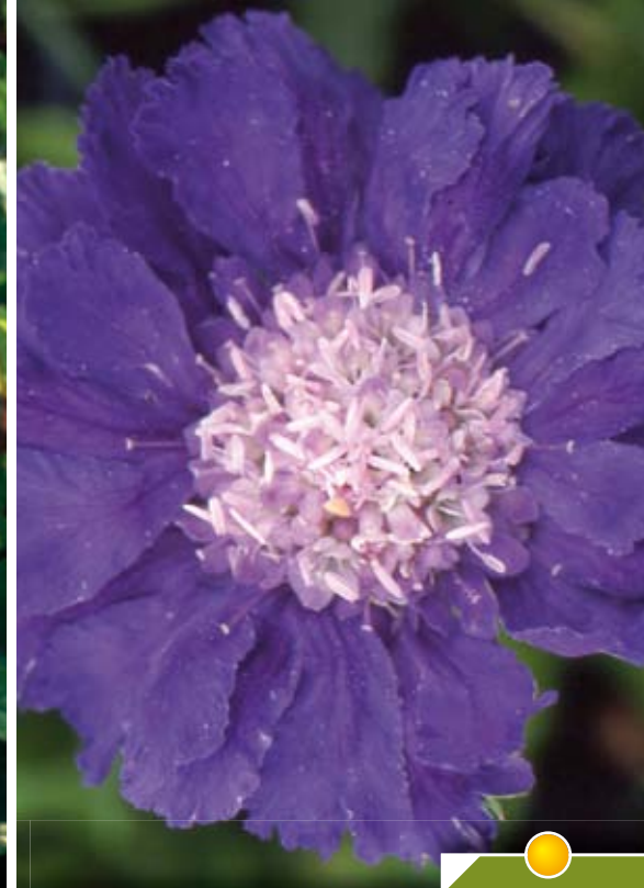
Hauteur 70 cm, floraison de juin à septembre. SCABIOSA caucasica 'Stäfa'