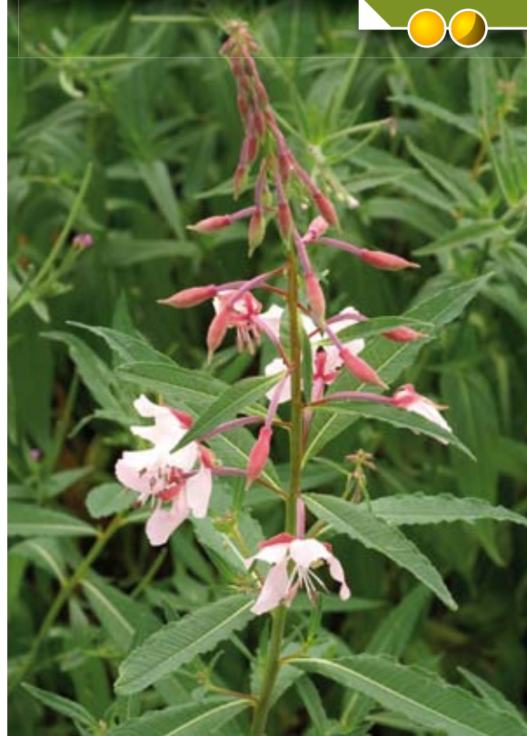
EPILOBIUM angustifolium 'Stahl Rose'

Hauteur 120 cm, floraison de juin à octobre.