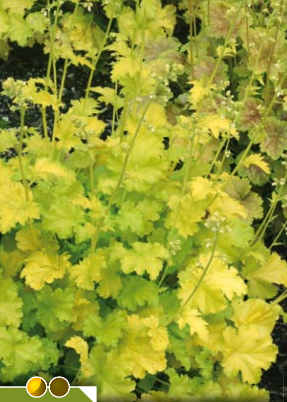
Hauteur 40 cm floraison de mai à juin. HEUCHERA 'Lime Rickey' ®