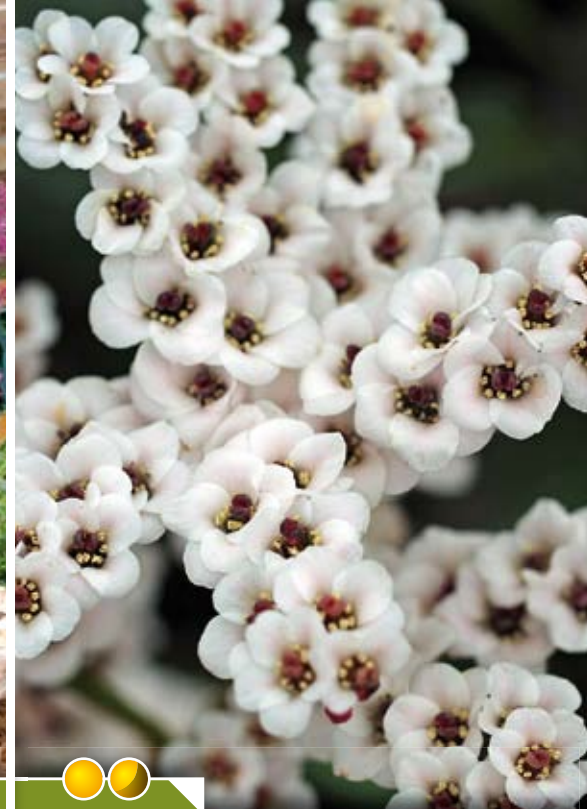
Hauteur 30 cm, floraison de mars à avril. BERGENIA 'Bach'