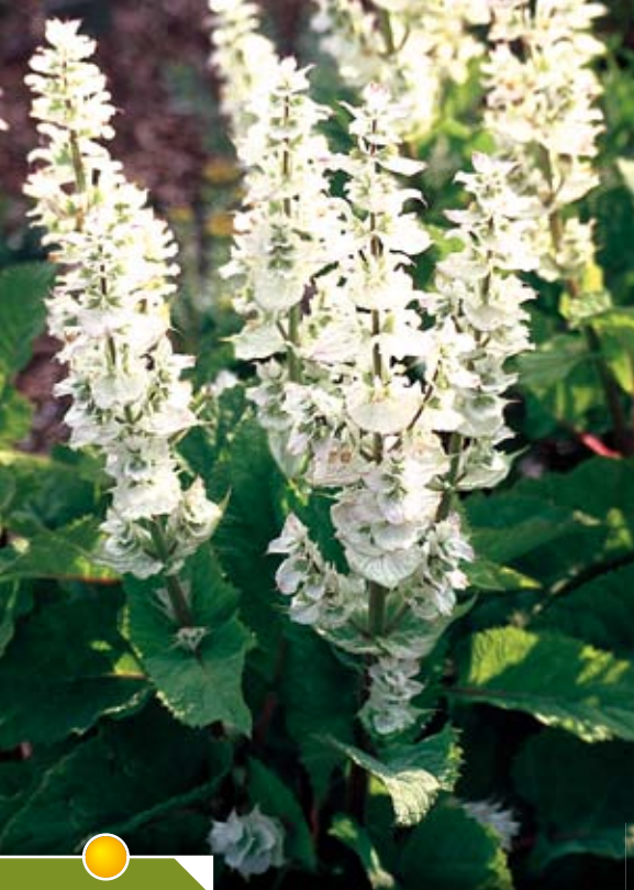
Hauteur 75 cm, floraison de juin à août. SALVIA sclarea 'Vatican White'