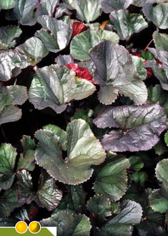
Hauteur 100 cm, floraison de juin à septembre. LIGULARIA dentata 'Dark Beauty'