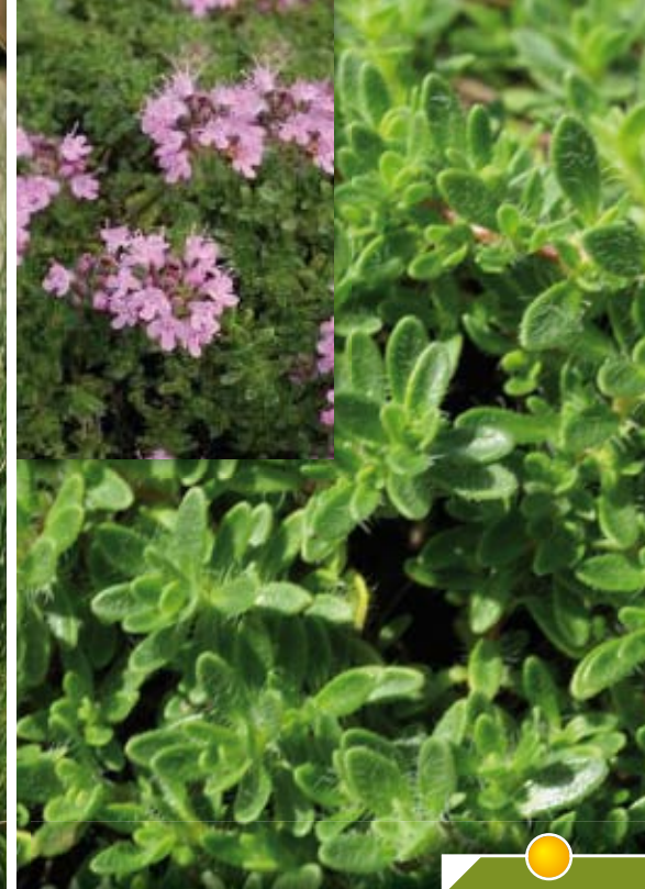
Hauteur 10 cm, floraison de juin à juillet. THYMUS doerfleri 'Bressingham'