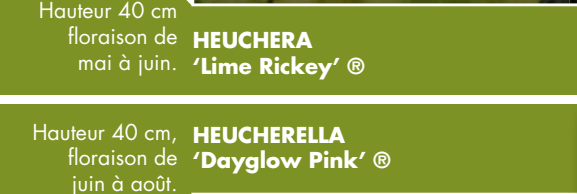
Hauteur 40 cm, floraison de juin à août. HEUCHERELLA 'Dayglow Pink' ®