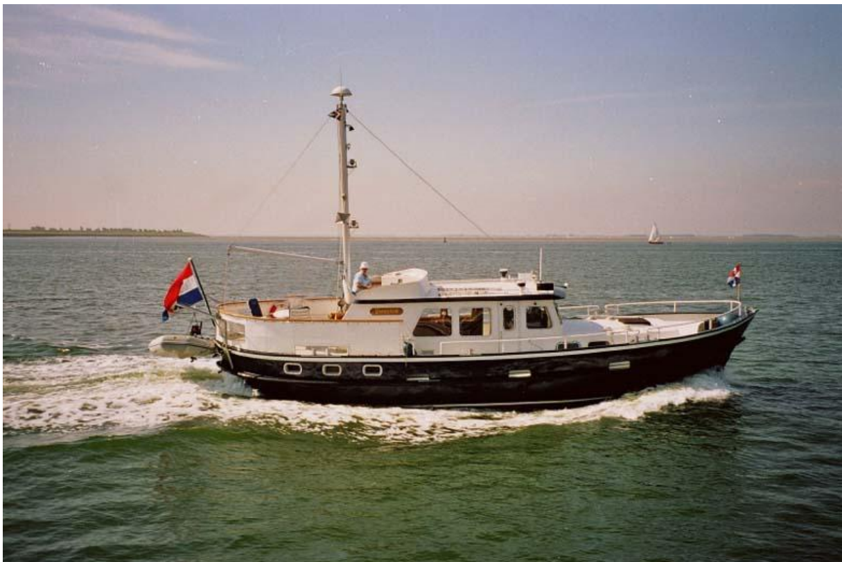
Henk te Velde met zijn 14 meter lange De Vries Lentsch kotter

Dit jaar met Henk te Velde Zeezeiler, filosoof en inmiddels motorbootvaarder