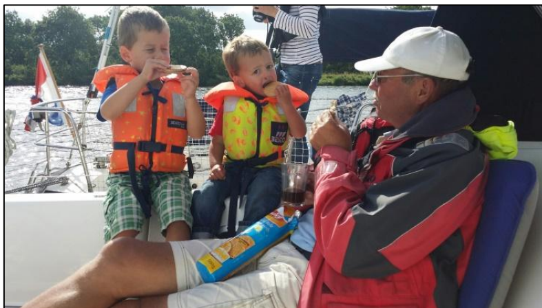
Het voordeel van een sleepje. Samen met Opa wedstrijd koeken snoepen