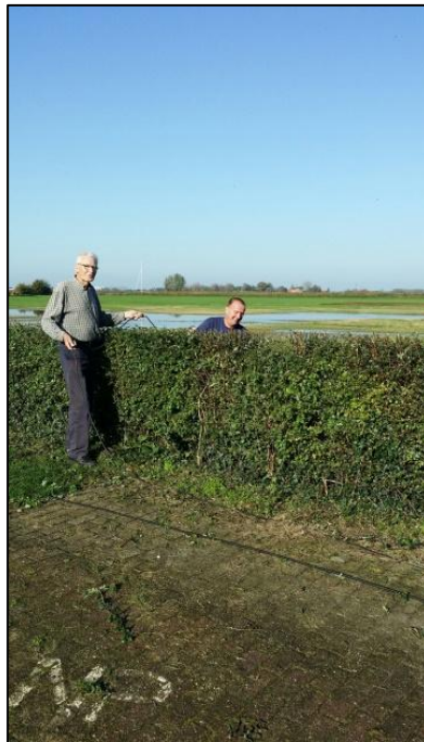
het RR team