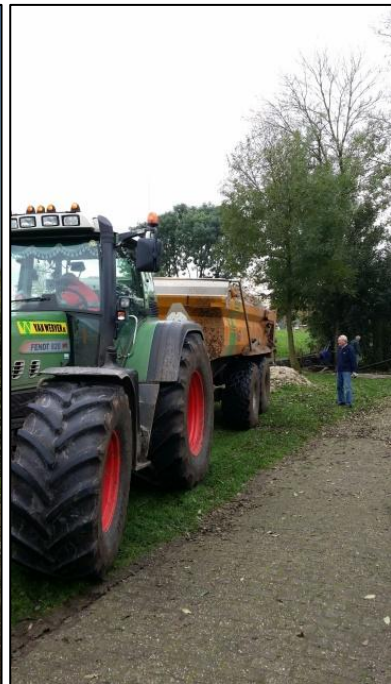
Hier moet de grond komen