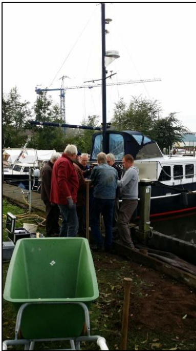
Vakwerk met vakmannen

Daar kunnen we voordelig aankomen en als die verzakken zijn die relatief eenvoudig weer op hun plek te maken. In de winter zal ik samen met het bestuur en onze havenmeester plannen ontwikkelen wat we verder gaan aanpakken. We weten dat mogelijk de aanleg van de rotonde in de N331 ook voor ons aanpassing noodzakelijk maken.