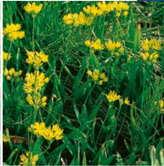
4 ▲ Allium molly