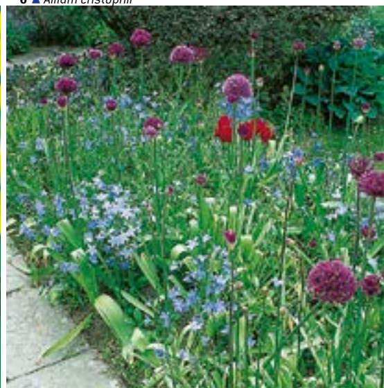
8 ▲ Allium 'Globe Master' et Campanula patula