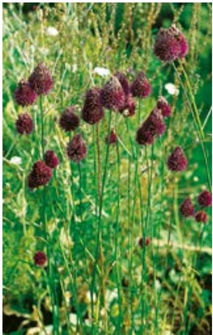
▲ 2 Allium spaerocephalon