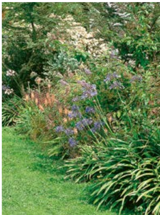
Agapanthus 'Hydon Mist' ▲ 1

Grandes fleurs bleu soutenu, ombelles de 15 à 20 cm de diamètre. 'Albus' : fleurs blanc pur. 'Albovittatus' : feuillage panaché de blanc crème, fleur bleu clair. Magnifique mais rare.