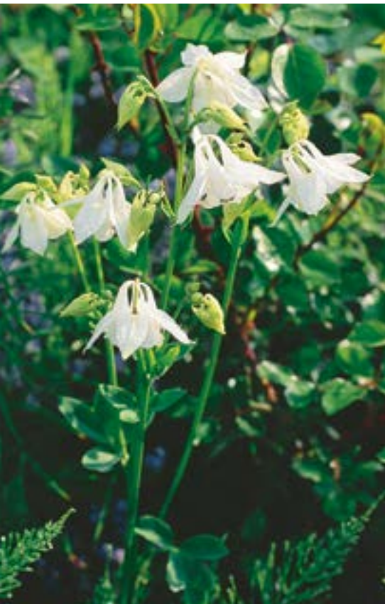
Aquilegia caerulea 'Munstead White' ▲ 2