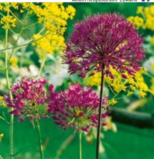
Allium hollandicum 'Purple Sensation' ▲ 7