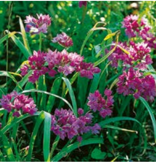
Allium oreophilum ▲ 3