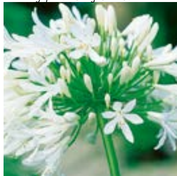
3 ▲ Agapanthus campanulatus 'Albus'