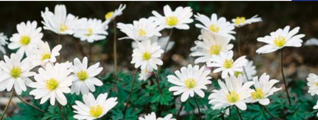
2 ▲ Anemone blanda 'White Splendour'