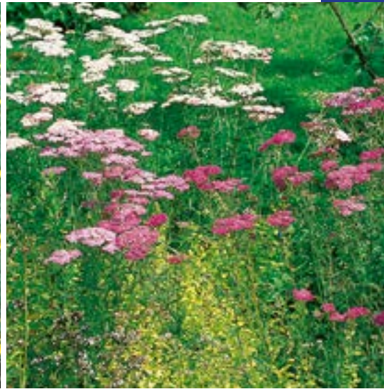
4 ▲ Achillea millefolium , achillée millefeuille