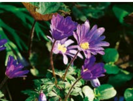
Anemone blanda ▲ 3