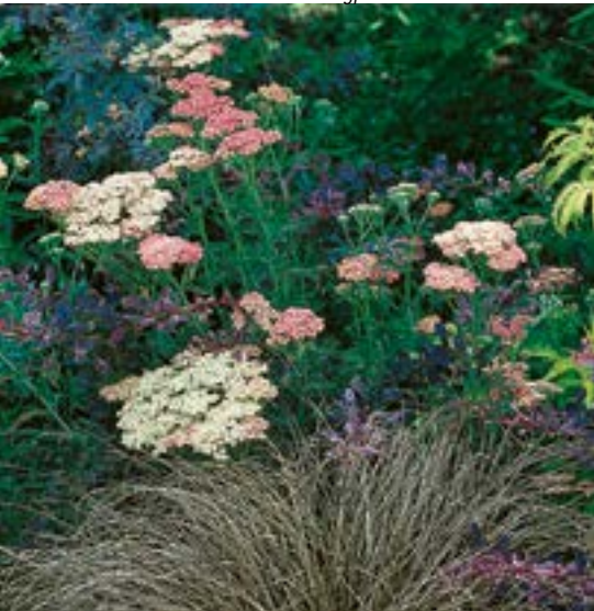
Achillea 'Lachsshönheit' ▲ 5