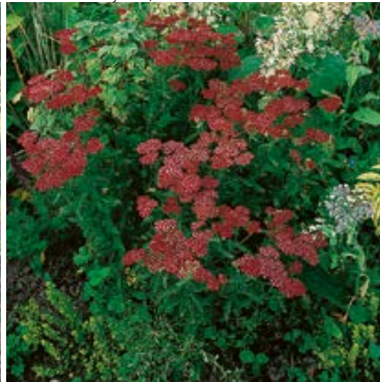
6 ▲ Achillea 'Petra'