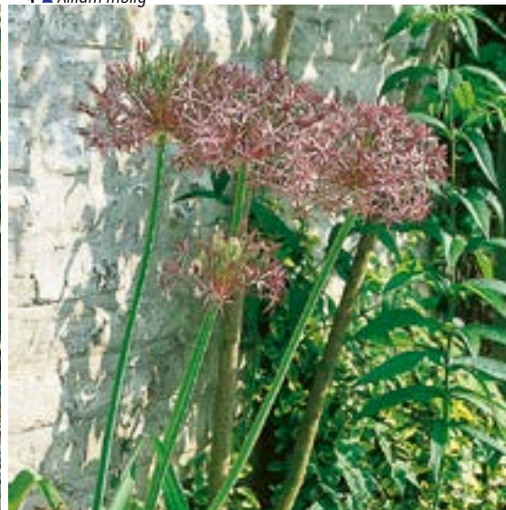
6 ▲ Allium cristophii