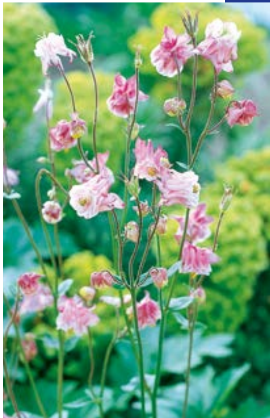
3 ▲ Aquilegia vulgaris 'Grandmother's Garden'