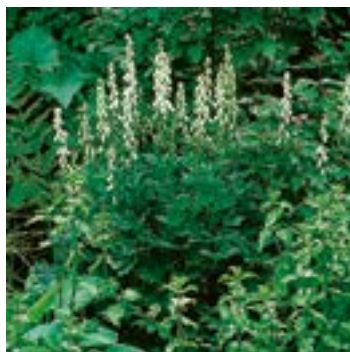
3 ▲ Aconitum 'Ivorine'