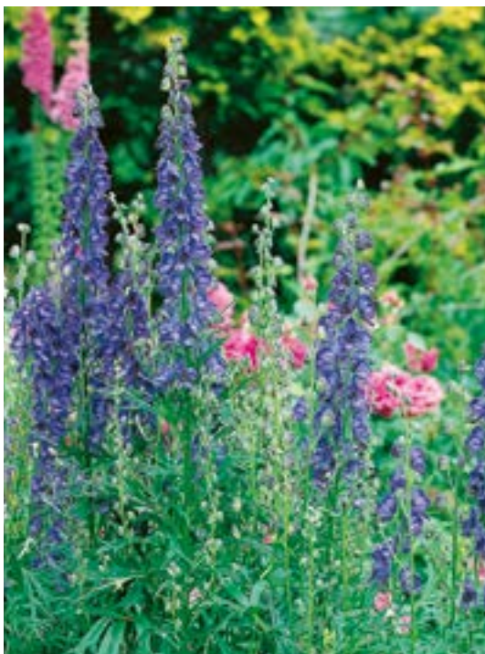
Aconitum napellus ▲ 2

Grandes fleurs violettes en épis courts, en IX et X, tiges solides, feuilles épaisses (1 m).