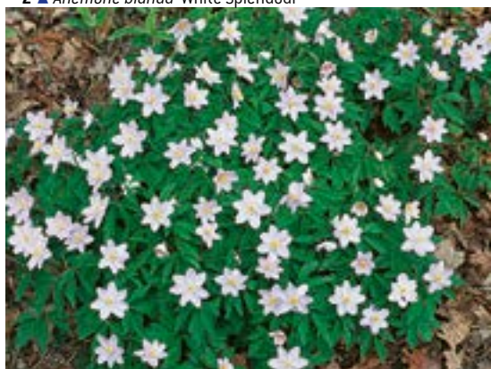
4 ▲ Anemone 'Robinsoniana'