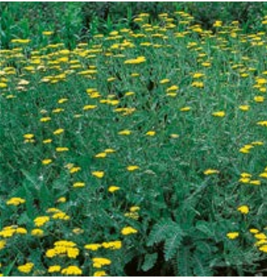
Achillea clypeolata 'Moonshine' ▲ 3