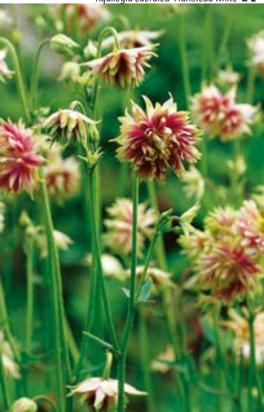
Aquilegia caerulea 'Nora Barlow' ▲ 4