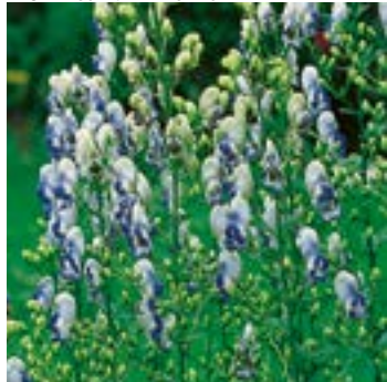
4 ▲ Aconitum x cammarum 'Bicolor'