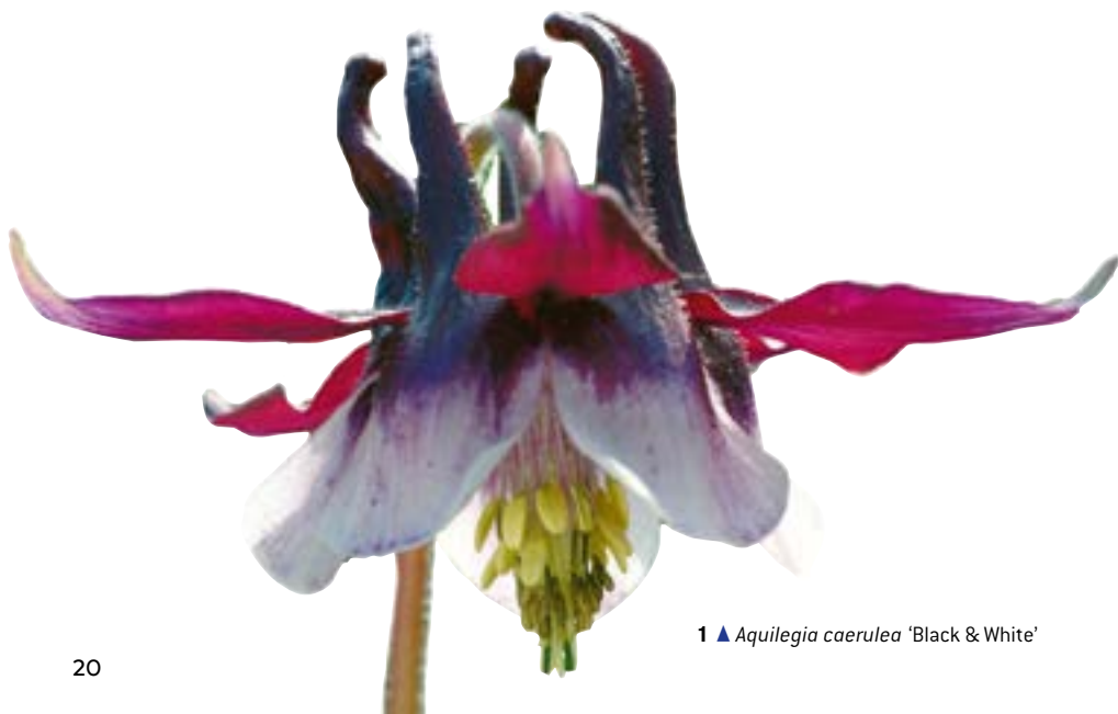
1 ▲ Aquilegia caerulea 'Black & White'