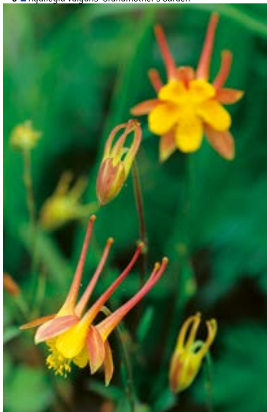
5 ▲ Aquilegia skinneri