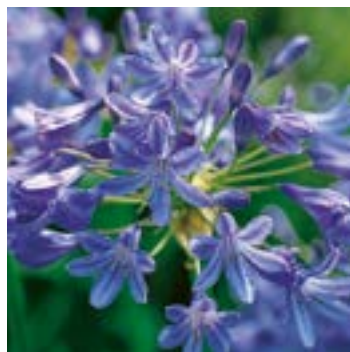
2 ▲ Agapanthus 'Hydon Mist'