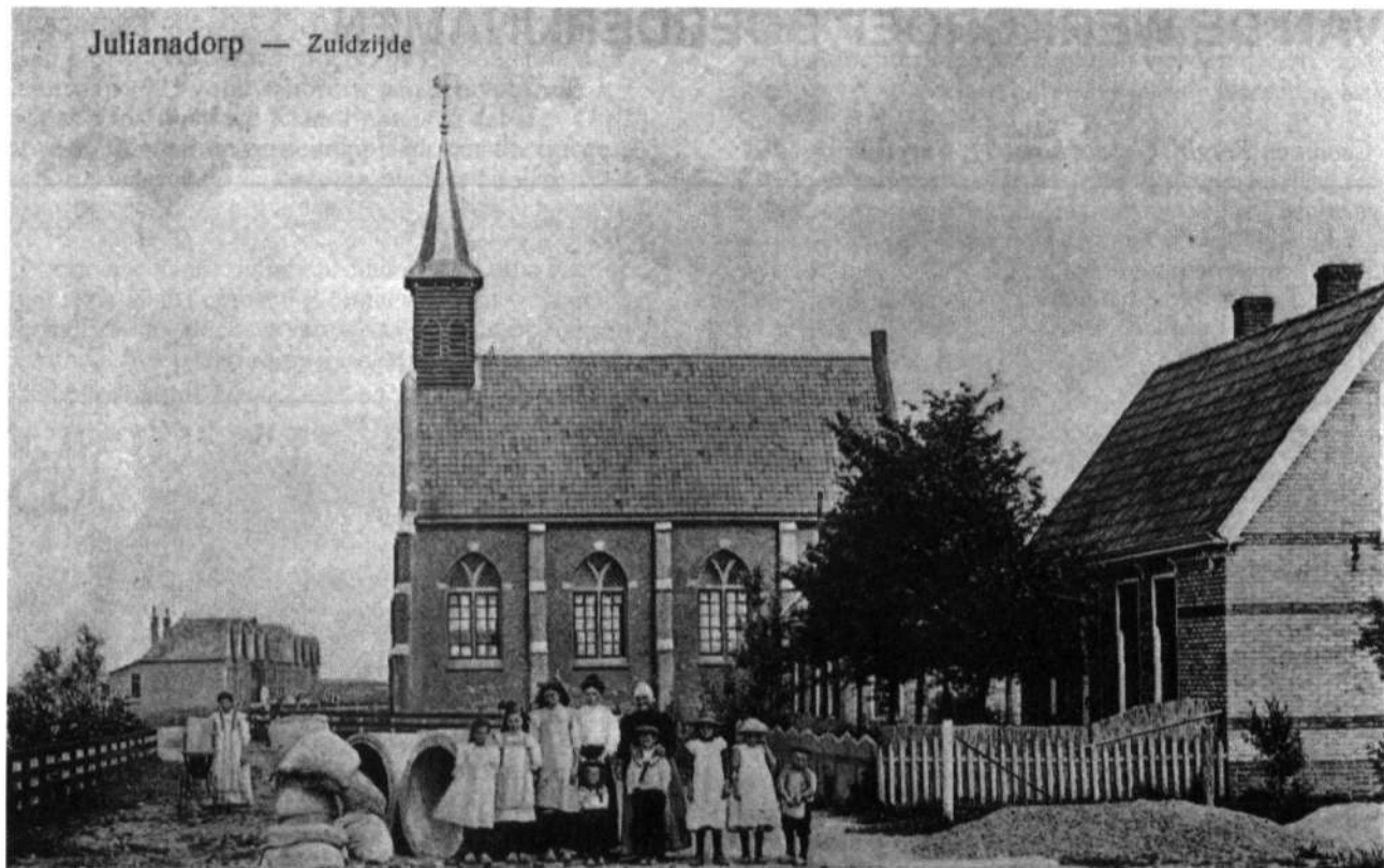
De Parkstraat met Kerk. In de beginjaren werd deze straat evenals de Proeftuinweg 'Achterbuurt' genoemd (de achter het pleintje liggende buurt).