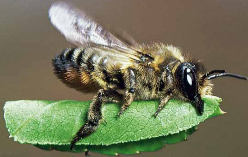
Blattschneiderbiene ( Megachile spec. )