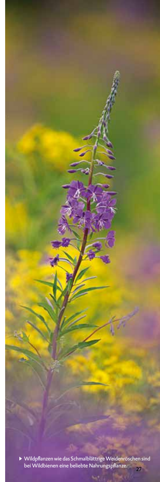
► Wildpflanzen wie das Schmalblättrige Weidenröschen sind bei Wildbienen eine beliebte Nahrungspflanze.

Die Mischung macht's. Vor allem im Sommer wird das Blütenangebot in Gärten oft knapp. Sorgen Sie für ein langfristiges und vielfältiges Nahrungsangebot für alle Bienenarten!