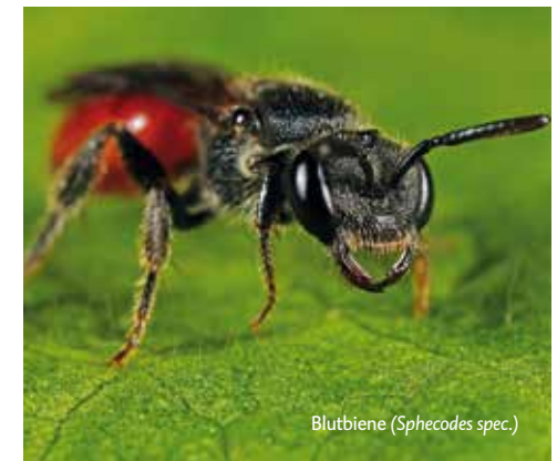
Blutbiene ( Sphecodes spec. )

Bei den sozialparasitischen Hummelarten übernimmt die Kuckuckshummel ein Hummelnest, indem sie die alte Königin tötet oder mittels spezieller Duftstoffe dominiert. Sie erzeugt keine Arbeiterinnen, sondern nur Geschlechtstiere, die von den Arbeiterinnen der Wirtsart großgezogen werden.