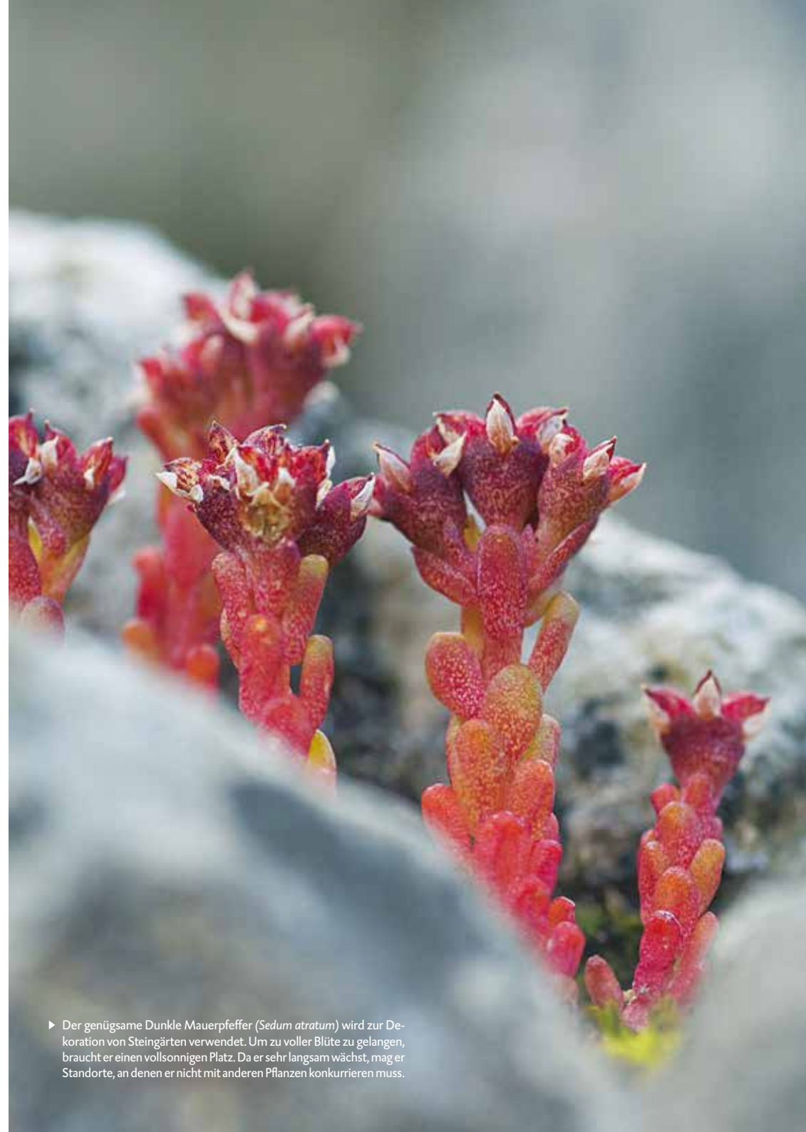
► Der genügsame Dunkle Mauerpfeffer ( Sedum atratum ) wird zur Dekoration von Steingärten verwendet. Um zu voller Blüte zu gelangen, braucht er einen vollsonnigen Platz. Da er sehr langsam wächst, mag er Standorte, an denen er nicht mit anderen Pflanzen konkurrieren muss.

Zwiebel, Lauch, Schnittlauch oder Zierlaucharten ernähren viele Bienenarten, darunter die auf Lauch spezialisierte Lauch-Maskenbiene. Wenn Sie Lauch oder Zwiebeln im Gemüsebeet anbauen, können Sie einzelne Pflanzen zur Blüte gelangen lassen, damit sie den Wildbienen als Nahrung zur Verfügung stehen.