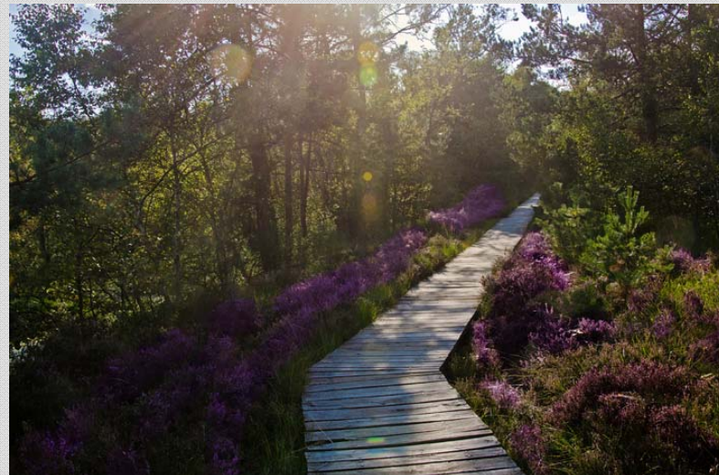
▲ Es gibt viel zu entdecken in der Heide: Pflanzen, Insekten und mit etwas Glück sogar Eidechsen und Nattern.