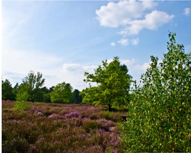
▲ Während der Lavendel große Flächen in Frankreich violett färbt, blühen Heidelandschaften in Deutschland in dem typischen Heiderosa.

◀ Heidelandschaften vermitteln eine entspannende Weite und haben einen hohen Erholungswert.