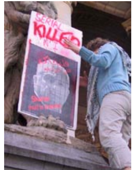
Protestactie aan de Brusselse Beurs (2004): serial killer en Israëlisch premier Ariel Sharon aan de schandpaal genageld.

Amos Oz inmiddels heeft laten weten dat hij een dergelijk interview niet geschreven heeft, zou je je toch kunnen voorstellen dat Sharon zoiets gezegd heeft. Beantwoordt het dus aan bepaalde verwachtingen?