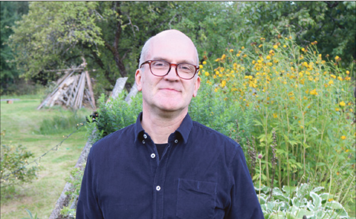
RAHMANI JANI PILT