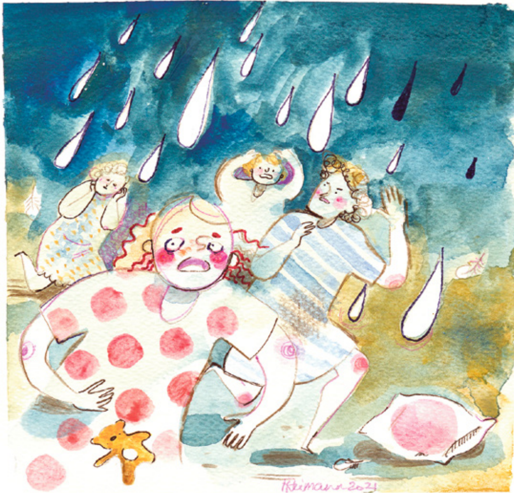
REIMANNI HILDEGARDI TSEHKENDÜS

Lõunasõõgis olf piimäklimbisupp. Istsõmi üten lavvaotsan, oppaja keskel, poiskõsõ tõsõn otsan. Lavvakatja pidi hoolõga kaema, et oppaja pand hindäle suppi õks mi kausist.