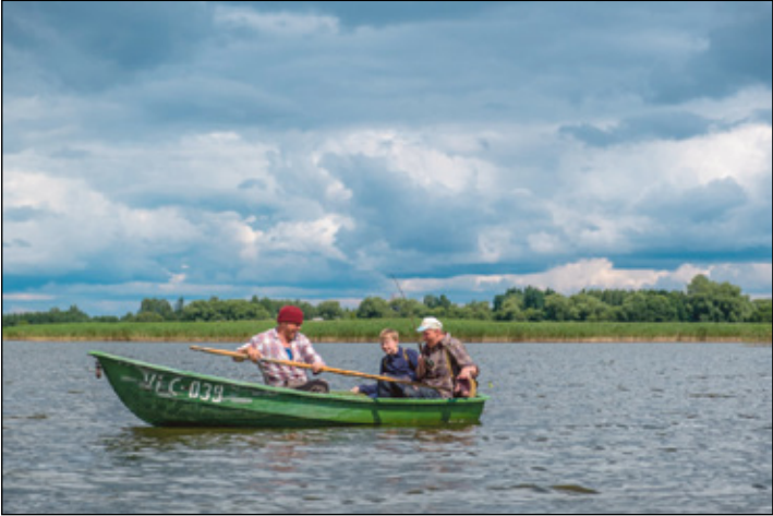
Pilt filmist «Vee peal».