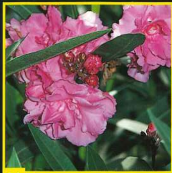
21 Splendens giganteum