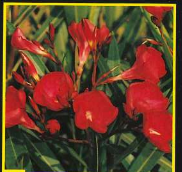
6 Emile Sahut