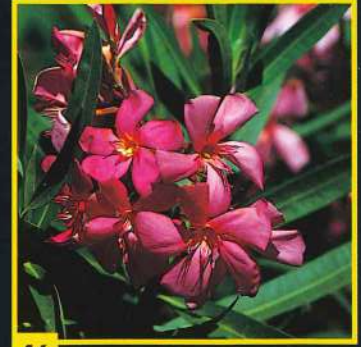
46 Maréchal Graziani