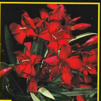
11 Petite Red