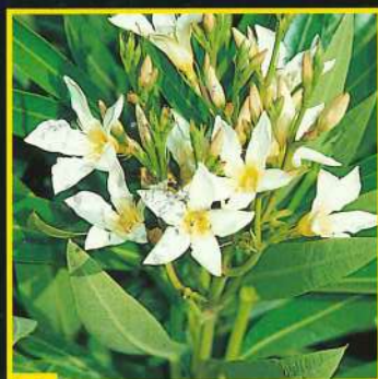
56 Isle of Capri