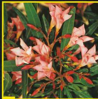
34 Nain Rose