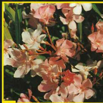
38 Rosy Ré® 'JR 95-2'