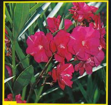
2 Géant des Batailles