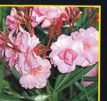
18 Rosée du Ventoux