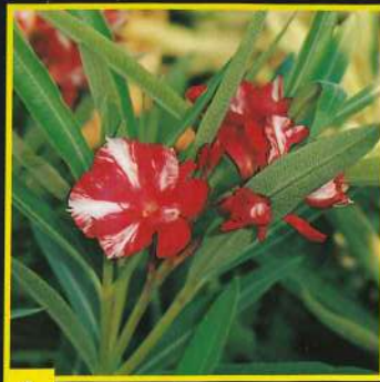
1 Blue-Blanc-Ré D