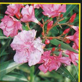
16 Louis Pouget