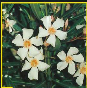
55 Angiolo Pucci