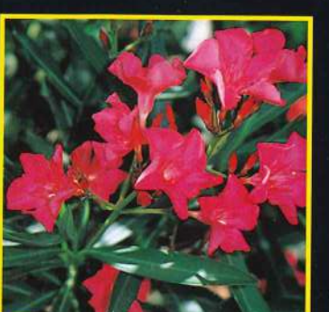
14 Ville de La Londe