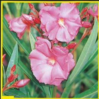
19 Roseum Plenum