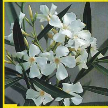
49 Sœur Agnès