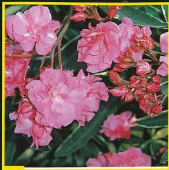
20 Splendens Foleis Variegata