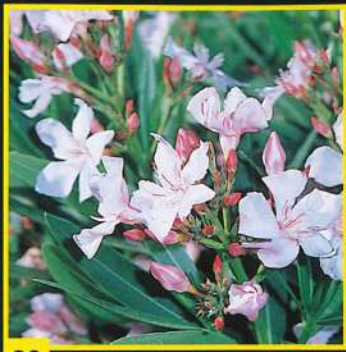
39 Sealy Pink