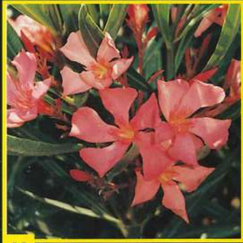
43 Soleil Levant