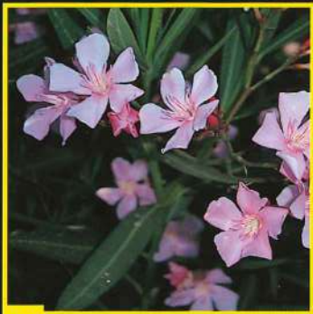
28 Hardy Pink