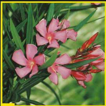
32 Maurin des Maures