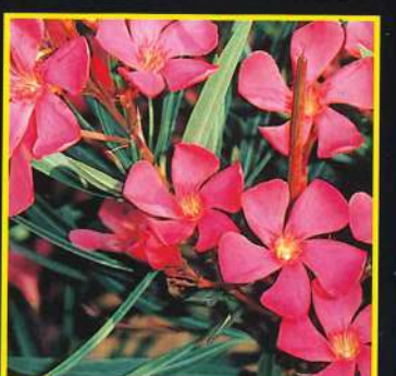
10 Papa Gambetta