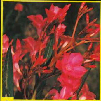
3 Professeur Granel