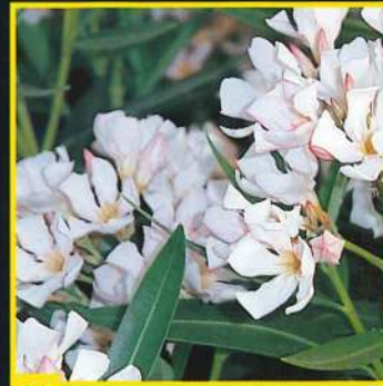
53 Petite Salmon