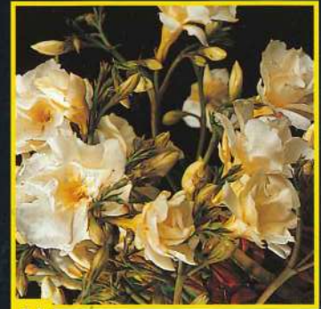
54 Luteum Plenum