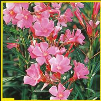
24 Belle Hélène