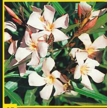
45 Madame Léon Blum