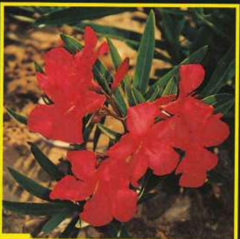
7 Hardy Red