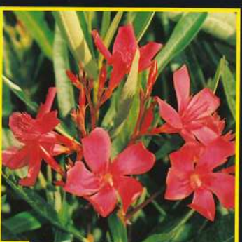
12 Ré D®