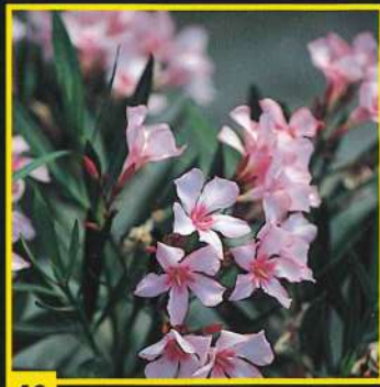
40 Villa Romaine