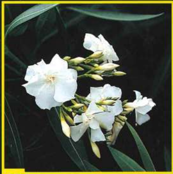
47 Mont Blanc