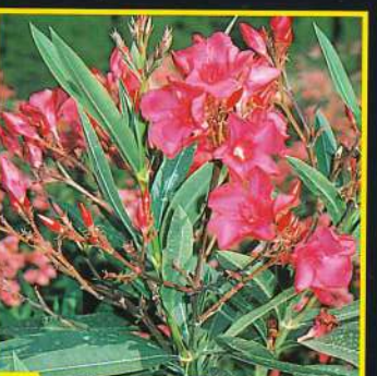
15 Ville de Martigues