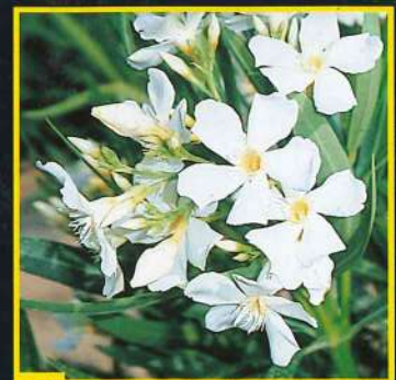
58 Souvenir des Iles Canaries