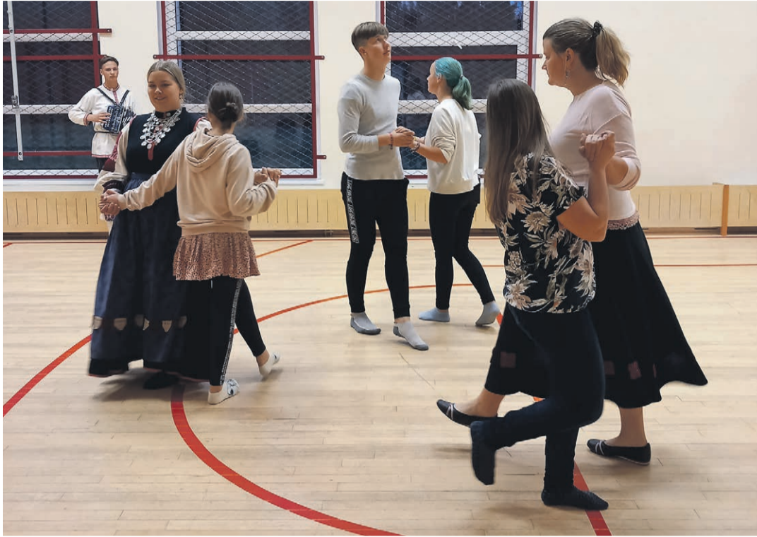
Obinitsa tantsude õpituba.

Luhamaa eakad olid kutsutud 18. oktoobril Meremäe tee-