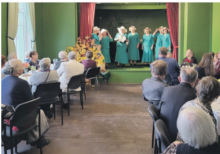
Laval on seltsingu naisansambel Meribel.