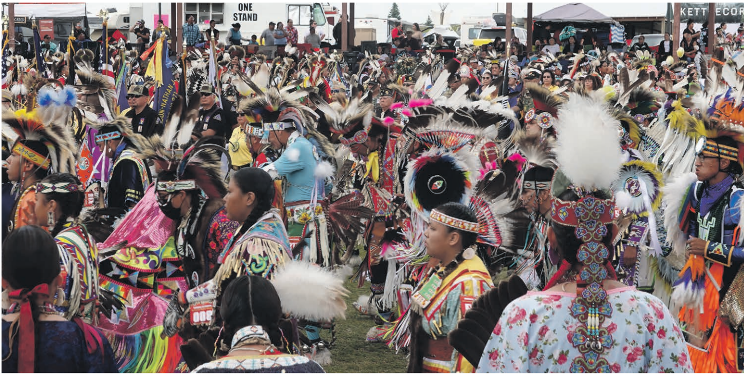
Mihi tands, koh tandsjal om ilosahe nätä' udrasõ naha' ku tsirgu sulõ.