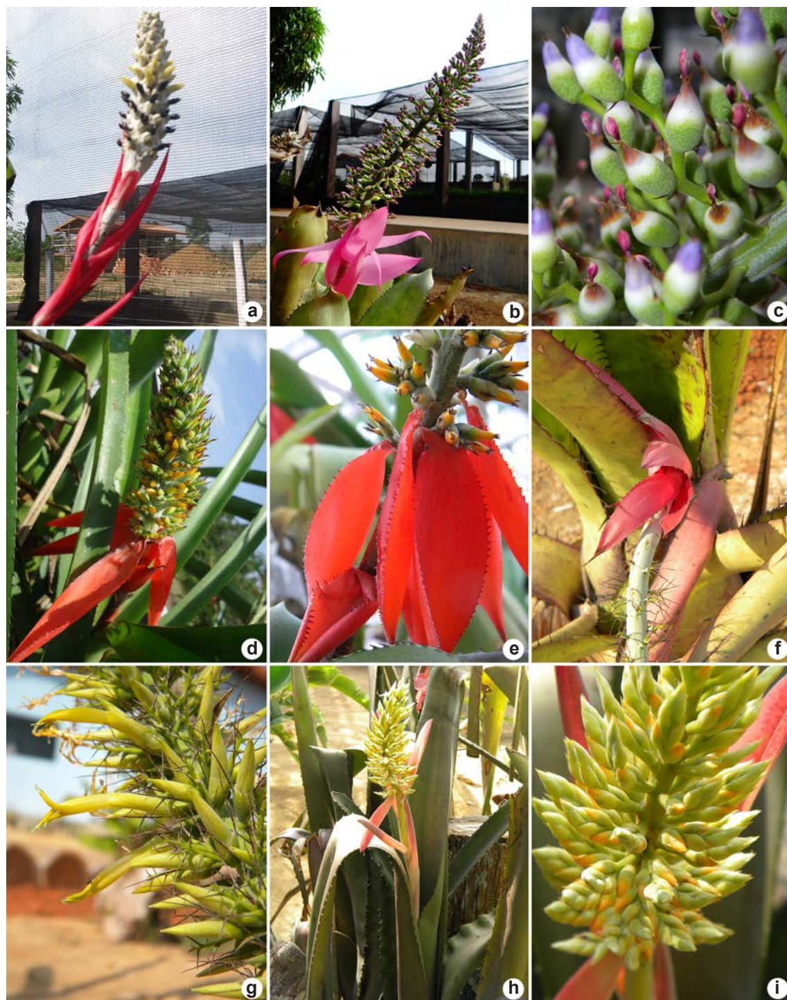
Figura 2 – a. Aechmea bromeliifolia – detalhe da inflorescência; b-c. Aechmea castelnavii – b. detalhe da inflorescência; c. flores e frutos imaturos; d-e. Aechmea mertensii – d. detalhe da inflorescência; e. detalhe das brácteas; f-g. Aechmea setigera – f. detalhe das brácteas da base do pedúnculo; g. detalhe da inflorescência; h-i. Aechmea tocatina – h. hábito fértil; i. detalhe da inflorescência.

Figure 2 – a. Aechmea bromeliifolia – detail of inflorescence; b-c. Aechmea castelnavii – b. detail of inflorescence; c. flowers and immature fruits; d-e. Aechmea mertensii – d. detail of inflorescence; e. detail of bracts; f-g. Aechmea setigera – f. detail of bracts at peduncle base; g. detail of inflorescence; h-i. Aechmea tocatina – fertile habit; i. detail of inflorescence.