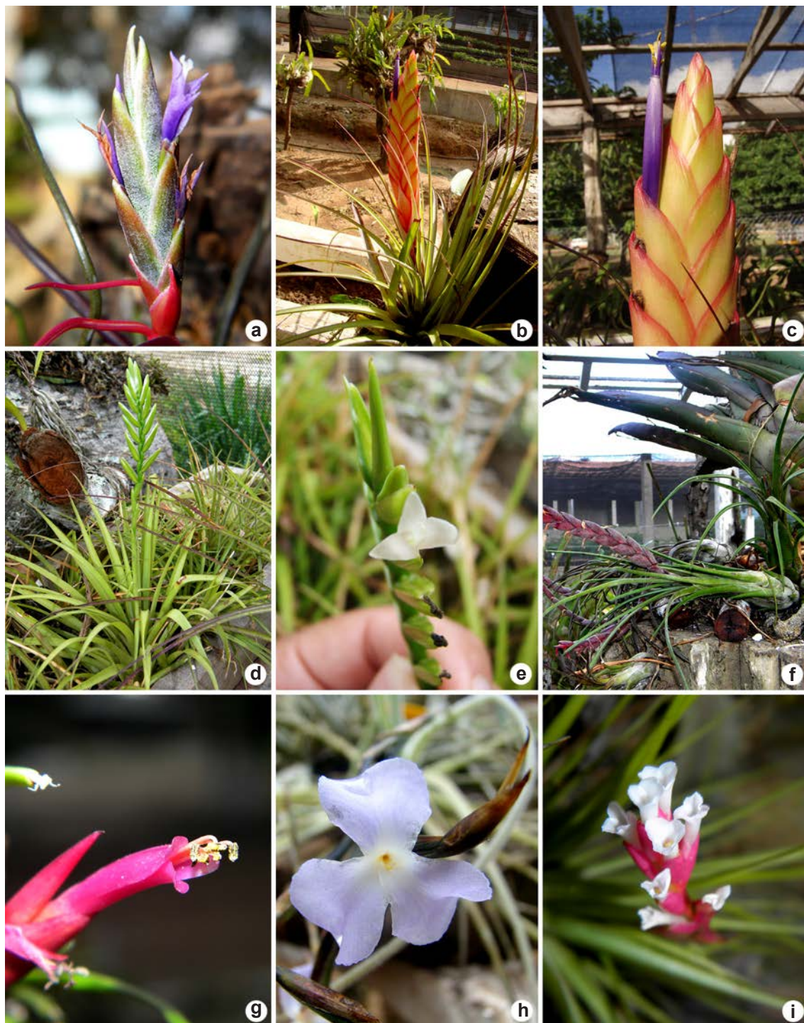
Figura 4 – a. Tillandsia bulbosa – detalhe da inflorescência; b-c. Tillandsia fasciculata – b. hábito fértil; c. flor; d-e. Tillandsia monadelphina – d. hábito fértil; e. detalhe da flor; f-g. Tillandsia paraensis – f. hábito fértil; g. detalhe da flor; h. Tillandsia tenuifolia – detalhe da inflorescência; i. Tillandsia streptocarpa – detalhe da flor.

Figure 4 – a. Tillandsia bulbosa – detail of inflorescence; b-c. Tillandsia fasciculata – b. fertile habit; c. flower; d-e. Tillandsia monadelphina – d. fertile habit; e. detail of flower; f-g. Tillandsia paraensis – f. fertile habit; g. detail of flower; h. Tillandsia tenuifolia – detail of inflorescence; i. Tillandsia streptocarpa – detail of flower.