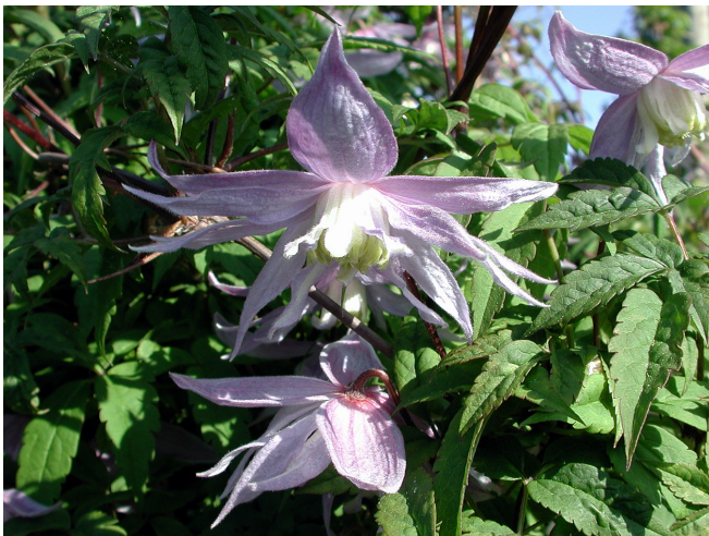
FLORALIA® – atragene-klematis