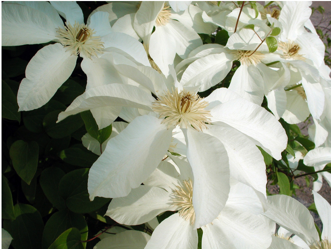
SUNNA® ('BCL721') – tidig storblommig klematis