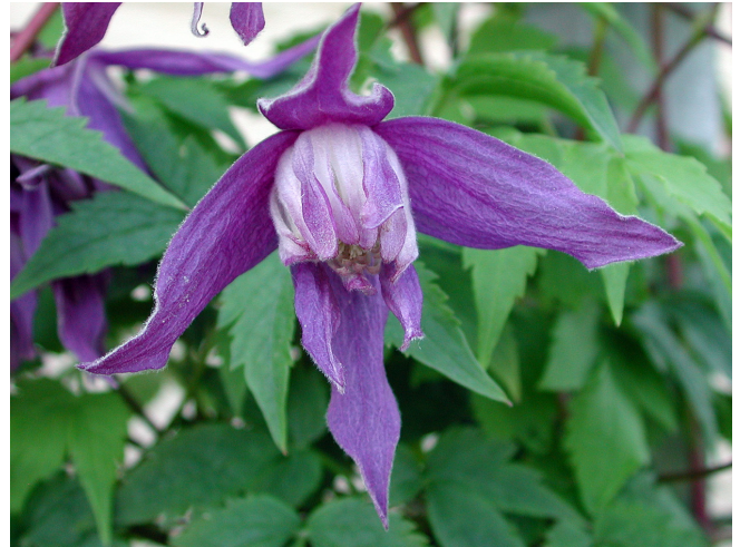
'Clochette Pride' E – atragene-klematis