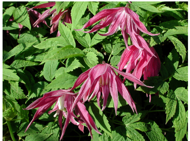
PINK PERFUME® – atragene-klematis