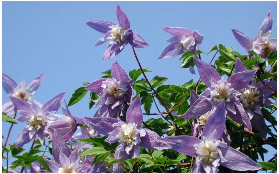
'Chili' – atragene-klematis