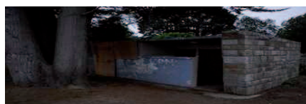
(Mise en valeur de la dune du Trez-Hir en 2013 !)