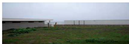
(Etat des paysages naturels en septembre 2013)

Mettre en place un plan de circulation intégrant les piétons et les cyclistes Entretien et nettoyage : bâtiments communaux, espaces verts, dunes du Trez-Hir... Développer les points de ramassage ornières : stationnement sur site aménagé, etc.