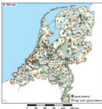
Egelmeldingen op Telmee

Nog nooit zijn in Nederland zoveel gegevens over de egel verzameld als tijdens het Jaar van de Egel. De duizenden en duizenden meldingen van egels overtroffen de verwachtingen van de Zoogdierverseniging. Met name rond het Egelweekend meldde Nederland massaal egels. En de 15.000 folders 'Egels ook in uw tuin' waren in korte tijd op. De mensen van de Zoogdierverseniging hebben hard gewerkt aan het verwerken en interpreteren van alle gegevens. Daarbij zijn zeker ook de gegevens van de E-teams van belang (vrijwilligers die een jaar lang dode egels bijhouden op hun woon-werk route). Of het inderdaad zo slecht gaat met de egels en ze op de Rode lijst voor beschermde zoogdieren moeten, was bij het ter perse gaan van dit nummer van Zoogdier nog niet bekend. Kijk op www.jaarvandeegel.nl voor actuele informatie.