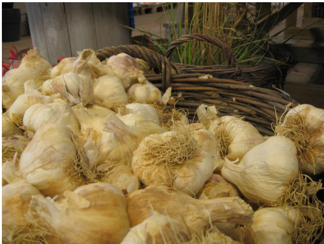
Vitlök-nyttig och lättodlad