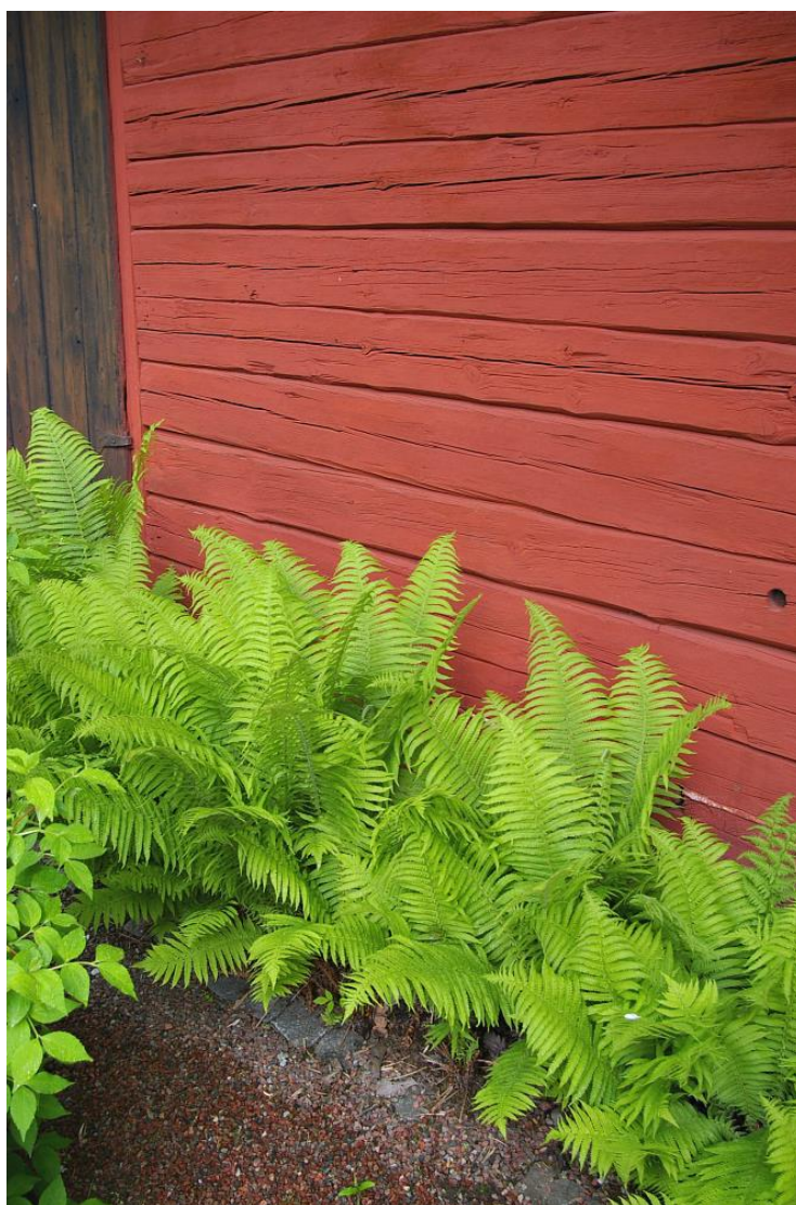
Enkelt och snyggt, strutbräken mot en faluröd vägg