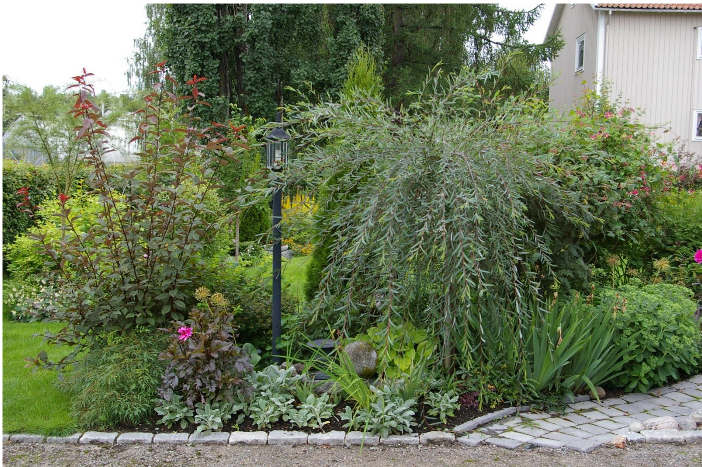
Träd finns i alla storlekar. Stora träd ger skugga och insynsskydd. Många medelstora träd har vacker blomning. De allra minsta passar både i den större rabatten och även i kruka

Det finns rätt många riktigt små träd att välja på om man t.ex. vill ha ett träd i kruka. För att de ska övervintra säkert bör de dock planteras ner/jordslås, eller ställas in i exempelvis kallgarage för att klara vintern. Annars finns en risk att rotsystemet skadas av kylan. Några är tillräckligt tåliga för att stå utomhus året runt i en isolerad kruka