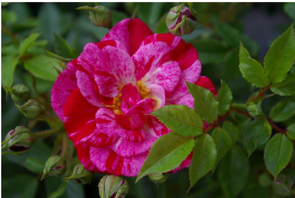
'Candy Cover', söt som en polkagris och mycket blomrik. Lika fin i rabatten som i krukant!