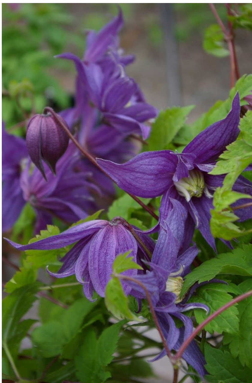
TINDRA E, småvuxen, återblommande & alldeles underbar! Kan odlas i ampel, som låg klättrare, eller mycket fin marktäckare!

Klematis trivs generellt med huvudet i solen och fötterna i skugga. Plantera gärna någon storbladig perenn vid basen för att skugga jorden. Jorden bör vara näringsrik och genomsläpplig, men fuktighetshållande. Ge gärna en dos höns gödsel på våren när tillväxten börjar. Höstgödsling kan göras med benmjöl. Vedartade sorter planteras ca 15 cm djupare än de står i krukan och runt stammarna fylls på med fint grus eller grov sand, detta för att minska risken för vissnesjuka. Alla sorter är osmakliga för rådjur