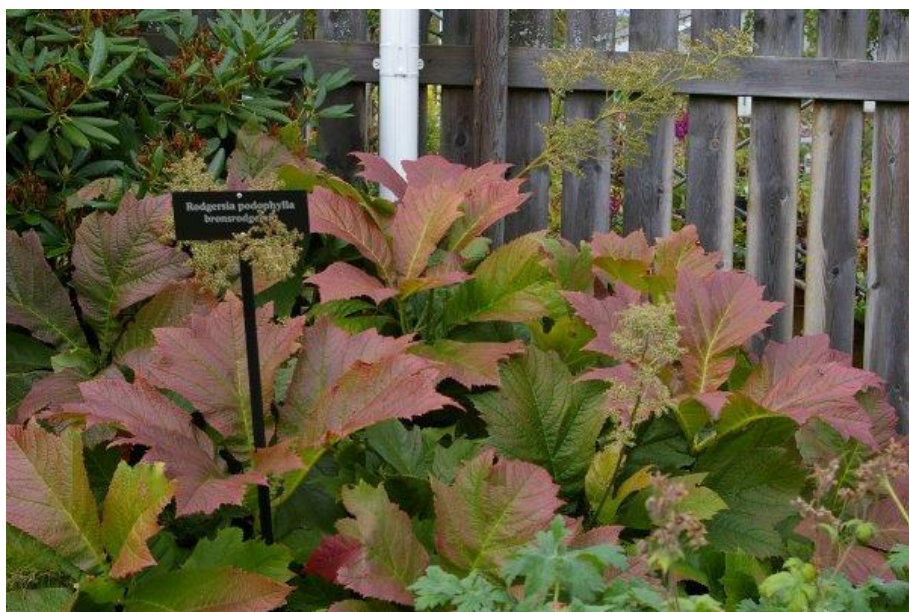
Långsam i starten är rogersian, men den utvecklas till en av trädgårdens pampigaste perenner