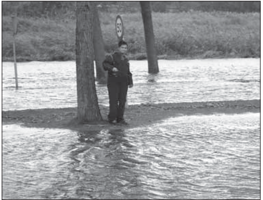
Vorige week was de weg weg naar de Holle Poarte. Een fanatieke visser wierp meteen zijn hengel uit.