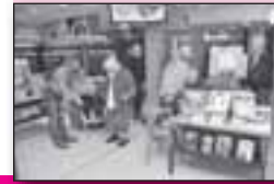
Schilderclub Avondrust exposeert in Makkumer Bibliotheek