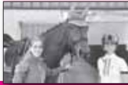
Tweling zien droom in vervulling gaan