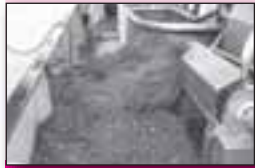
Supervangst Won 17