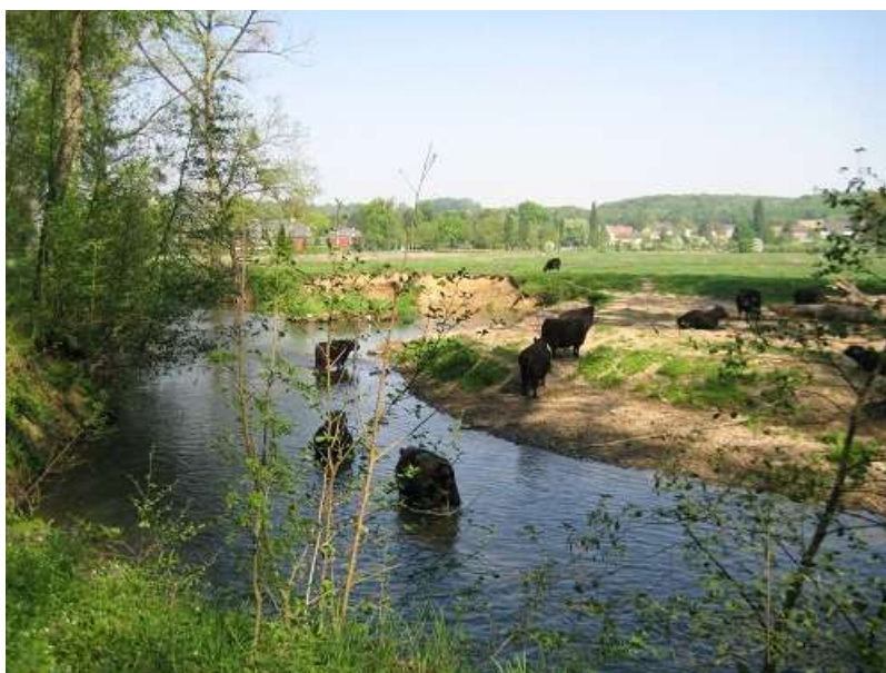
De camping "Hoeve Krekelberg" bevindt zich tussen prachtige natuurgebieden.