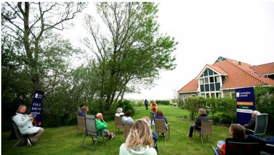
Foto: Verhalen van 'Ameland Vertel!' tijdens Proeftuin Verhalenavond juni 2021

Op 26 november 2021 is er weer een Verhalenavond! Het thema van dit jaar is 'Taal fan myn hert', een breed thema waar een scala aan verhalen over te vertellen is en dat is precies wat de organisatie van Verhalenavond beoogt. Honderden vertellers in heel Fryslân op bijzondere locaties. Ontmoeten, dat is waar we naar verlangen en dat is waar Verhalenavond in uitblinkt.