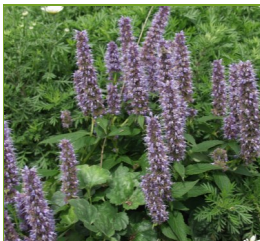
Agastache foeniculum 'Blue Fortune' Duftnessel

Blüthenhöhe: 45 cm Blütezeit: März-April