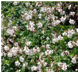
Geranium cantabrigiense 'Biokovo' Storchschnabel

Blüthenhöhe: 60-80 cm Blütezeit: Juli-Sept.