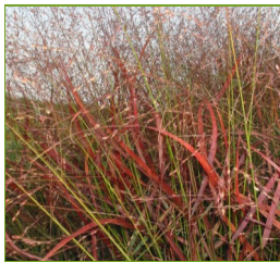
Panicum virgatum 'Rotstrahlbusch' Ruten-Hirse

Blüthenhöhe: 20-25 cm Blütezeit: Juni-Juli