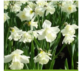
Narcissus 'Mount Hood' Trompeten-Narzisse

Blüthenhöhe: 45 cm Blütezeit: März-April