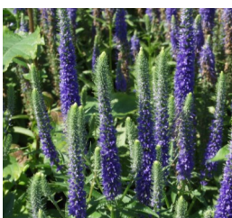
Veronica longifolia 'Blauriesin' Hoher Ehrenpreis

Blüthenhöhe: 80-100 cm Blütezeit: Juli-Aug.