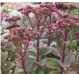
Sedum telephium 'Matrona' Großes Fettblatt

Blüthenhöhe: 50-70 cm Blütezeit: Aug.-Okt.