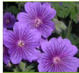
Geranium x magnificum 'Rosemoor' Pracht-Storchschnabel

Blüthenhöhe: 90 cm Blütezeit: Juli-Sept.