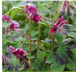
Geranium phaeum 'Samobor' Brauner Storchschnabel

Blüthenhöhe: 30-50 cm Blütezeit: Juni-Juli