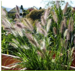
Pennisetum alopec. 'Hameln' Lampenputzergas

Blüthenhöhe: 120 cm Blütezeit: Sept.-Okt.