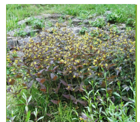
Lysimachia ciliata 'Firecracker' Bronze-Felberich

Blüthenhöhe: 30-60 cm Blütezeit: Mai-Sept.