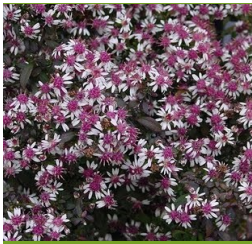
Aster lateriflorus 'Lady in Black' Kissen-Aster

Blüthenhöhe: 120 cm Blütezeit: Sept.-Okt.