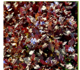
Cerastostigma plum-baginoides Bleiwurz

Blüthenhöhe: 40-50 cm Blütezeit: Juli-Juli