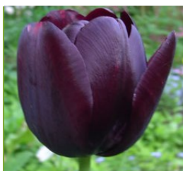
Tulipa 'Queen of Night' Tulpe

Blüthenhöhe: 50-70 cm Blütezeit: Aug.-Okt.