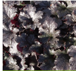
Heuchera micrantha 'Plum Pudding' Purpurglöckchen

Blüthenhöhe: 30-50 cm Blütezeit: Juni-Juli