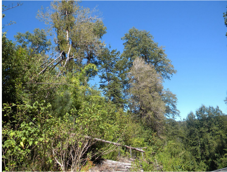
FIGURA 6. Vista parcial del bosque de Coigue-Raulí-Roble, hábitat de C. ochsenii (en parte inferior izquierda), en la precordillera andina de la Región de la Araucanía.

De acuerdo a información recopilada por Saavedra (2007), hasta el momento se ha determinado que en la Región de La Araucanía hay una población total aproximada de 900 ejemplares de esta especie, de los cuales 890 se ubican en la Reserva Nacional Malleco. La mayoría de ellos están asociados a la distribución del bosque de Roble-Laurel-Lingue por la Depresión Central de dichas regiones (Figura 6).