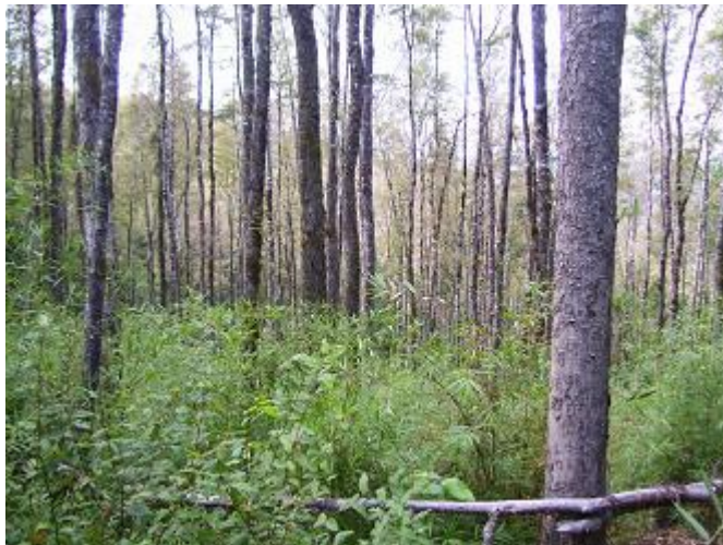
FIGURA 7. Vista parcial del bosque de Roble-Laurel-Lingue, en la depresión central de la Región de la Araucanía (Hauenstein E. 2011).

La huella chica es una especie endémica de Chile con serios problemas de conservación. Es un arbusto bajo, que en su reducida área de distribución ocupa posiciones ambientales asociado al bosque de Roble-Laurel-Lingue (Figura 7), intervenidos por el hombre, tanto en la Depresión Central, Cordillera de la Costa y sectores preandinos (Hechenleitner et al. 2005).