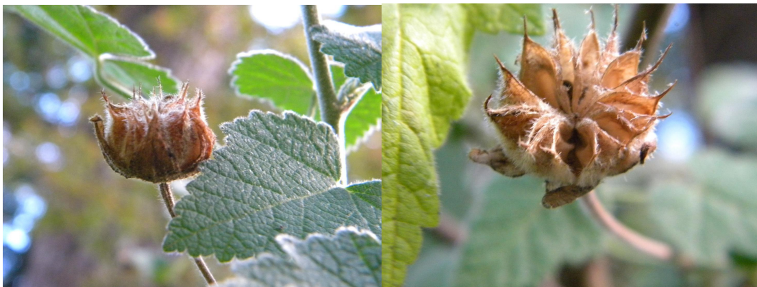
FIGURA 4a. Frutos de C. ochsenii .

Frutos: Sus frutos son cápsulas, esquizocárpicas, compuestas por 6 a 10 mericarpos, de 1 a 1,8 cm, con dos aristas largas. Se caracterizan por desprenderse de la planta antes de su maduración. Cada cápsula contiene entre 12 y 14 semillas de aspecto reniforme, de 2 mm de diámetro (Figuras 4 a y 4b).