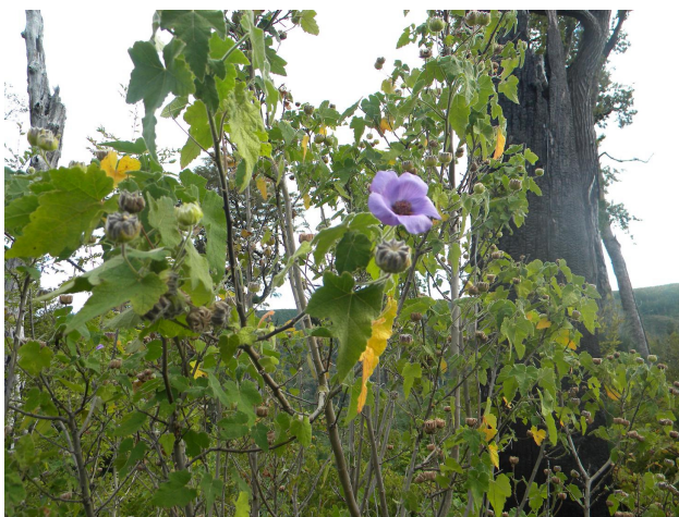
FIGURA 1. Habito de Corynabutilon ochsenii en Chile. (Fuente: Saavedra M. 2011).

Arbustos o árboles pequeños, con pelos estrellados. Hojas grandes, de margen entero a lobulado, o pequeñas y tripartidas. Estípulas pequeñas, triangulares. Flores grandes, axilares, solitarias o pareadas, o en corimbos o subumbelas. Calículo ausente. Cáliz campanulado, dividido hasta cerca de la mitad o subtruncado. Corola dos veces más larga que el cáliz. Pétalos blancos o purpúreos. Estambres incluidos en la corola, columna apicalmente estaminífera. Estilos 5 a 10, ramificados, más o menos aplastados-clavados, pilosos en la base; estigmas decurrentes, sobre cada lado. Fruto esquizocárpico, mericarpos 5 a 10, ápice aristado, dehiscencia loculicida o septicida.