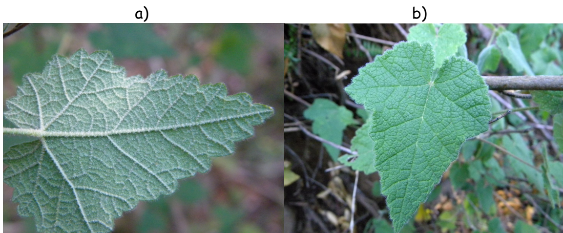
FIGURA 2. Hojas de C. Ochsenii , a) cara abaxial y b) cara adaxial.

Hojas: Simples, con 3 a 5 lóbulos bien marcados, destacando el central mucho más desarrollado; lámina de 3,6 a 7,5 cm de largo, con pelos (tricomas) simples en la cara superior (haz), o sólo los nervios con pelos estrellados, la cara inferior (envés) con pelos estrellados; el pecíolo es largo, alcanzando una longitud de entre 3 y 7 cm. Estípulas sólo con pelos estrellados.