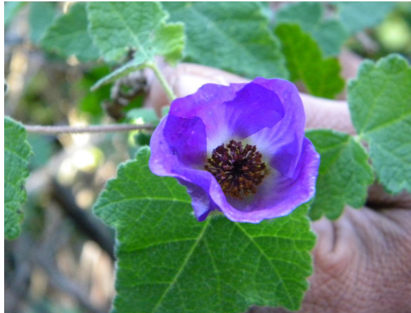
FIGURA 3. Flor de C. ochsenii . (Fuente: Saavedra M. 2011).

Frutos: Sus frutos son cápsulas, esquizocárpicas, compuestas por 6 a 10 mericarpos, de 1 a 1,8 cm, con dos aristas largas. Se caracterizan por desprenderse de la planta antes de su maduración. Cada cápsula contiene entre 12 y 14 semillas de aspecto reniforme, de 2 mm de diámetro (Figuras 4 a y 4b).