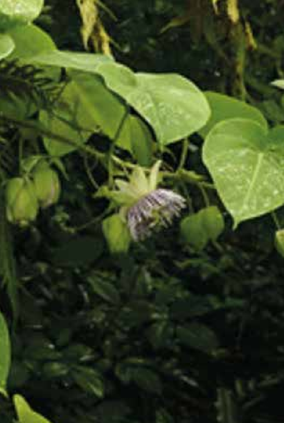
Passiflora ligularis Juss.