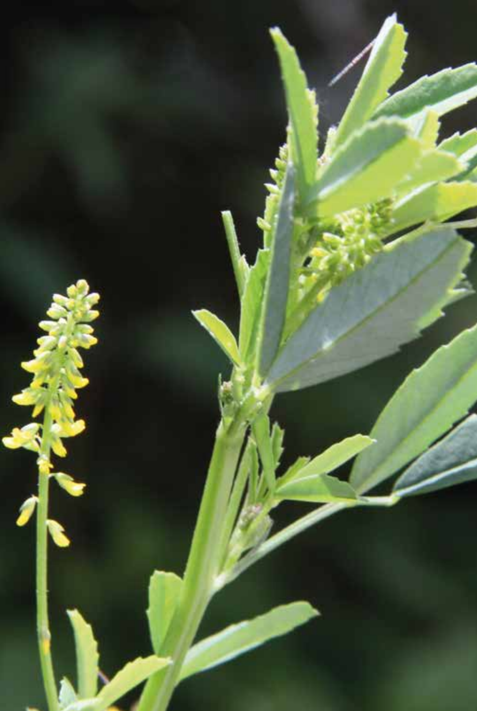
Medicago sativa L.