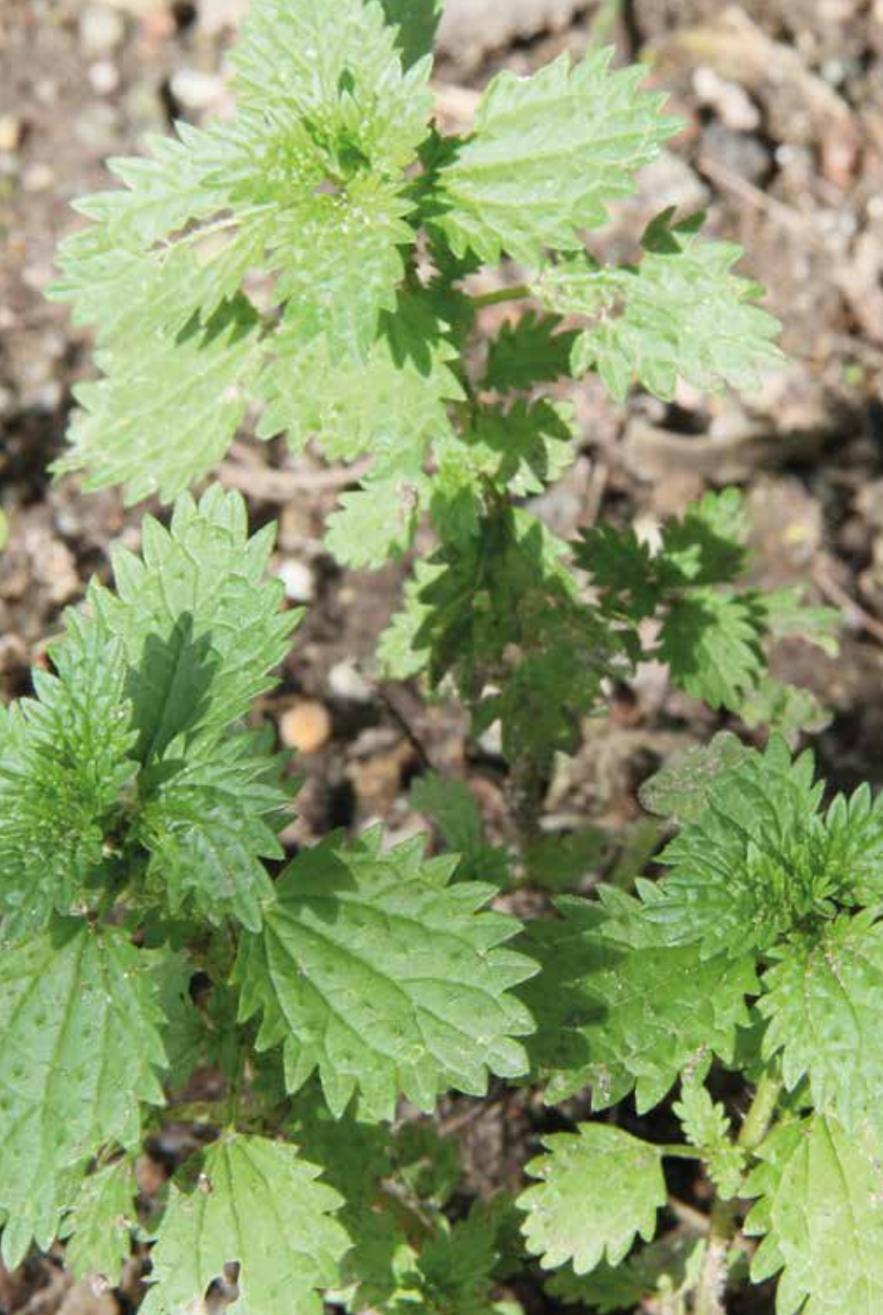
Urtica laetevirens Maxim.