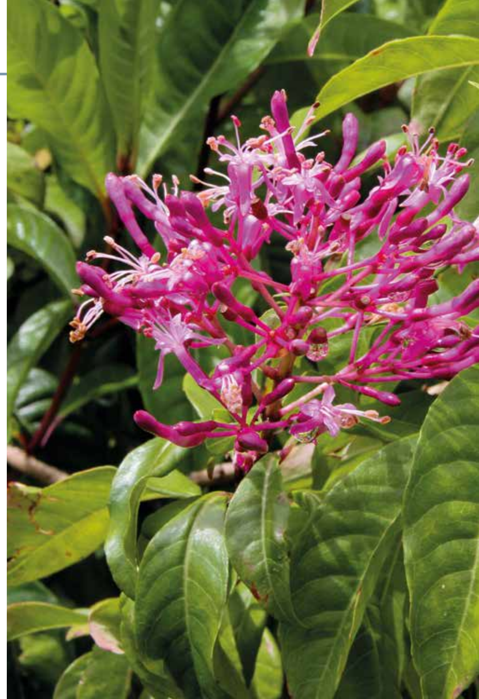
Palicourea amethystina (Ruiz & Pav.) DC.

Información química y farmacológica: En la literatura científica no existen estudios químicos y farmacológicos de la especie.