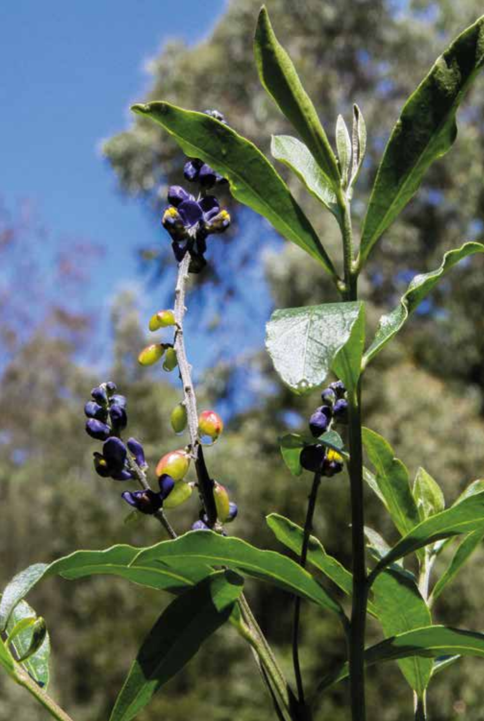
Monnina phillyreoides (Bonpl.) B. Eriksen