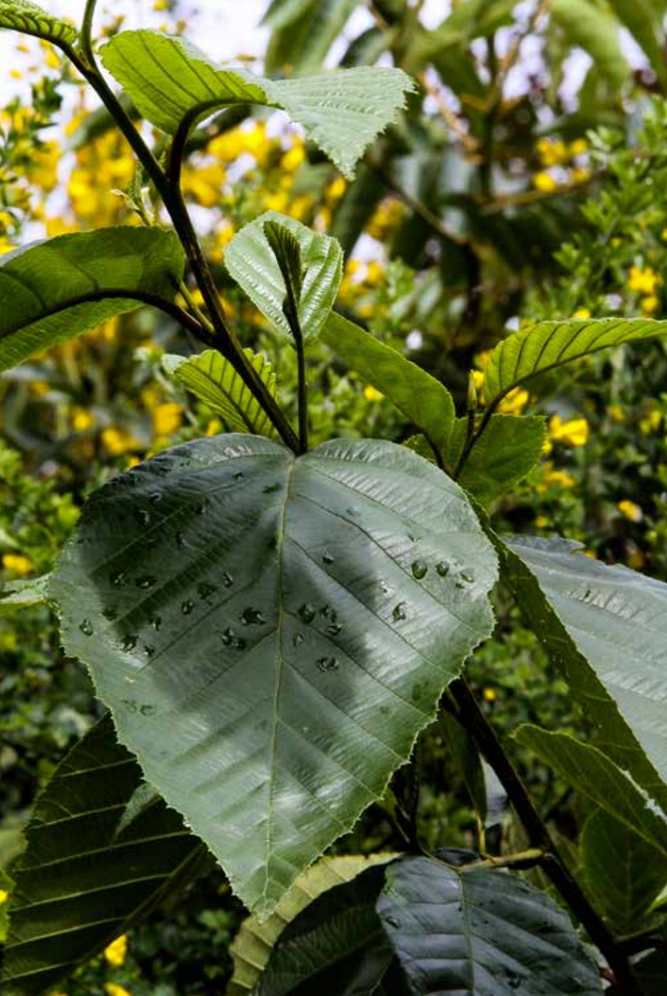
Alnus acuminata Kunth