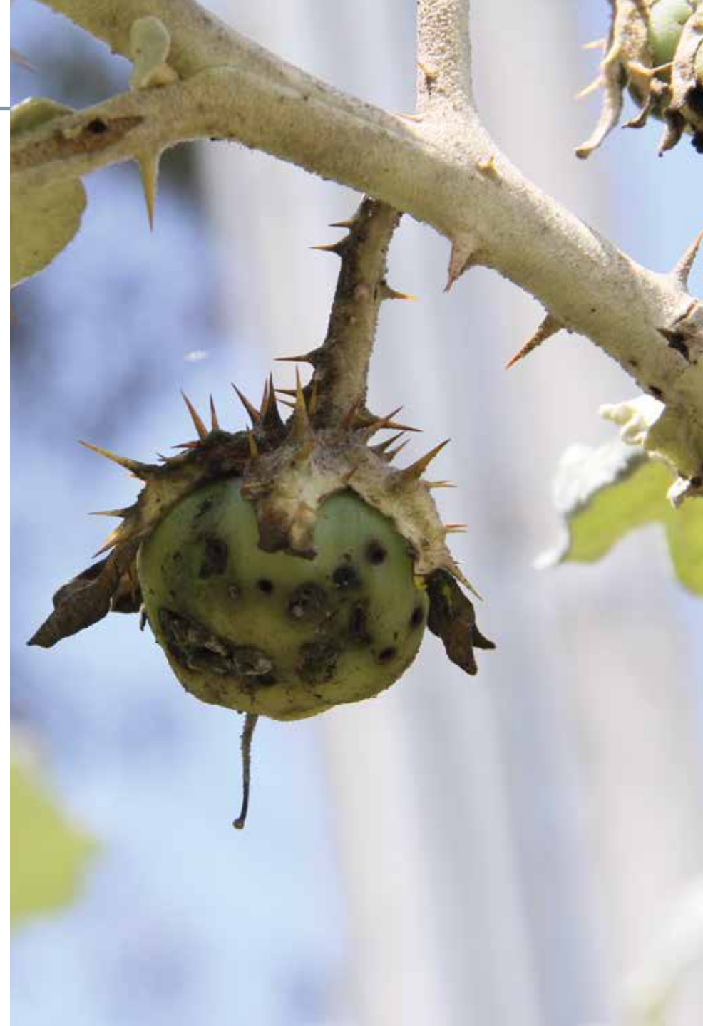
Solanum quitoense Lam.

Información química y farmacológica: El fruto de la especie es rico en carotenoides y compuestos polifenólicos [371-372], poliamidas derivadas de la espermidina [373] y componentes volátiles [374]. Se destaca su actividad antioxidante [375] y anticancerígena [376].