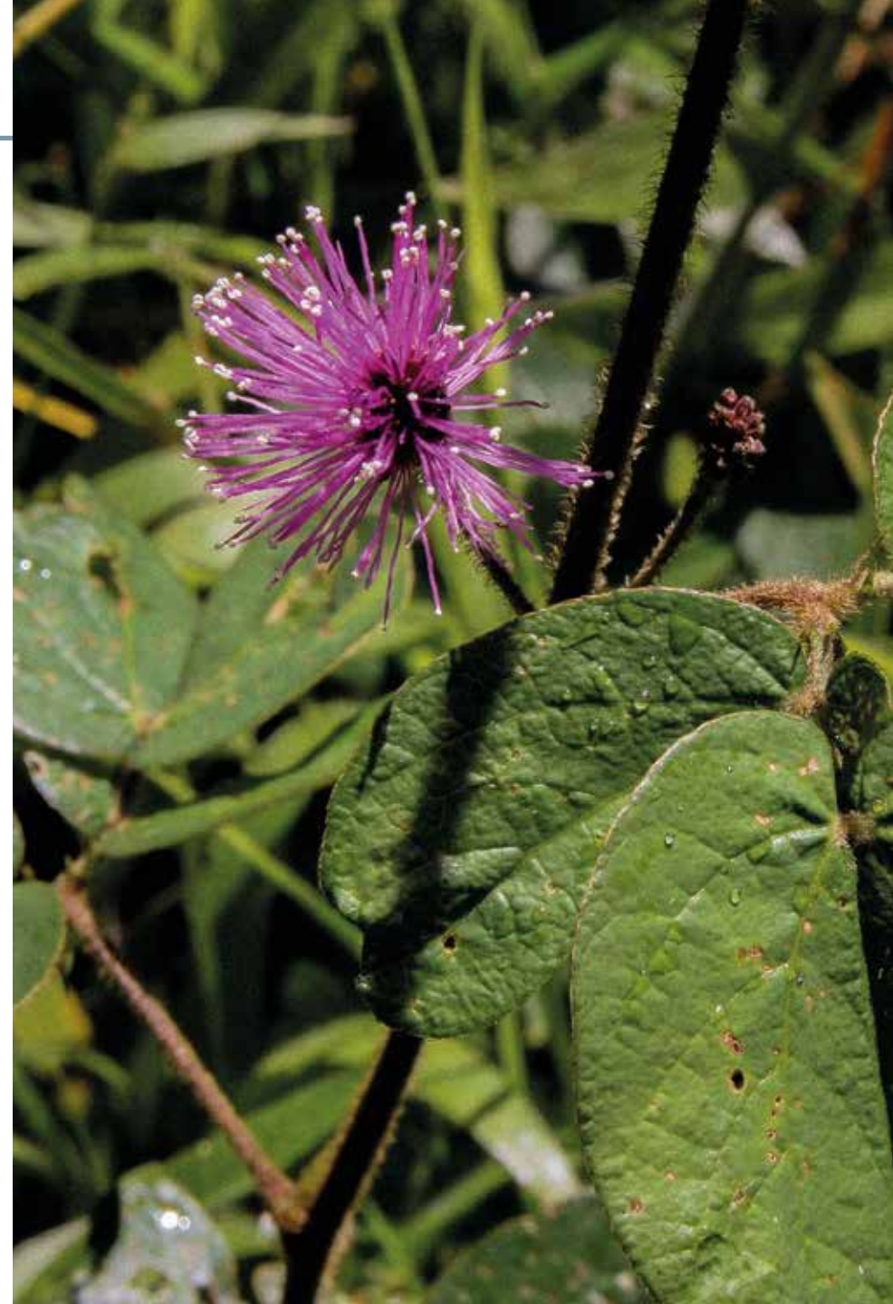
Mimosa albida Humb. & Bonpl. ex Willd.

Información química y farmacológica: Se ha detectado en la especie la presencia de flavonoides [225]. Como estudios de relevancia tenemos la evaluación de su capacidad antioxidante [225], y analgésica [226].