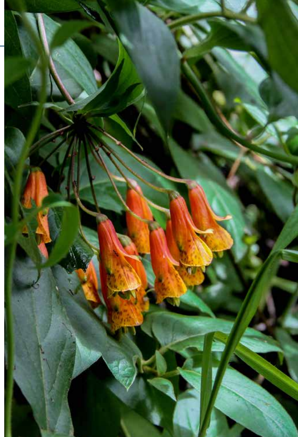
Bomarea multiflora (L. f.) Mirb

Información química y farmacológica: En la literatura científica no se encuentra información química ni farmacológica de la especie.