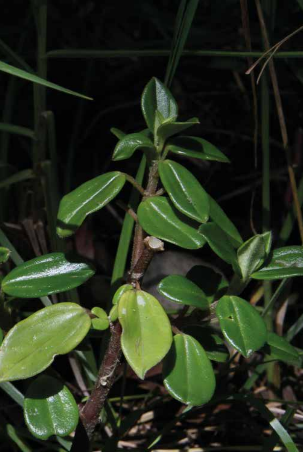
Peperomia fruticetorum C. DC.