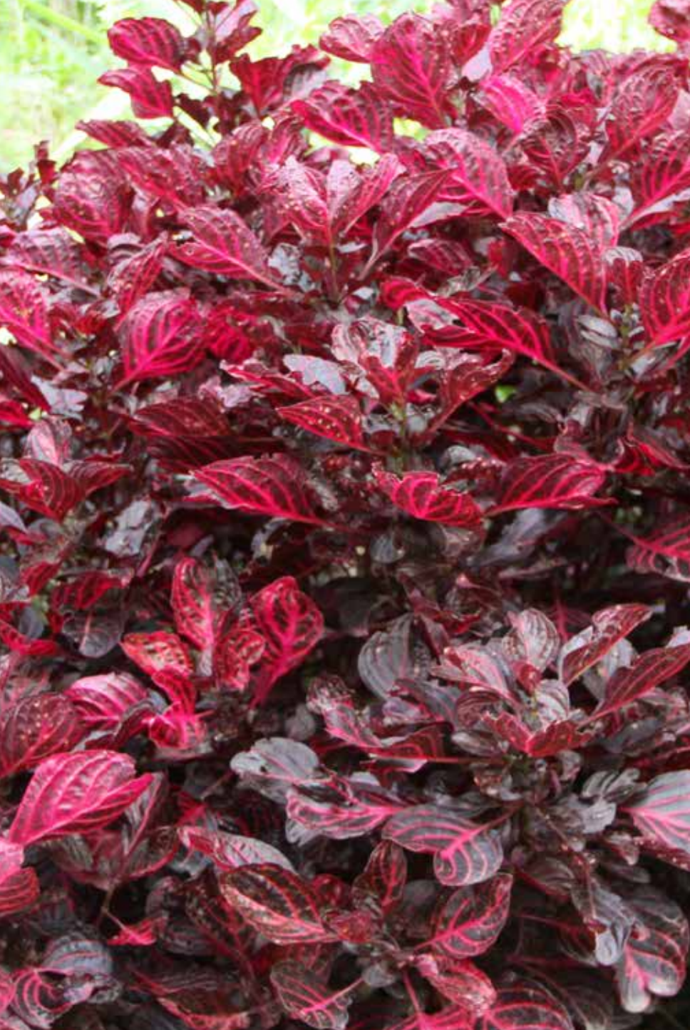
Aerva sanguinolenta (L.) Blume.