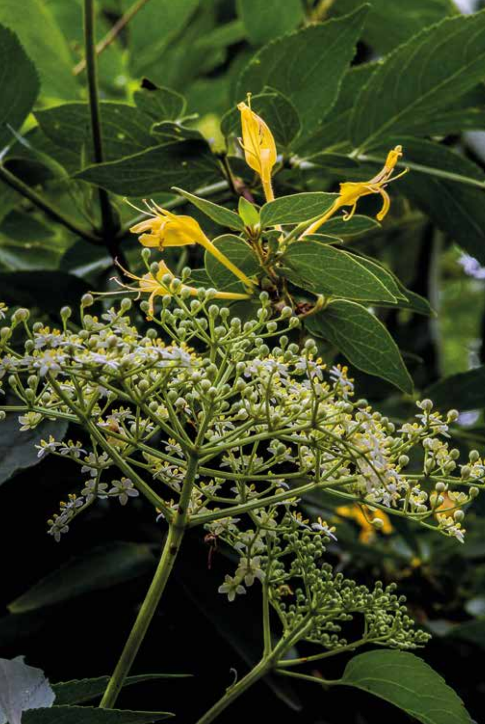
Tilia platyphyllos Scop.