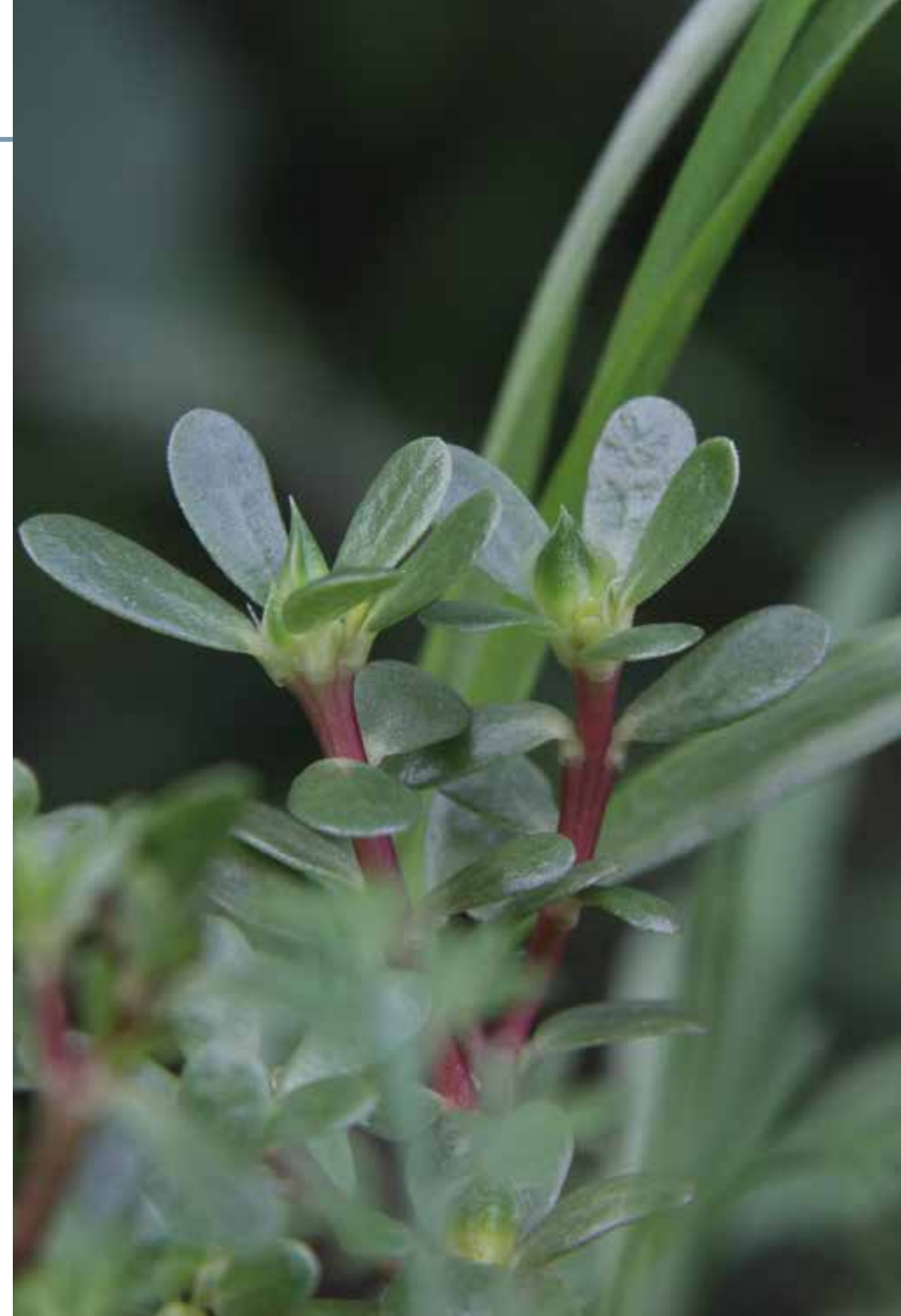
Portulaca oleracea L.

Información química y farmacológica: En la especie encontramos alcaloides [303], ácidos grasos [304], azúcares [305], flavonoides [306] y terpenos [307]. Han sido comprobados sus efectos antifúngicos [308], antioxidantes [309], anticancerígeno [310], antidiabético [311], antiinflamatorio y analgésico [312] y broncodilatador [313].