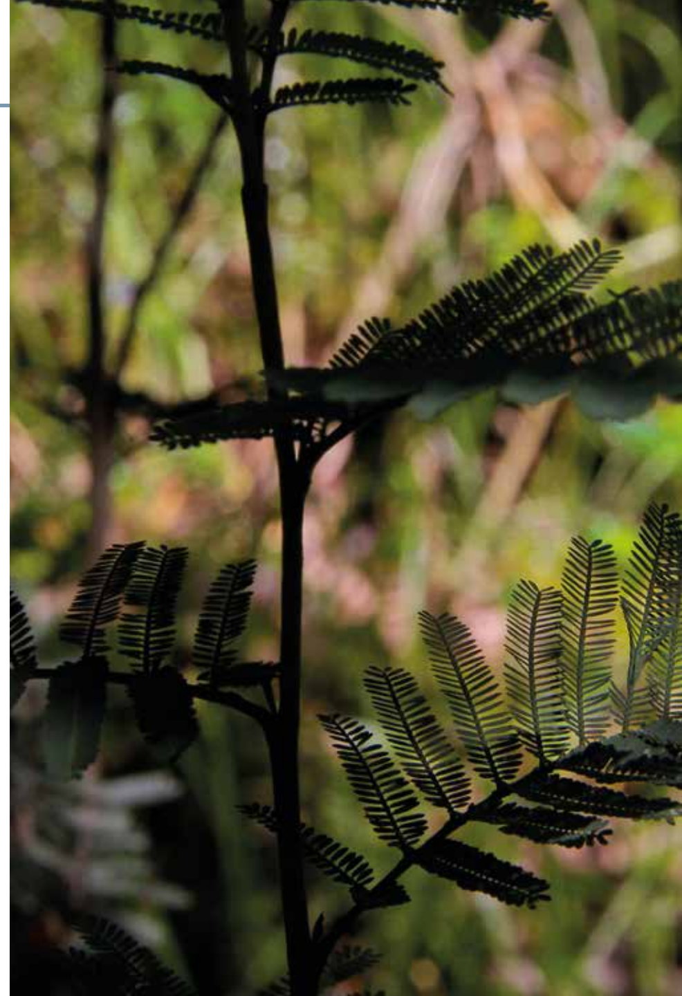
Vachellia macracantha (Humb. & Bonpl. ex Willd.) Seigler & Ebinger

Información química y farmacológica: En la literatura científica es escasa la información química y farmacológica de la especie.