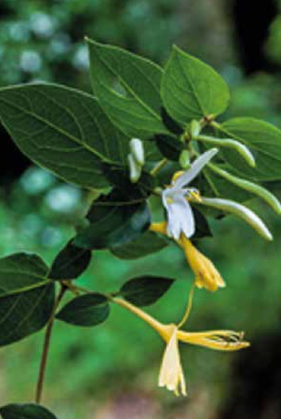
Solanum americanum Mill.