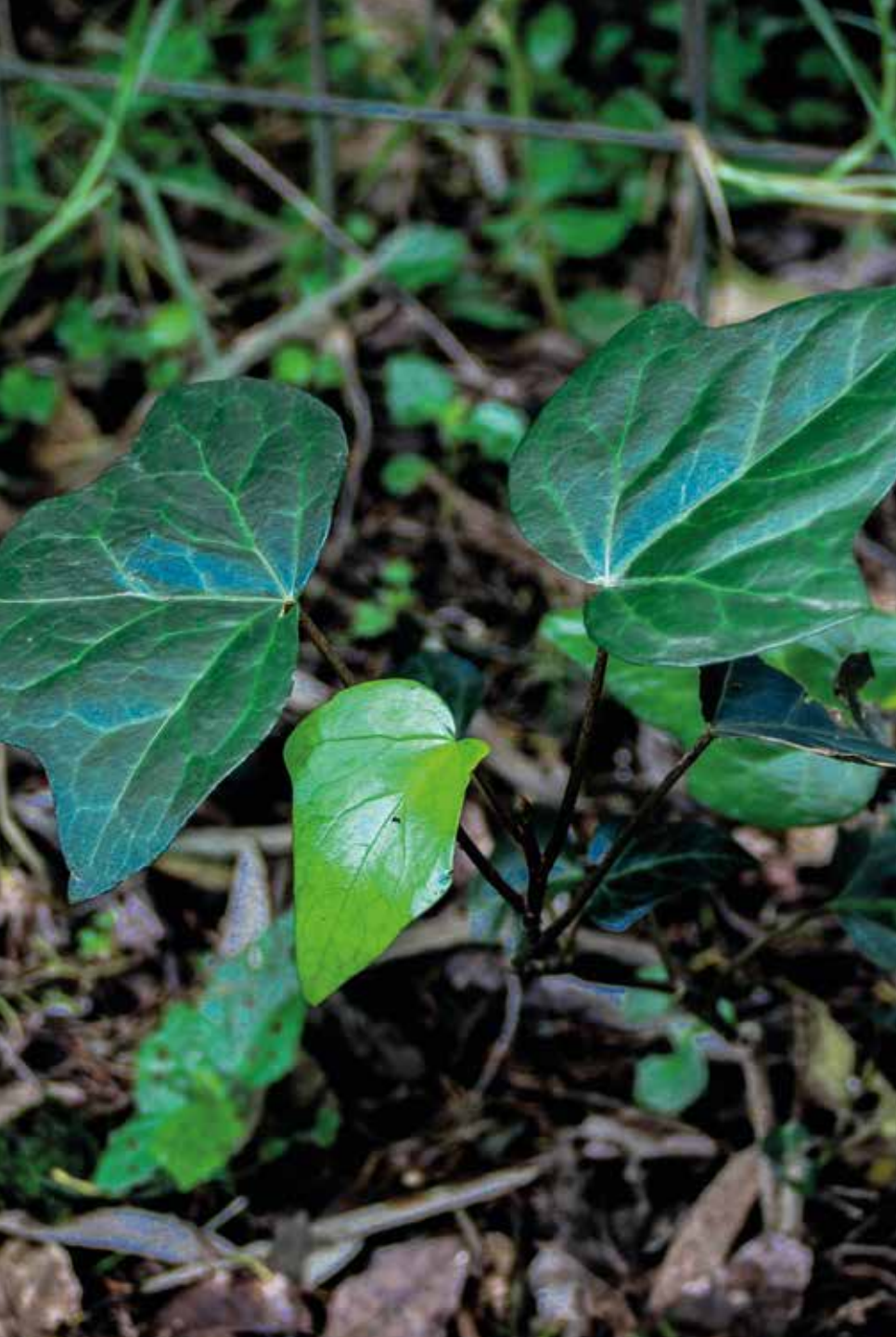
Hedera helix L.