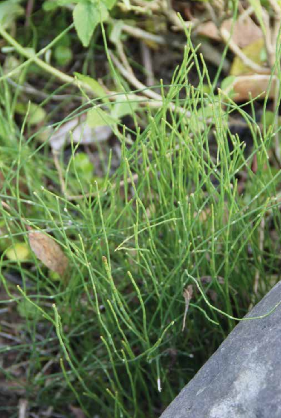
Equisetum arvense L.