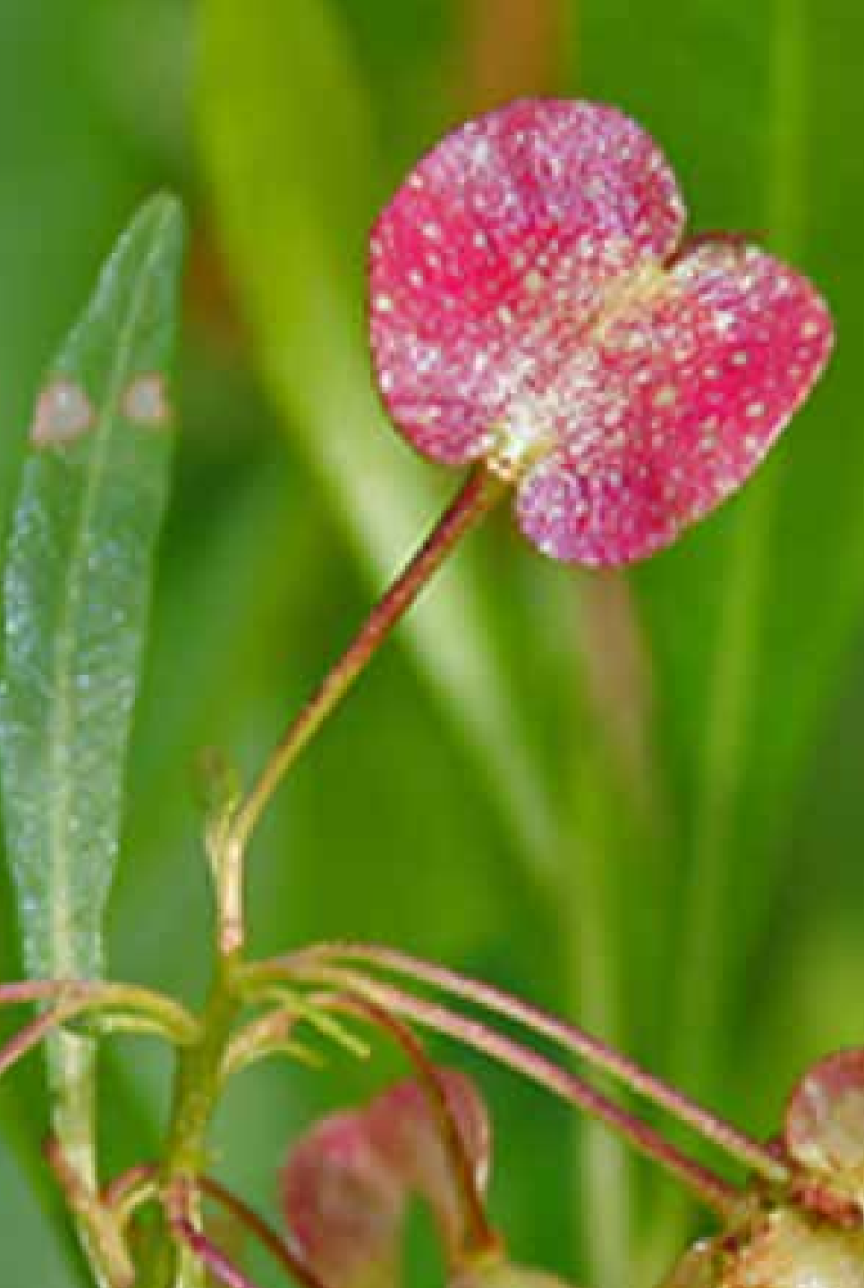
Dodonaea viscosa Jacq.