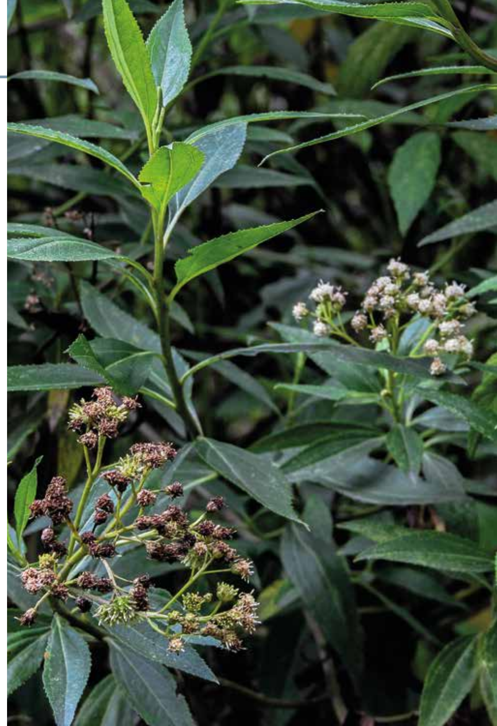
Ligustrum vulgare L.

Información química y farmacológica: En la planta se evidencia la presencia de alcaloides de naturaleza piridínica [202], secoiridoides y flavonoides [203], saponinas y taninos [204]. Han sido evaluadas sus propiedades antioxidantes [205] y citotóxicas [206].