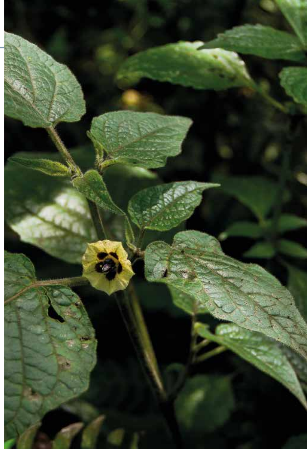
Physalis peruviana L.

Información química y farmacológica: En la especie se resalta su contenido de vitaminas K, A y C [287] y compuestos polifenólicos [288]. Se destaca su actividad antimicrobiana [289], antioxidante [288], anticancerígena [290], hepatoprotectora e hipoglucemiente [291].