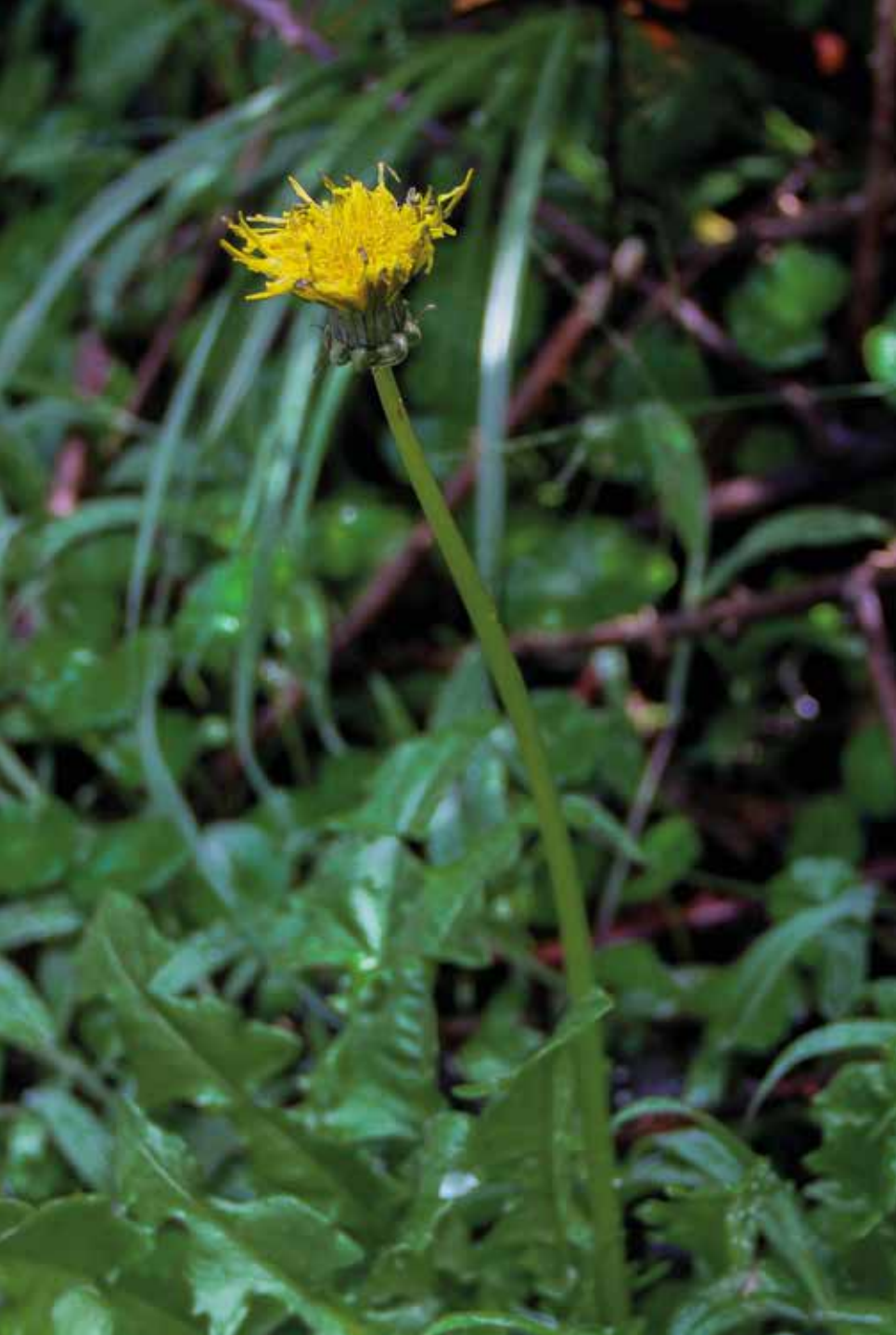
Taraxacum officinale F.H. Wigg.