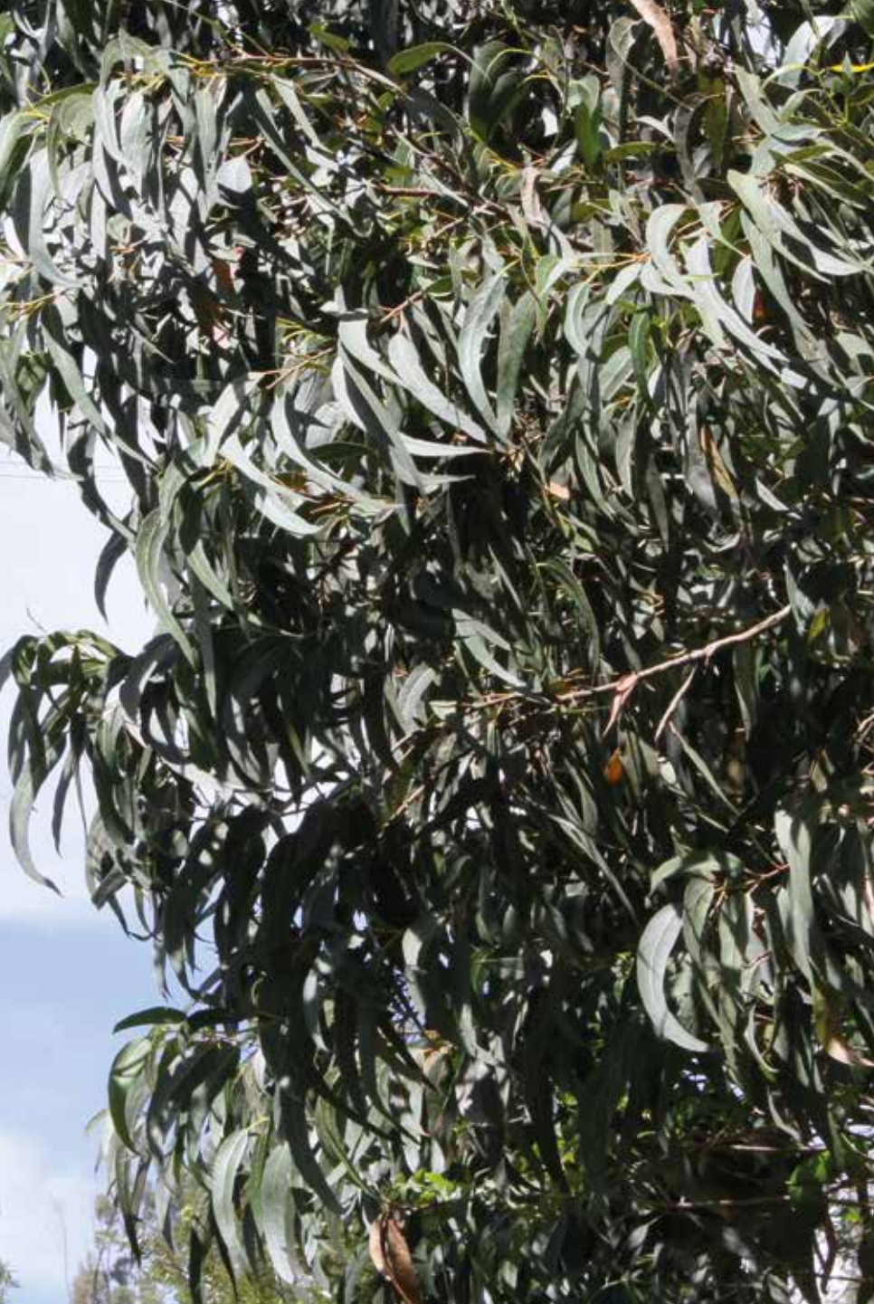
Eucalyptus globulus Labill