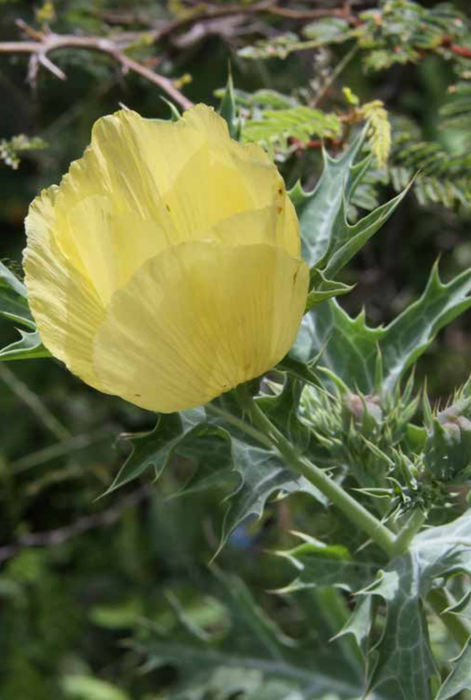
Argemone mexicana L.