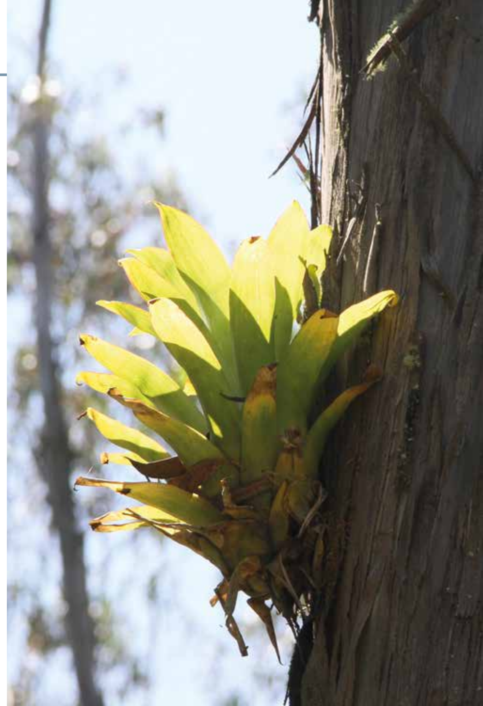
Racinea pseudotetrantha (Gilmartin & H. Luther) J.R. Grant

Información química y farmacológica: En la literatura científica no existe información química o farmacológica de la especie.