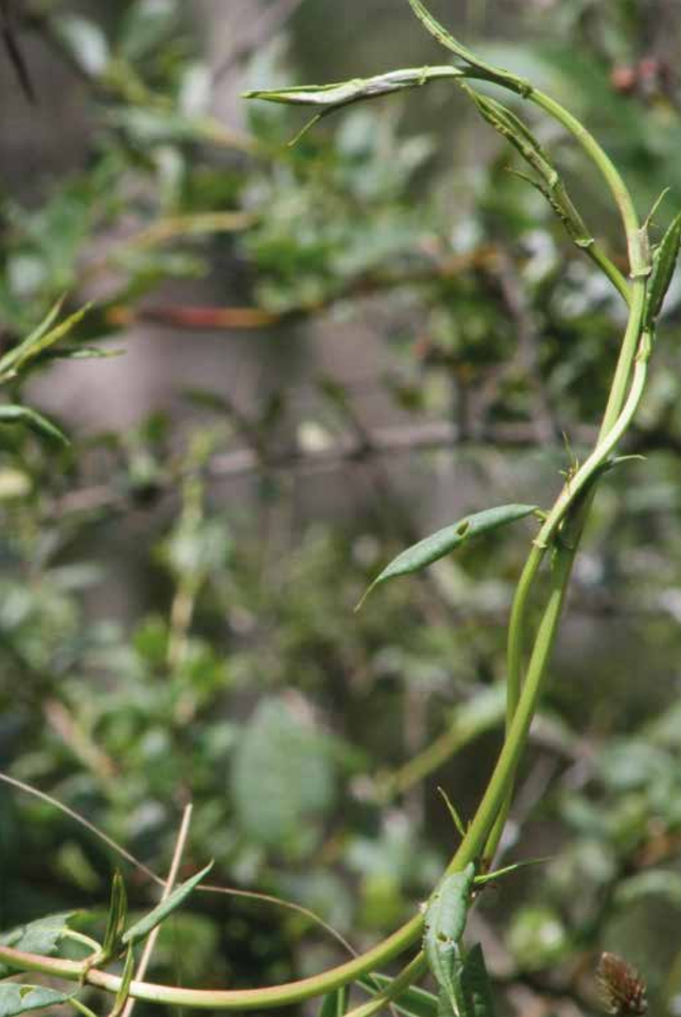
Petiveria alliacea L.