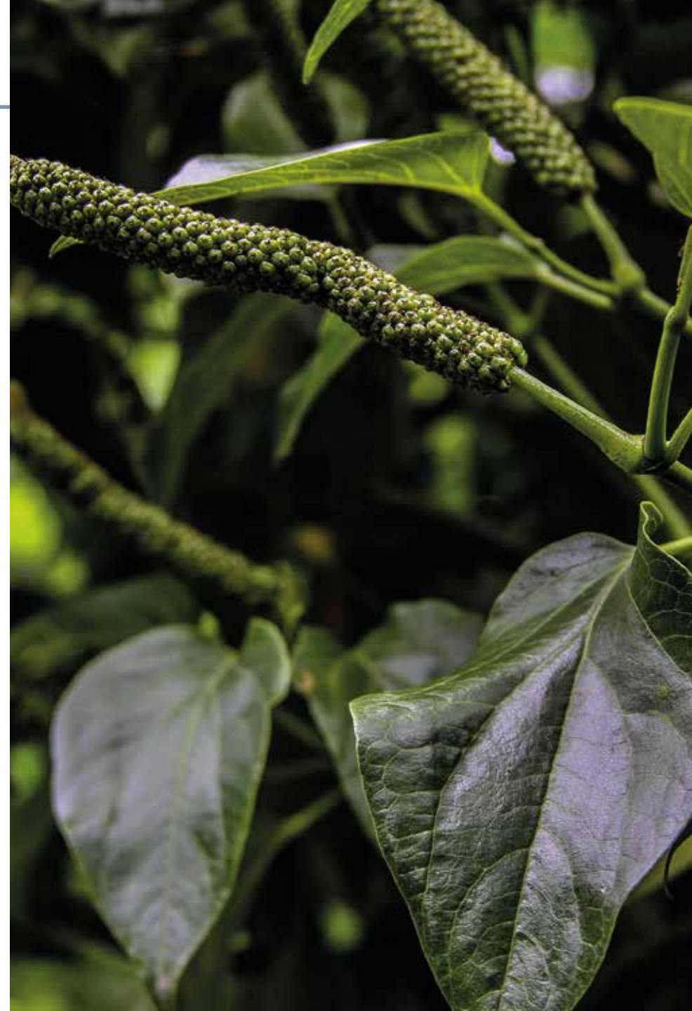
Piper barbatum Kunth

Información química y farmacológica: Contiene aceites esenciales en sus hojas, se destaca la presencia del 2-metoxi-4,5-metilen dioxipropiofenona, \alpha y \beta azarona y piperitona [295]. No se reportan estudios de actividad biológica.