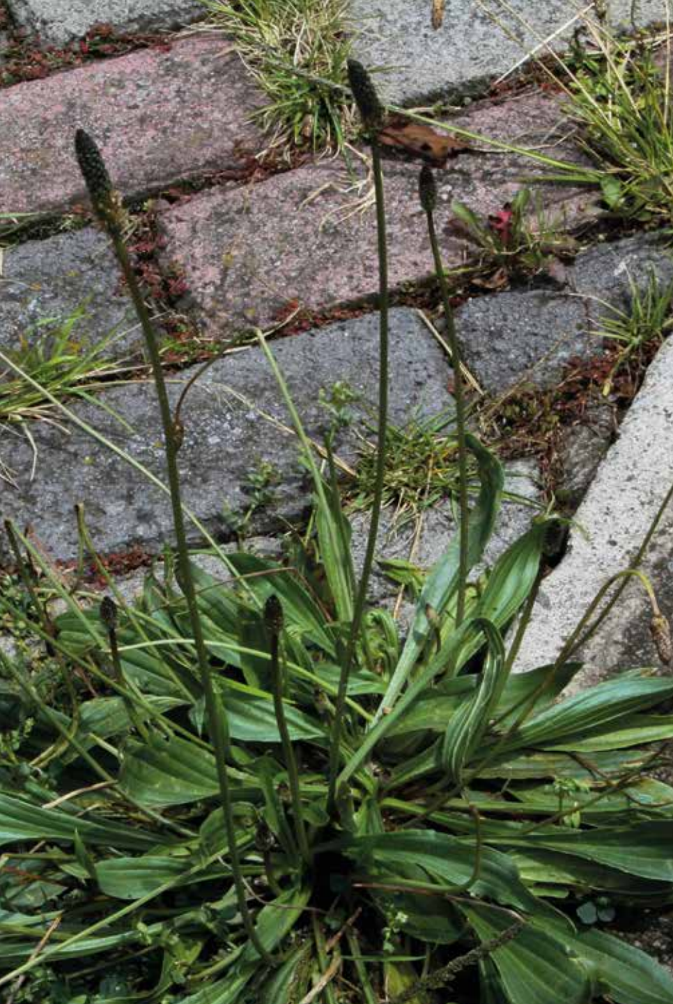
Plantago major L.