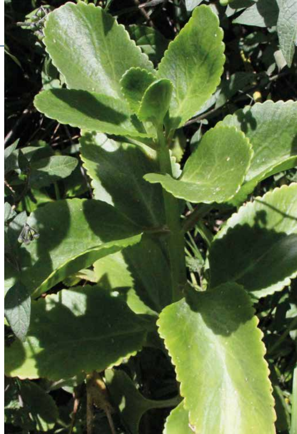
Kalanchoe daigremontiana Raym.-Hamet & H. Perrier

Información química y farmacológica: En la planta se encuentran compuestos bufadienólicos los cuales evidencian un interesante efecto antioxidante [195].