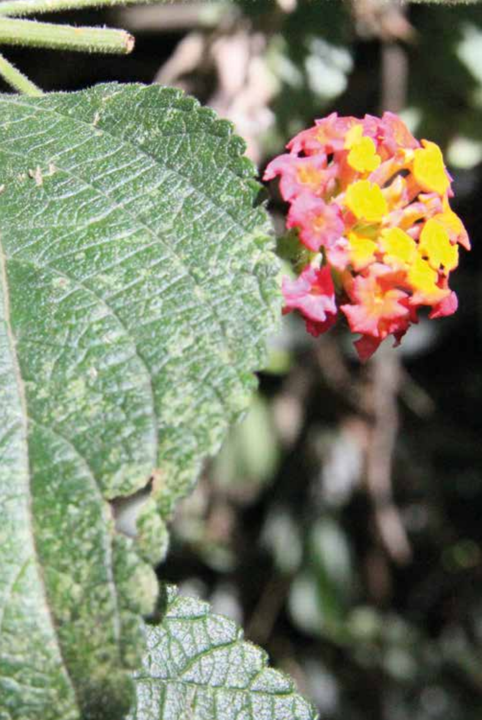
Lantana camara L.