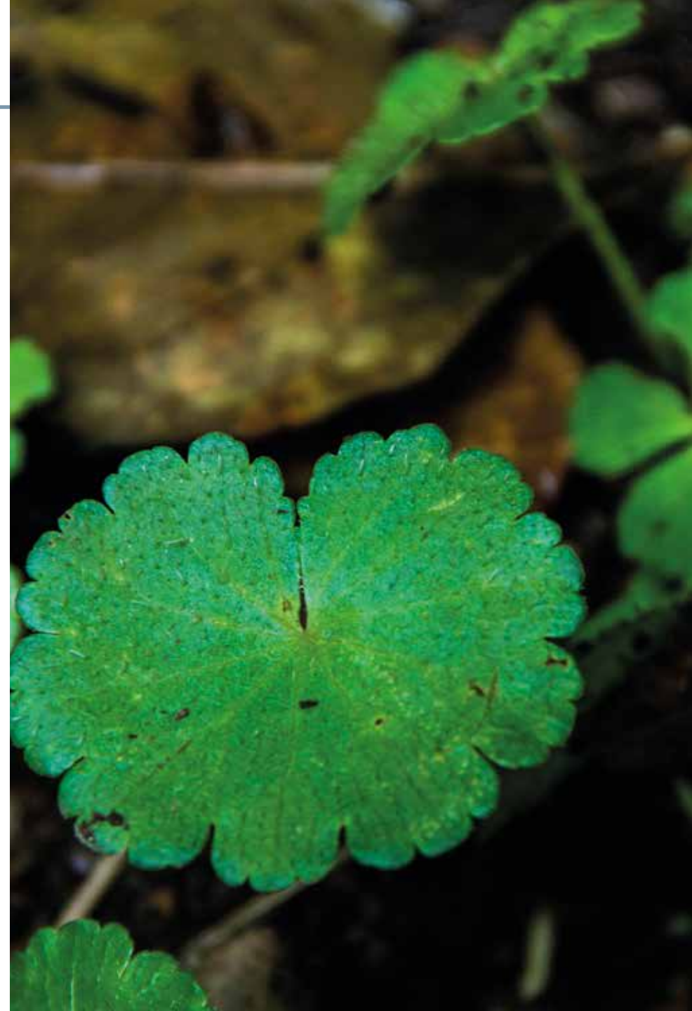
Hydrocotyle bonplandii A. Rich.

Información química y farmacológica: No existe en la literatura científica información química y farmacológica de la especie.