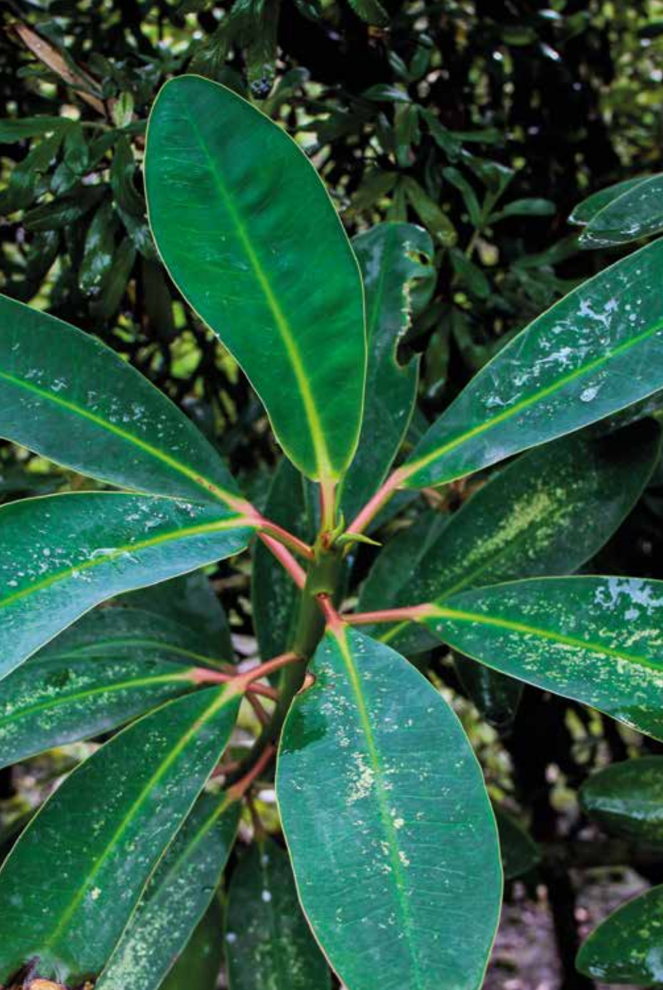
Euphorbia laurifolia Juss. ex Lam.