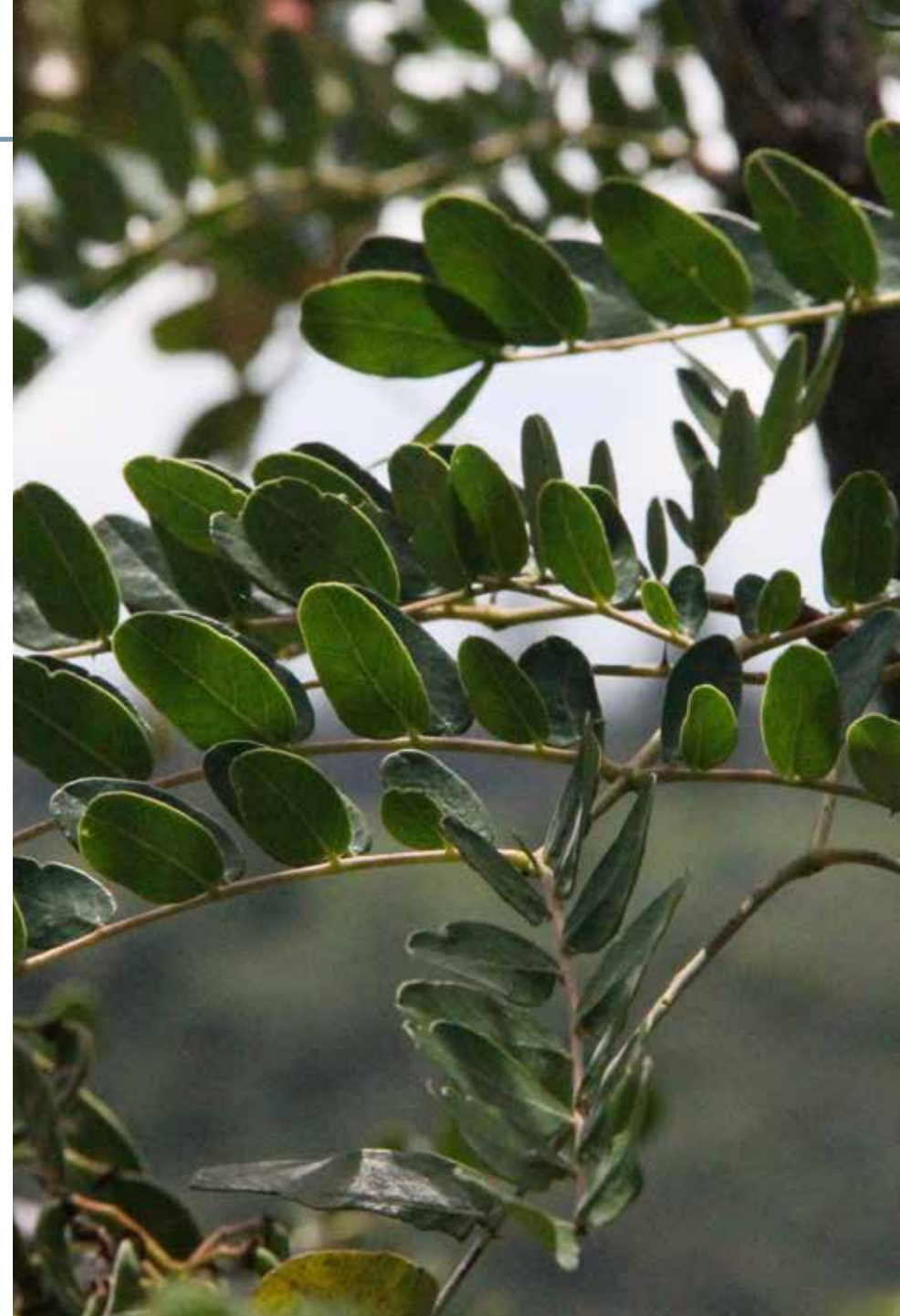
Caesalpinia spinosa (Molina) Kuntze

Información química y farmacológica: En la especie encontramos compuestos polifenólicos sobresaliendo los galotaninos y flavonoides [39-40], se reporta también la presencia de polisacáridos [41]. Diversos estudios validan propiedades antimicrobianas [40], antioxidantes [39], antitumorales [42] e inmunomoduladora [41].