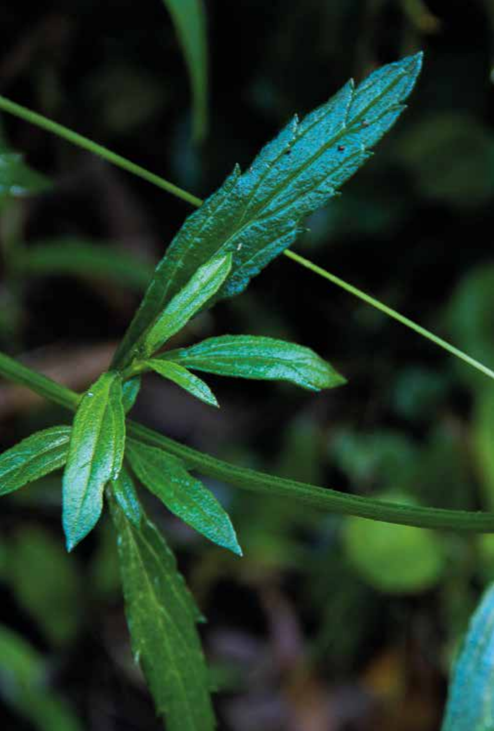
Verbena litoralis Kunth