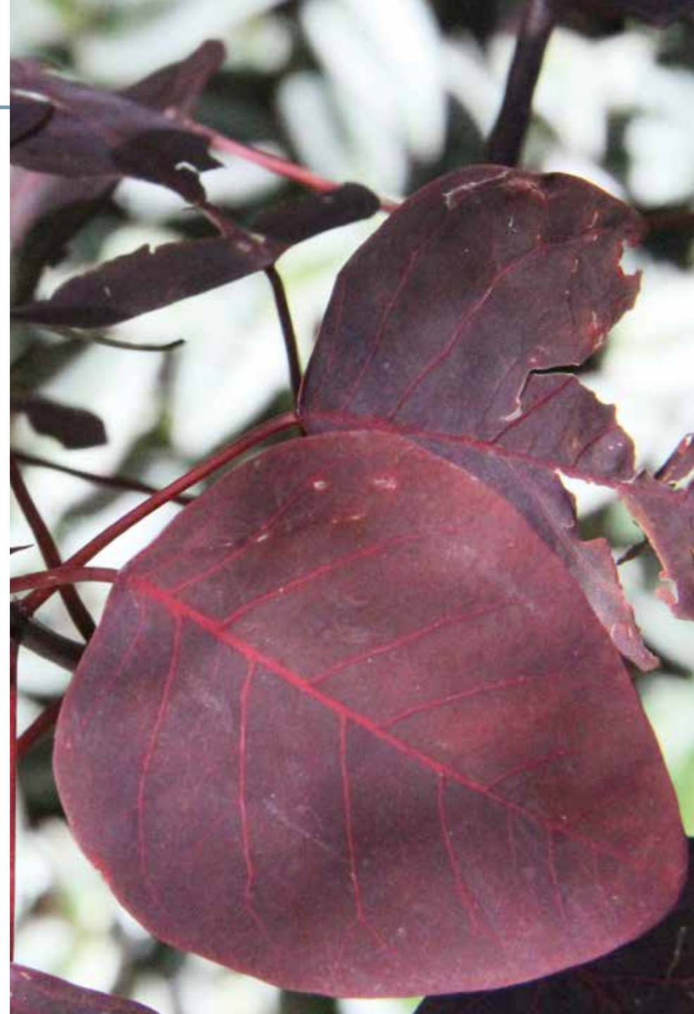
Euphorbia cotinifolia L.

Información química y farmacológica: En la especie encontramos alcaloides [154], compuestos polifenólicos [155], enzimas [156], glúcidos [154] y un éster diterpénico denominado ingenol [157]. Se confirman sus actividades, antimicrobianas [158], plaguicida [159], molusquicida [160] citotóxica en general [161].