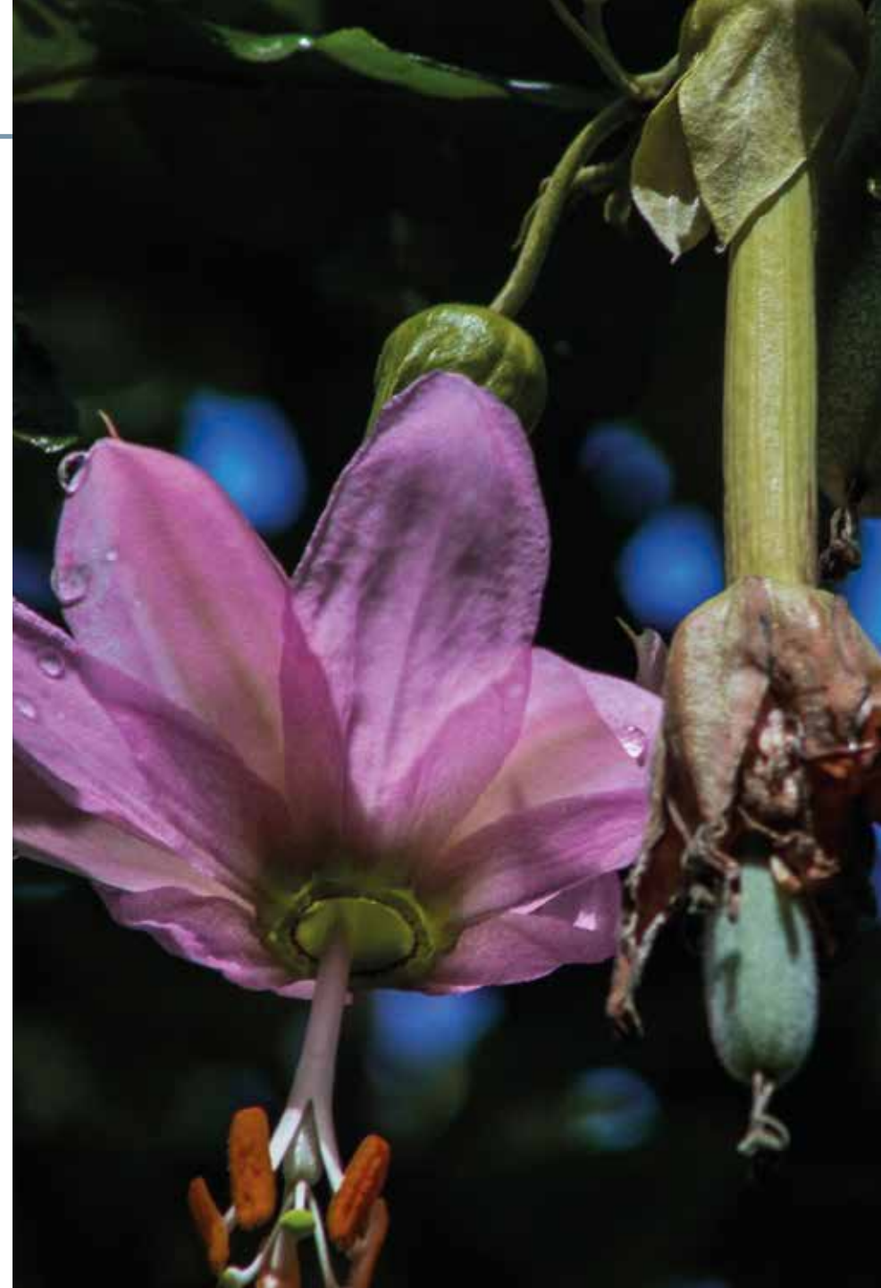
Passiflora tripartita Breit. Hort. ex Steudel

Información química y farmacológica: En las hojas de la especie se han encontrado importantes concentraciones de compuestos fenólicos destacándose los flavonoides como la catequina, quercetina, apigenina y rutina [264-266] y los frutos que son comestibles poseen componentes volátiles como el etil hexanoato y el etil butanoato [267]. Las propiedades son la antiinflamatoria y hepatoprotectora [264-265] y su fruto posee un alto potencial nutraceútico [268].