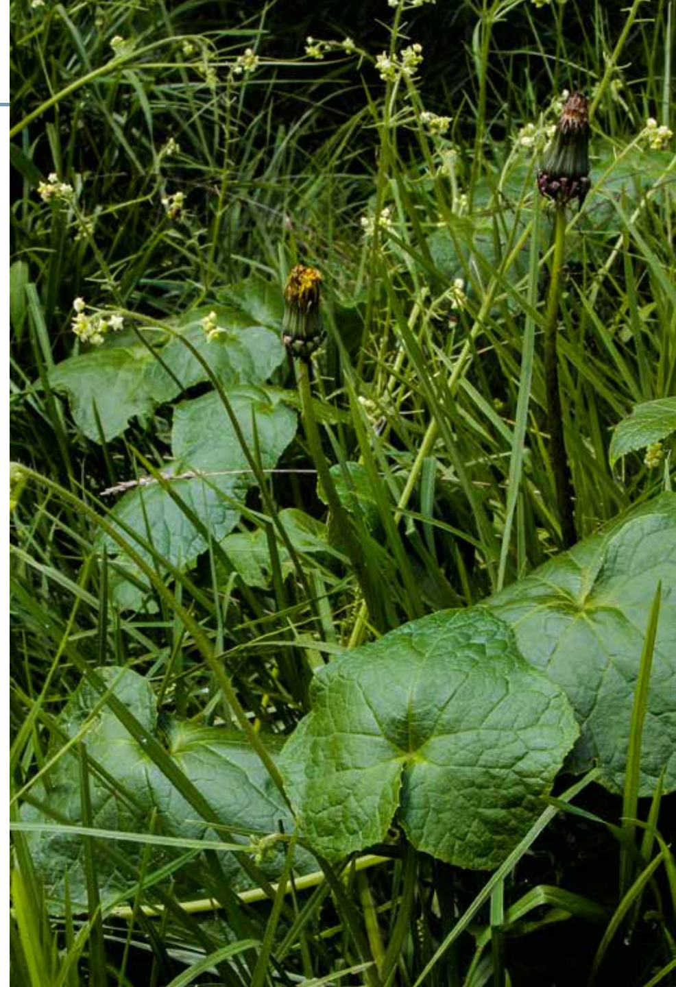
Cyclanthera pedata (L.) Schrad.

Información química y farmacológica: Es destacable la presencia de flavonoides en frutos y flores [86-87], saponinas [88] y esteroles como la curcubitacina [89]. Se han estudiado sus actividades, antioxidante [90], hipoglucemiente e hipotensora [91].