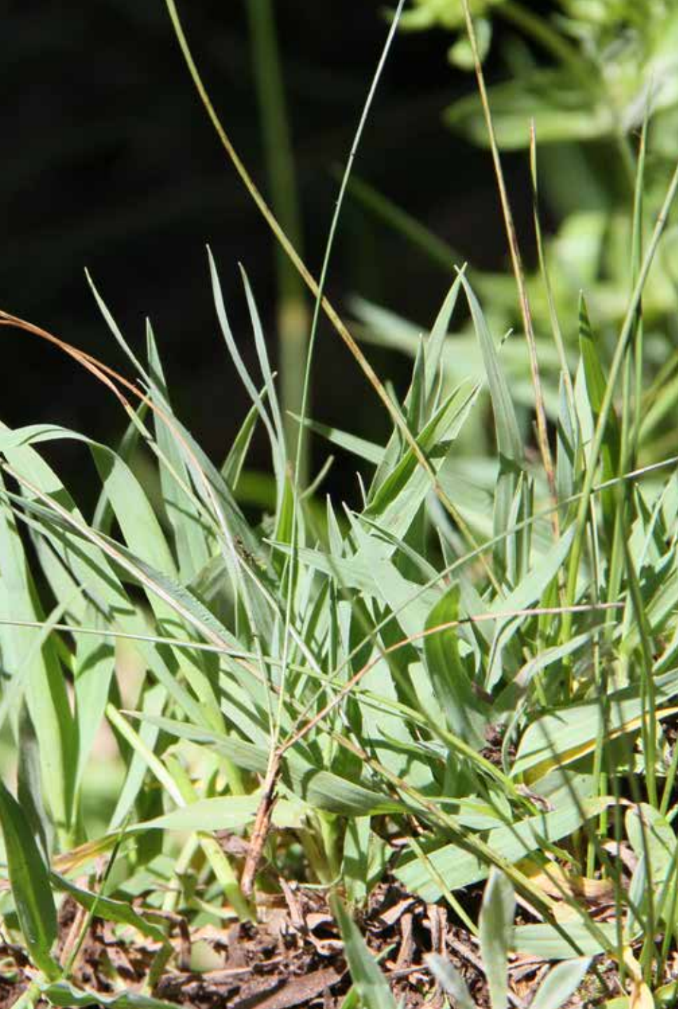
Cynodon dactylon (L.) Pers.