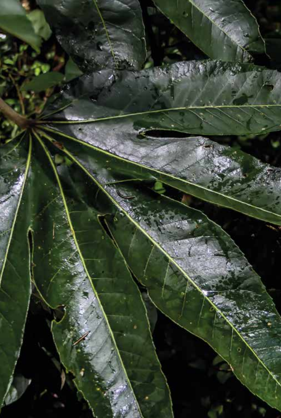
Oreopanax ecuadorensis Seem.