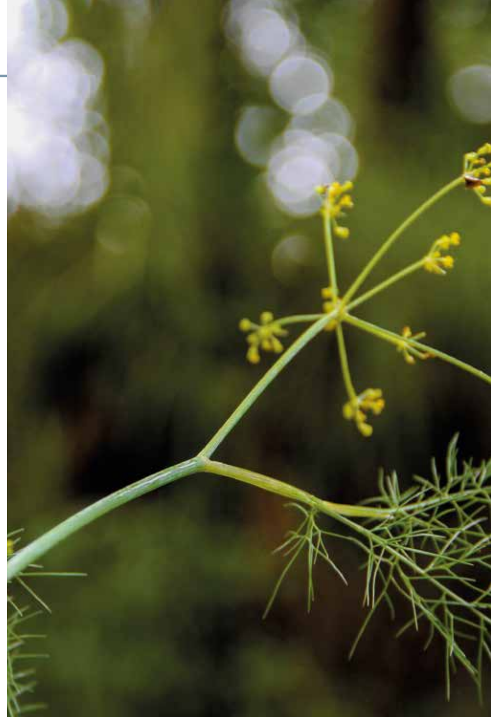
Foeniculum vulgare Mill.

Información química y farmacológica: En la especie se encuentran aceites esenciales [164], alcaloides [165], polifenoles [166] y glucósidos [164]. Se verifican propiedades antimicrobianas [167], antiinflamatoria y analgésica [168], antioxidante y anticancerígena [169], citotóxica [170], hepatoprotectora [171] e insecticida [172].