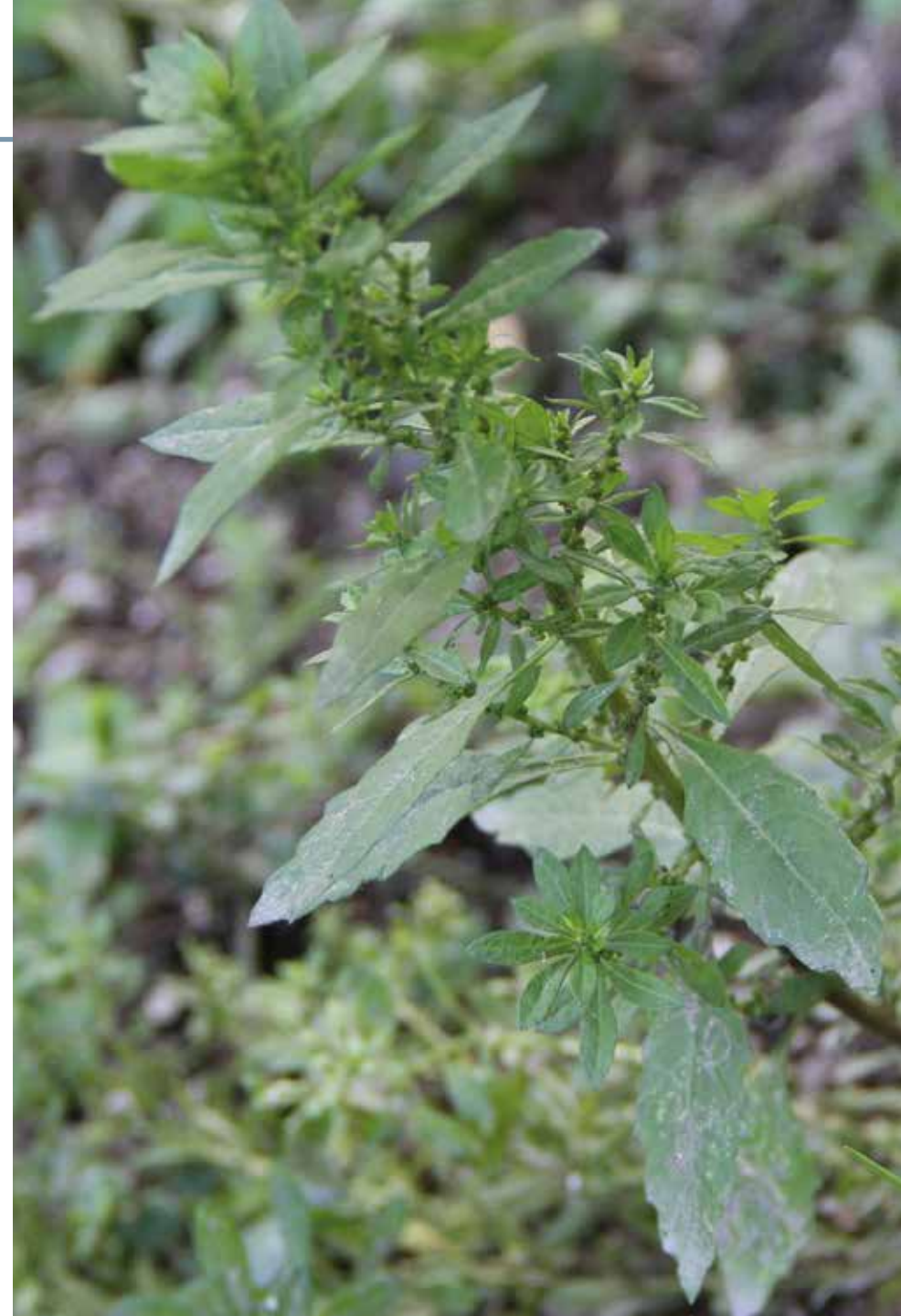
Nepeta cataria L.

Información química y farmacológica: En la planta encontramos aceites esenciales [241], alcaloides [242], lactonas [243], flavonoides y ácidos fenólicos [244]. Se destacan sus propiedades antimicrobianas [245], antioxidantes [245], antifúngicas [246], anticancerígenas [247], analgésicas y antiinflamatorias [248] y antidiabéticas [249].