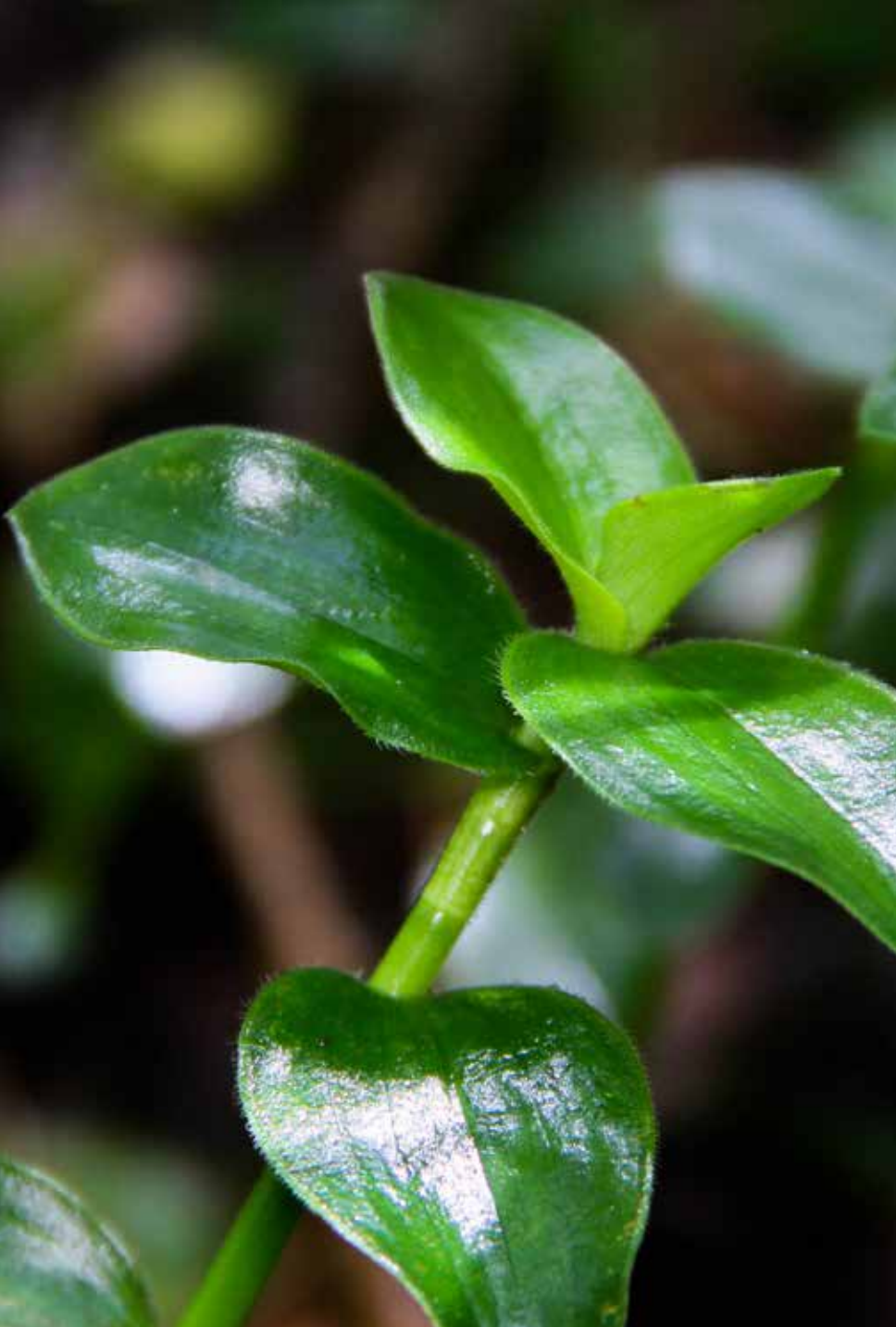
Commelina diffusa Burm. f.