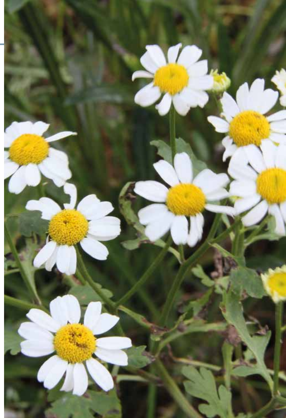
Tanacetum parthenium (L.) Sch. Bip.

Información química y farmacológica: En la planta se ha detectado la presencia de polifenoles [411], y lactonas sesquiterpénicas en las que se destaca la partenolida [412]. Desde el punto de vista medicinal posee propiedades antioxidantes [411], anticancerígenas [412], antiinflamatoria [413], antiagregante plaquetario [414] y anti protozoárico [415].