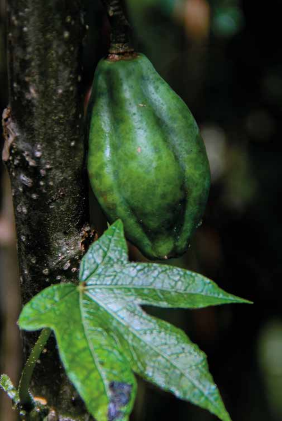
Vasconcellea pubescens A. DC.