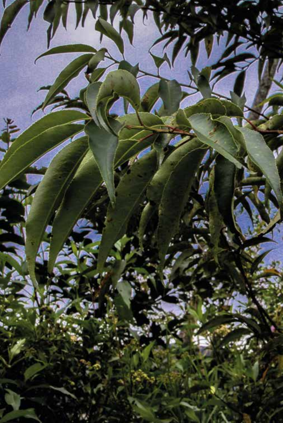
Prunus serotina Ehrh.