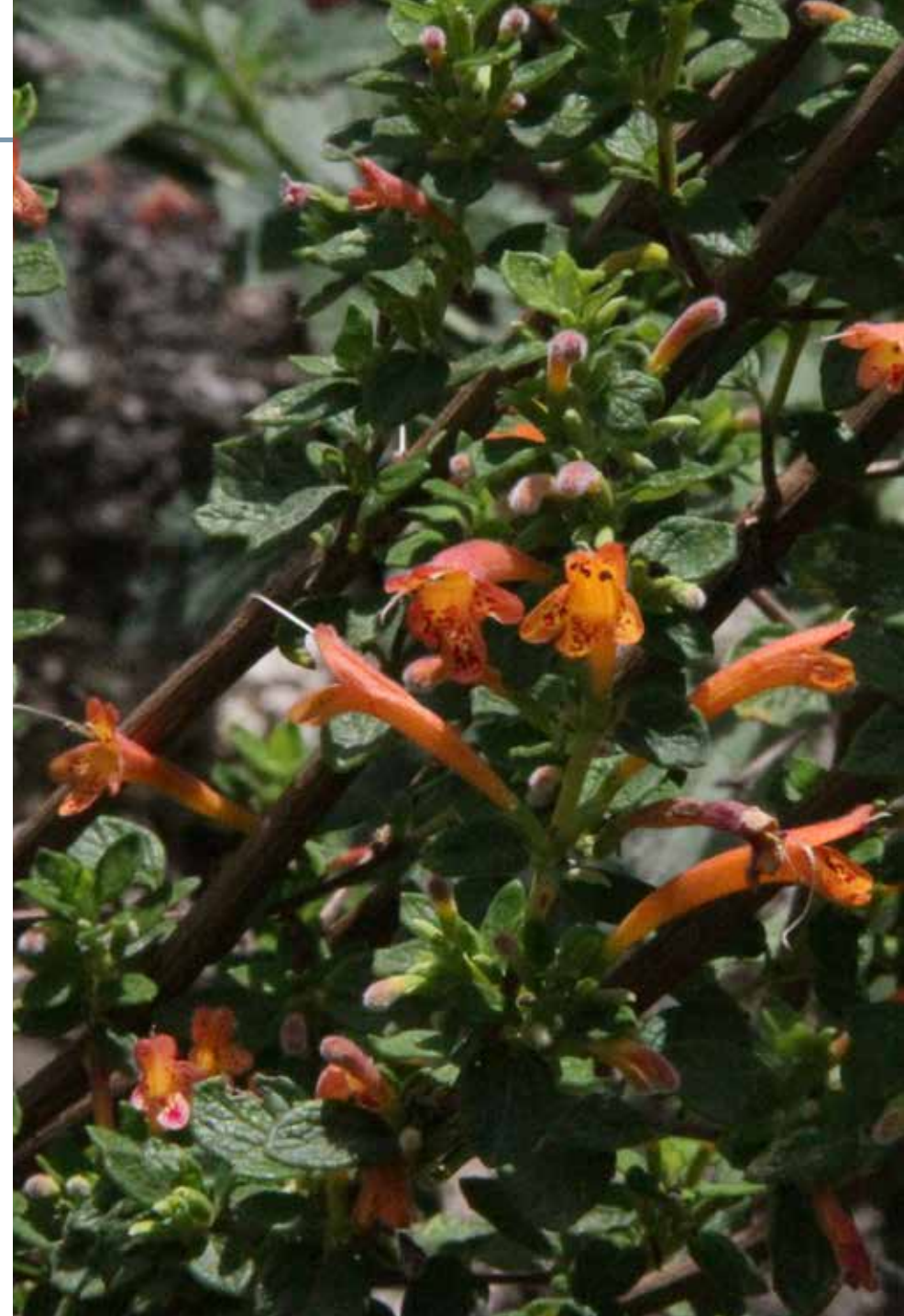
Clinopodium tomentosum (Kunth) Govaerts

Información química y farmacológica: La especie contiene aceite esencial abundante en isomentona y pulegona [59], y compuestos polifenólicos [60]. Existe poca investigación de actividad biológica en la planta, un estudio evalúa su potencial antiinflamatorio [61].