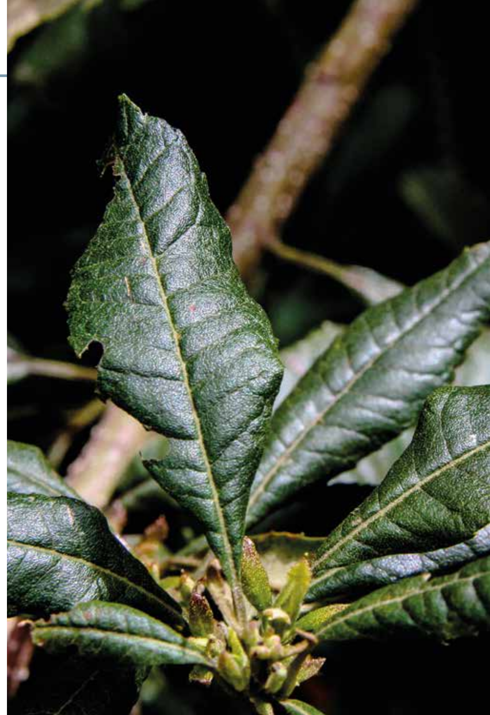
Morella pubescens (Humb. & Bonpl. ex Willd.) Wilbur

Información química y farmacológica: Contienen aceites esenciales en hojas y frutas en donde los componentes mayoritarios son el germacreno D, seguido del selina-3,7(11)-dieno y el cadineno [227]. La planta no tiene investigación farmacológica.