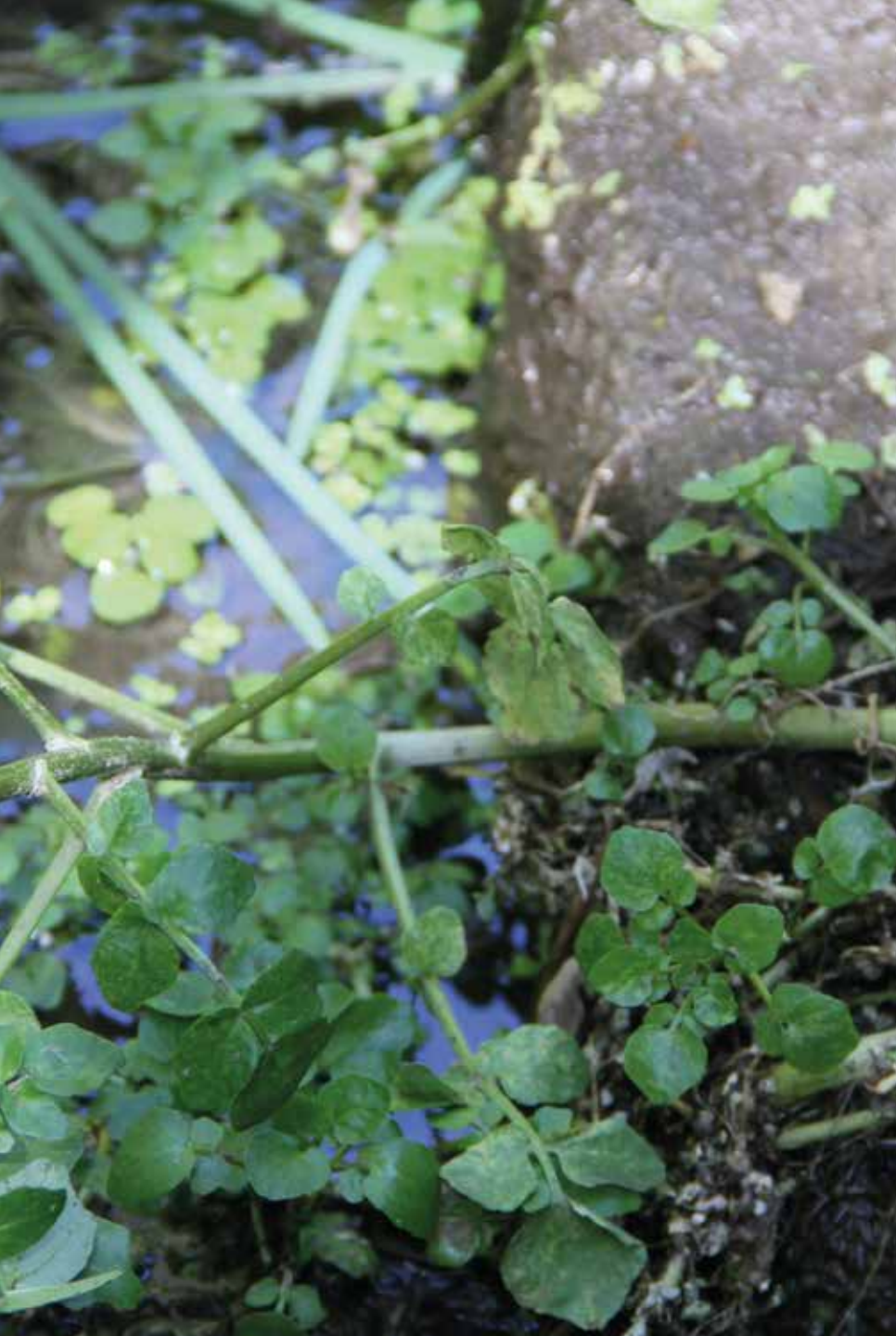
Nasturtium officinale W.T. Aiton