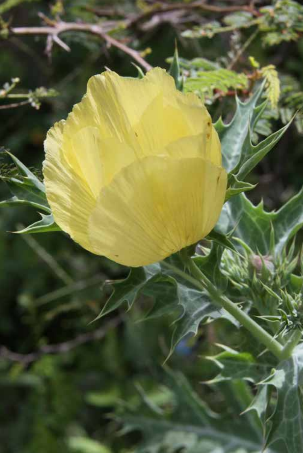
Datura stramonium L.