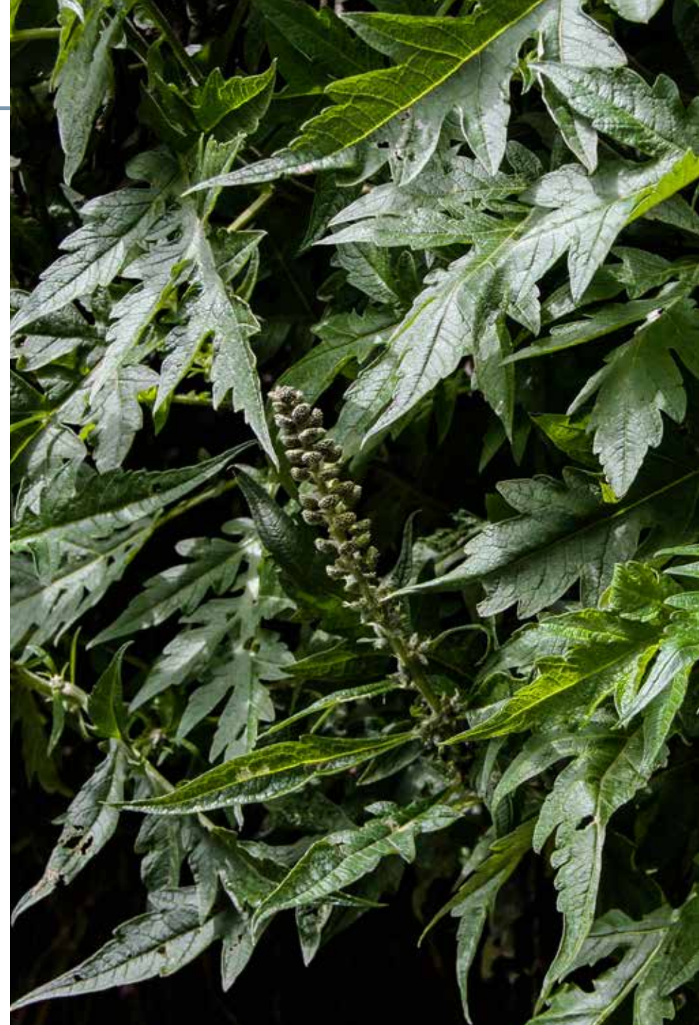
Ambrosia peruviana Willd.

Información química y farmacológica: La planta contiene aceite esencial rico en sesquiterpenos [19-20] y lactonas sesquiterpénicas [21], se destaca la presencia de alloromandreno 4- \beta , alloromandreno 10 \alpha diol, psilostacinas C y B, ambrosina y damicina contiene un pseudoguanidol denominado peruvina [22]. La planta posee propiedades antimicrobianas [23-24] y citotóxicas [20].