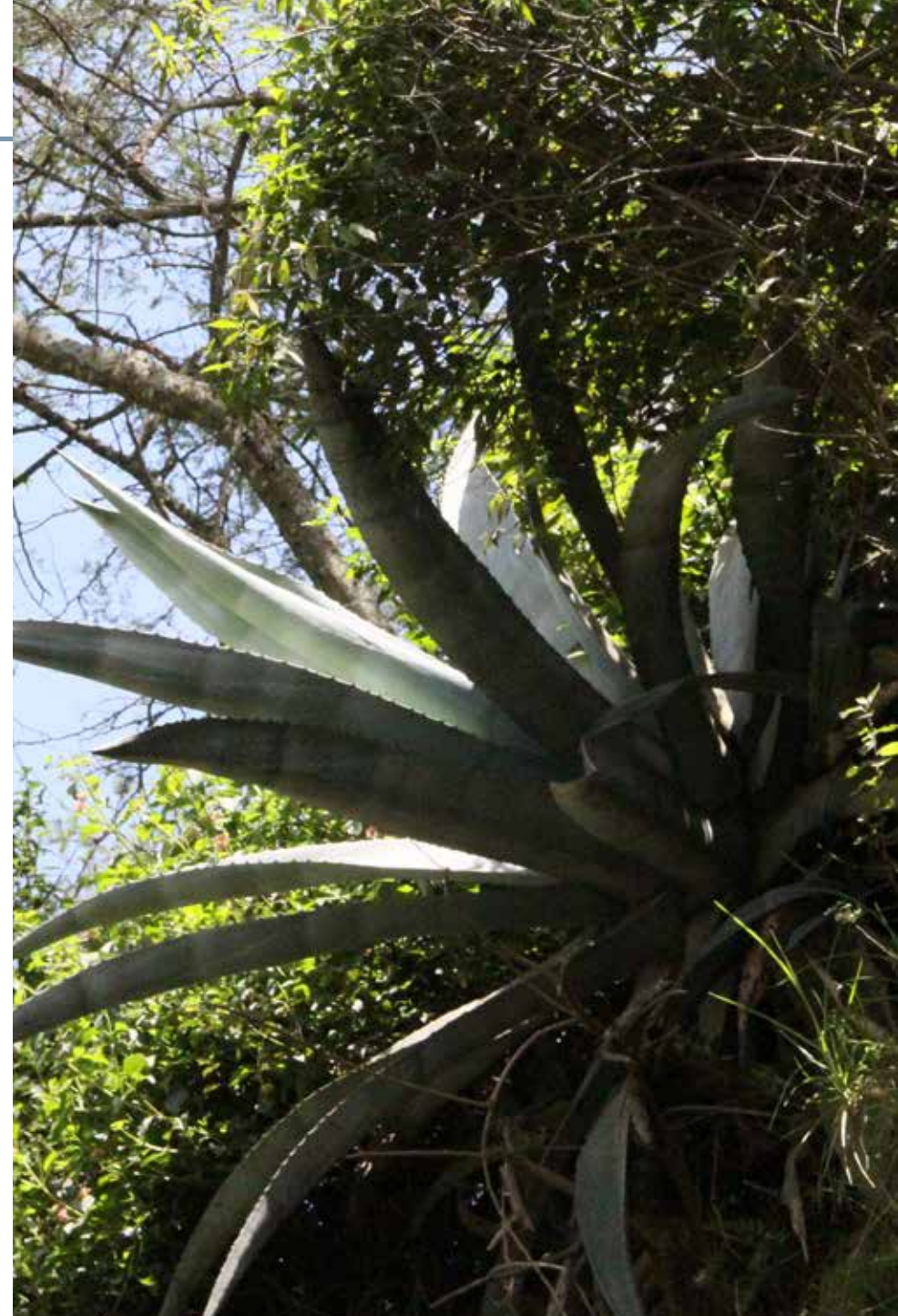
Agave americana L.

Información química y farmacológica: En la planta se destaca la presencia de glucósidos [9], flavonoides [10], flavonas [11], saponinas [12-13] y esteroides [14]. Posee actividades, antimicrobiana [15-16], antiparasitaria [17] y antidiabética [18].