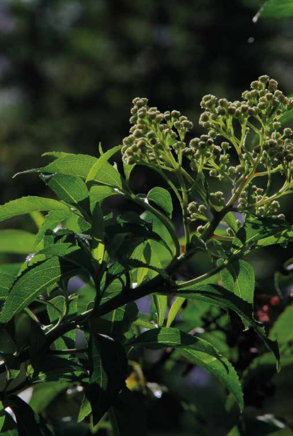
Sambucus nigra L.