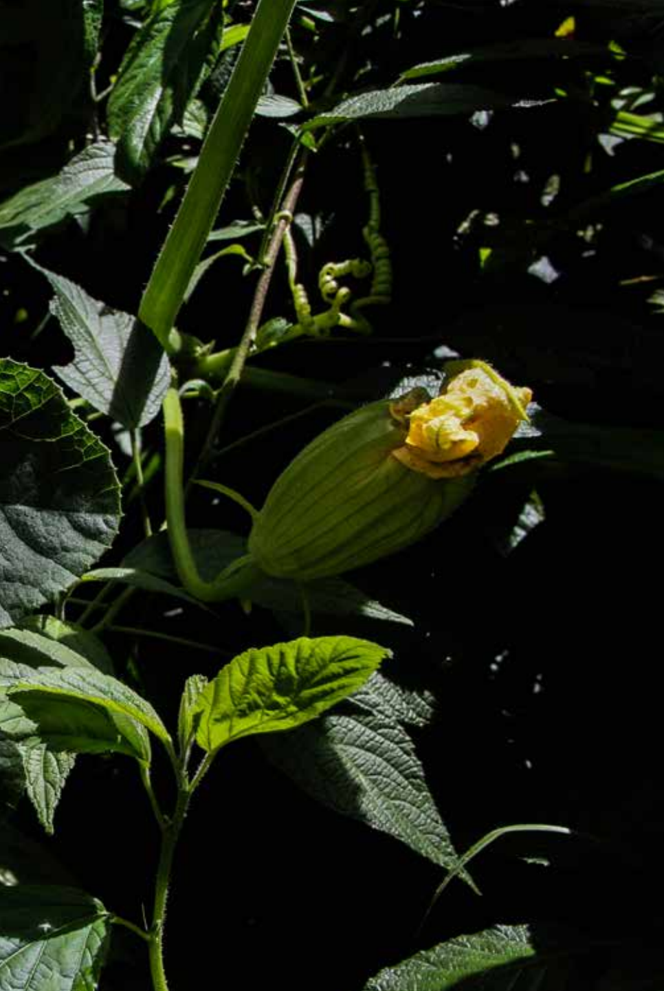
Cucurbita ficifolia Bouché