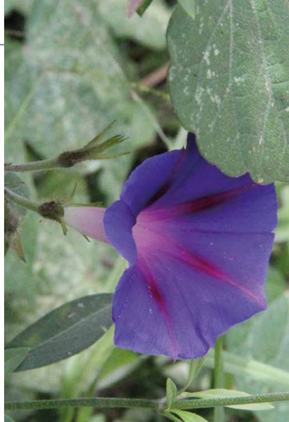
Ipomoea purpurea (L.) Roth

Información química y farmacológica: Los componentes sobresalientes en la especie son los alcaloides derivados de la ergolina [186-187]. Son notorios sus efectos alucinógenos y convulsionantes [187-188].