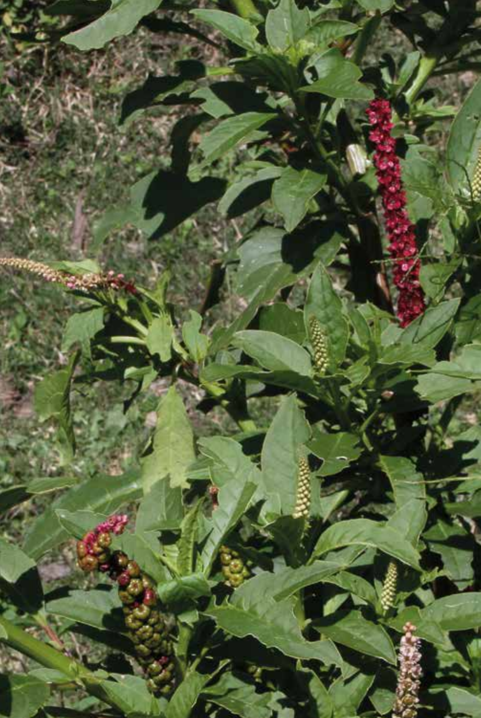
Phytolacca icosandra L.