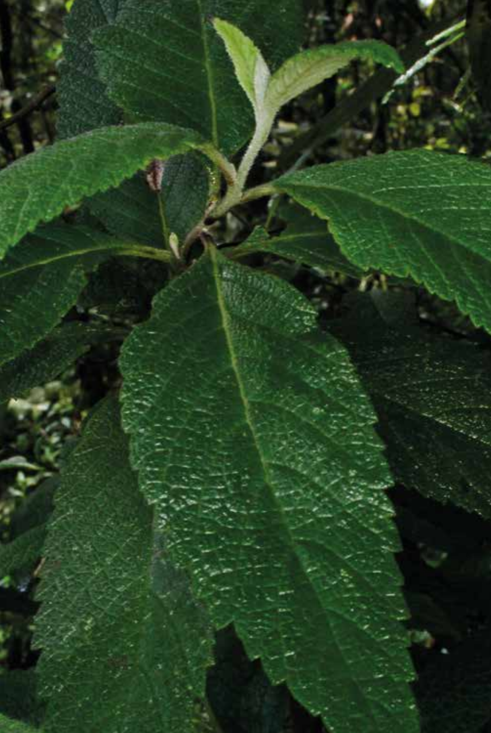
Sida rhombifolia L.