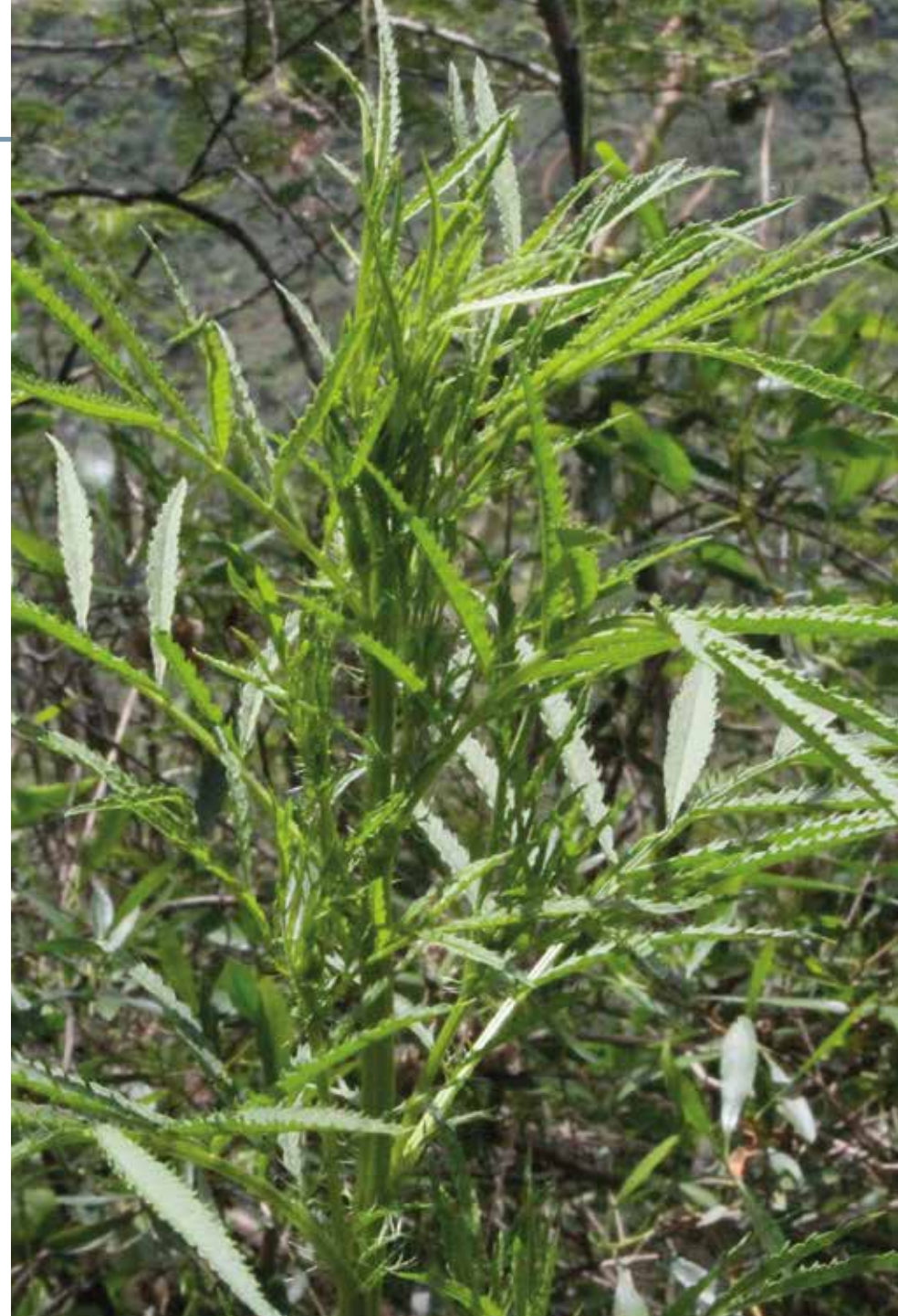
Tagetes multiflora Kunth

Información química y farmacológica: Contiene aceite esencial abundante en tagetona cis y trans, ocimenona y \beta -ocimeno [394]. En la literatura científica no se encuentran estudios de actividad biológica.