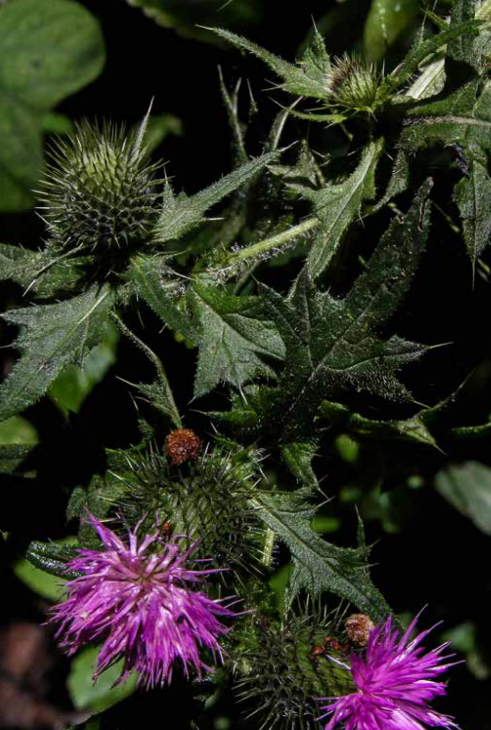
Cirsium vulgare (Savi) Ten.