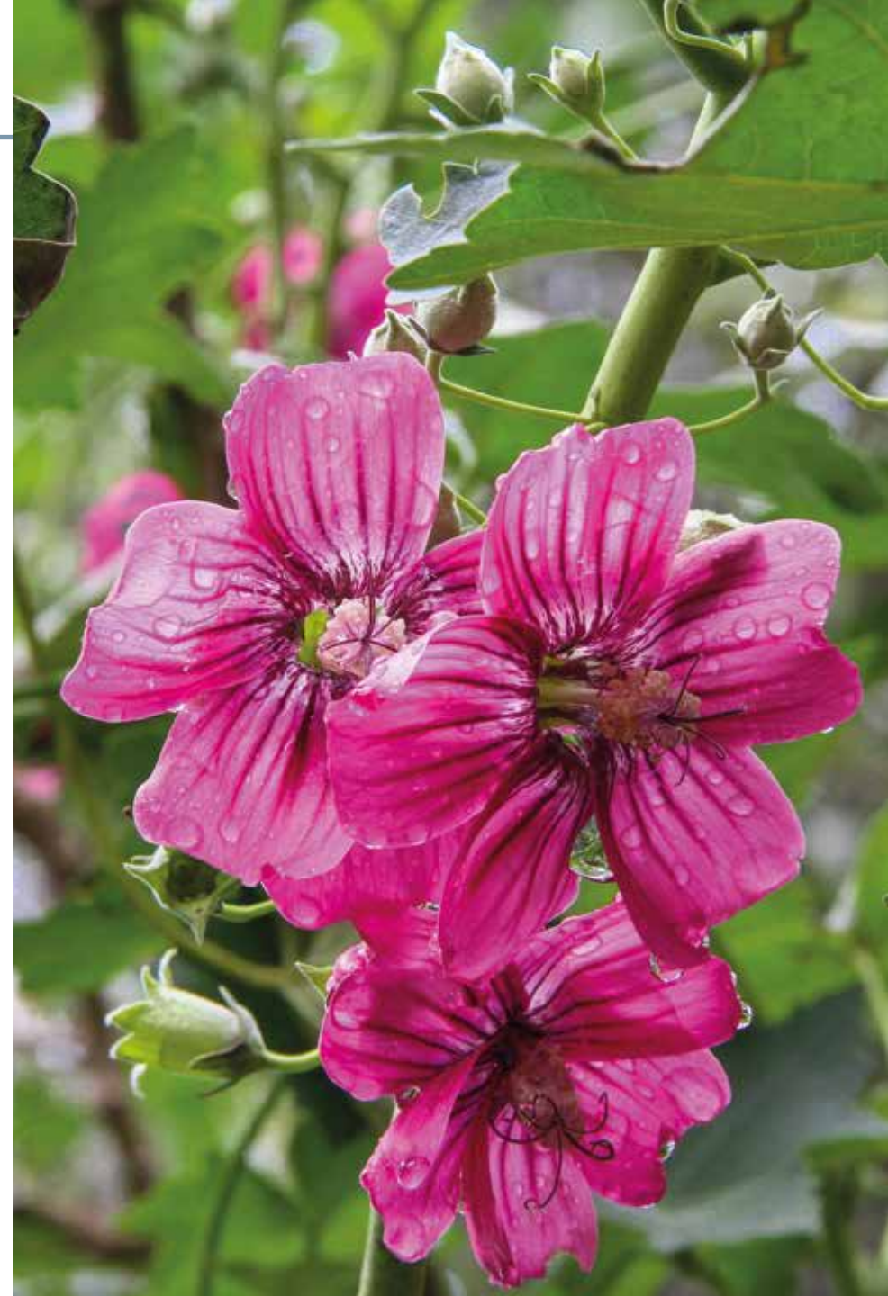
Malva arborea L. Webb & Berthel.

Información química y farmacológica: En la especie se describe la presencia de mucílagos [210-211]. En la literatura científica no se encuentra información de su actividad biológica.