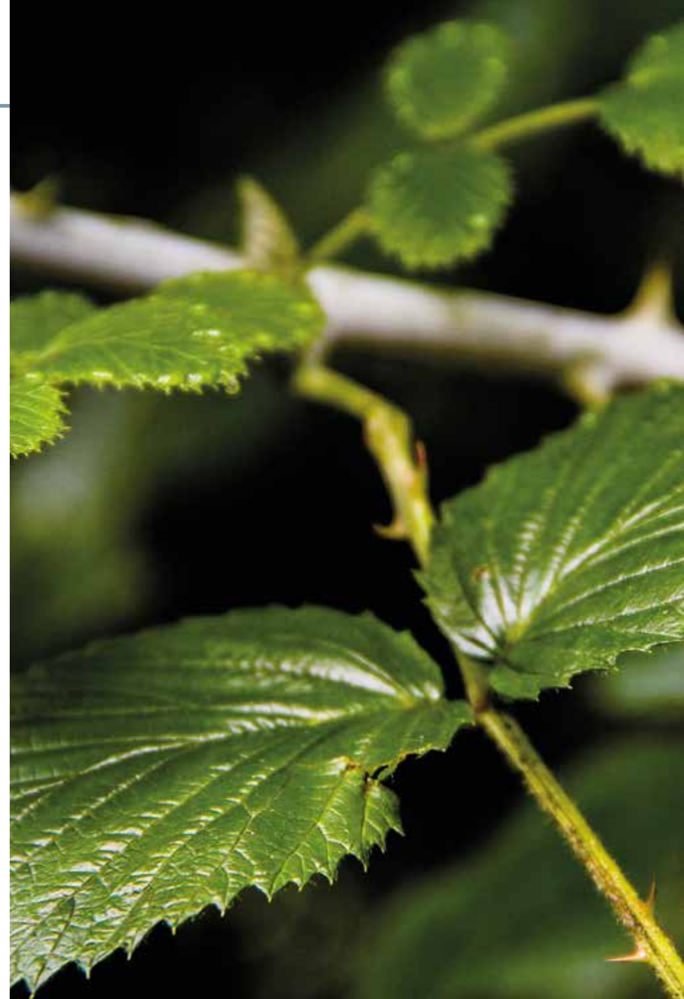
Rubus glaucus Benth.

Información química y farmacológica: Planta rica en polifenoles como flavonas, quercetina, caempherol y epicatequina [322-323], sus semillas contienen ácidos grasos [324]; y en los frutos abundan las antocianinas [325]. Es destacable su actividad antioxidante y antimicrobiana [326], anticancerígena [327] y su uso como colorante natural no tóxico [325].