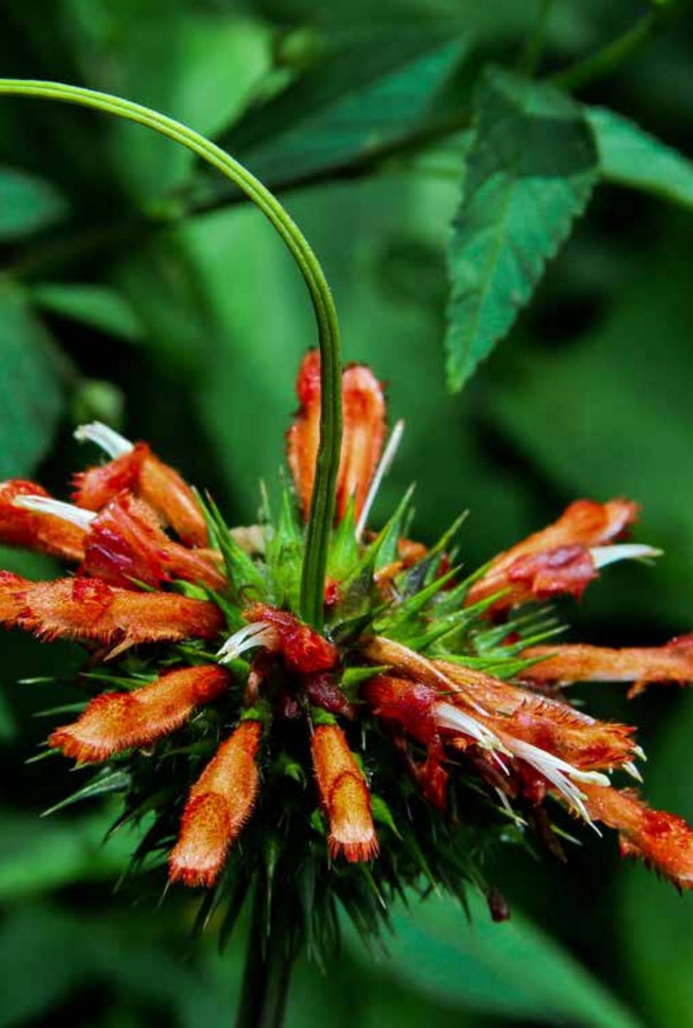
Echinacea purpurea (L.) Moench