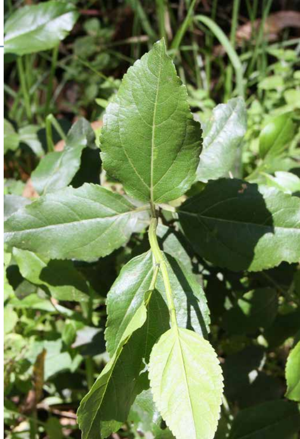
Baccharis latifolia (Ruiz & Pav.) Pers

Información química y farmacológica: La planta contiene aceite esencial cuyos componentes mayoritarios son: limoneno, \beta -phellandreno, sabineno, \beta -pineno, \alpha -pineno, c-curcumeno y cubenol [29], y flavonoides [30]. Son interesantes su actividad antimicrobiana y antifúngica [29-30], antioxidante [31] y antiinflamatoria [32].