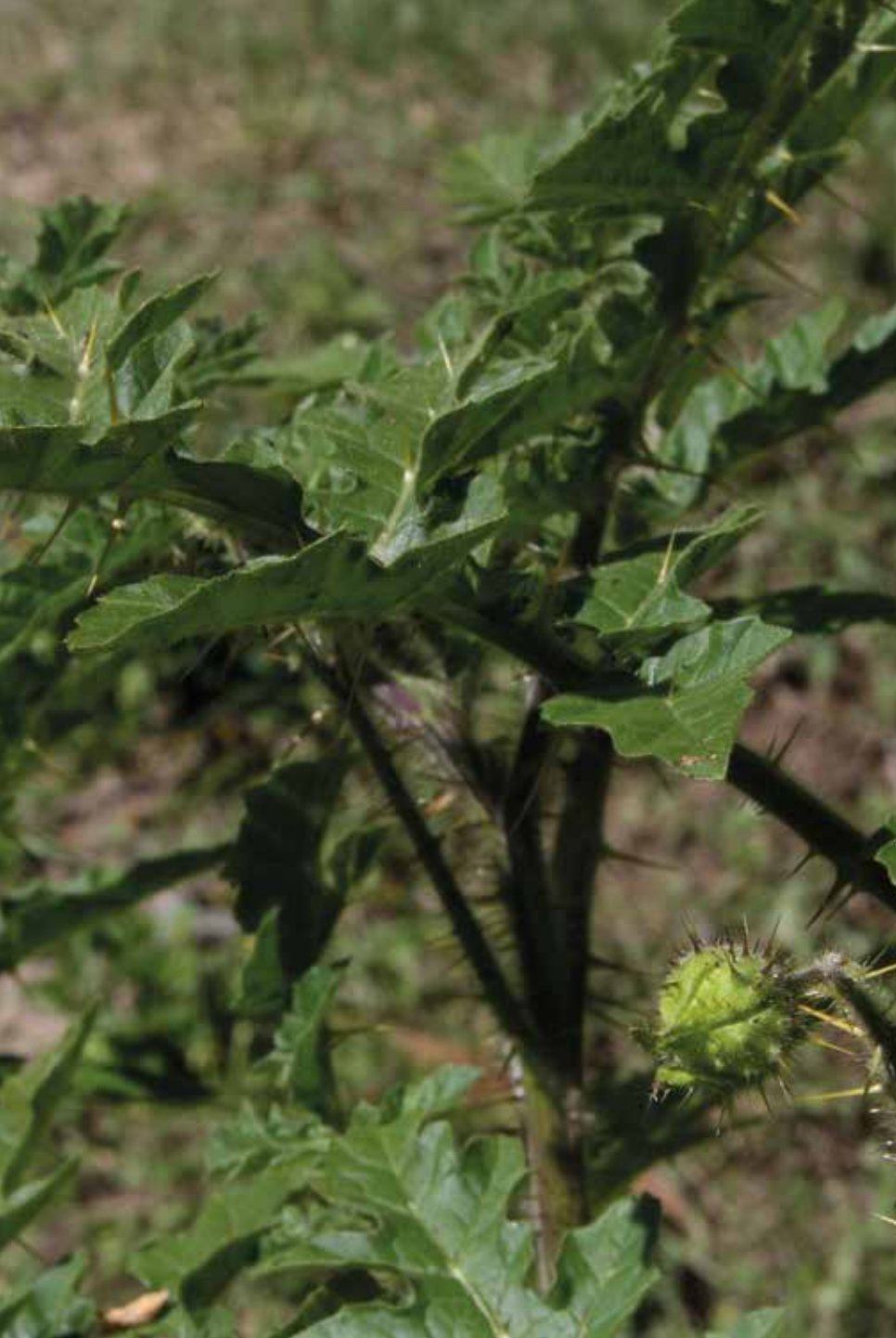
Solanum sisymbriifolium Lam.