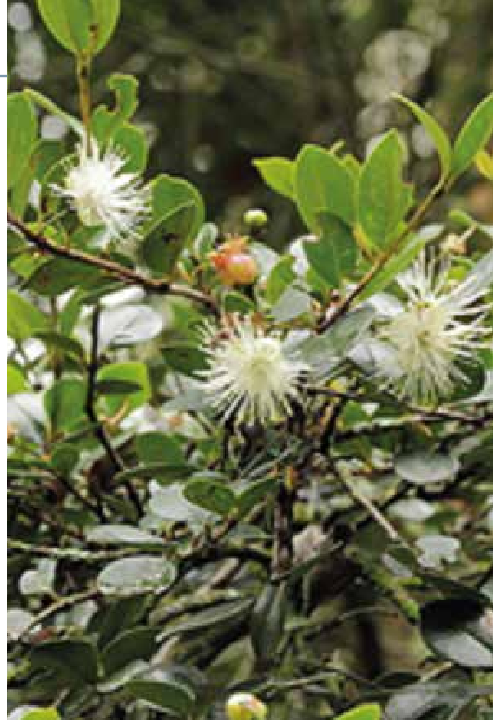
Myrcianthes hallii (O. Berg) McVaugh

Información química y farmacológica: En la planta son abundantes los compuestos de naturaleza fenólica, destacándose los flavonoides derivados de la catequina [231] y el aceite esencial rico en moterpenos [232]. Es destacable su actividad antibacterial [231].