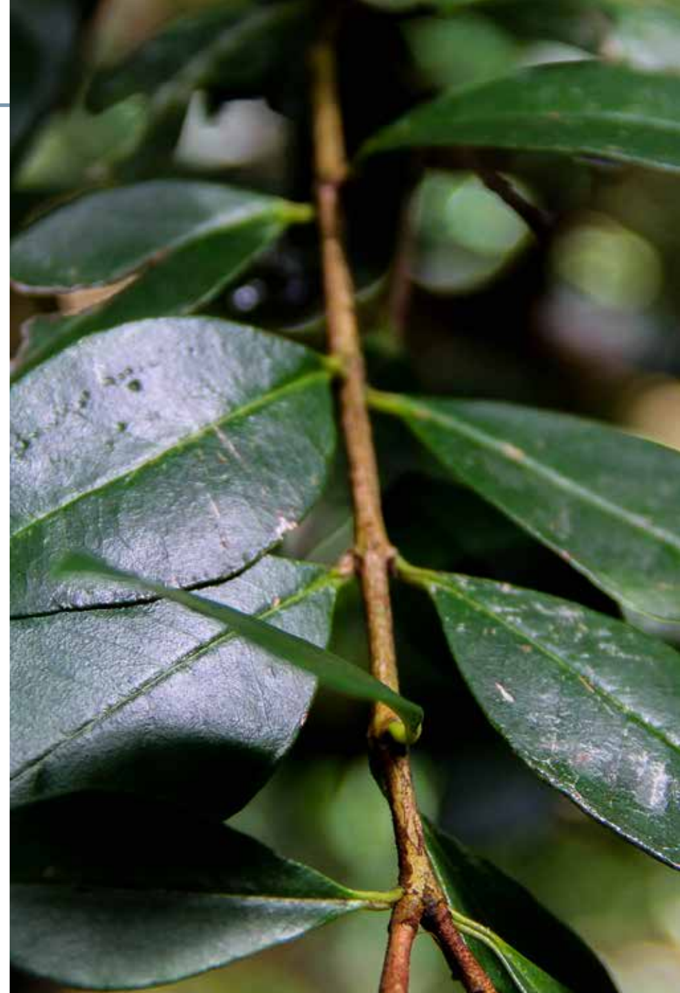
Duranta triacantha Juss.

Información química y farmacológica: Estudios fitoquímicos cualitativos resaltan la presencia de flavonoides, taninos, alcaloides, lactonas sesquiterpénicas y quinonas [117]. Se destaca su actividad antimicrobiana [118].