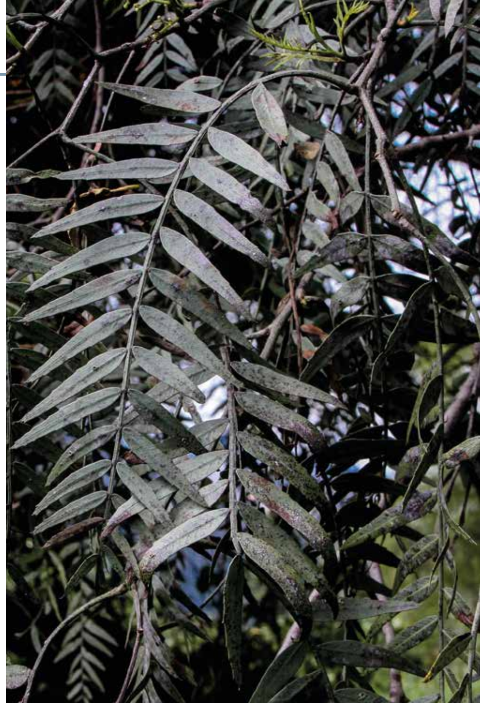
Schinus molle L.

Información química y farmacológica: Especie rica en aceite esencial cuyos componentes más abundantes son el \alpha y \beta felandreno, \alpha y \beta pineno y cimeno [348]. En S. molle han sido detectadas actividades de tipo antimicrobiana [349], antioxidante y anticancerígena [350], antifúngica [351], citotóxica [352] e insecticida [353].