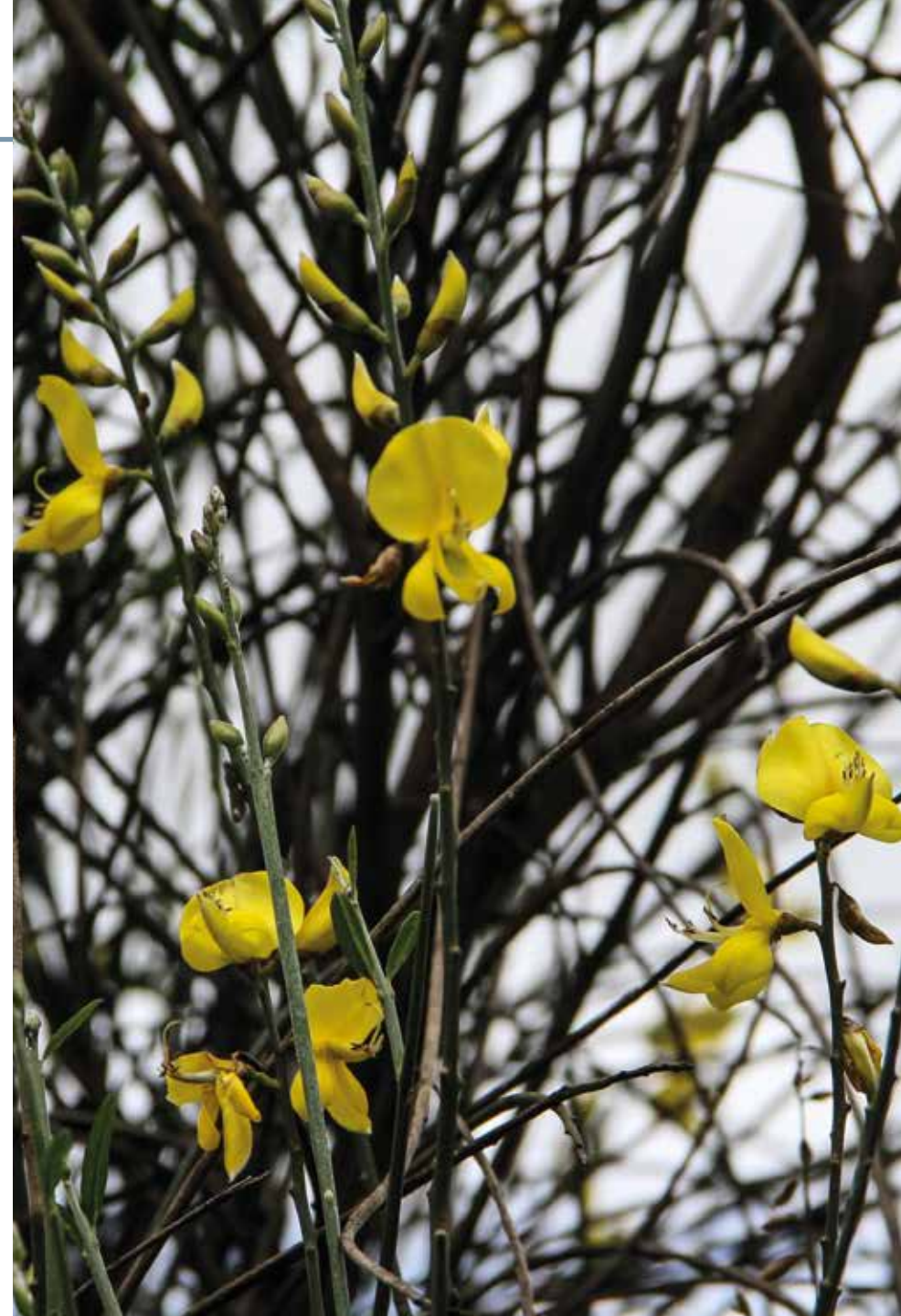
Spartium junceum L.

Información química y farmacológica: Las flores de la especie contienen aceites esenciales ricos en tujeno, cimeno y terpineno [383], otra investigación destaca la presencia de tricosano, tetracosano y pentacosano [384]; se ha detectado la presencia de compuestos polifenólicos y flavonoides [385] y en las semillas se tienen ácidos grasos con alto potencial cosmético [386]. La planta posee actividad antioxidante [385].