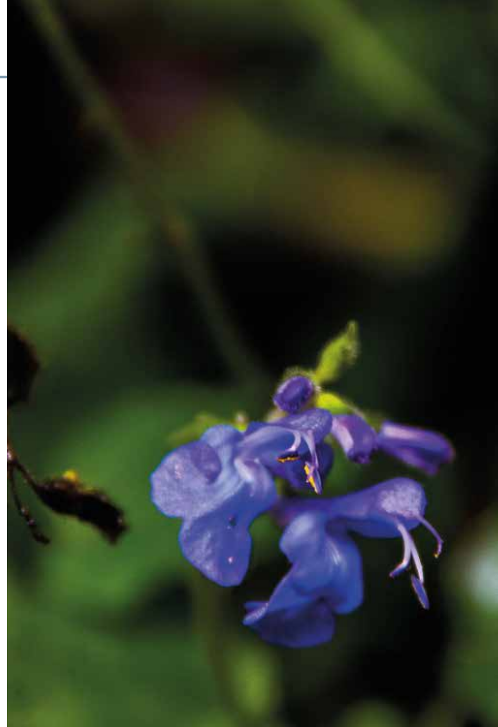
Salvia scutellarioides Kunth

Información química y farmacológica: No se encuentra en la literatura científica información química de la planta. En la especie se han realizado ensayos que confirman su actividad antihipertensiva [339], diurética [340] e inhibitoria enzimática [341].