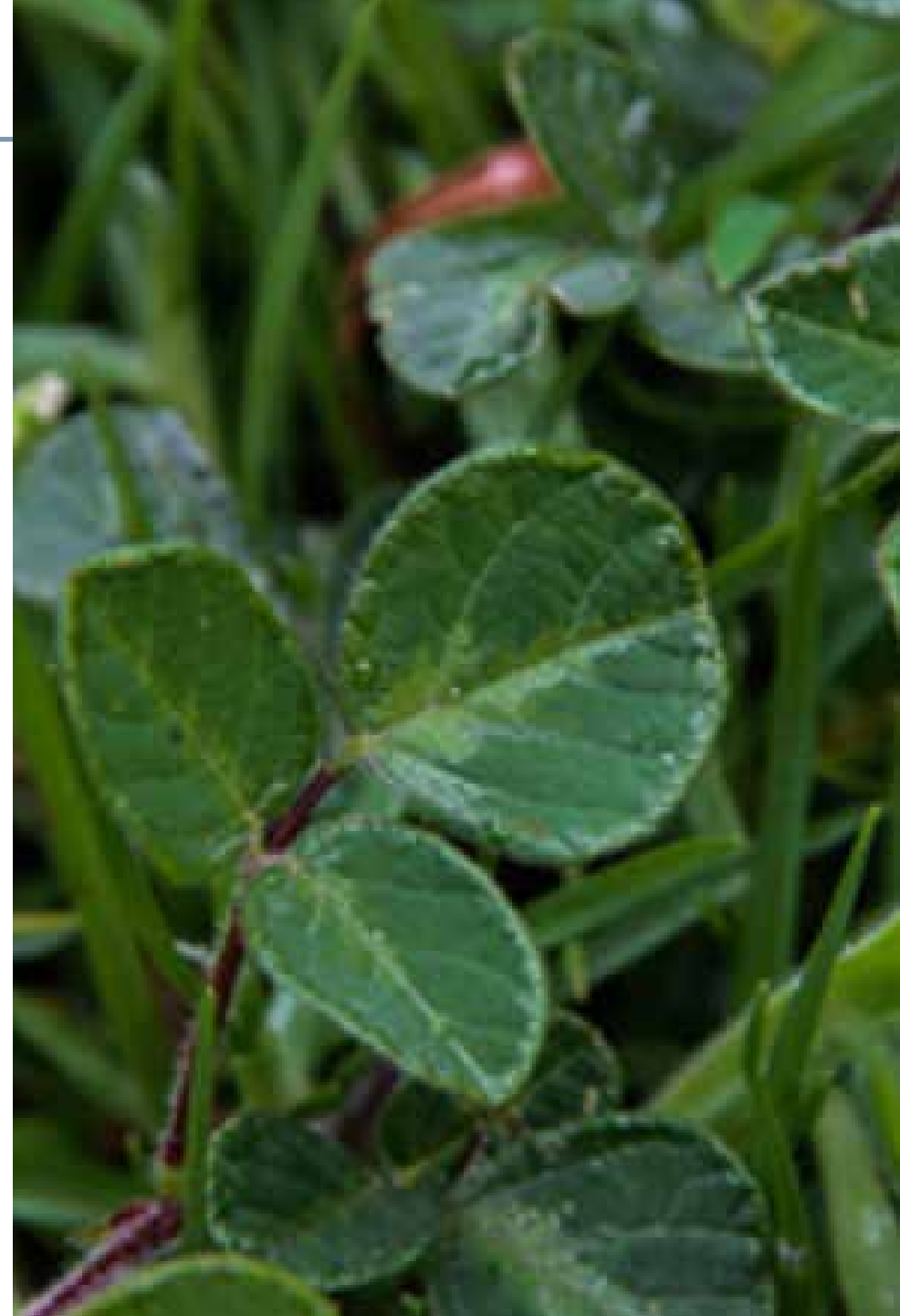
Desmodium molliculum (Kunth) DC

Información química y farmacológica: Se observa la presencia de polifenoles en especial flavonoides [103]. Se han evaluados sus efectos antimicrobianos [103-104], antioxidantes [105], anticonceptivo [106] y antiinflamatorio [107].