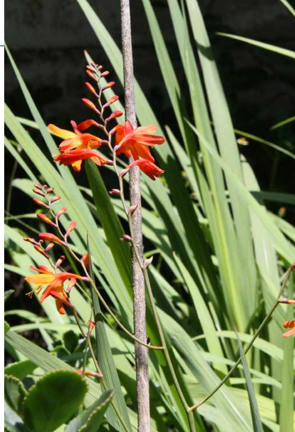
Crocsmia × crocsmiiflora (Lemoine) N.E. Br.

Información química y farmacológica: En la especie se han encontrado alcaloides [75], flavonoides [76] y saponinas [77-78]. Los estudios más relevantes muestran actividades de tipo anticancerígeno [77], cosmético [79] e hipoglicemiente [76].