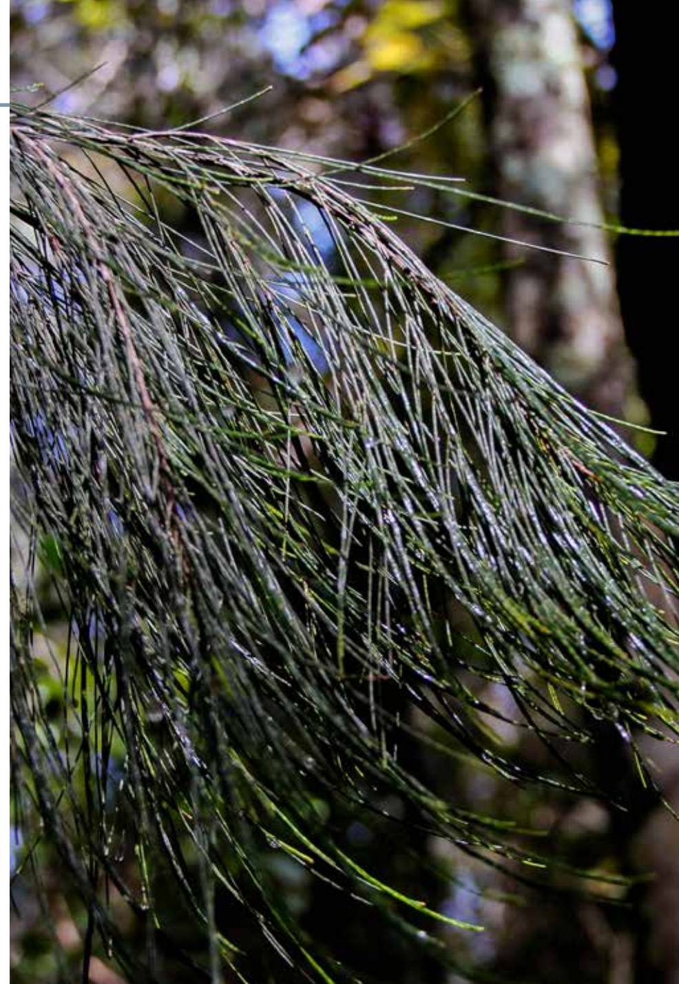
Casuarina equisetifolia J.R. Forst. & G. Forst

Información química y farmacológica: La planta contiene casuarina un alcaloide de naturaleza pirrilizodínica [50], varios compuestos polifenólicos como: catequina, ácido elágico, ácido gálico, quercetina y lupeol [51], otro estudio destaca la presencia de apigenina, esperitina, naringenina y ácido clorogénico [52] y aceites esenciales ricos en pentadecanal y 1-8 cineol [53]. En lo que se refiere a su actividad farmacológica se identifican propiedades anticancerígenas [54], antioxidante [52] y antimicrobianas [55].