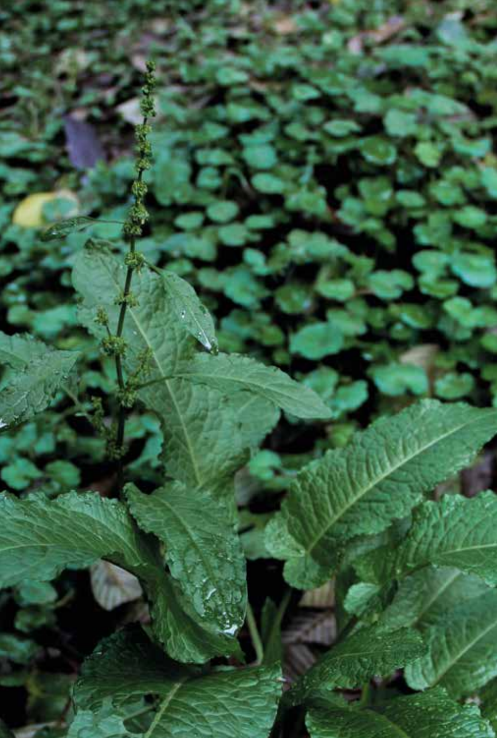
Rumex obtusifolius L.