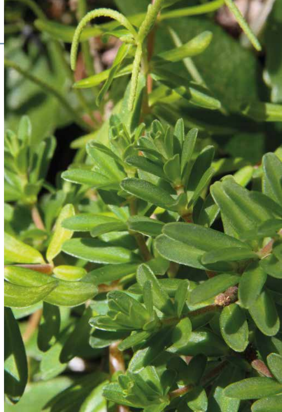
Peperomia galioides Kunth

Información química y farmacológica: En la planta se han detectado quinonas y compuestos fenólicos [269-270], también aceite esencial en donde predomina el chavicol [271]. La actividad biológica más destacable es la antimicrobiana [272-273] y la antihistamínica [274].