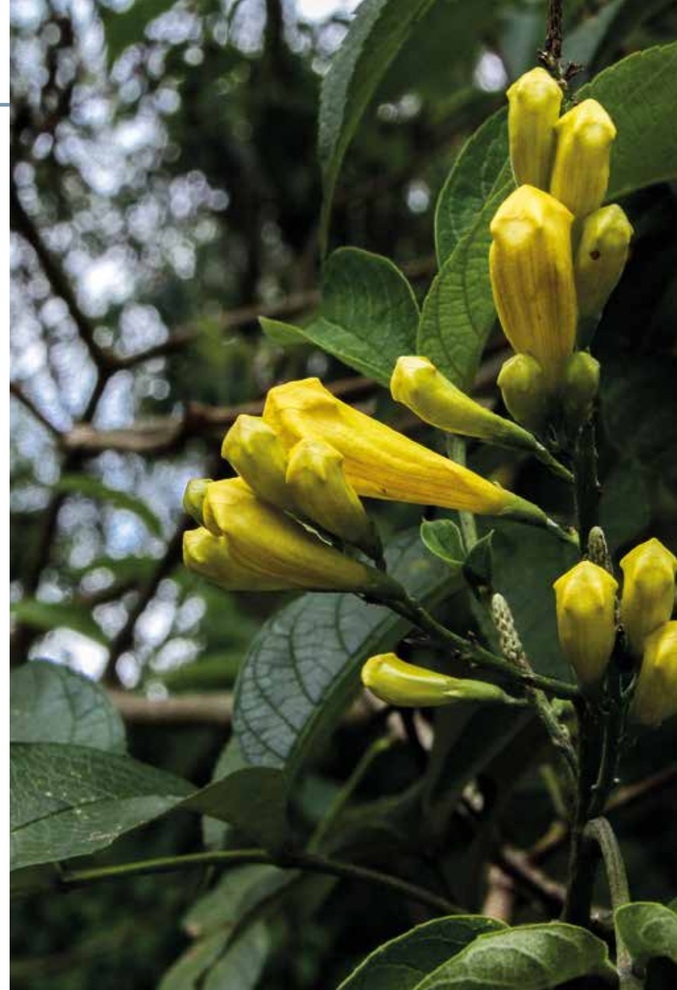
Tecoma stans (L.) Juss. ex Kunth

Información química y farmacológica: Se reporta la presencia de alcaloides de tipo piridínico como la tecomanina, 4-noractinidina, N-nor-metil skitantina y boschniakina [399] y glucósidos irridoides [400]. Presenta una diversa actividad farmacológica destacándose las actividades, antimicrobiana [401], antioxidante [402], antiespasmódica [403], anticancerígena [404], antiinflamatoria y analgésica [405] y cardioprotectora [406].