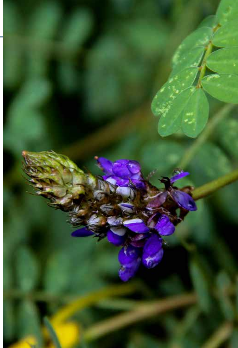
Dalea coerulea (L. f.) Schinz & Thell.

Información química y farmacológica: No existe en la literatura científica estudios de tipo químico y farmacológico en la especie.