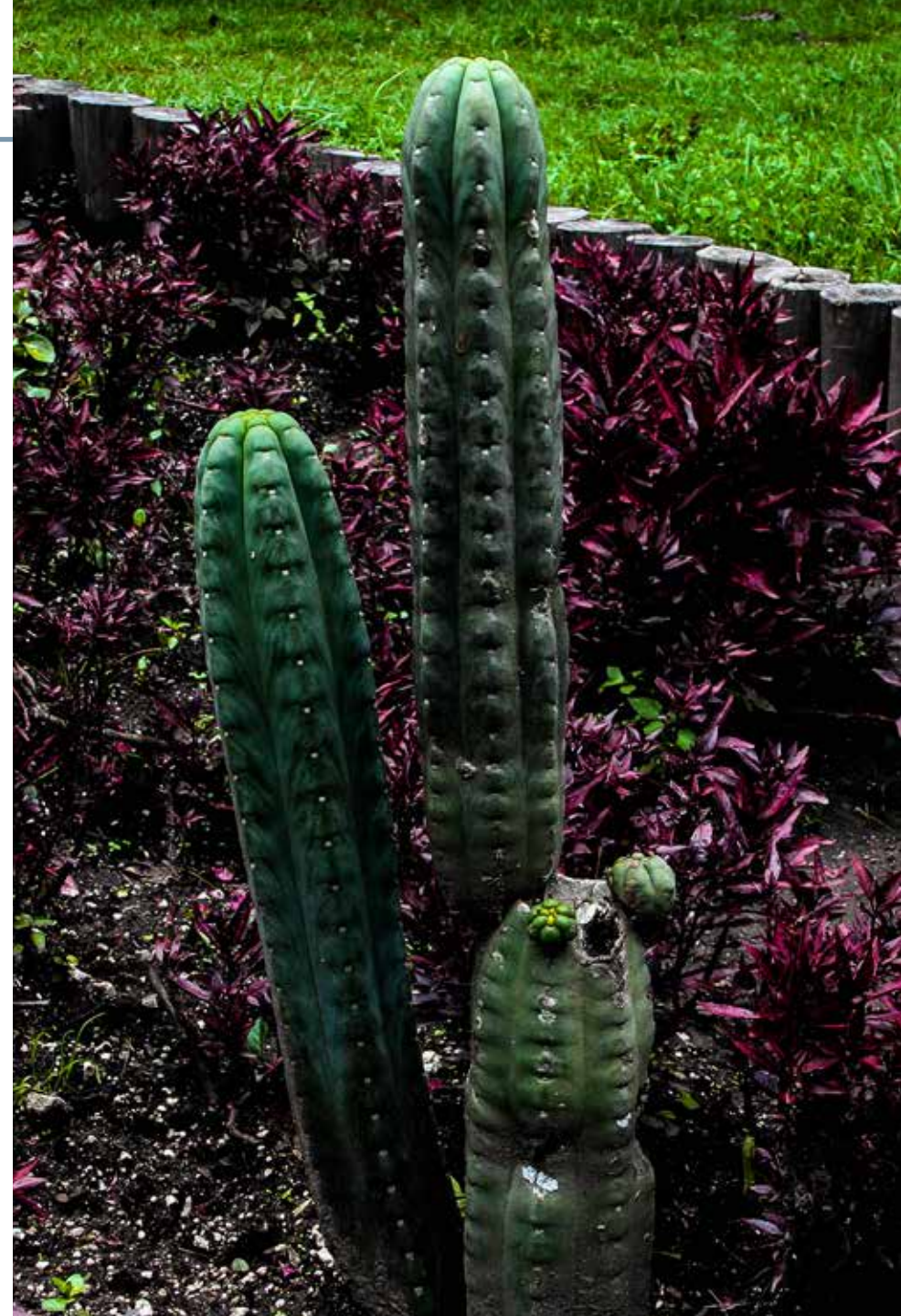
Echinopsis pachanoi (Britton & Rose) Friedrich & G.D. Rowley

Información química y farmacológica: La especie es conocida por la presencia del alcaloide mezcalina [129], han sido encontrados triterpenos denominados pachanol A y pachanol B [130]. La mezcalina es una sustancia enteógena empleada en ceremonias mágico religiosas en la región interandina [131].