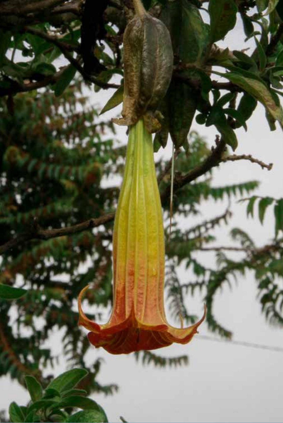
Brugmansia arborea (L.) Lagerh.