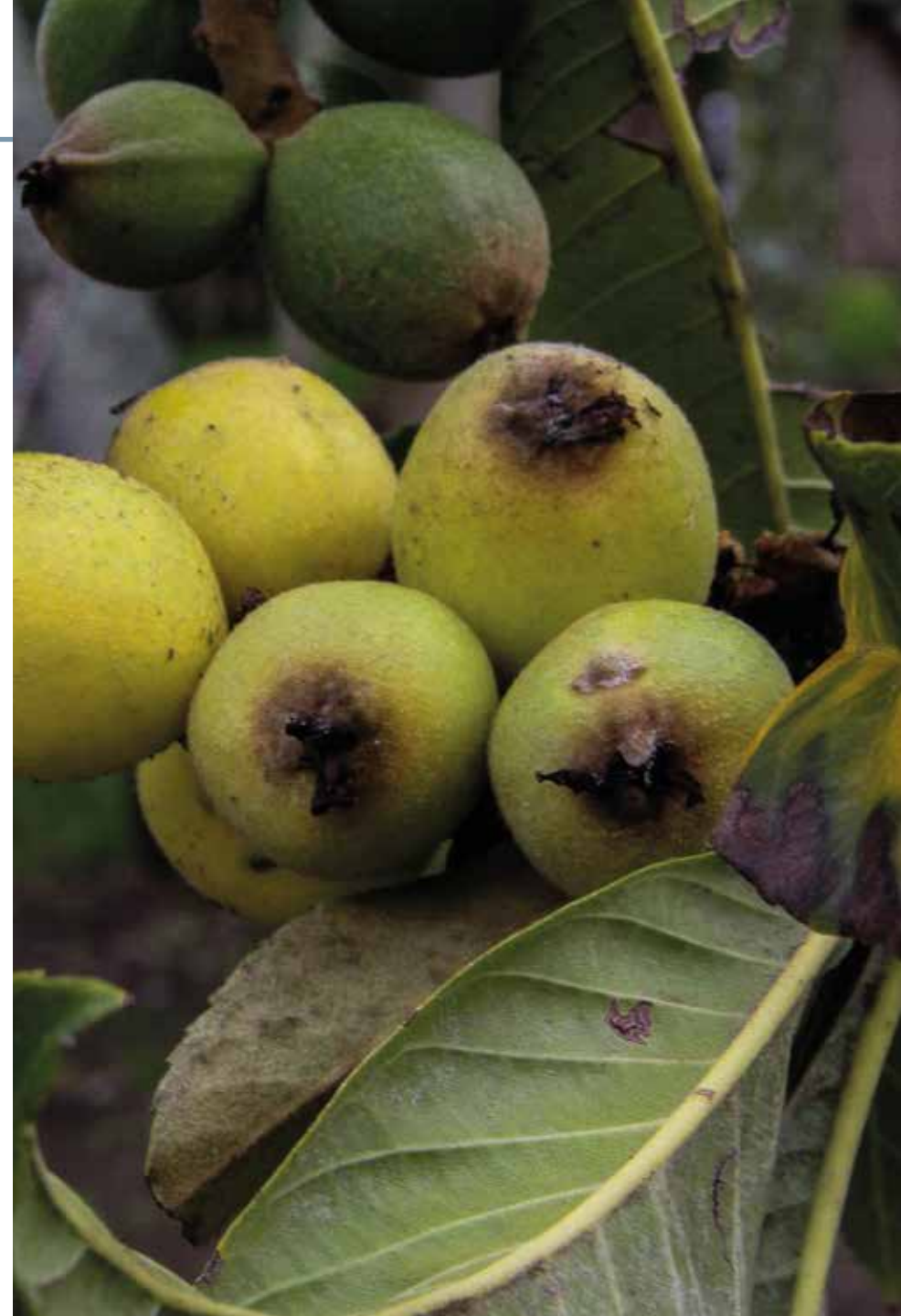
Eriobotrya japonica (Thunb.) Lindl.

Información química y farmacológica: En el fruto abundan compuestos polifenólicos [140], carotenoides [141] y ácido tormentico [142]. Posee estudios que validan su potencial: antidiabético e hipolipidémico [142-143], antitumoral [144], antimicrobiano [145], pectoral [146] y antigastrálgico [147].