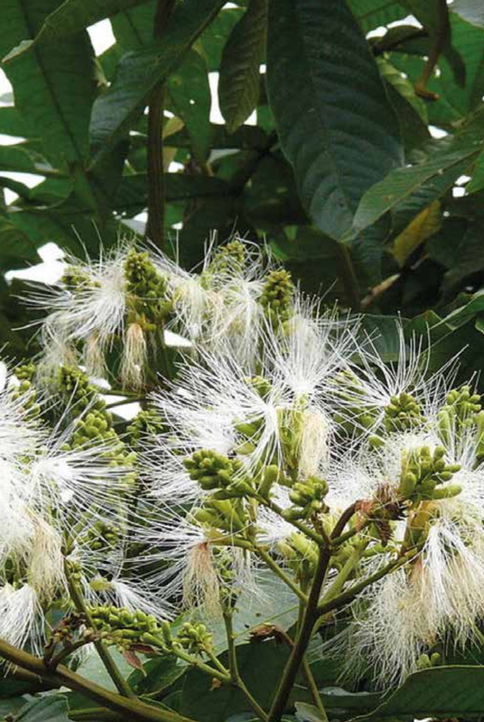
Inga edulis Mart.