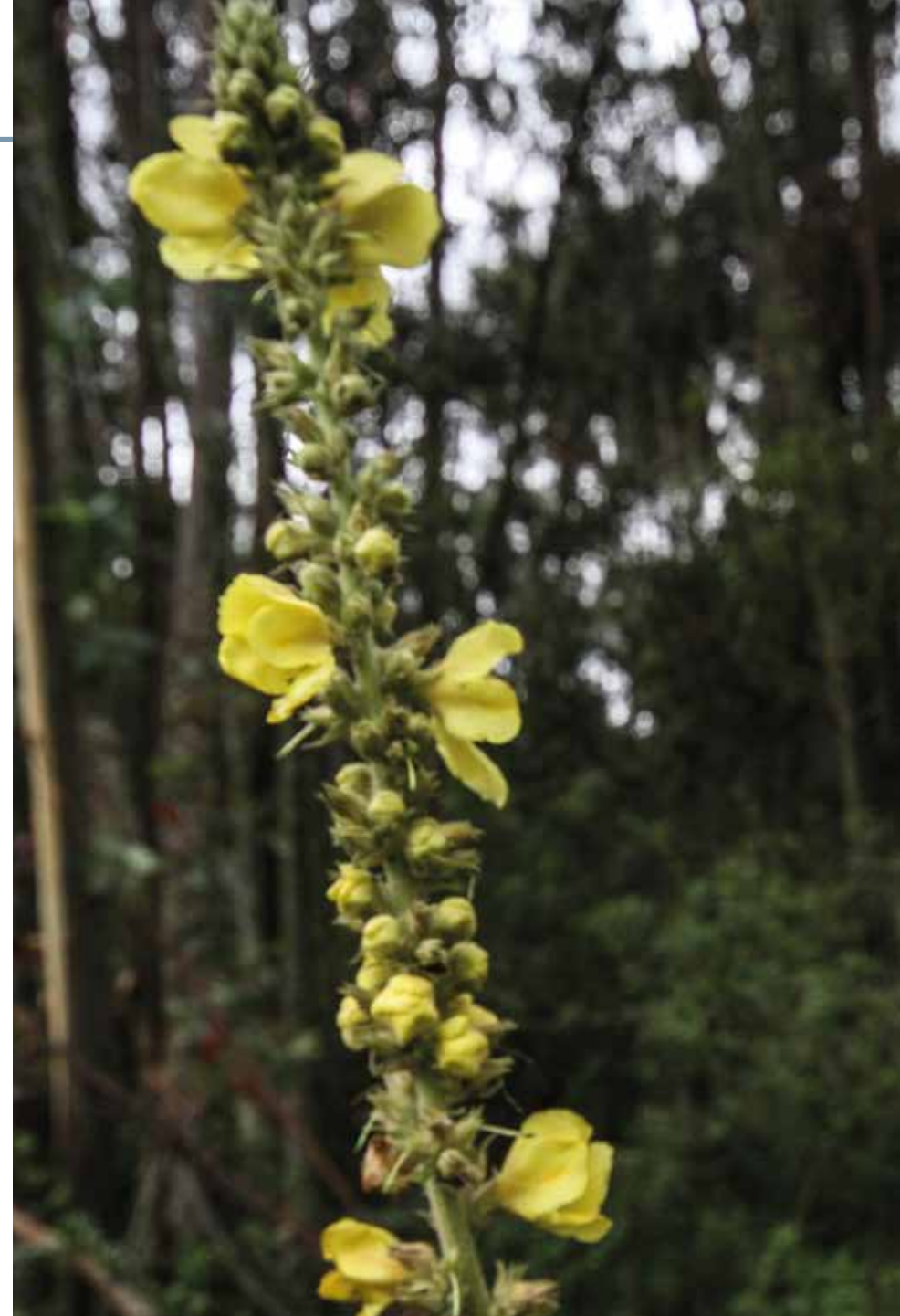
Verbascum phlomoides L.

Información química y farmacológica: La planta es rica en glucósidos y saponinas [426], polifenoles [427] y glucósidos iridoides [428]. Se ha evaluado con buenos resultados su actividad antiinflamatoria [429], antioxidante [429] y demulcente [426].