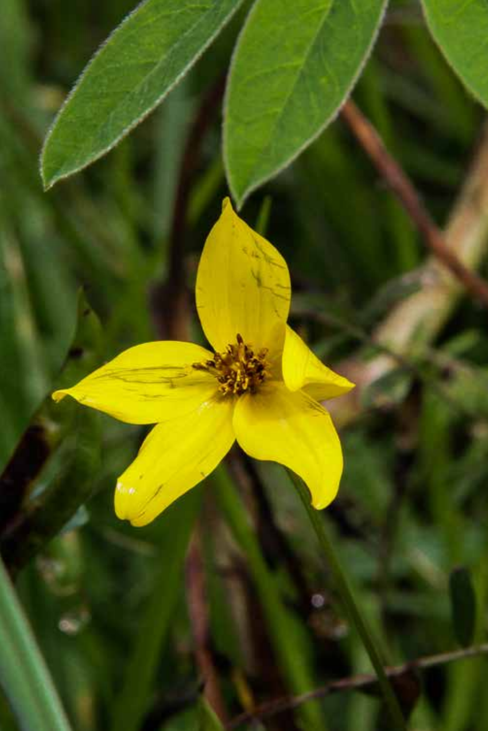
Bidens andicola Kunth