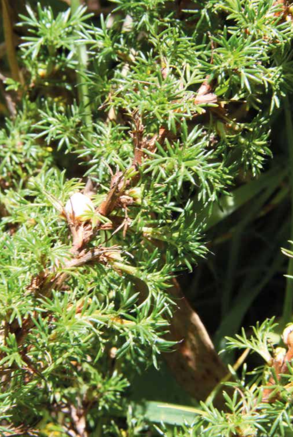
Margyricarpus pinnatus (Lam.) Kuntze