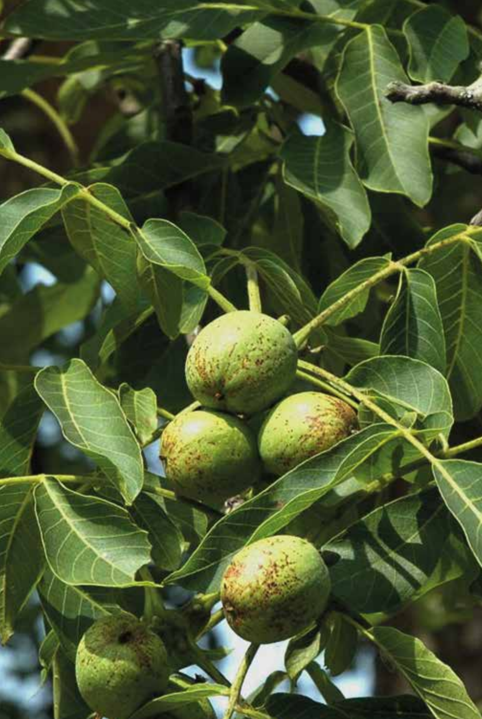
Juglans regia L.