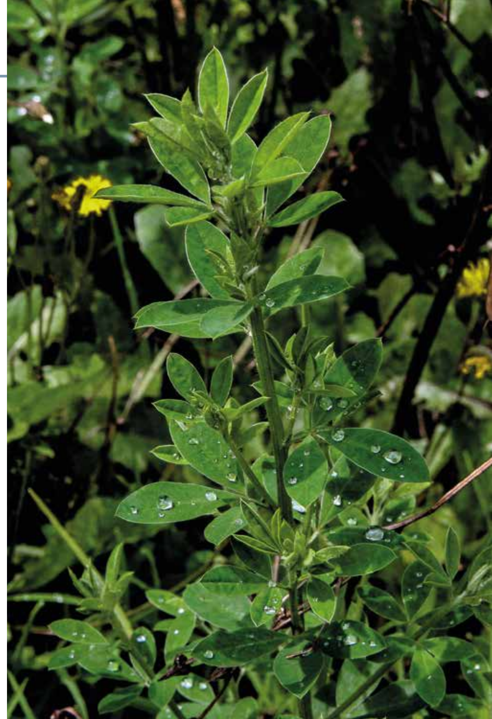
Medicago lupulina L.

Información química y farmacológica: En la especie encontramos saponinas triterpénicas [214]. No existen estudios de actividad biológica en la especie.