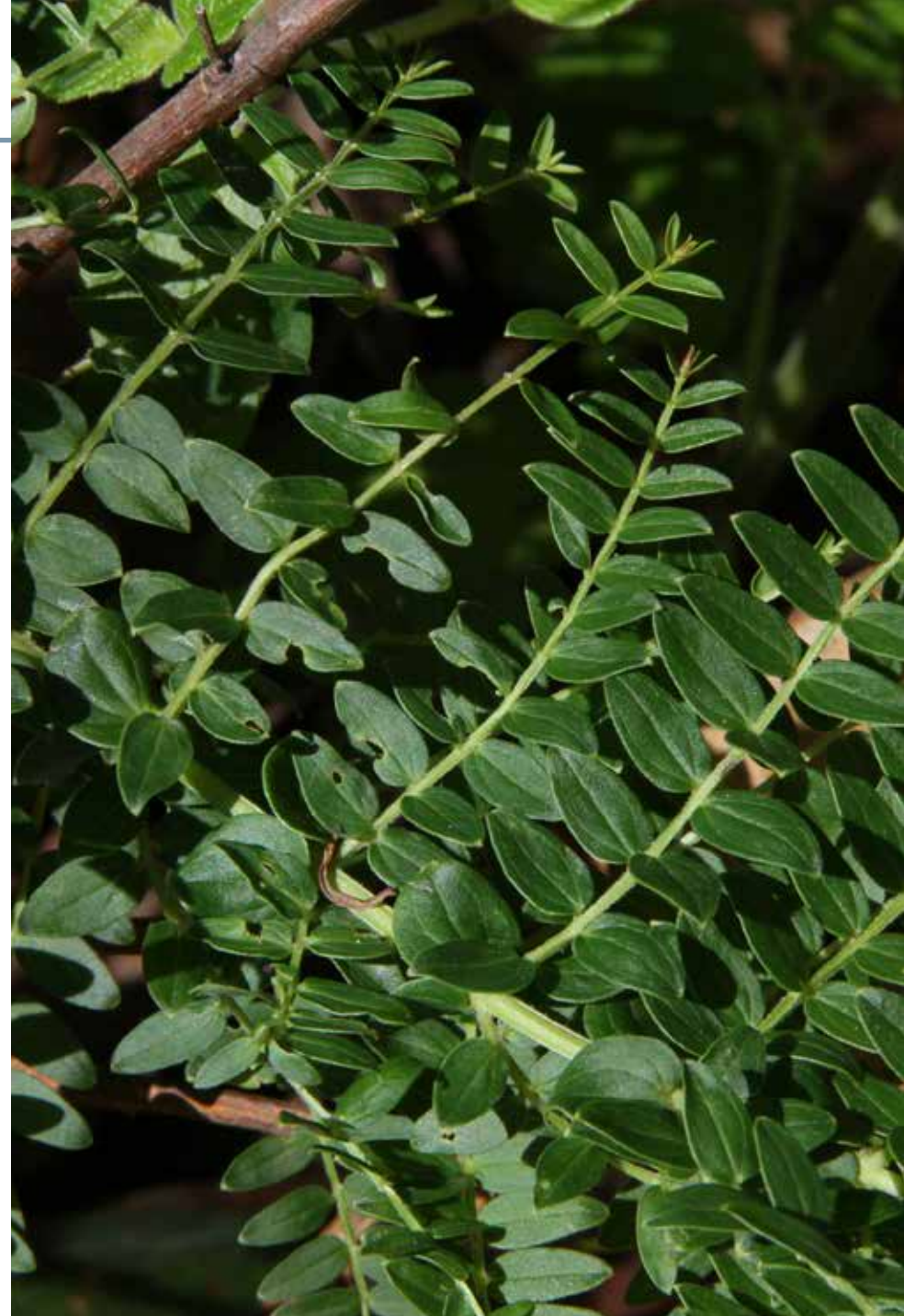
Coriaria ruscifolia L.

Información química y farmacológica: En sus frutos se encuentran compuestos polifenólicos y lactonas sesquiterpénicas como la corianina [66-67] y taninos [68]. Se ha evaluado su potencial antimicrobiano [69] y se destacan sus efectos sobre el sistema nervioso [70].