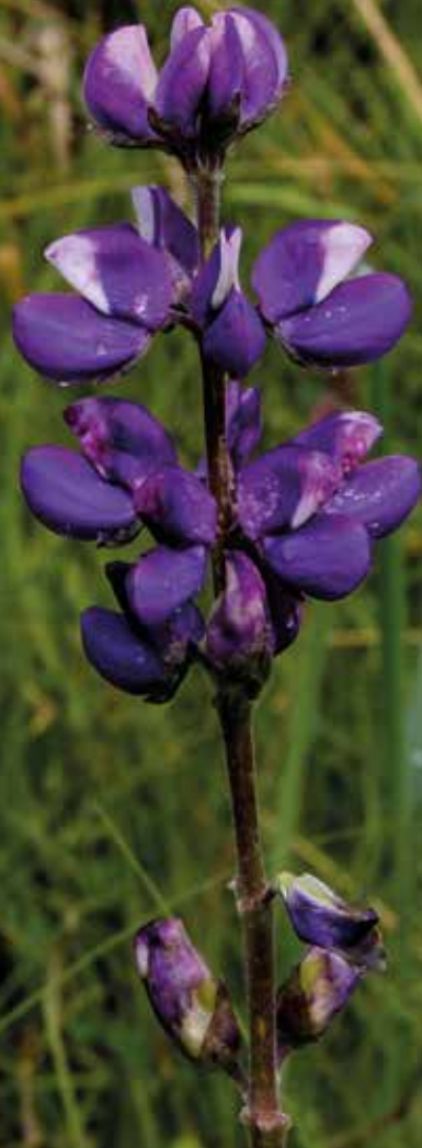
Lupinus pubescens Benth