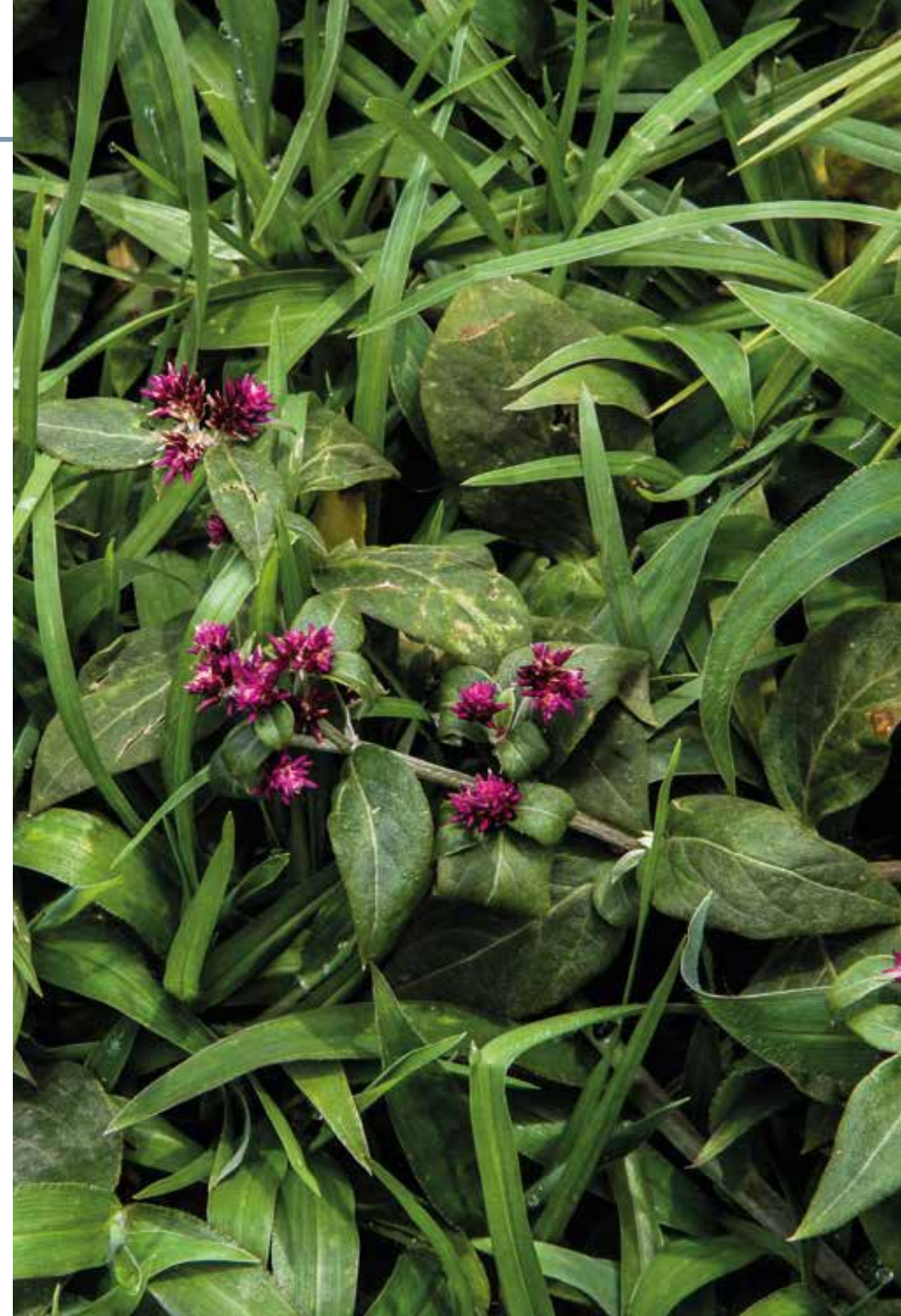
Smilax aspera L.

Información química y farmacológica: Los compuestos de mayor interés en la especie son las antocianinas de sus frutos [360], las saponinas [361-362], el resveratrol [363] y los carotenoides [364]. Se resaltan sus cualidades antioxidantes [365] y antiinflamatoria s [366].