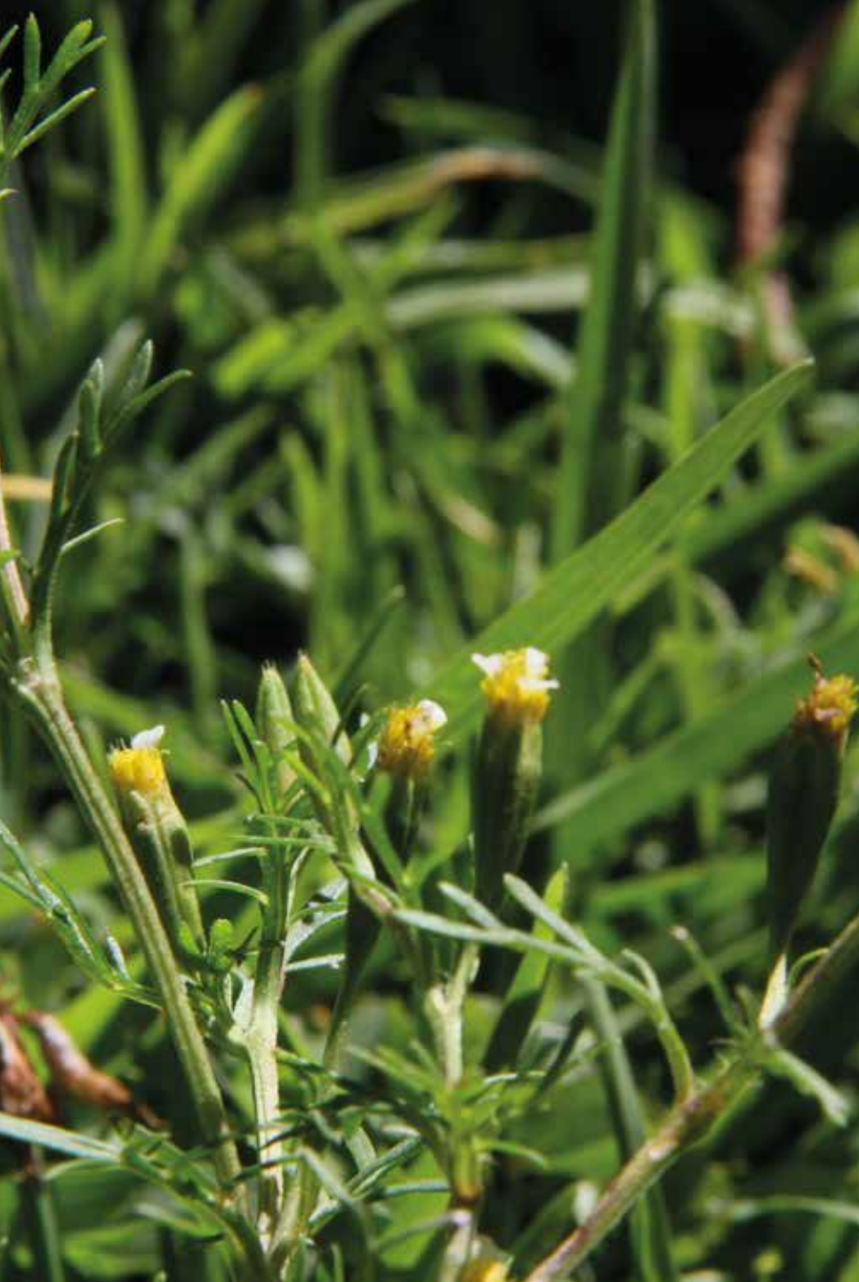
Tagetes filifolia Lag.