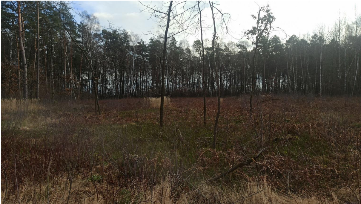
Zdjęcie terenu przed sadzeniem