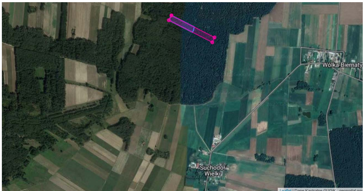
Las Na Zawsze Suchodółtek zajmuje obszar o powierzchni 1,58 ha