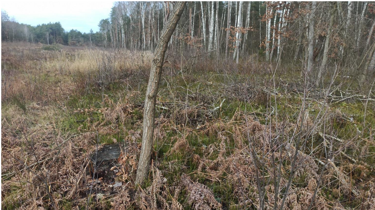
Zdjęcie terenu przed sadzeniem