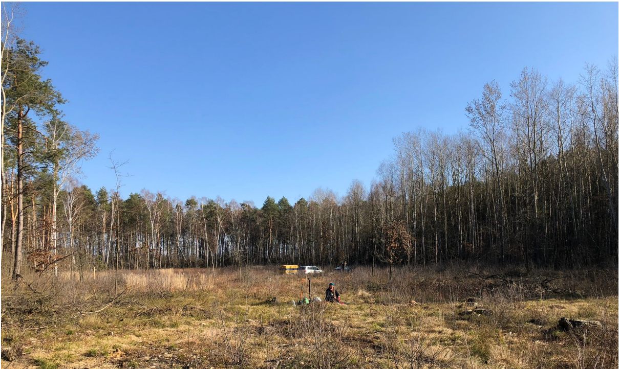
Między jednym wbiciem szpadla a drugim