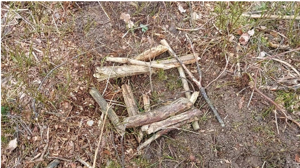
Czasami warto pobawić się w budowanie "domku"

Las Na Zawsze w Suchodołku sadzili ludzie z Fundacji. Mieliśmy szczęście do słońca i pogody, nie mieliśmy szczęścia do malin. Sadzenie wśród nich było trudne, trzeba było wrywać kujące łodygi z korzeniami. Ale co tam. Krok po kroku, sadzonka po sadzonce napętniliśmy pustą przestrzeń. Niech rośnie!