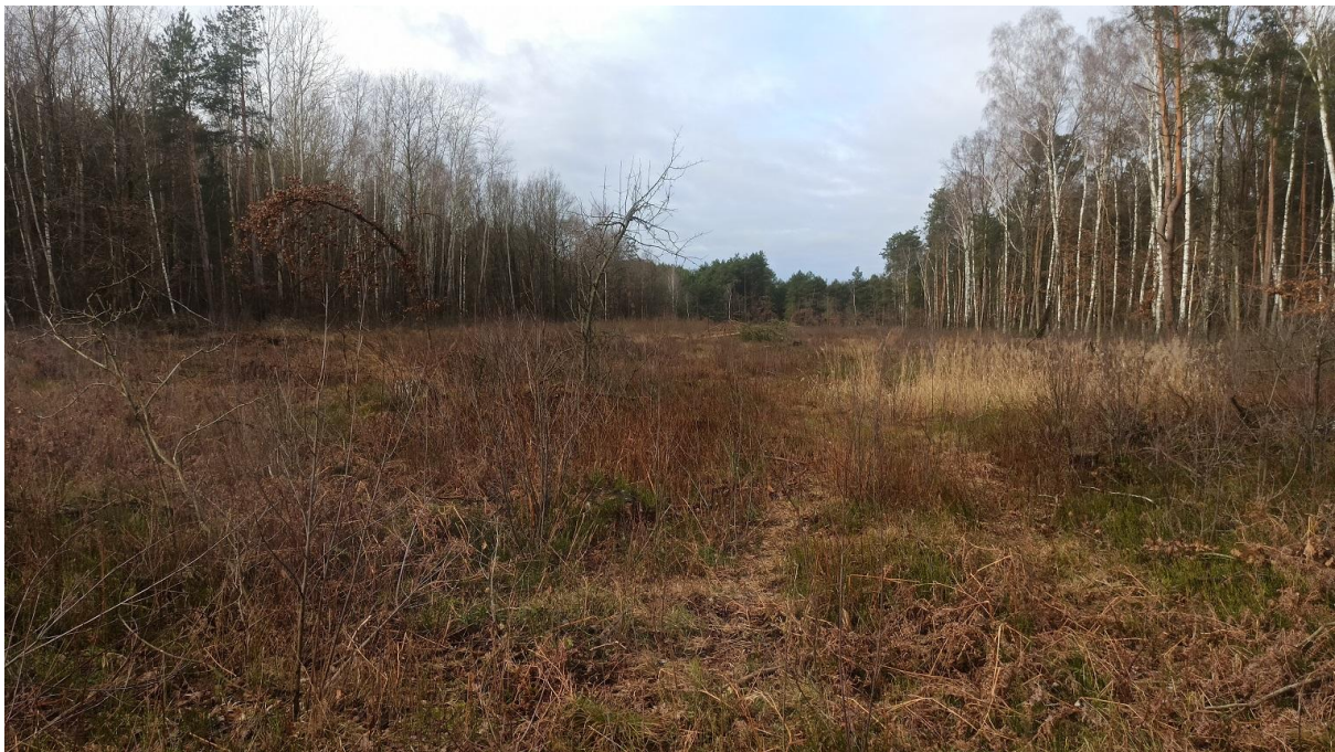
Zdjęcie terenu przed sadzeniem

Typowy teren leśny - LNZ Suchodółek składa się z dwóch działek znajdujących się w środku lasu, przeciętych drogą leśną. Został sklasyfikowany jako grunt leśny kategorii V. Obszar ma kształt wydłużonego prostokąta, jest równy, otoczony typową uprawą leśną - monokulturą sosny przetykaną brzozą oraz dębem. Poprzedni właściciel wyciął tutaj las około 2-3 lat temu. Robił to dosyć pobieżnie, więc zostało trochę małych dębów i krzewów. Po kilku latach od wyřębu sukcesja naturalna zaczęła tu już wchodzić. Pojawiły się siewki drzew, weszły maliny.