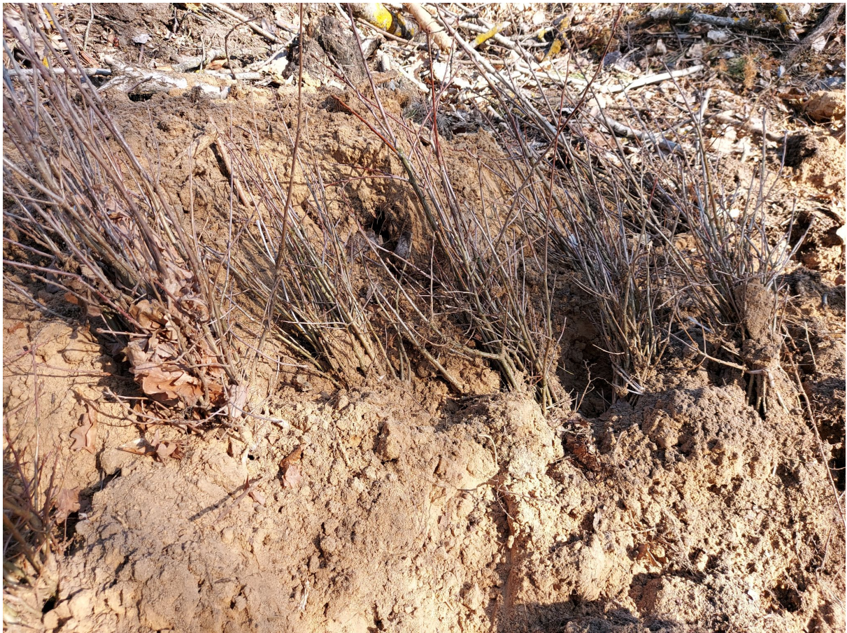
Sadzonki są już na miejscu i czekają na sadzenie

Nie stawialiśmy tam płotu. Sadzonki, które zakupiliśmy były tak duże, że nie powinny im grozić sarny czy jelenie. Przygotowań było więc mało - wystarczyło postawić słupy informacyjne, przywieźć i zabezpieczyć sadzonki.