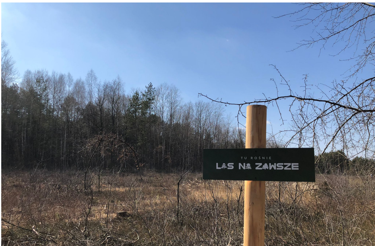
Las jest oznaczony tabliczkami