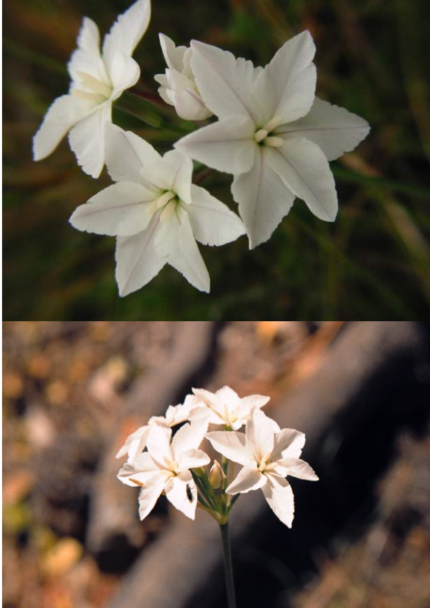
Reserva Nacional Lago Peñuelas. 2004

Preparado por: Secretaría Técnica Reglamento de Clasificación de Especies Silvestres, e-mail: clasificacionespecies@conama.cl