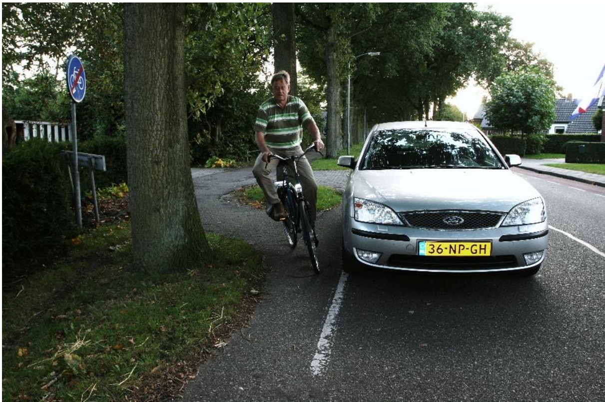
Onveilige situatie bij Hoofdweg 118

Eén daarvan is de Hoofdweg 118: daar eindigt het fietspad en dat geeft een gevaarlijke situatie omdat er weinig ruimte is en er te hard gereden wordt (zie tek. 2). Dit wordt zeker bevestigd tijdens de bewonersavond. Het probleem is dat in overleg met de gemeente destijds gekozen is voor de huidige oversteek. Als suggestie wordt gegeven: markering aanbrengen en eventueel een wegversmalling.