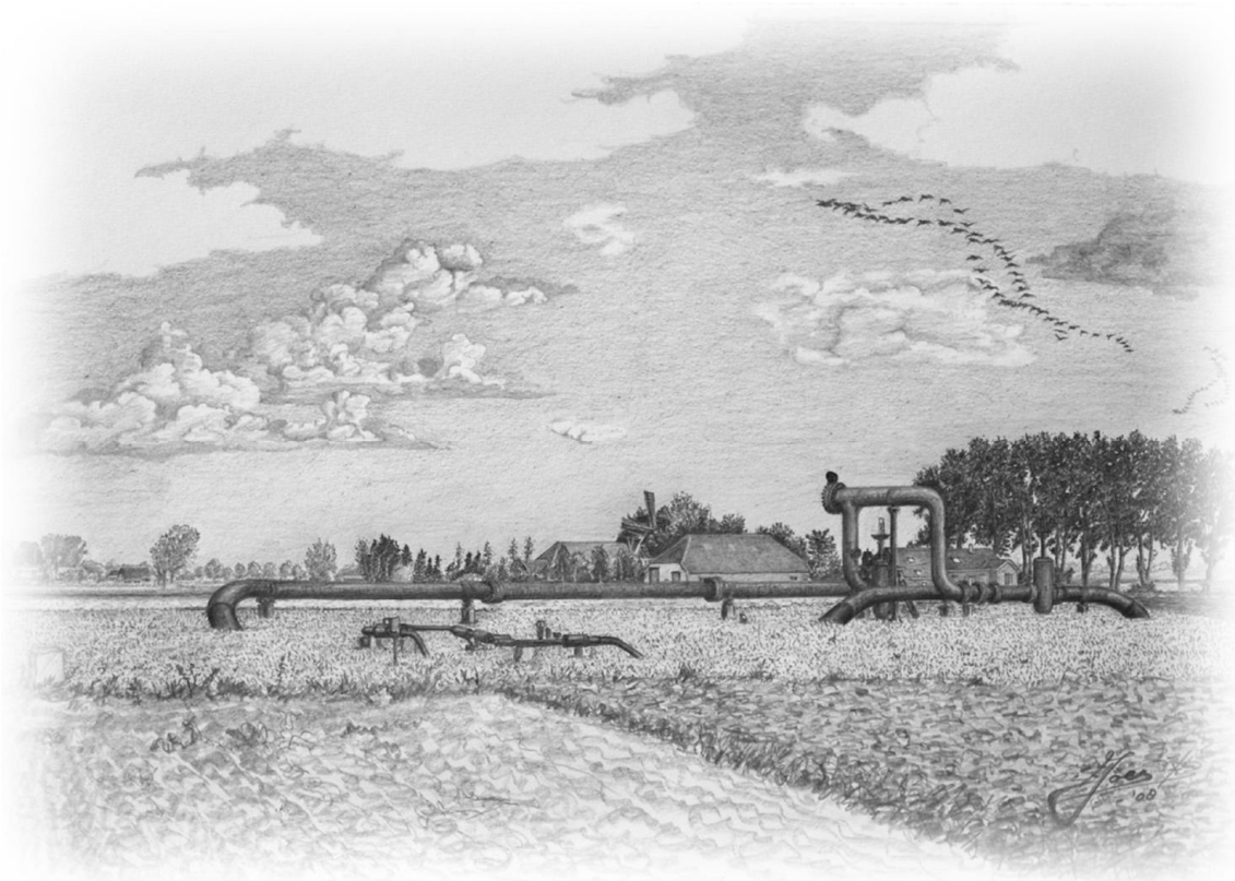
De Groene Dijk te Froombosch