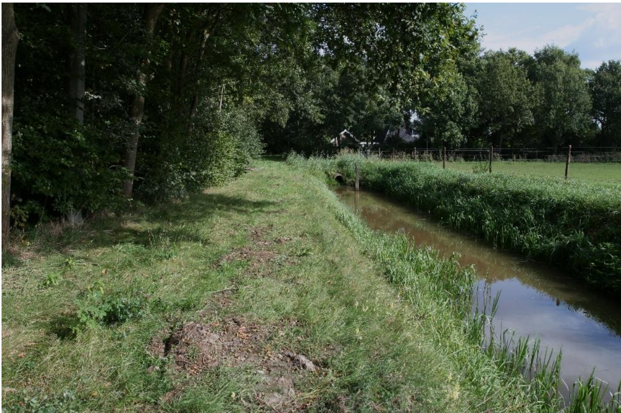
Maaipad tussen de Boerweg en de Ruitenweg

Verder wordt nog als suggestie gedaan dat Froombosch in het wandelroute boekje van de Groningerloop zou moeten staan.