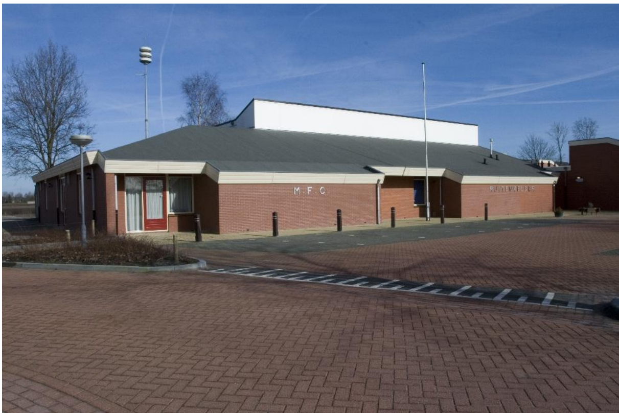
MFC De Ruitenvelder

Als een paal boven water staat voor de deelnemers aan de keukentafelgesprekken en de bewonersavond de noodzaak om de Ruitenvelder voor het dorp te behouden met een professionele beheerder, zoals die er nu is.