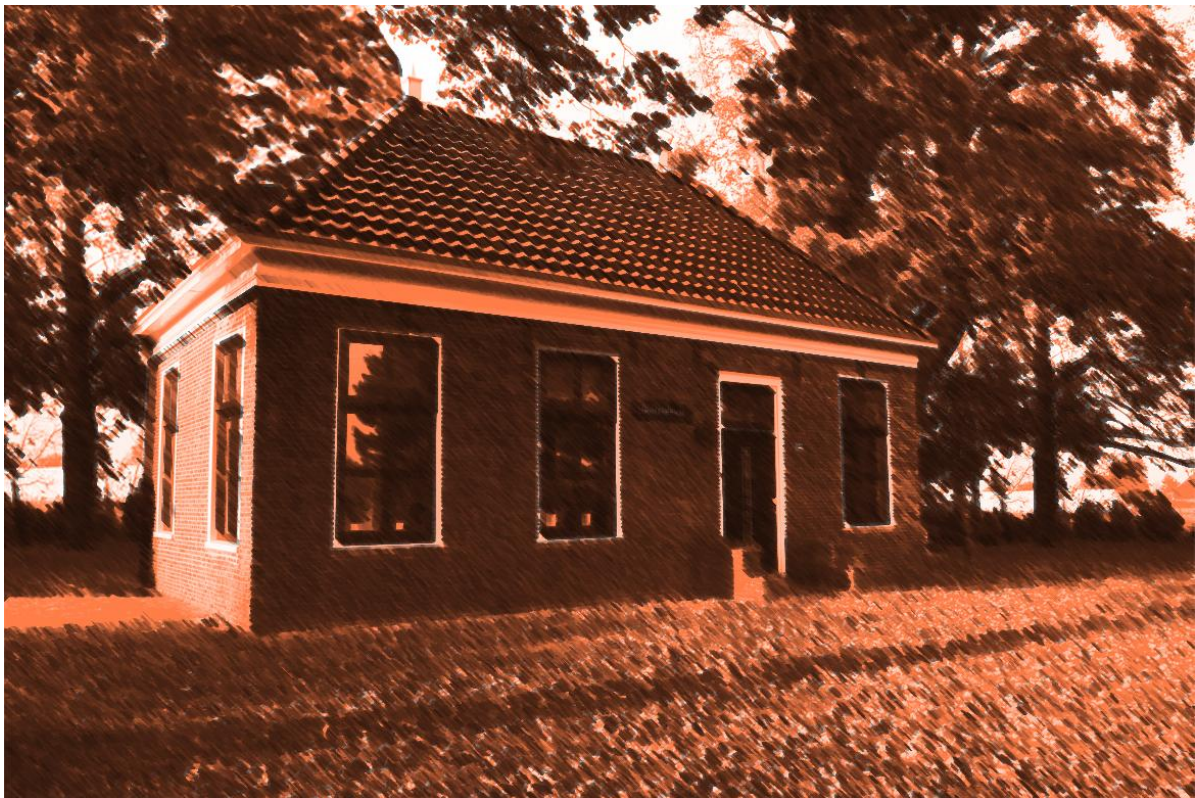
Ruitenborg te Froombosch

De geschiedenis van Froombosch gaat terug tot in het jaar 1231. In dat jaar werd een inwoner van dit gebied, een monnik van het klooster uit Wittewierum, vermoord. Vermoedelijk was hij belast met het toezicht op de veenafraving in deze dreven. De dader werd berecht op het Kaakheem, een plaats waar destijds ook lijfstraffen werden toegediend.