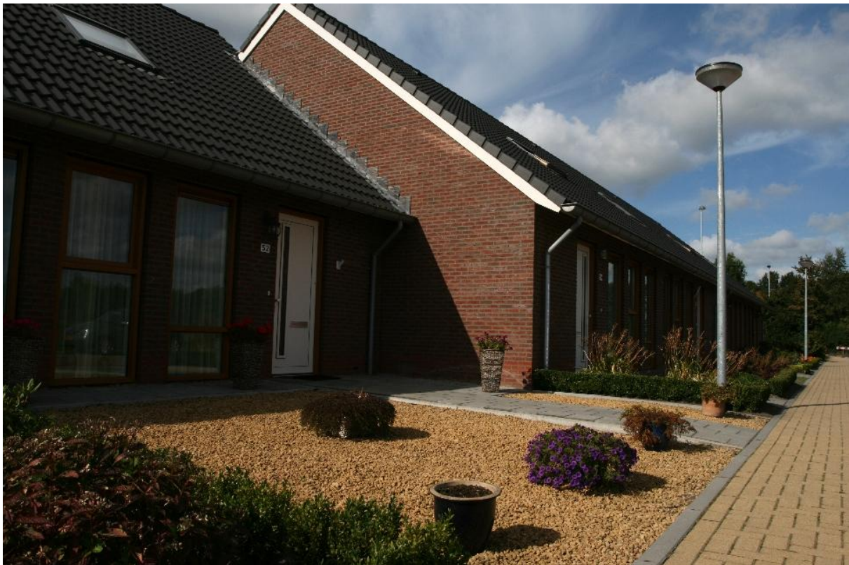
Levensloopbestendige woningen aan het Hoofdlingepad

Tijdens de keukentafelgesprekken komt vaak ter sprake dat er behoefte is aan meer seniorenwoningen en levensloopbestendige woningen. Meermalen wordt de suggestie gedaan: een 2 lagen complex met seniorenwoningen, extra zorg (noodzakelijk voor ouderen in de toekomst), bijvoorbeeld een pinautomaat en winkelvoorzieningen. Dit wordt tijdens de bewonersavond enigszins bevestigd. Onder oudere inwoners leeft heel sterk de wens ook op hogere leeftijd in het 'eigen' dorp te kunnen blijven wonen.