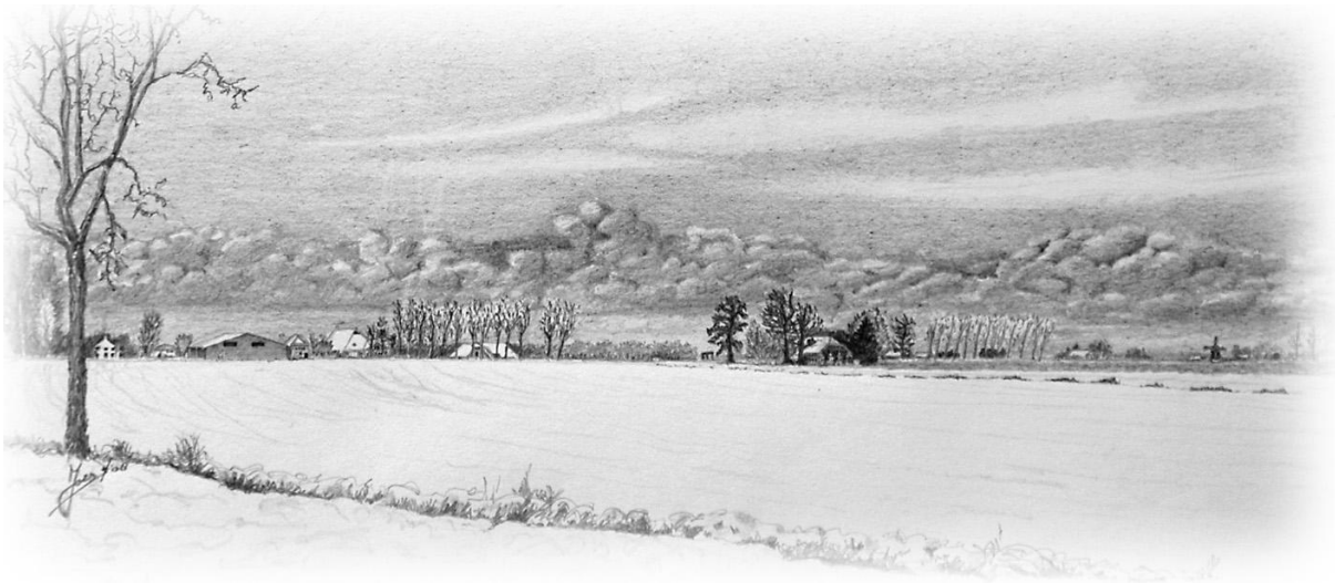
Sneeuwlandschap De Ruiten, Froombosch

De hobbybeurs, het toneel, de expositie en het dorpschoolfeest moeten behouden blijven. Voorstel: plaats een ideeënbus, waarin mensen kunnen laten weten wat ze aan cultuur erbij willen hebben.