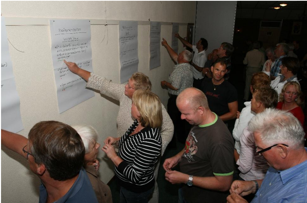
Impressie van de Bewonersavond

Op 12, 20, 24 november en 2 december 2008 zijn 4 keukentafelgesprekken gehouden in De Ruitenvelder in Froombosch. De opkomst daarbij was tevredenstellend: in totaal hebben 62 mensen deelgenomen aan de keukentafelgesprekken. Daarnaast zijn door diverse mensen allerlei ideeën en gedachten aangedragen, die zeker ook meegenomen zijn in de planontwikkeling.