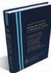
DERECHO PENAL Y PROCESAL PENAL