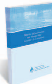
DERECHOS DE LAS PERSONAS CON DISCAPACIDAD