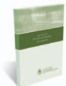
DERECHOS DEL PACIENTE