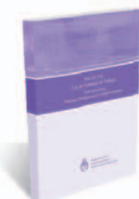
LEY DE CONTRATO DE TRABAJO