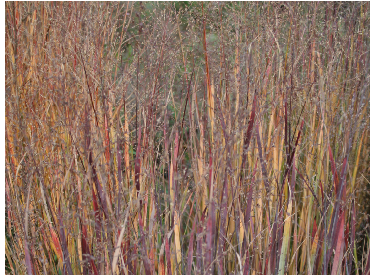
Panicum virgatum ‚Heavy Metal‘