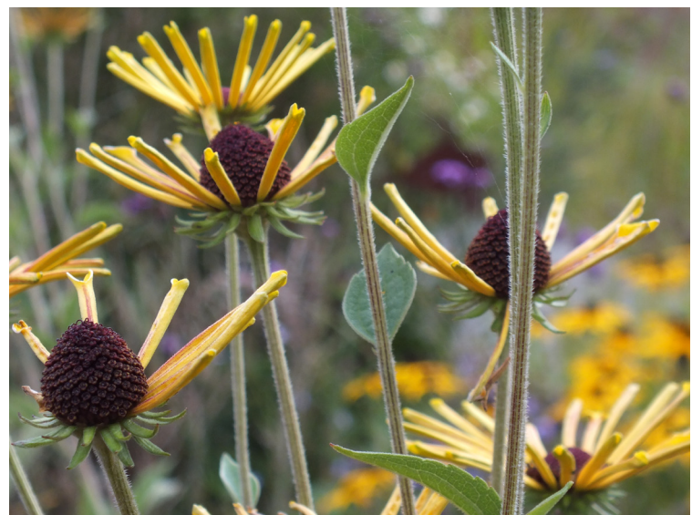
Rudbeckia subtomentosa ‚Henry Eilers‘