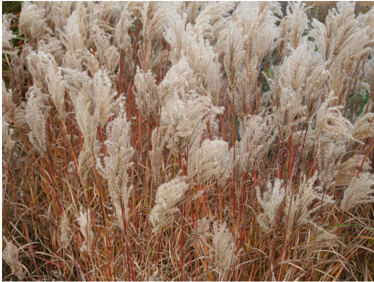
Miscanthus sinensis ‚Ferner Osten‘