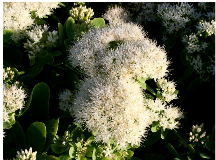
Sedum spectabile ‚Stardust‘