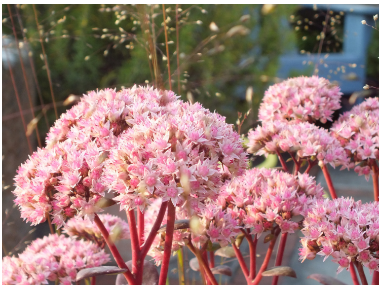
Sedum ‚Matrona‘, Sporobolus heterolepis ‚Cloud‘