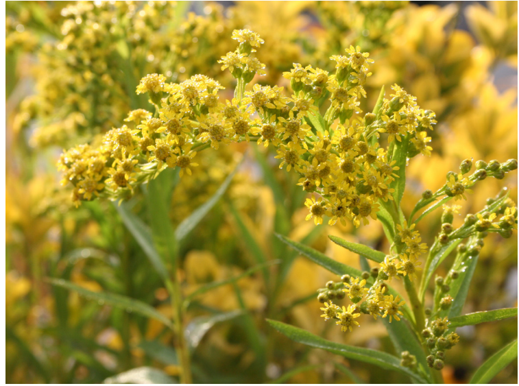
Solidago semp ‚Goldene Wellen‘