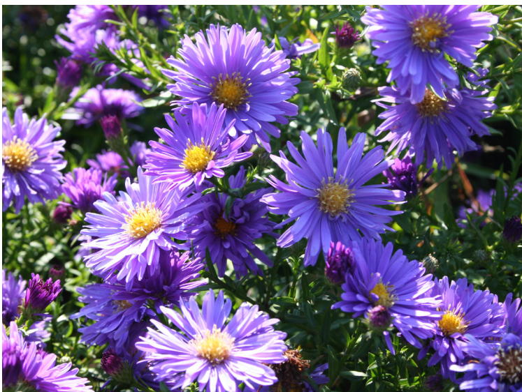
Aster dumosus ‚Blaue Lagune‘