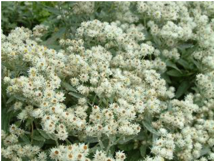
Aster pansos ‚Snowflurry‘