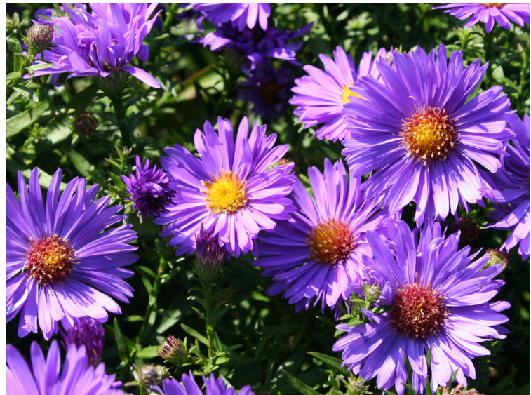
Aster dumosus ‚Augenweide‘