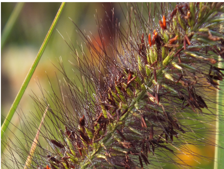
Pennisetum alopecuroides var. viridescens