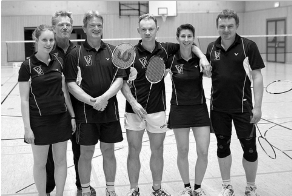
Die Seniorenmannschaft der Badmintonabteilung