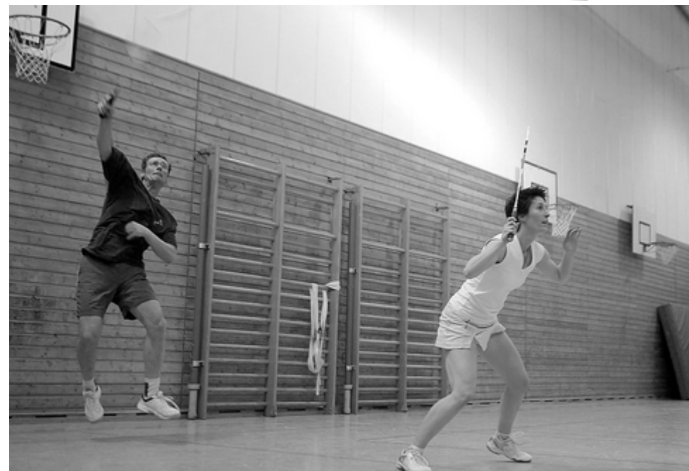
Training bei der Badmintonabteilung