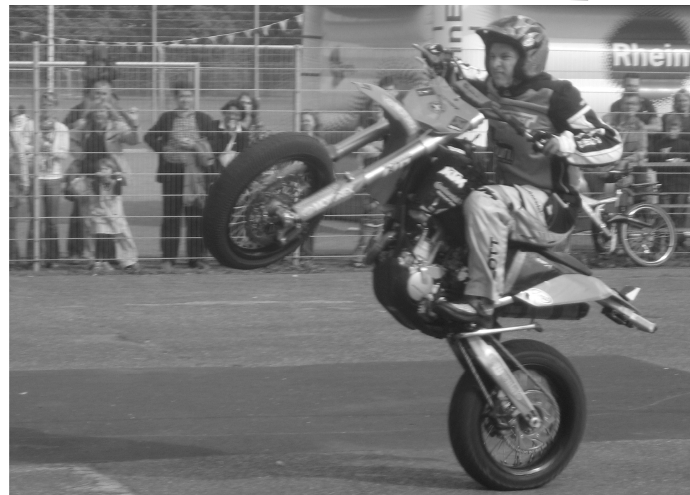
Eines der Highlights bei unserer 50 Jahrfeier